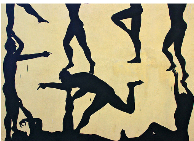
Labyrinth, Horsens (Dinamarca)