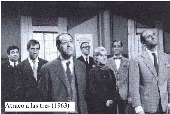
Atraco a las tres (1963)

Nombroses produccions d'aquesta dècada estaven destinades únicament a entretenir els espectadors, amb títols com La gran familia (1962) de Fernando Palacios, Las que tienen que servir (1967) i Pecados conyugales (1968) de José María Forqué, o altres títols protagonitzats amb xiquets prodigi tipus Marisol o nombrosos cantants i grups musicals com Raphael, Massiel, Los Bravos, Duo Dinámico o Joan Manuel.