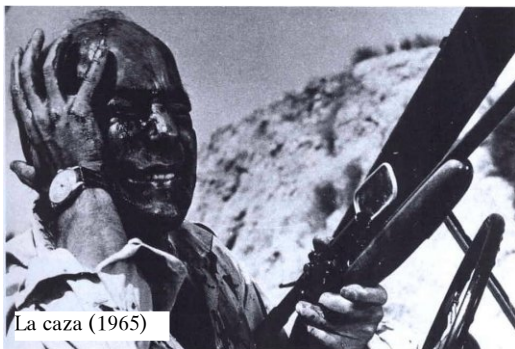
La caza (1965)

De tota aquesta nova fornada hem de destacar a Carlos Saura, qui fou l'excepció, el prestigi i la projecció internacional del cinema espanyol. La seua particular visió de la història i de la realitat espanyola la va reflectir en la seua obra cinematogràfica. Es tracta del primer realitzador jove que realitzà una superproducció internacional en Llanto por un bandido (1964). Posteriorment va rodar La caza (1965), premiada al festival de Berlí. Altres obres seues d'aquest període foren