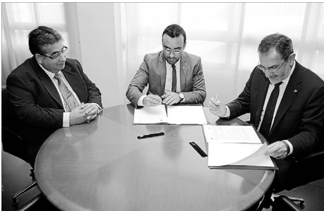
Fotografia d'arxiu de la firma del conveni per a la creació de la Càtedra al desembre del passat 2012.