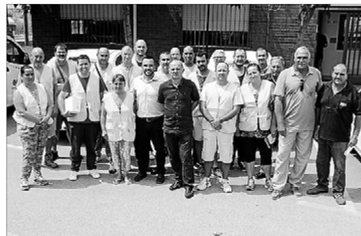
Los primeros trabajadores ya se han incorporado al programa.