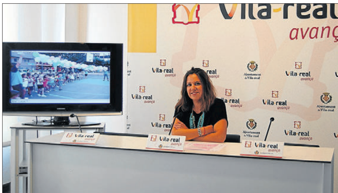
La regidora de Serveis Socials ha presentat la Memòria 2013 de l'àrea, que ofereix dades de les atencions.