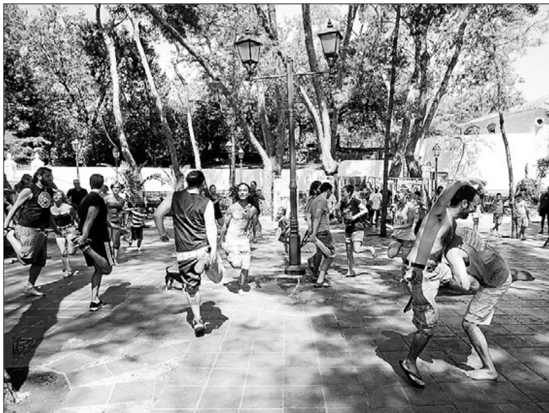
Nombroses activitats dins de Malabara't s'han realitzat durant tres dies al paratge del Termet.

Durant els tres dies en els quals Malabara't ha pres el paratge del