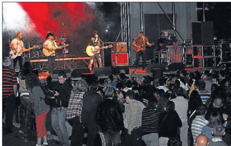
Los eventos musicales atraerán a un numeroso público a la ciudad.