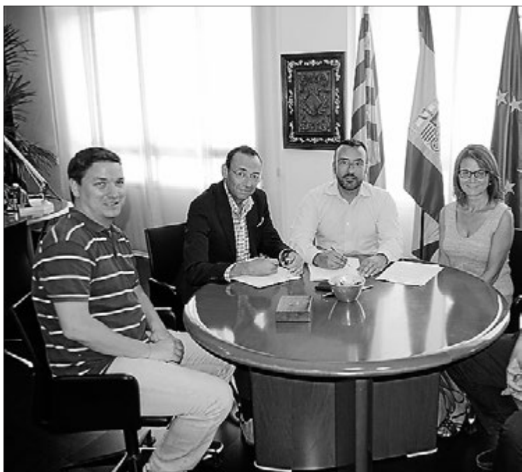
El alcalde y el edil de Innovación han firmado el acuerdo.