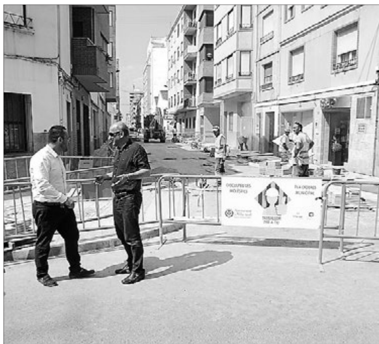
El alcalde y el edil de Servicios Públicos han visitado las obras.

Tanto el primer edil como el concejal de Servicios Públicos han querido destacar también la "sensibilidad" por la ejecución de este tipo de obras en verano, "cuando