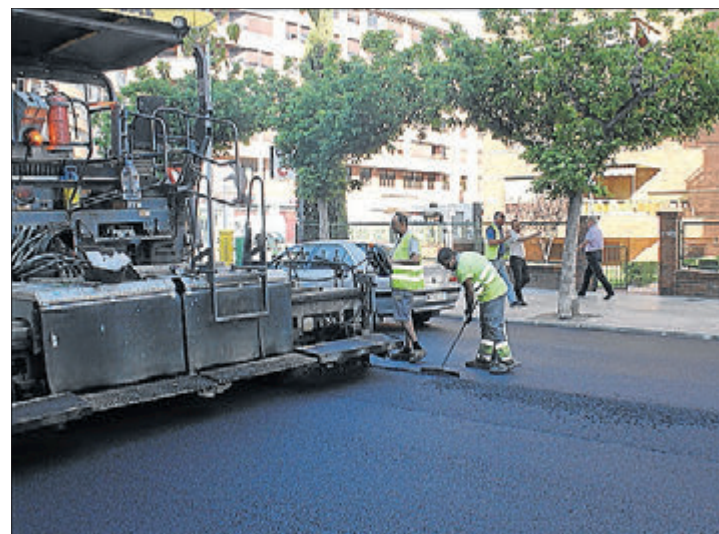
El departament ha asfaltat 12 carrers durant el mes d'agost.

"Tots els interessats a participar en algun dels tallers poden passar per la Casa dels Mundina de 9.00 a 13.00 hores a inscriure's", detalla. La regidora recorda, en aquest sentit, que només podran impartir-se aquells cursos que arriben almenys al 50% de la matrícula i que, en el cas que siga necessari, també es duplicaran els tallers més sol·licitats per a atendre la demanda. ≡