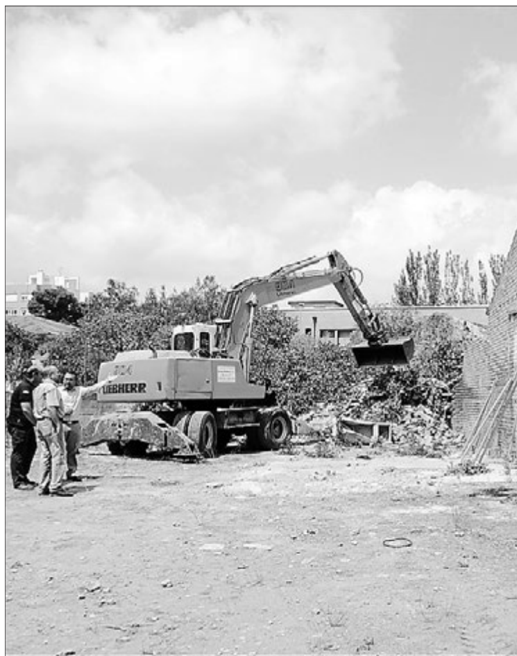
Imagen de la visita a las obras de demolición de las alquerías.

"Por tanto", añade Obiol, "con esta actuación responsable logramos un doble objetivo: limpiar y eliminar un foco de peligrosidad en el que no se había actuado en 20 años, al tiempo que trabajamos para salvaguardar el patrimonio y ganamos equipamiento para la ciudad, en particular para una zona como Botànic Calduch, donde estamos actuando para mejorar las dotaciones del barrio y solventar carencias históricas".