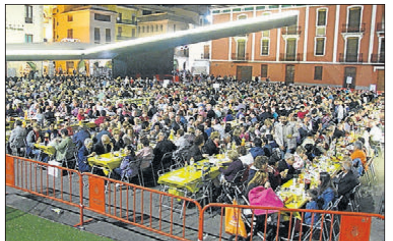
Uno de los eventos multitudinarios será la macrocena de vecinos.