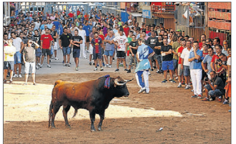
Los taurinos volverán a disfrutar con la programación específica.