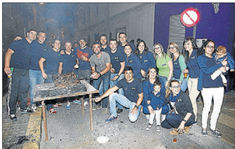
La 'xulla' volverá a sacar a la calle a vecinos y visitantes el lunes.