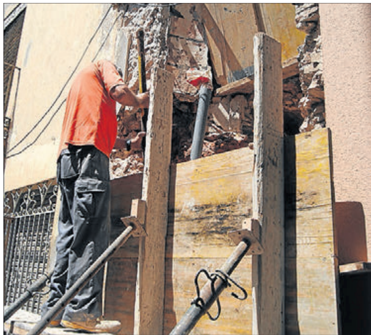
Los técnicos seguirán trabajando en la zona tras las fiestas.

En concreto, en la antigua calle de Baix se ha dejado al descubierto la muralla que estaba oculta en una pared y se está restituyendo la parte en peor estado, de manera que sobresalga unos centímetros, "marcando también así la diferencia de amplitud entre las murallas del siglo XIV y las del siglo XVI". Para esta reconstrucción se está utilizando la misma técnica que se usó en la construcción original del muro. "Estamos utilizando la técnica de la arquitectura de tapia, que es una forma de construcción muy antigua que se usa mucho en restauraciones y que consiste en la construcción del muro con tierra húmeda compactada a golpes con un pisón y con un encofrado de madera que se va desplazando a medida que se avanza en la construcción", ex-