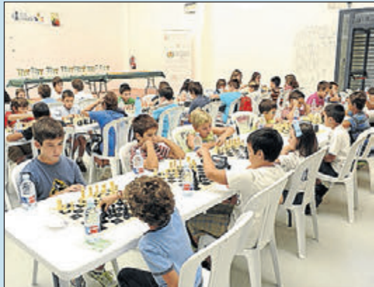
Oci, formació i educació per a la gent jove.