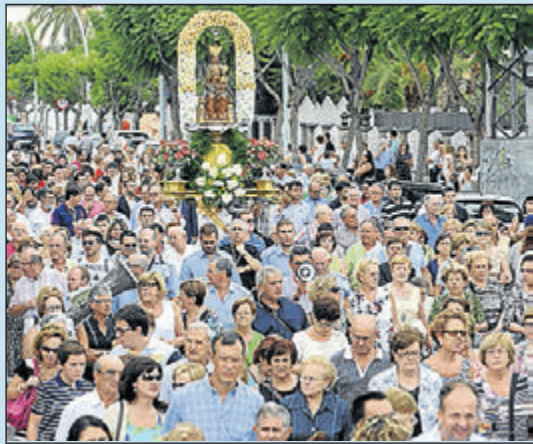
Riquesa cultural, fervor i tradicions pròpies.