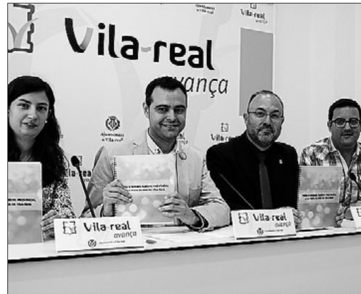
Imagen de la presentación de la solicitud, el pasado mes de junio.

El evento de Juventud Antoniana es el tercero de la ciudad en conseguir esta declaración