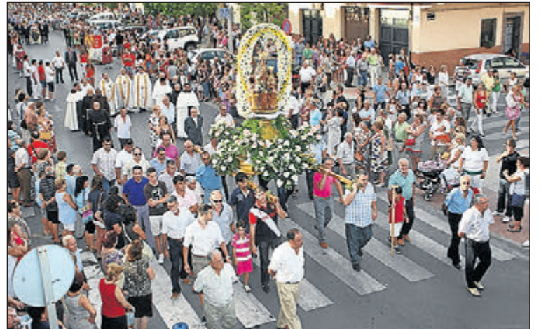
Los vecinos honrarán a la Mare de Déu de Gràcia durante 10 días.