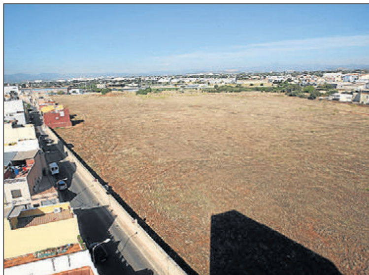
Els terrenys de la Bassa d'Insa acolliran aquesta zona esportiva.

històric de la Bassa d'Insa, ja que es convertirà en el jardí més gran de Vila-real i es millorarà a més el trànsit de la zona, gràcies al vial d'accés que inclou", argumenta Benlloch. L'alcalde recorda, a més, que la Ciutat Esportiva Municipal "permetrà configurar una gran illa dedicada a l'esport i la salut, amb els mòduls formatius en esports de l'IES Miralcamp, el pavelló Melilla a 400 metres, la Ciutat Esportiva del Villarreal i el CTE". "La Ciutat Esportiva Municipal és el projecte més important que coneixerà Vila-real en la primera meitat del segle XXI, amb infraestructura verda, esportiva i de salut", assenyala el regidor de Territori. Les obres tenen un termini d'execució de 18 mesos. ▬