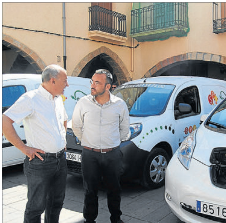
El edil de Servicios Públicos y el alcalde han visitado los coches.

A los beneficios ambientales se suman también los económicos, ya que los vehículos adjudicados tienen una autonomía de 150 kilómetros, con un coste de 1,5 euros por cada recarga. "Esto quiere decir que cada kilómetro tiene un coste aproximado de un céntimo, frente a los 10 céntimos de media que puede costar el kilómetro en los vehículos de gasolina. De esta manera, Servicios Públicos gastará con estos vehículos un 90% menos en consumo", detalla el responsable, quien avanza que se está trabajando ya para llegar a un coste 0, mediante el uso futuro de placas solares para las recargas. A las cinco unidades adjudicadas se suman también cinco