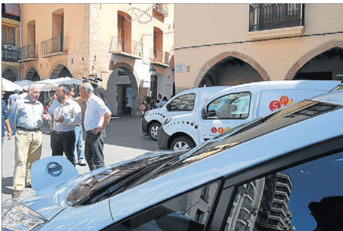
Los cinco vehículos son 100% eléctricos y evitan la emisión de cinco toneladas de dióxido de carbono al año.