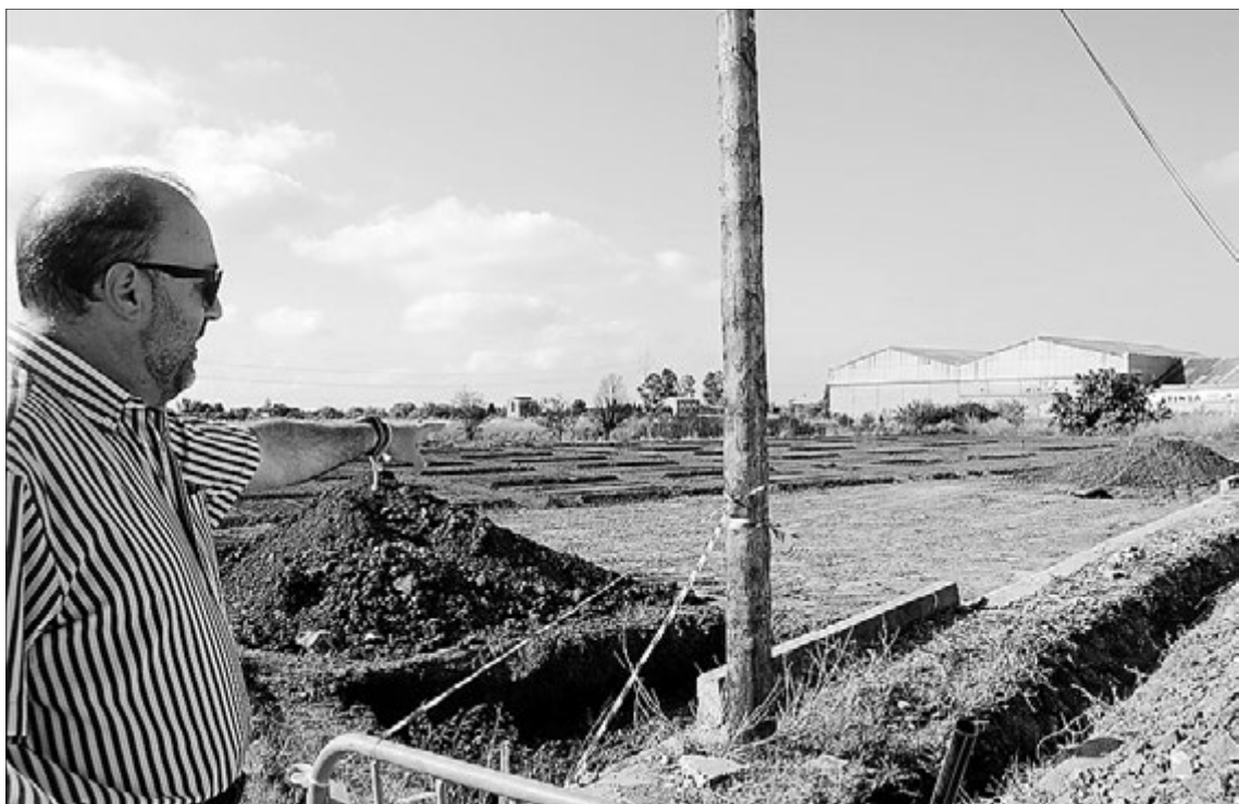
Los terrenos que acogerán en breve los huertos urbanos se ubican junto a las vías del tren, al este de la ciudad.