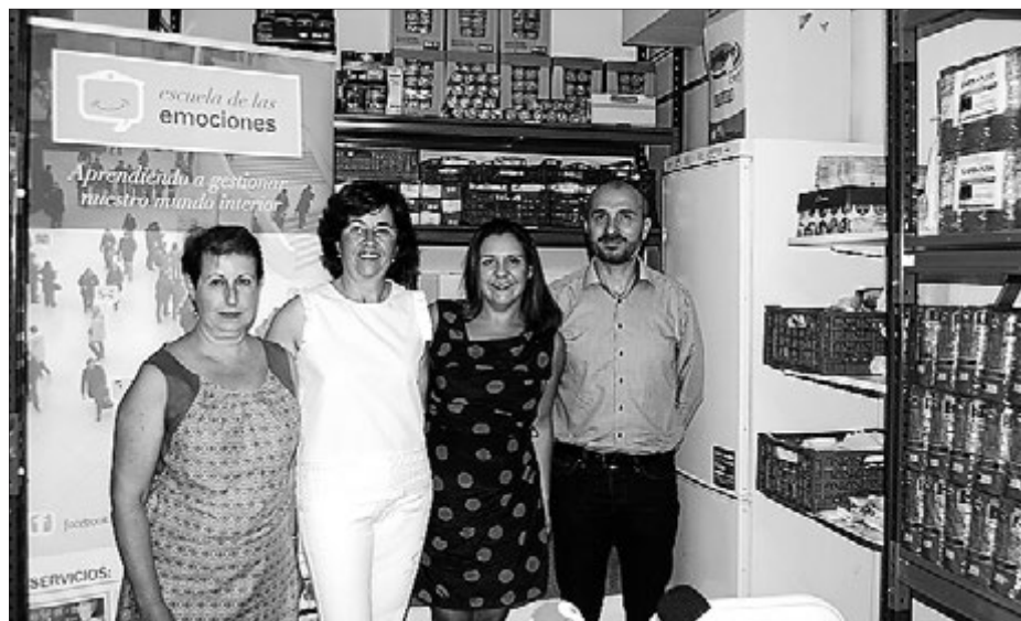
La regidora de Serveis Socials, ha visitat el magatzem on es guarda el menjar.