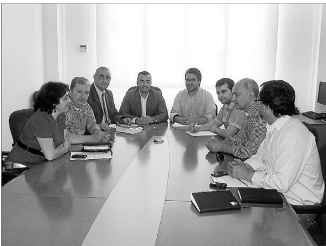
La comissió es va iniciar sense els membres del PP que no van voler participar, però després es van afegir.