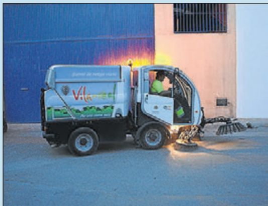
Serveis adaptats a les necessitats de cada zona.