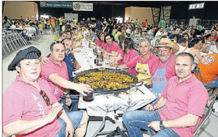
El concurso de paellas cambia esta edición a la avenida de la Murà.

Evento multitudinario al que se sumarán otros similares, como la macrocena de disfraces, o la cena de vecinos, entre otros. La subida al campanar y la 'xulla', el lunes, o los mercados de artesanía y las concentraciones de vehículos clásicos, serán algunos de los actos más destacados de un extenso programa festivo. MÁS INFO. PÁG. 22-23