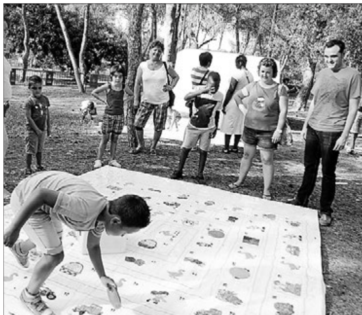
Els més joves han commemorat el dia de la Joventut al Termet.

El Dia de la Joventut, organitzat en col·laboració amb Soundglasses, Amaca i Otakuonda, ha comptat amb tallers d'elaboració de gelats, cocteleria sense alcohol i llepolies, a més de jocs de taula gegants, jocs amb corda o jocs de rol. Les exhibicions de circ d'AMACA i capoeira, a càrrec dels alumnes del grup Capoeira Brasil, van completar la programació de la vesprada, que va seguir amb un sopar de pa i porta i una festa amb DJ més tard. ≡