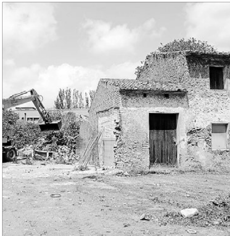
Las alquerías se habían convertido en un foco de inseguridad.