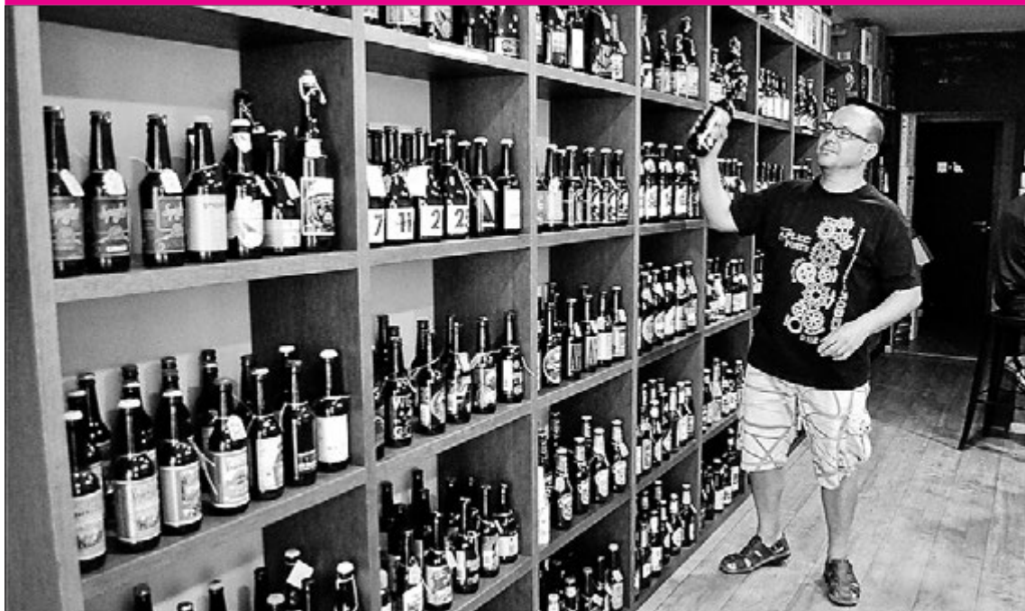
Beer Attack ofrece todo tipo de cervezas de importación y también autóctonas, elaboradas en nuestra tierra.