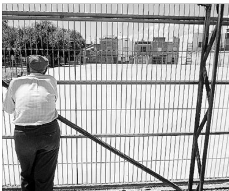
El nou projecte esportiu s'executarà en els propers mesos.

En els 4x200 metres lliures també van realitzar una bona carrera i van finalitzar 32es amb un cronòmetre de 9:34.31. La millor prova la van realitzar en els 4x100 estils, una carrera plena de compromís i cohesió en la qual van donar el màxim per a rebaixar la mínima que portaven i aconseguir, amb un registre de 4:57.15, la 37a posició a la competició. ≡