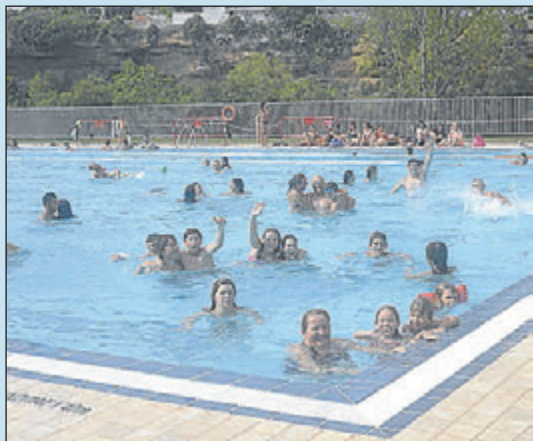
Infraestructures esportives a l'abast dels veïns.