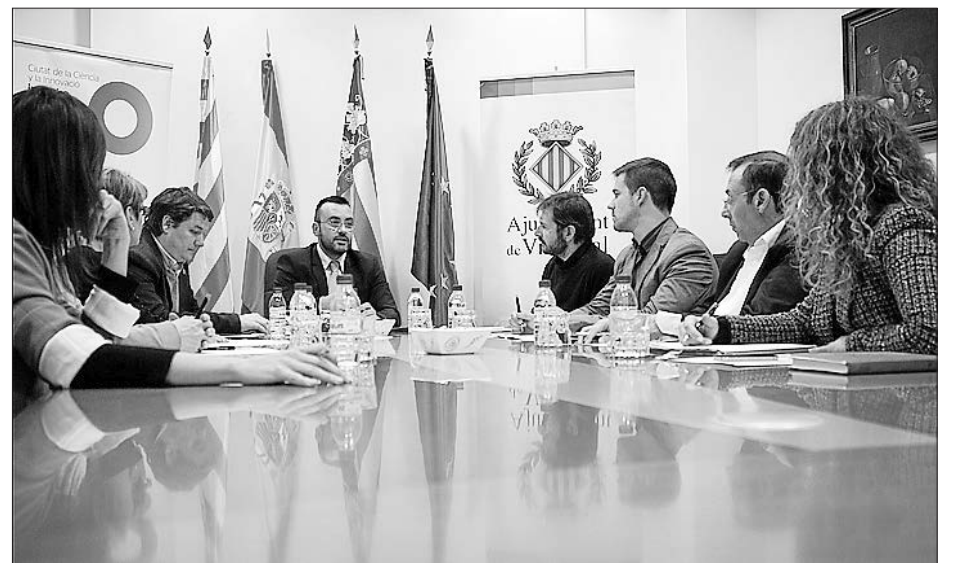
Imatge de la reunió mantinguda recentment per part dels organismes que se sumen.