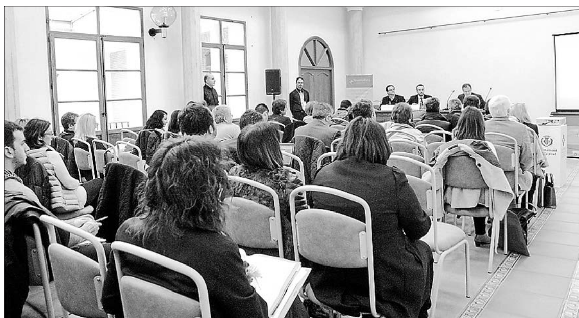
La Casa dels Mundina va ser l'escenari triat per tal d'acollir les I Jornades Nacionals de Transparència.

La consultora encarregada del Pla Municipal de Transparència s'ha mostrat molt satisfeta per l'èxit d'aquestes jornades, que han comptat amb ponents d'alt nivell i assistents de tot el país i que, en la seua primera edició han tingut un "grandíssim ressò mediàtic, especialment en les xarxes socials, on s'ha fet un gran seguiment i milers de retuits de les principals novetats i actualitzacions realitzades".