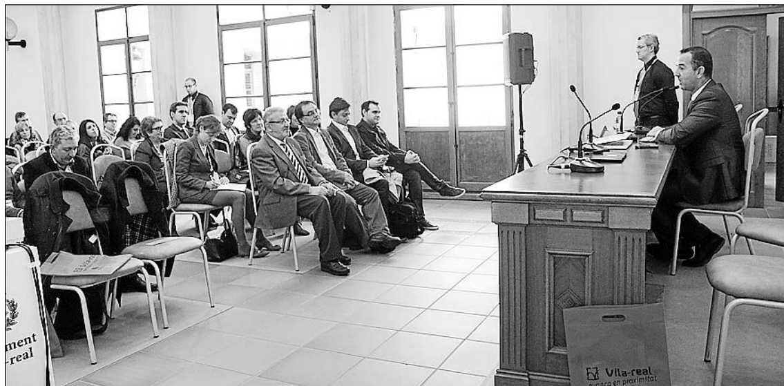
En les jornades es va analitzar la Llei de transparència, la situació actual i el cas de la nostra ciutat.