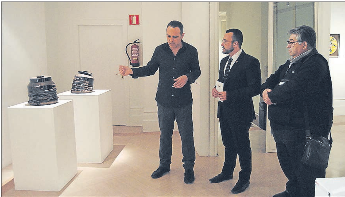
L'exposició '17 visions contemporànies' mostra una selecció de peces de ceràmica de cada comunitat.