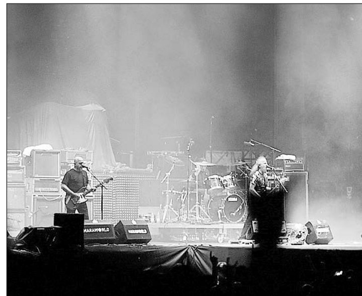
Los míticos Barón Rojo actuarán de nuevo en Vila-real en mayo.

Amaia Montero, Dorian, Barón Rojo y Los del Río, entre los más destacados de la programación