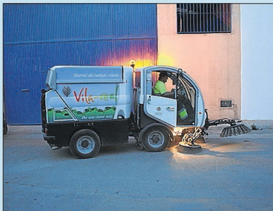
Serveis adaptats a les necessitats de cada zona.