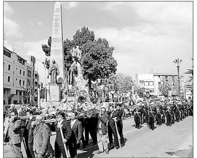
El pregón musical, todo un éxito junto a la basílica.