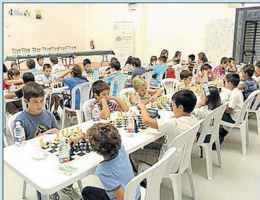
Oci, formació i educació per a la gent jove.