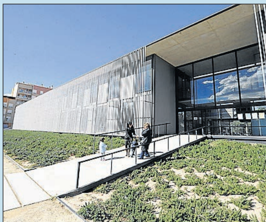
Instal·lacions punteres obertes a tothom.