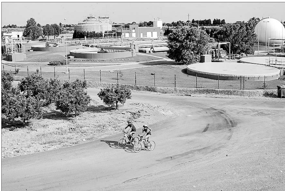
El Ayuntamiento y la EPSAR han trabajado de forma conjunta para dar una solución a la depuradora.