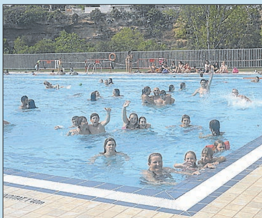
Infraestructures esportives a l'abast dels veïns.