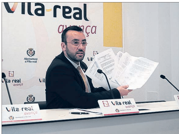
Benlloch va anunciar als mitjans que presentarà una querrela.

A aquest respecte, Benlloch avança que molt probablement optarà per la via civil i no per la penal, de manera que reclamarà "el màxim possible", perquè no vol "que aquest tipus d'accions li isquen gratis", en considerar que