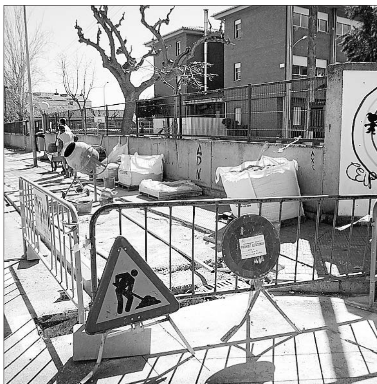
Les obres de millora de la seguretat s'han iniciat a Pasqual Nàcher.

"Quan vam assumir el govern vam trobar un desgavell en les factures, amb rebuts als calaixos que ens van suposar haver de pagar nou milions d'euros endarrerits. Per això vam decidir implantar mecanismes de control, com l'entrada de totes les factures a través de l'oficina d'Atenció i Tràmits, on s'escanegen i entren en un circuit reglat, s'evita que es produïsquen situacions com pèrdua dels documents i s'agilita el procés", explica. "Ara anem un pas més enllà", afegeix, i recorda que "enfrent dels dos anys que han tardat a cobrar les empreses en la passada legislatura, hem reduït els temps fins als 17 dies". El personal municipal resoldrà els dubtes dels proveïdors. ■