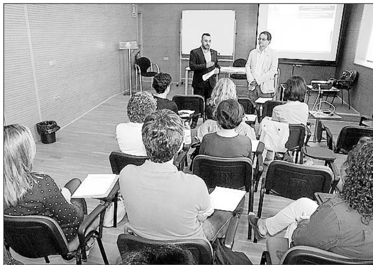
L'Ajuntament ha oferit un pla formatiu als treballadors municipals.