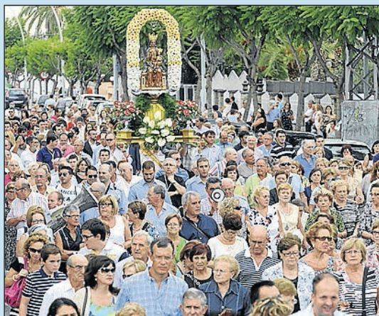
Riquesa cultural, fervor i tradicions pròpies.