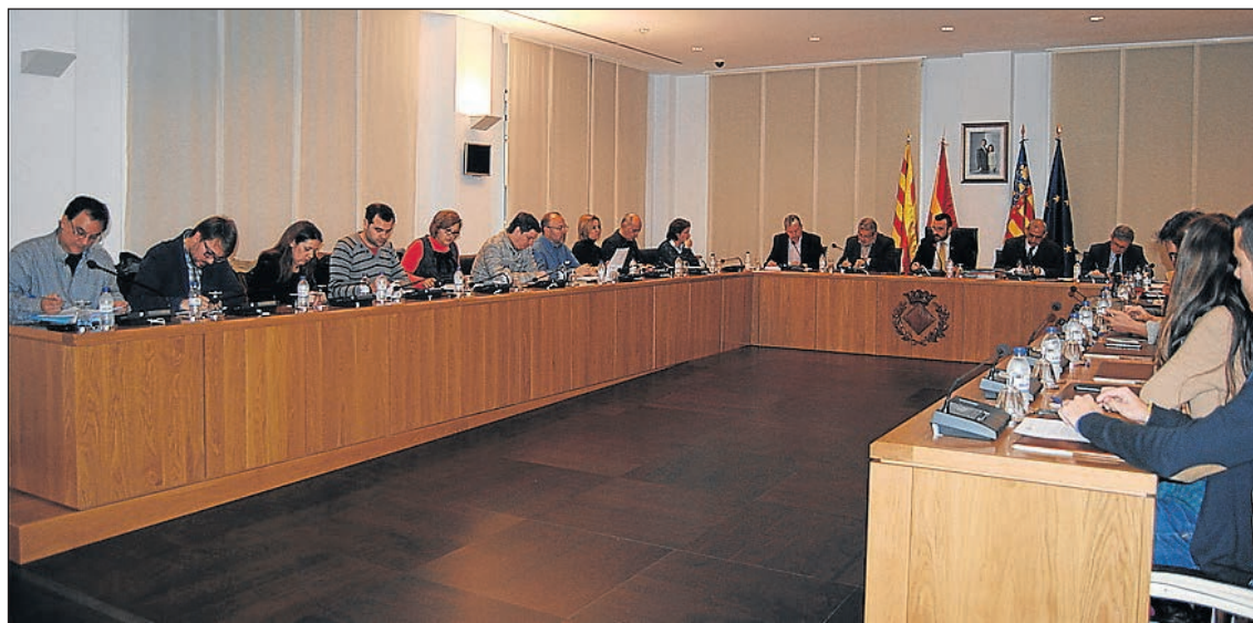
El Pleno ha dado cuenta de la liquidación del presupuesto del 2014, que ha cerrado con remanentes.

“Tras casi cuatro años en el gobierno municipal, podemos decir que hemos cumplido nuestros objetivos: hemos acabado con el despilfarro y las irregularidades, anulando 600.000 euros en facturas falsas de una empresa investigada por presunta financiación irregular del PP; hemos reducido la deuda y bajado en un 20% los impuestos y hemos puesto en marcha infraestructuras y mejorado el entorno de todos los barrios”, señala Benlloch, quien recuerda que otro de los “ob-