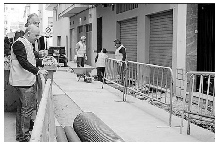
El edil de Serveis Públics visitó los trabajos de remodelación.

lorar detenidamente la propuesta presentada por parte de los vecinos y comerciantes del centro de posponer los trabajos al verano. Atendiendo a estas peticiones y “tras haber escuchado a todas las partes afectadas”, pero también dando respuesta a la necesidad de una actuación urgente en el edificio que garantice sus condiciones de salubridad y seguridad, el equipo de gobierno ha decidido iniciar los trabajos preparatorios y de obra menor en el interior de los viejos juzgados en la fecha inicialmente prevista, en marzo. Estos trabajos preparatorios permitirán avanzar en todo aquello que sea posible, con la idea de que el grueso de la obra y el derribo del edificio se ejecute durante los meses de verano y que la adecuación del espacio, con la construcción de una nueva plaza, sea una realidad en las próximas fiestas de septiembre. ≡