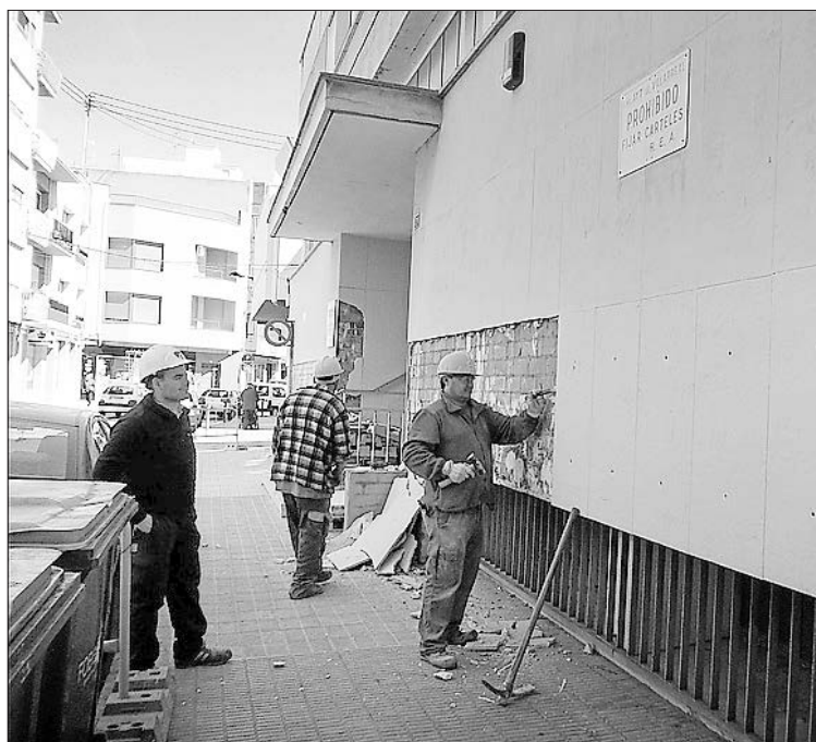
Los trabajos previos del proyecto comenzaron durante el mes de marzo.

Tras estos encuentros y la reunión celebrada con los vecinos, la junta de coordinación del equipo de gobierno se ha reunido para va-