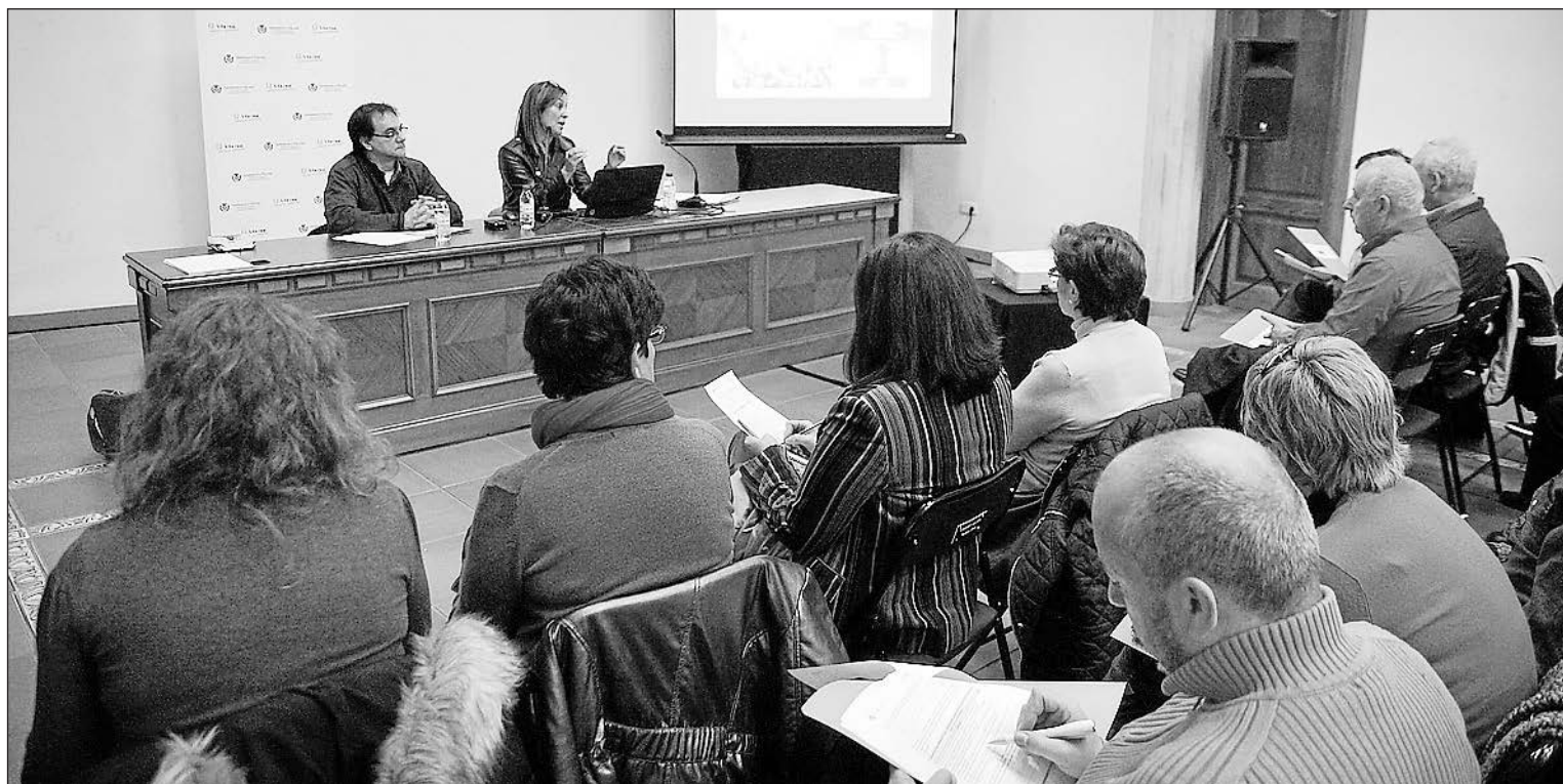
Una de les accions del Pla Municipal de Transparència va ser la convocatòria d'un fòrum a la Casa dels Mundina obert a la ciutadania.

També es va realitzar una jornada informativa i de debat amb els responsables polítics, a més d'un fòrum presencial per a veïns i un altre en línia, en què els participants, a