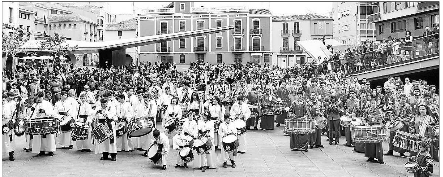
La tamborrada del Domingo de Ramos congregó a numerosas cofradías locales, que hicieron retumbar la zona con sus bombos y tambores.