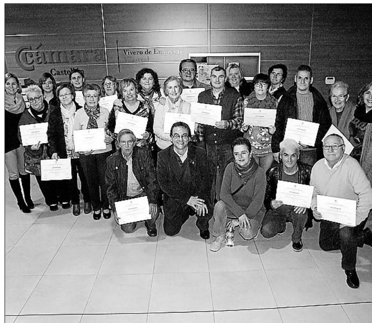
Los 17 participantes en el plan recibieron un certificado.

cognitiva dirigida a la prevención y rehabilitación de personas con lesiones cerebrales, enfermedades neurodegenerativas que cursan con demencia, para la población infantil con problemas de aprendizaje o de desarrollo y para personas interesadas en la prevención y el mantenimiento funcional. Se trata de la primera edición de esta iniciativa pionera en la ciudad que, a tenor de los resultados, podría repetirse, ya que los participantes se han mostrado muy satisfechos con la formación recibida, al tiempo que destacan su utilidad a la hora de hacer frente a estos casos. ■