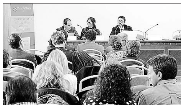
L'alcalde, el rector de l'UJI, el regidor de Solidaritat i prop d'una vintena de ponents van assistir-hi.