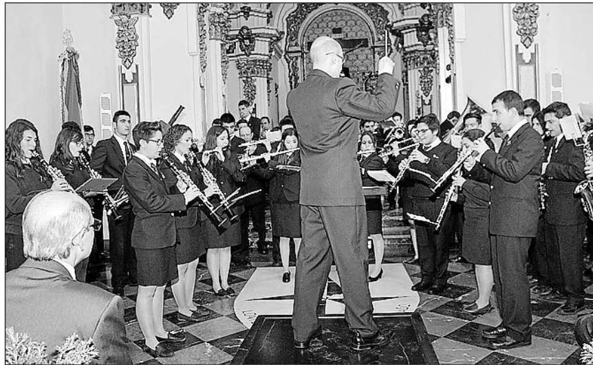
La capilla del Cristo del Hospital acogió el pregón con una nueva pieza.

El Viernes Santo se celebrará el Vía Crucis (8.00h.) y la procesión del Santo Entierro (20.30h.) y el sábado, a las 11.00 horas, el Vía Matris y, a las 22.00 horas la Vigilia Pascual. El Domingo de Pascua tendrán lugar la procesión del Encuentro y la misa, cerrando la Semana Santa. ■