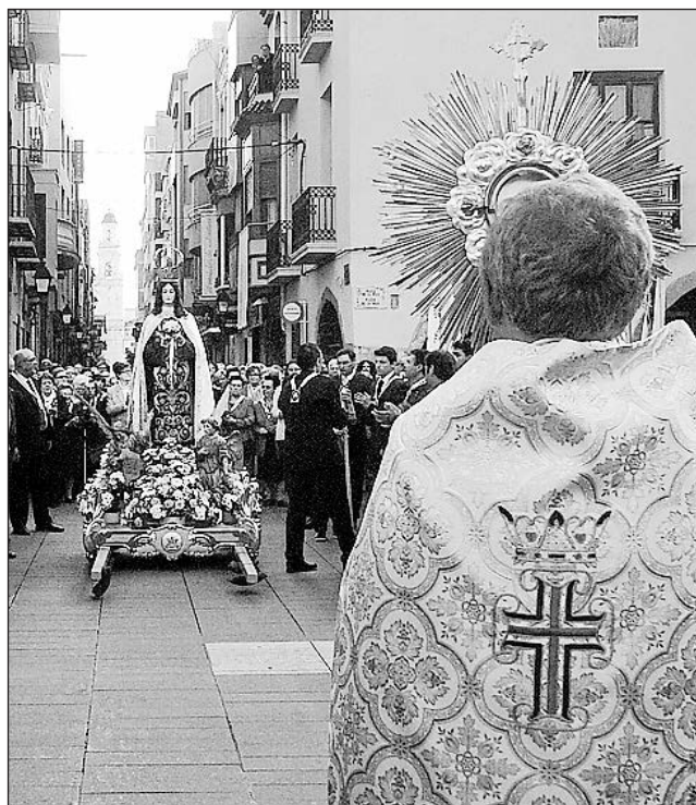
La ciudad será escenario de procesiones y de 'Laquima Vere'.