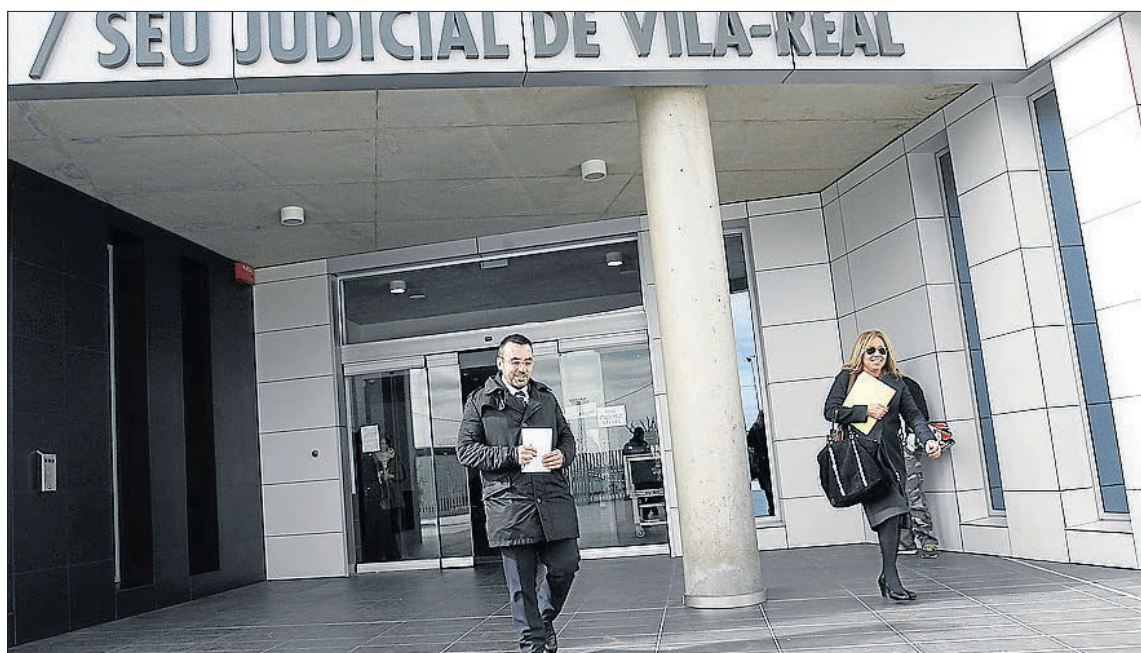
L'alcalde, a l'eixida de la seu judicial de Vila-real, on va acudir a un acte de conciliació amb Folgado.