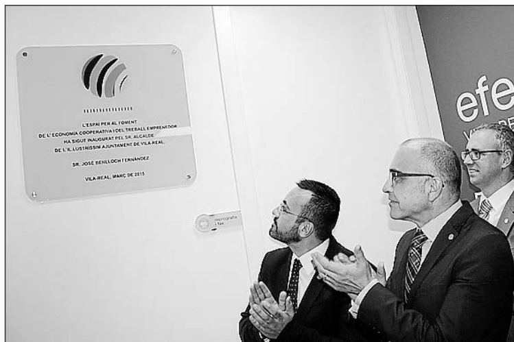
Imagen del descubrimiento de la placa durante la inauguración.

la Innovación. Fruto de esta cooperación con la sociedad se encuentra también el Instituto de la Innovación, en el que el Ayuntamiento trabaja, a través de las concejalías de Innovación y la de Economía.