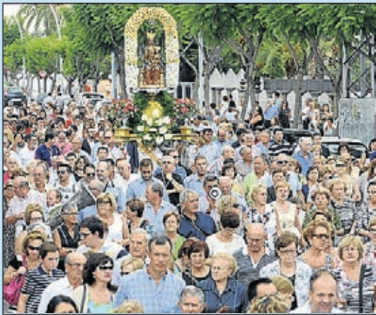
Riquesa cultural, fervor i tradicions pròpies.