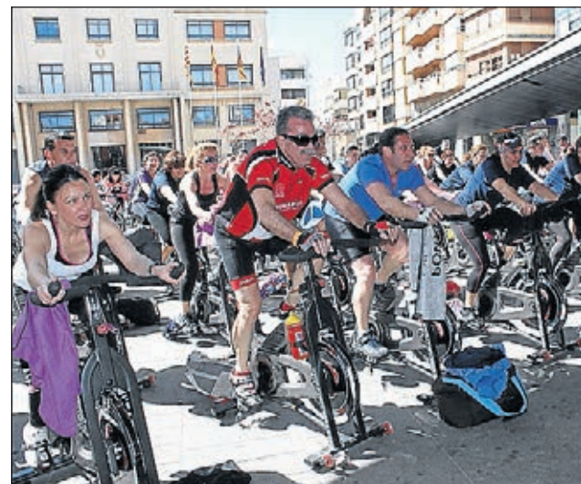
Ciutat de l'Esport i la Salut.