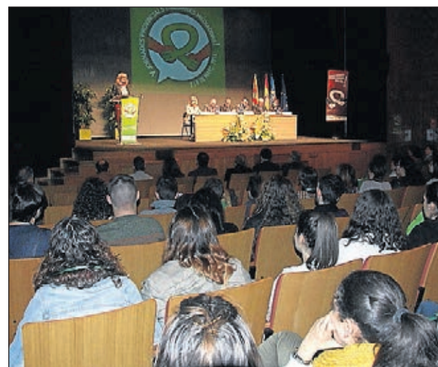
Ciutat de Congressos, Fires i Esdeveniments.