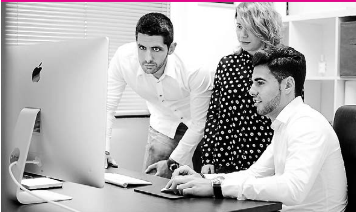
Desmarca está formada por un joven grupo de expertos en materia de gestión de empresas y márketing.