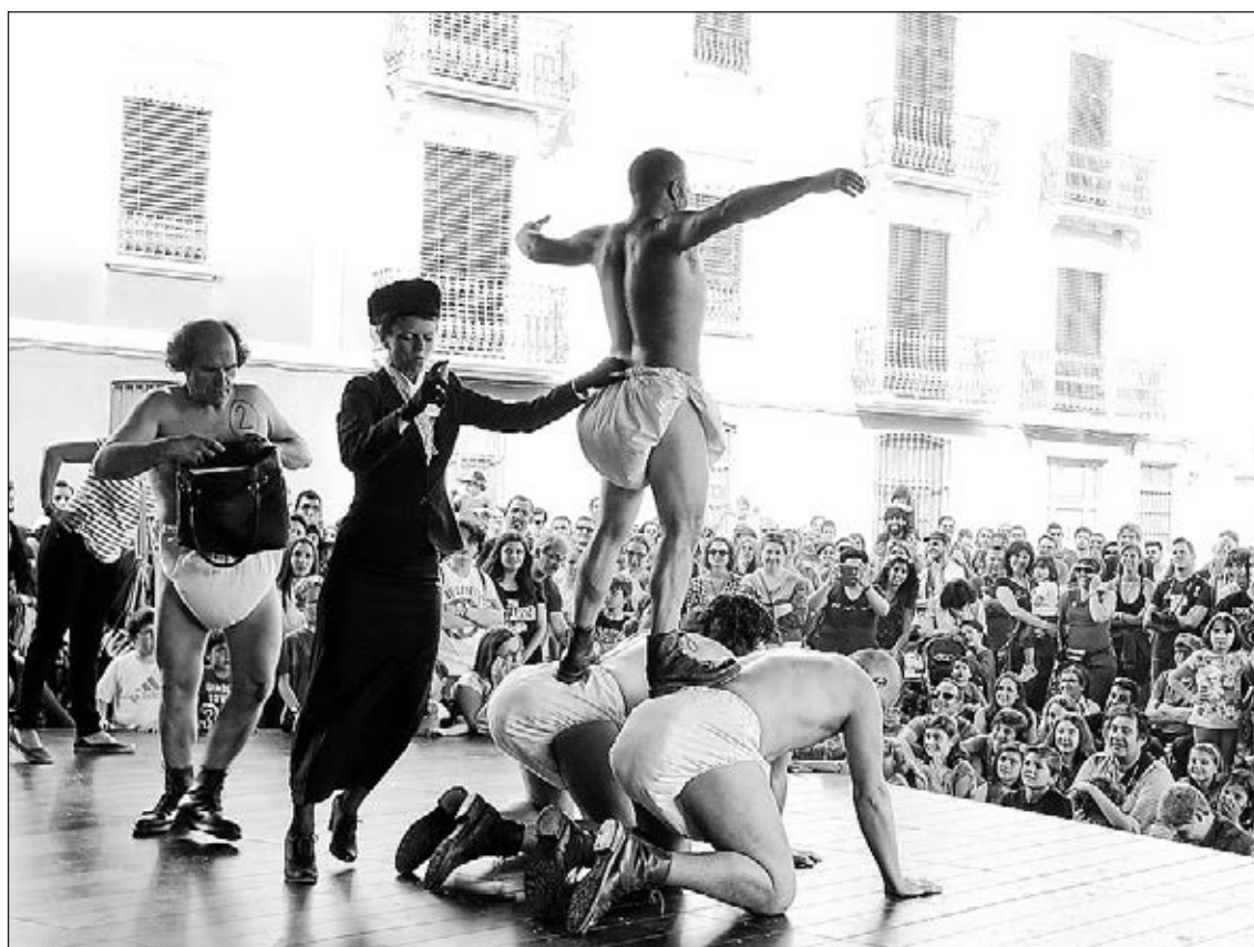
Gràcies al FitCarrer, milers de persones han gaudit de quatre dies de teatre als carrers de la ciutat.

Ayet afirma que el FitCarrer "ha aconseguit ser més que un festival, ja que la seua proposta no es limita a la simple exhibició d'espectacles, sinó que representa un espai