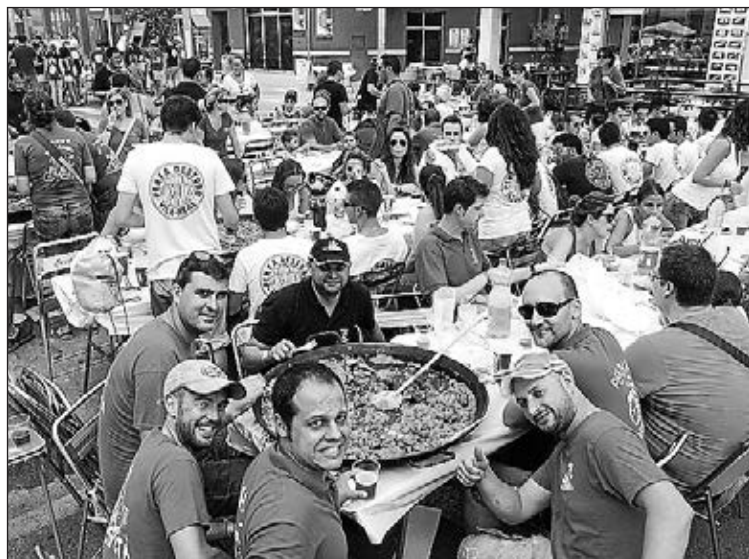
Las peñas disfrutarán el primer sábado del concurso de paellas.