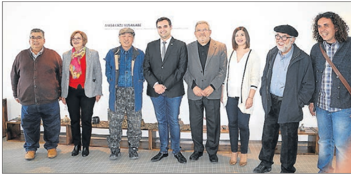
Imatge de la inauguració de la Fira d'Art i Cultura Ceràmica, a la Biblioteca del Coneixement.

A més de l'exposició de Masakazu Kusakabe, que s'ha instal·lat a la Biblioteca Universitària del Coneixement (BUC), la FACC també ha inclòs la mostra del mestre ceramista Xohan Viqueira (Casa de l'Oli) i la col·lectiva FANGtàstic, amb més