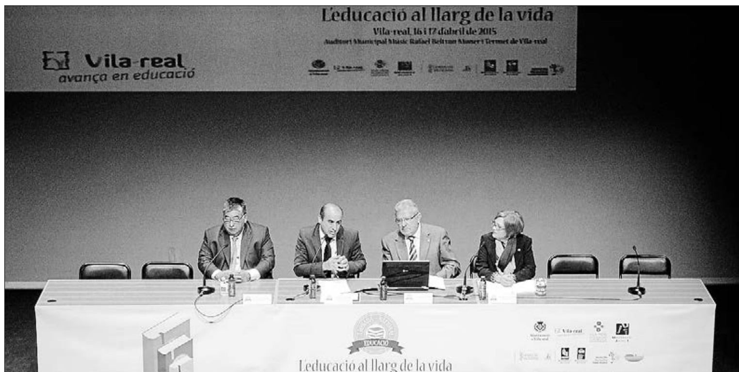
L'Auditori ha acollit la Trobada Nacional d'Educació, que ha tingut lloc durant dos dies a la nostra ciutat al llarg del mes d'abril.

Sota aquestes premisses, la Trobada Nacional d'Educació, que ha comptat amb la col·laboració de la