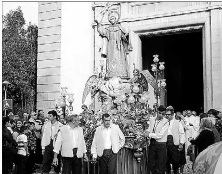
El cierre de los festejos coincidirá con el día de Sant Pasqual.

Asimismo, los aficionados taurinos disfrutarán una docena de astados durante los festejos. ≡