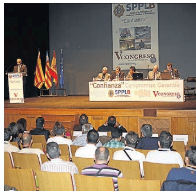
Ciutat Educadora i Universitària.

Perquè el nostre projecte no és sols el projecte del Partit Popular, és el projecte que millor representa els interessos de Vila-real, perquè està fet per la gent del nostre poble, per veïns i veïnes que han volgut aportar a la vida pública municipal la seua experiència en diferents àmbits de la nostra societat. Tots junts fem + Vila-real!