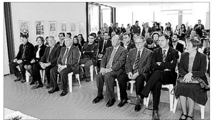
Imatge de la inauguració de la seu de la Plana de l'UJI.