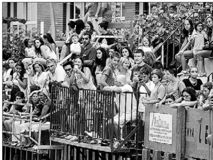
Los eventos taurinos volverán a contribuir ambiente festivo.