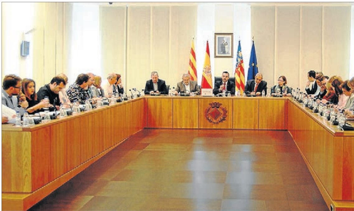
El ple ha votat a inicis del mes de maig la incorporació dels tres empresaris com a Fills Predilectes de la ciutat.

El ple va aprovar atorgar la distinció als tres empresaris vila-realencs