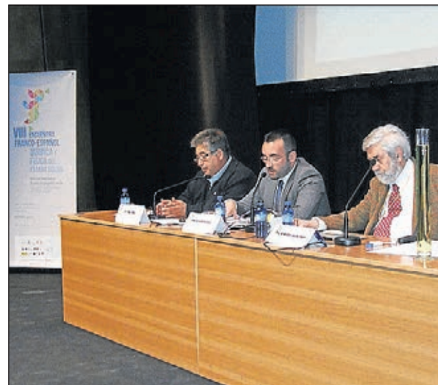
Ciutat de la Ciència i la Innovació.