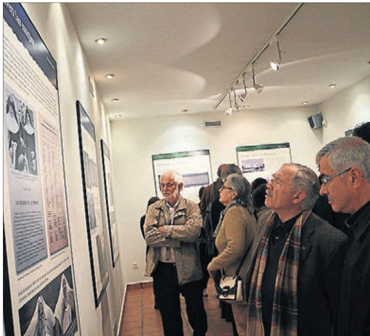
La exposición fotográfica sobre el tema atrajo a numerosos curiosos.

El sábado 18 tuvo lugar uno de los actos centrales del Memorial con la ruta teatralizada por diferentes espacios de la ciudad e inspira-