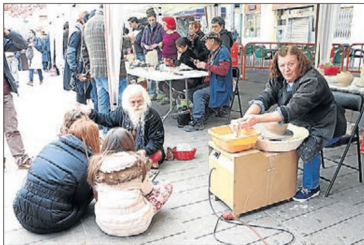
Un dels tallers de ceràmica que es van celebrar a la ciutat.

de 30 autors de l'Associació Nacional de Professionals de la Ceràmica (ANPEC), que s'ha pogut visitar a l'Espai Jove. L'apartat expositiu de la FACC es va completar amb la inauguració, el dia 17 a El Convent, de l'exposició 'Espanya ceràmica: 17 visions contemporànies', que en el seu pas inicial pel Museu Nacional de Ceràmica de València ha rebut més de 15.000 visites.