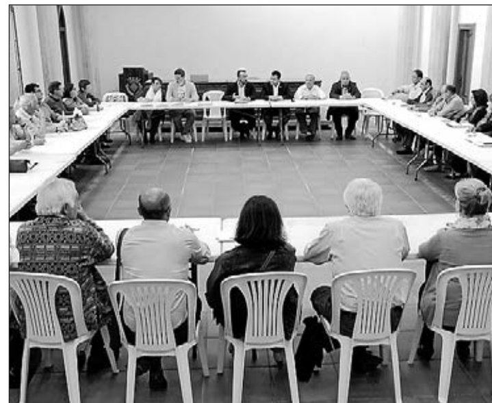
El Consell de Participació ha aumentado hasta las 47 entidades.

El nuevo organismo, constituido recientemente, incorpora la iniciativa del escaño ciudadano