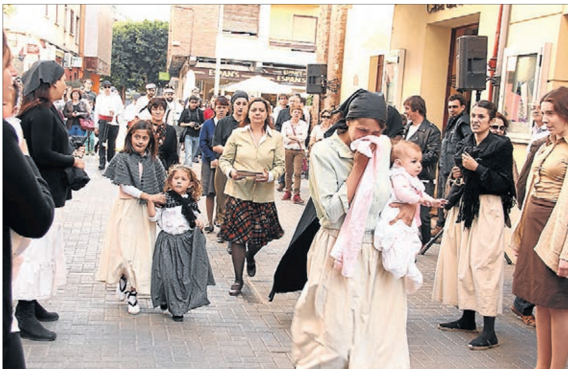
Una ruta teatralizada recorrió las calles de la ciudad rememorando la represión ejercida contra las mujeres.