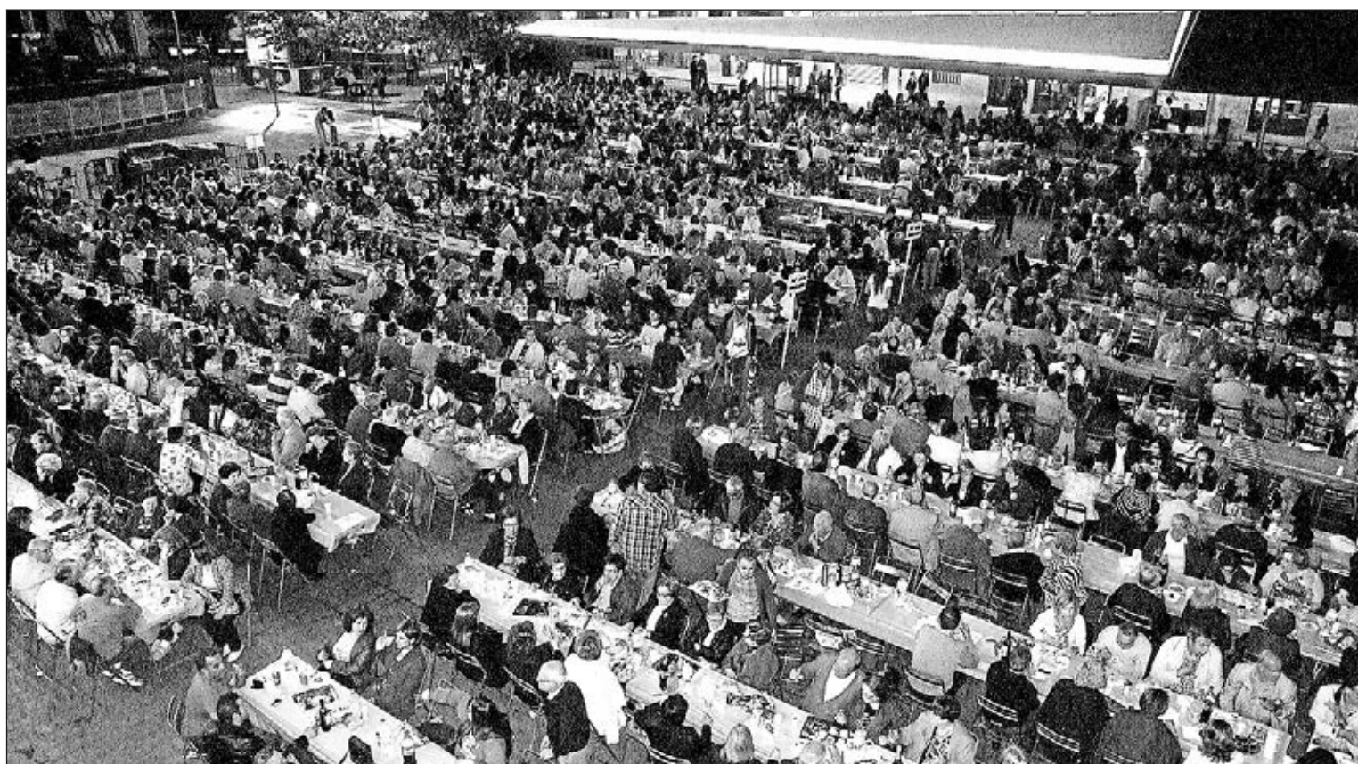
La Concejalía de Participación Ciudadana y Barrios espera que el 'macrosoapar de veïns' congrege este año a más de 2.000 personas.