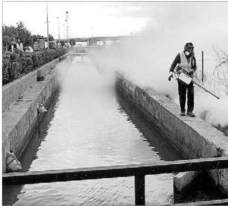
Los técnicos de SPV han realizado ya varios tratamientos.