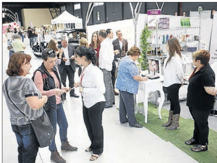
El Centre de Congressos, Fires i Trobades completa la xarxa.

també el concepte del local, que d'un restaurant amb cafeteria i saló de banquets passa a incorporar-se a la xarxa de congressos de la ciutat. "D'un projecte obsolet i que suposava entrar en competència amb negocis locals que ho estan passant malament, reconvertim El Molí en un nou espai d'oportunitats", afegeix l'alcalde. La plica inclou una sèrie de condicions que suposen la reserva preferent d'ús dels salons superior i inferior del local, a més de l'envelat per part del consistori. La cafeteria serà d'ús privatiu del concessionari, que també es farà càrrec del servei de terrassa de la piscina del Termet, amb ús com a local chill-out, per una quantitat mínima de 24.120 euros més IVA a l'any. ≡