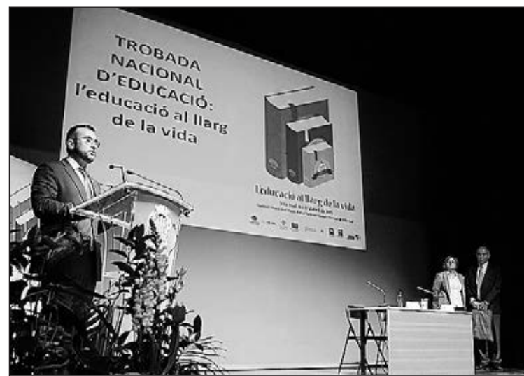
L'alcalde, durant la clausura de la Trobada Nacional d'Educació.