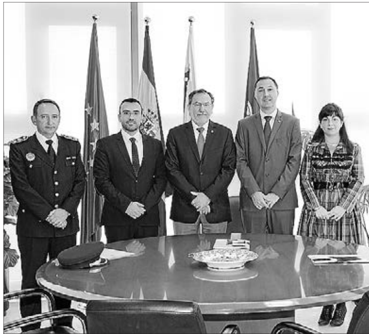
Imatge de la signatura del conveni per a crear la Càtedra de Mediació.

Per a satisfer aquests objectius la Càtedra es proposa accions de formació com la realització d'un curs d'estiu, taules redones així com d'altres jornades centrades en la mediació policial, i l'elaboració d'activitats divulgatives i informatives dirigides als centres d'ensenyament de la ciutat de Vila-real, així com la investigació i divul-