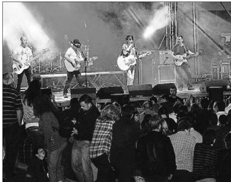
Los conciertos volverán a congregar a miles de espectadores.