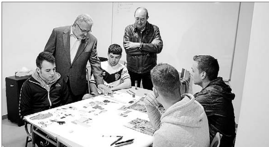
La Fundació Tots Units ha posat en marxa, dins del conveni anual amb l'Ajuntament, un taller formatiu.

"Són unes ajudes per a fomentar l'ocupació local i afavorir els col·lectius amb majors dificultats, per això es té en compte en el barem qüestions com que els beneficiaris siguin majors de 40 anys", detalla Batalla, per a qui el pla "està dissenyat també per a ajudar els xicotets negocis i comerços de la ciutat". Les empreses poden acollir-se a aquestes ajudes en tres períodes, en aquells contractes iniciats entre l'1 de març i el 31 de maig, entre l'1 de juny i el 30 de setembre i entre l'1 d'octubre i l'1 de desembre.