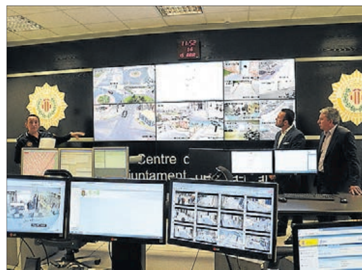
El alcalde y el edil de Seguridad han visitado la sede policial.

"En total, 8.344.432 euros que se embolsó esta empresa, involucrada en la trama Gürtel de supuesta financiación ilegal del PP, mientras las empresas de Vila-real pasaban dificultades", incide Serralvo. "Todo esto se hacía con el beneplácito del PP y de Héctor Folgado, que también contrataba para sus áreas con esta empresa", agrega. Serralvo ha querido también destacar que estos datos revelan "dos modelos muy distintos: el del PP y el del equipo de gobierno, que trabajamos con empresas locales para favorecer el empleo".