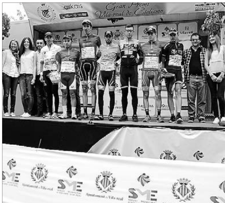
El 69é Gran Premi Vila-real ha format part de la Setmana de l'Esport.