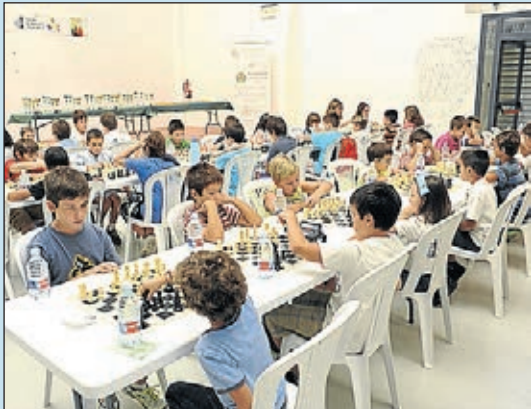
Oci, formació i educació per a la gent jove.