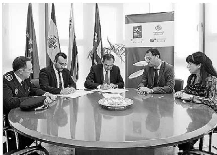
La marca de Ciutat Educadora compta amb la Càtedra de Mediació.

Les jornades van comptar amb l'Escola de Dansa, una visita al Termet i el reconeixement als professors jubilats