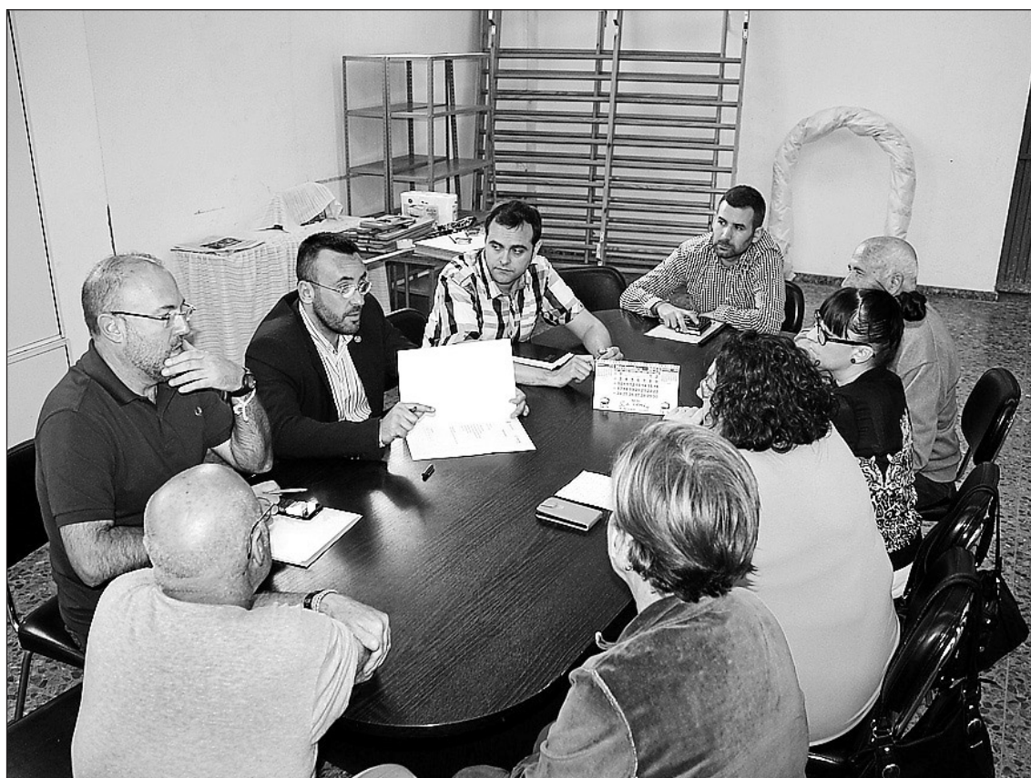
Els representants municipals s'han reunit amb els veïns per tal d'arribar a una solució que els beneficie.

El projecte, tal com explica el regidor de Territori, suposarà l'enderrocament de la zona afectada per aluminosi i la resta de la nau, la demolició de la qual aconsellen