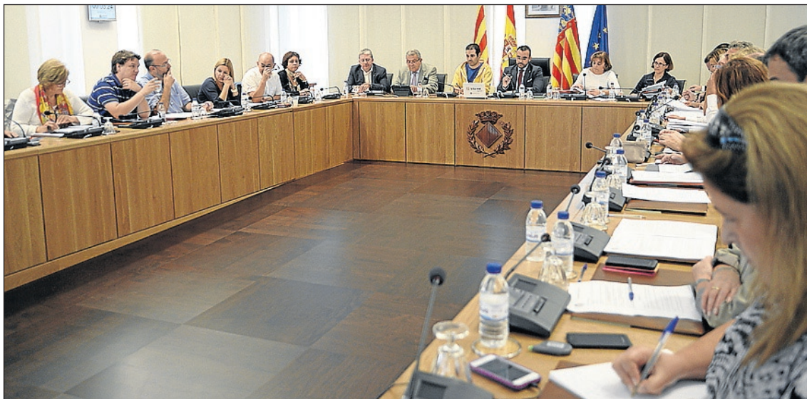
Imatge del Ple on es va aprovar el conveni de col·laboració entre la Conselleria i el consistori de la ciutat.

L'alcalde reitera que la prioritat de l'Ajuntament de Vila-real és poder obrir la piscina, que serà necessari buidar i posar a punt, amb l'objectiu de donar servei als clubs locals i incorporar nous socis del SME en el pla de reducció de llistes d'espera impulsat per la Regidoria d'Esports amb iniciatives com el conveni amb els gimnasos de la ciutat. Les converses amb l'UJI perquè pugui utilitzar les aules del centre de tecnificació és una altra de les pos-