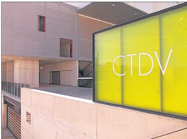
La infraestructura està finalitzada però no s'ha pogut utilitzar.

sibilitats que la pròxima signatura del conveni d'encomanda de gestió obri per a la ciutat.