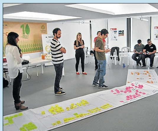
Formació i innovació per aprofitar el talent.