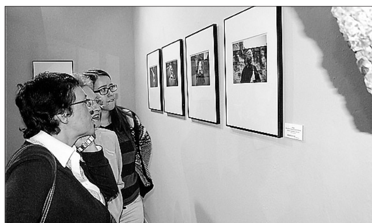
Las exposiciones son uno de los puntos fuertes de la programación.

La agenda cultural de llena de muestras, además de conciertos y representaciones de teatro y danza