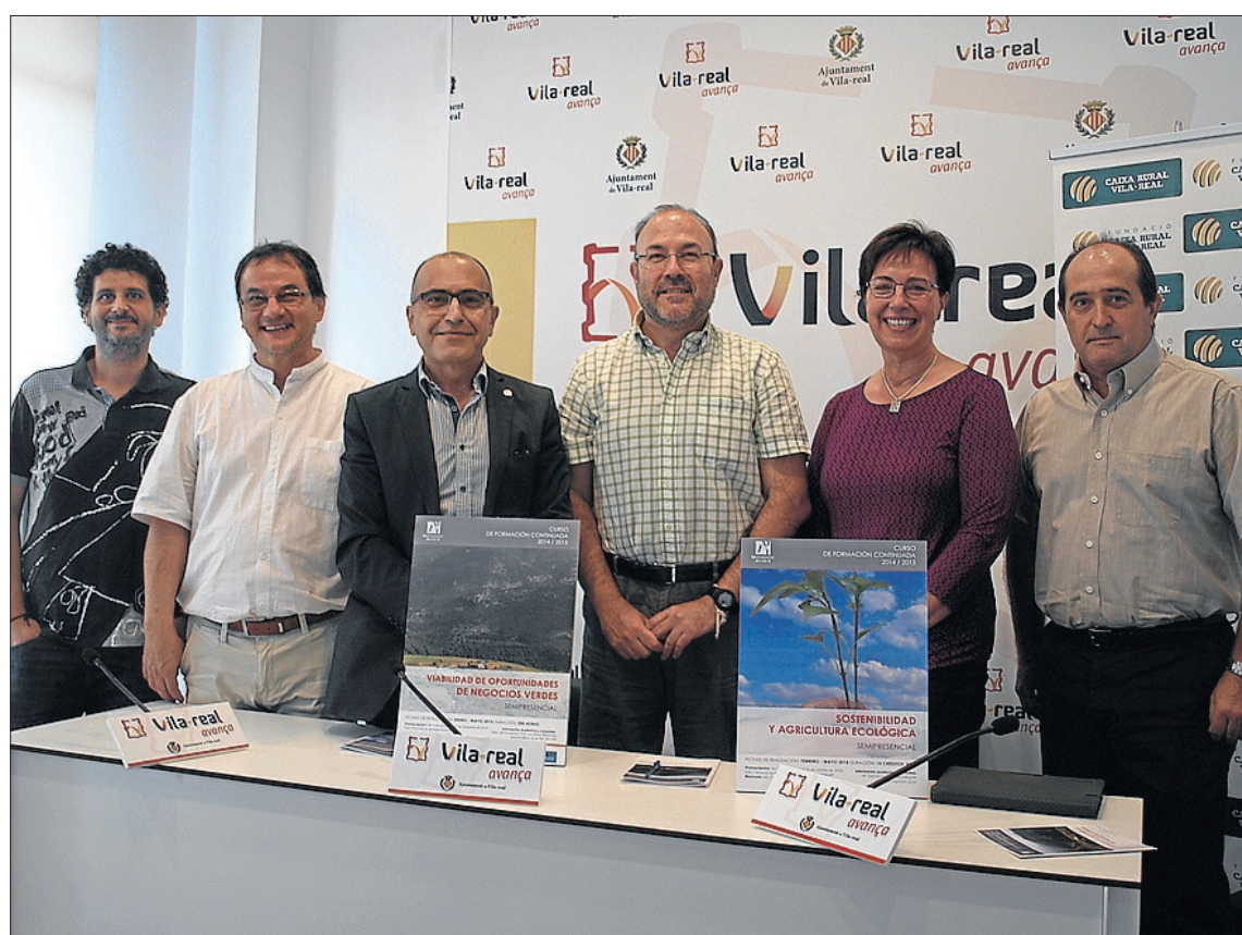
Imagen de la presentación de los nuevos cursos que ofrecerá la UJI sobre agricultura en la biblioteca.