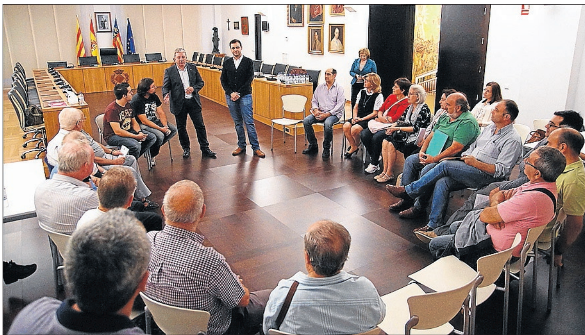
Los ediles de Hacienda y Participación Ciudadana acompañaron a los vecinos durante la primera sesión.