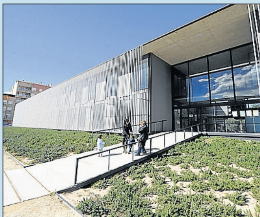
Instal·lacions punteres obertes a tothom.