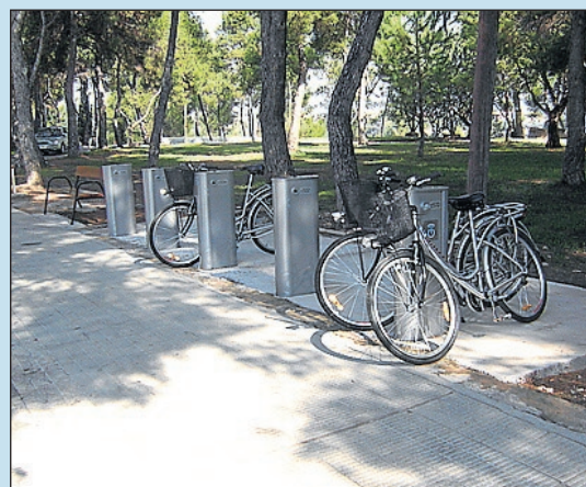
Una ciutat preocupada pel mediambient.