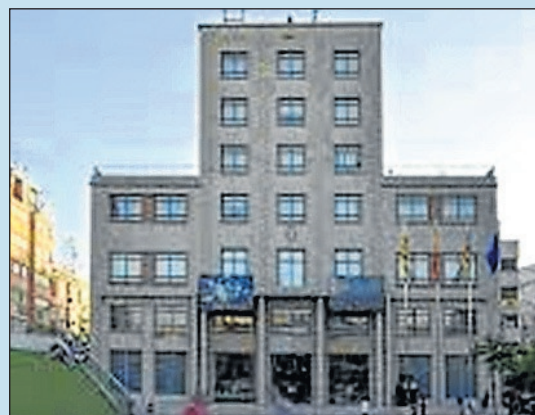
Un ajuntament amb les portes obertes.