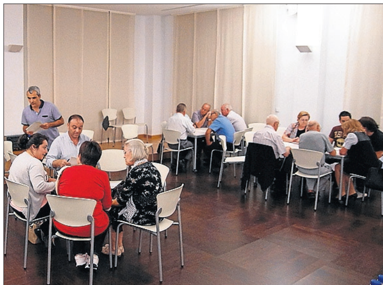
Los vecinos podrán votar las propuestas a través de varios medios.

“Con esta apertura a toda la población, damos un paso más en nuestro compromiso de implicar a la ciudadanía y hacer de la gestión una cosa de todos”, destaca Ochando. En esta línea, el concejal recuerda que, en los últimos años, “se han abierto más cauces para la participación que en toda la historia municipal reciente, con iniciativas