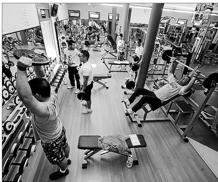
Els usuaris en llista d'espera podran accedir al gimnàs a preu públic.

De moment, des de la Regidoria, ja s'informa a les persones en llista d'espera de les noves places disponibles, condicions i horaris de les activitats que s'ofereixen en cada gimnàs. "Encara que els horaris poden ser més limitats, perquè només podran anar a les hores de menor afluència de públic, els usuaris tindran un gran ventall de