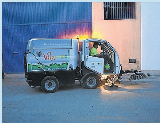
Serveis adaptats a les necessitats de cada zona.