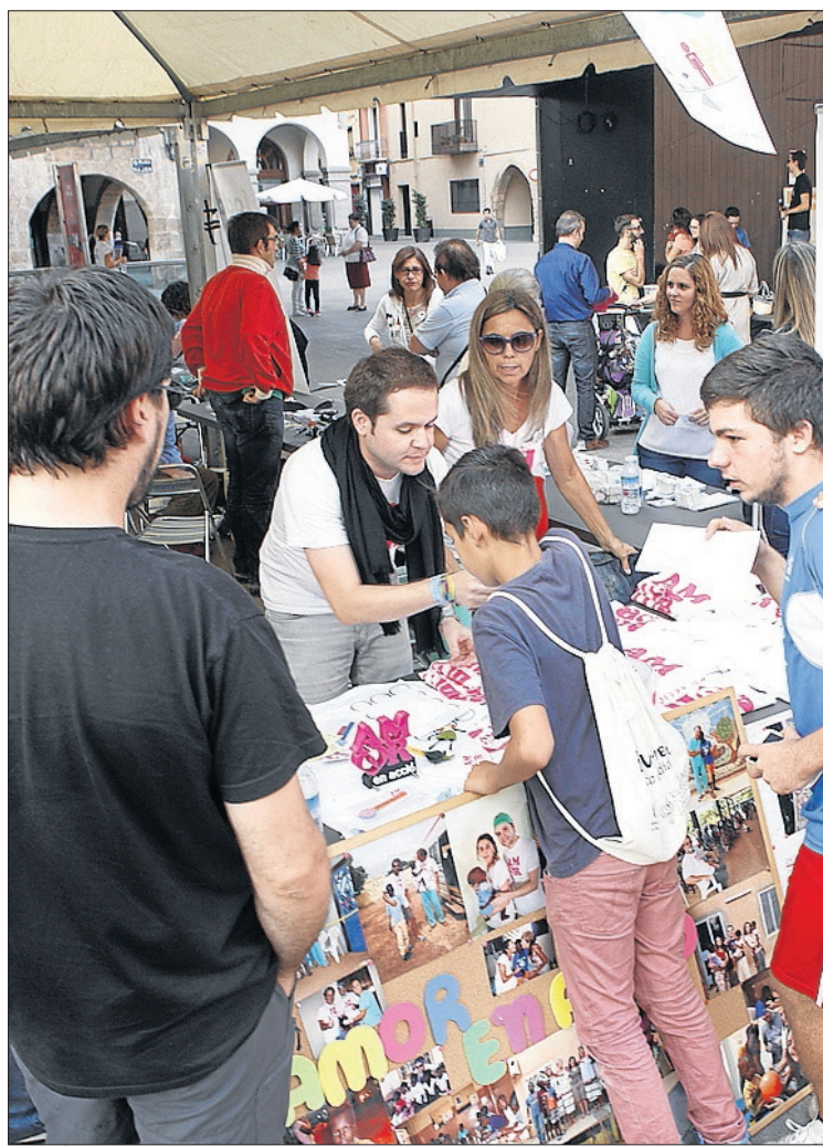
La plaza Mayor acogió diversas actividades durante toda la jornada.

Pero desde primera hora de la mañana el centro de la ciudad se llenó de vida y, más que nunca, de movimiento, ya que fueron muchos los vecinos y visitantes que se unieron al Flashmob solidario, una de las novedades de este año.