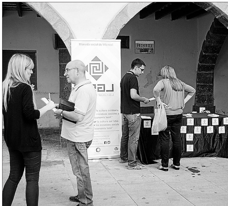
La plaza Major ha acogido también un stand informativo.

rativa y promover las iniciativas sociales. De este modo, se han realizado dos jornadas informativas para estudiantes, así como para voluntarios, asociaciones y colectivos sin ánimo de lucro. También se ha desarrollado una jornada para emprendedores, 'startups', comercios, pymes y artesanos, se ha instalado una carpa informativa en la plaza Major y Globalis ha participado en un encuentro sobre moneda social Valencia, entre otras actividades. ■