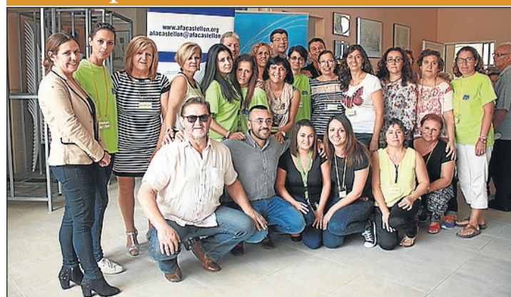
El centre d'Alzheimer Molí la Vila d'AFA Castelló ha celebrat les seues olimpiades amb usuaris, familiars i voluntaris de l'entitat. L'alcalde de Vila-real i diversos regidors han acompanyat els usuaris i els membres de la Junta Local.