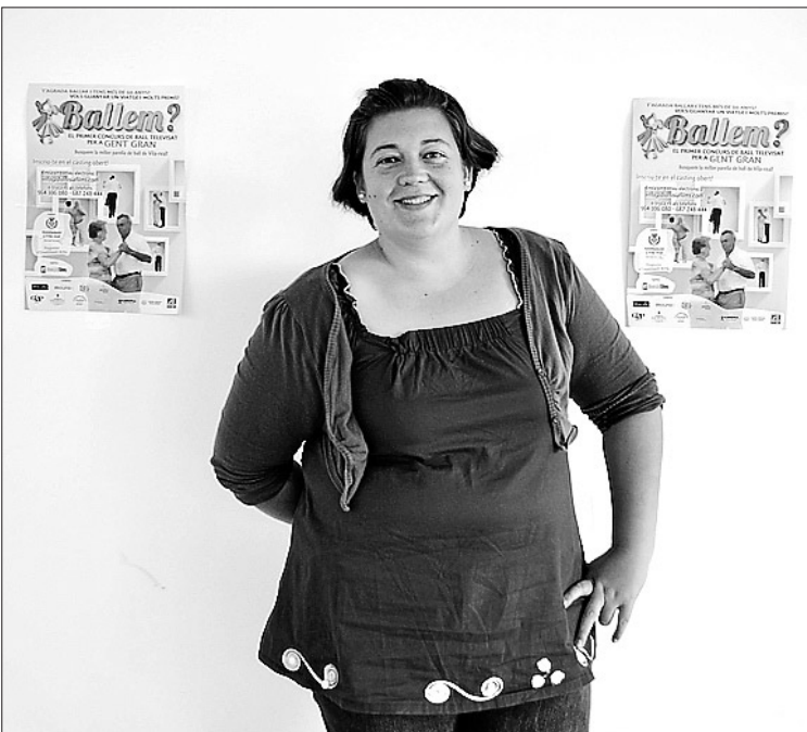
Actualmente su proyecto está en marcha dentro de Vilabeca Emprén.

"Yo me enteré de la Vilabeca gracias a Twitter, son casualidades de la vida, pero las oportunidades no hay que dejarlas pasar".