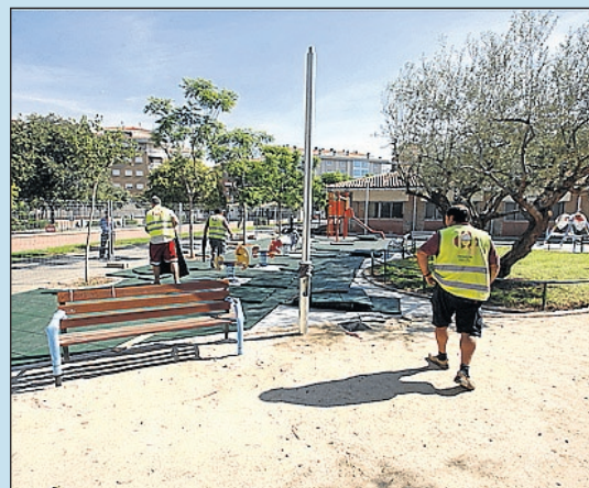
Manteniment i condicionament constant.