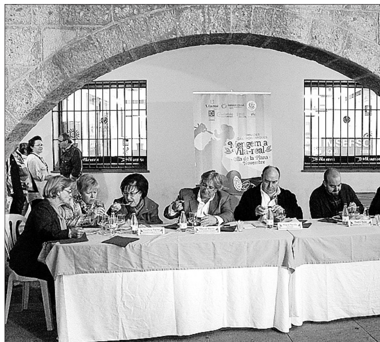
El dia 12 tindrà lloc el concurs i degustació popular d'olla.