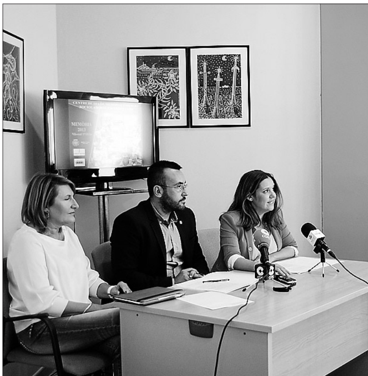
Les dades del 2013 al centre de menors són molt positives.