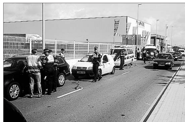
La Policía Local ha finalizado la campaña con seis positivos.

El proyecto se inserta en el Plan de Transparencia del Ayuntamiento de Vila-real, impulsado el pasado año 2013 con la realización, por parte de una entidad externa, de una auditoría de transparencia en el propio consistorio local. ≡