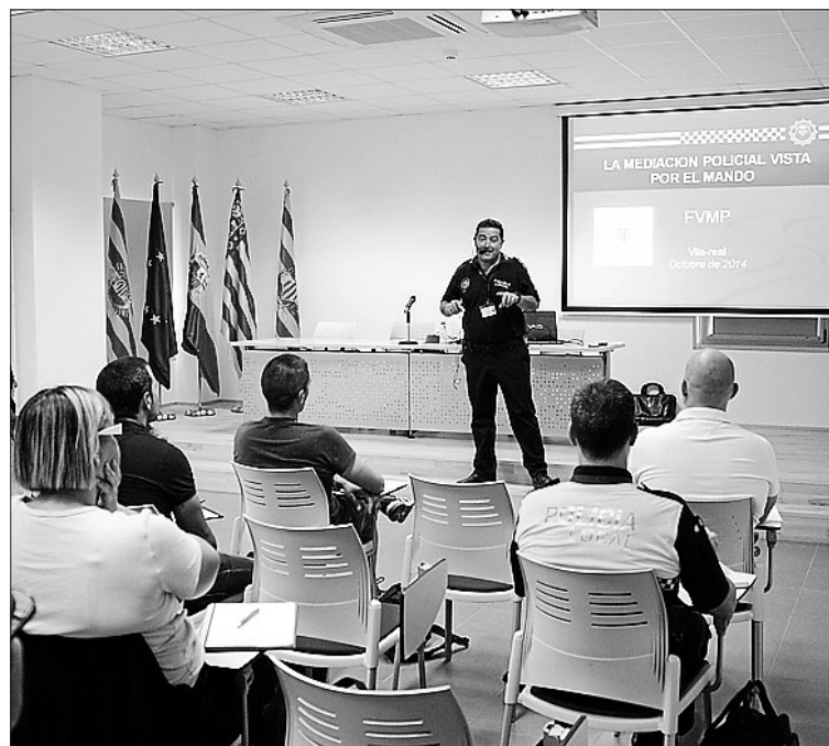
Un total de 25 personas asisten al curso de mediación policial.

Después del éxito obtenido en el primer curso, el proyecto formativo Mediem, impulsado por la Asociación El Porc Espí con la colaboración de la Concejalía de Solidaridad, pone en marcha su segunda edición para afianzar la mediación en los centros escolares de primaria y secundaria.