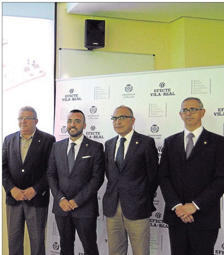
Representantes municipales y de Caixa Rural durante la presentación.

El proyecto pone a disposición de las empresas infraestructuras como espacios para oficinas