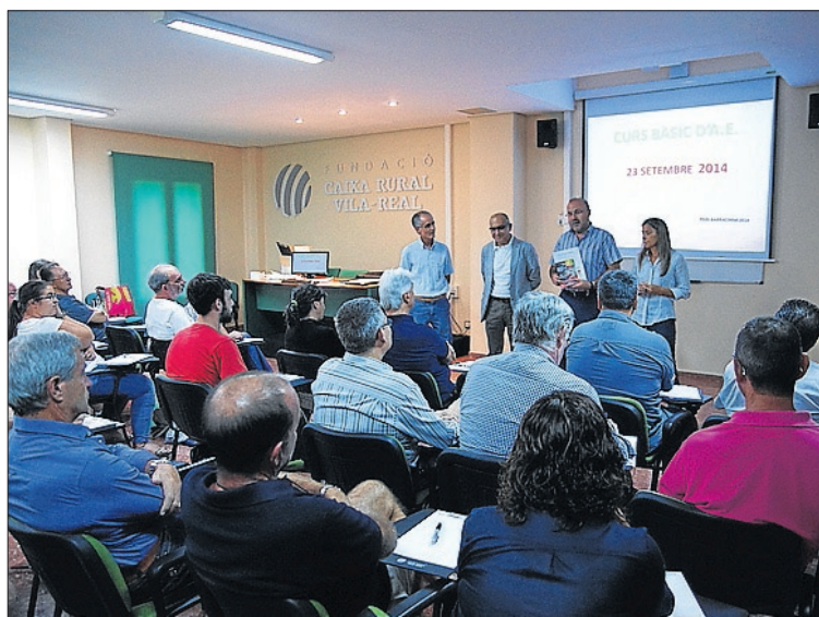
La ciudad ha acogido cursos similares con gran éxito de convocatoria.