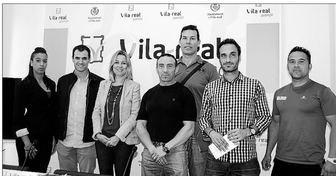
La regidora d'Esports junt amb els responsables dels sis gimnasos amb els quals s'ha signat el conveni.

La Fundació Primavera ha celebrat la IV Marxa Solidària per la Salut Mental a Vila-real, una jornada per a donar visibilitat a les persones amb malalties mentals.