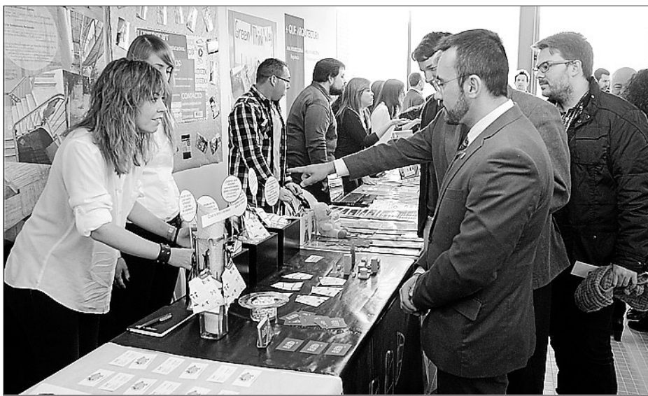
No és la primera vegada que Vila-real acull una cita d'innovació i networking.