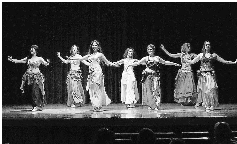
Els cursos de dansa o de Bollywood han hagut de desdoblarse per la demanda.

"Mantenim també cursos tan importants per a nosaltres com son el de Prepara't per aconseguir feina i el Cuida't i estima't, molt apreciats entre les persones que busquen en la Regidoria de la Dona un suport emocional i pràctic", apunta la responsable. ■