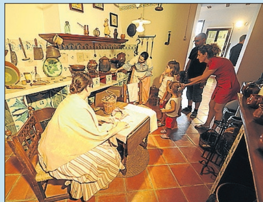
Museus i centres culturals específics.