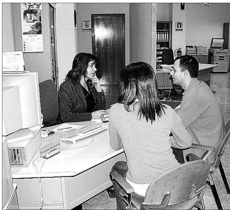
El personal municipal recibirá formación sobre la Ley de Transparencia.