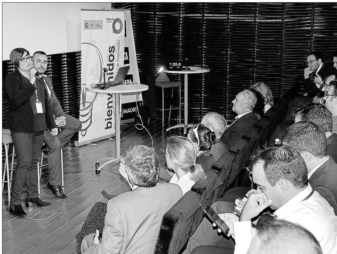
L'alcalde i la representant d'Empaperart durant la seua estada a Madrid a la trobada de la Xarxa.