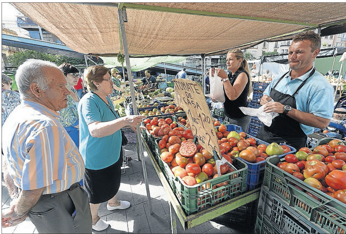
El mercado de productores locales pasará al jueves y el de las verduras se ubicará más cerca del de la ropa.