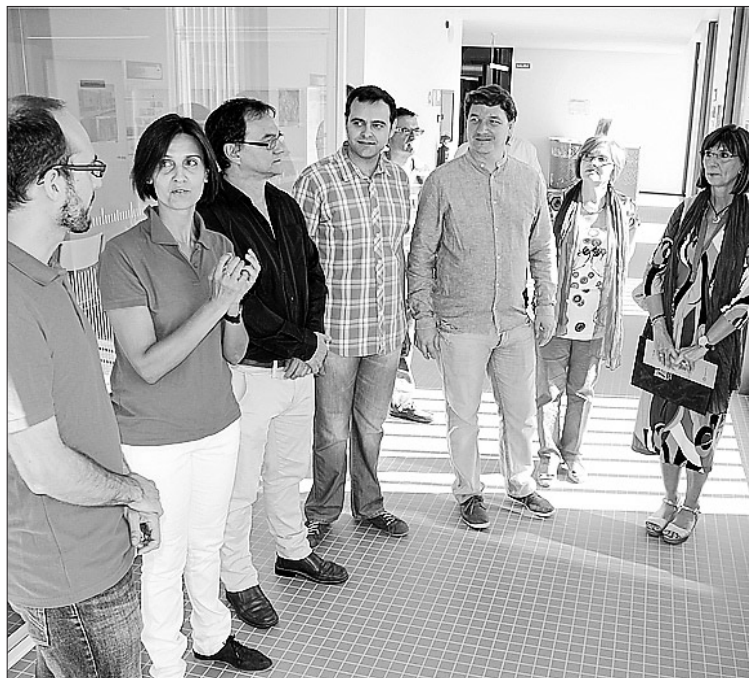
La ciudad ha acogido durante todo el mes jornadas sobre sostenibilidad.

La jornada centrada en la arquitectura y la construcción sostenible (8 de octubre), de la mano del proyecto eBrickHouse con el que el equipo VIA-UJI ha participado en la competición Solar Decathlon Europe, o el día dedicado al empleo verde (15 de octubre), con una conferencia sobre los fondos estructurales 2014-2020 y la presentación del estudio 'El emprendimiento verde en España', son algunas de las propuestas para acercar a la ciudadanía "el