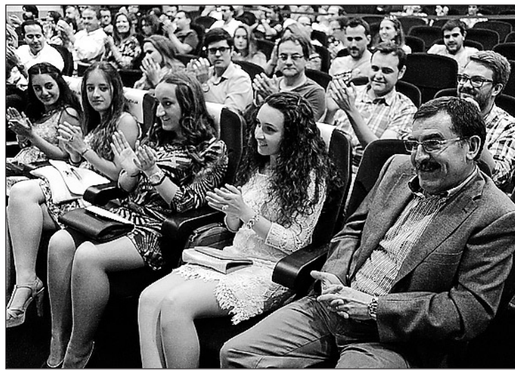
Els representants municipals i festius van donar suport a Colás.

El nou equip, que ja té experiència prèvia al teixit associatiu i fester, treballarà durant els propers tres anys en les festes