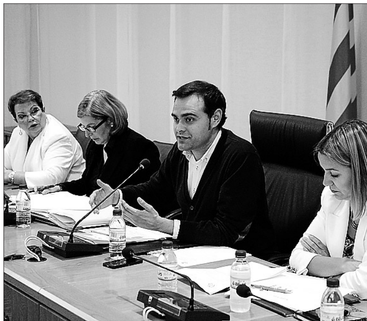
Imatge del darrer Consell de Participació reunit a Vila-real.

I és que durant la sessió es van donar a conèixer les últimes novetats respecte al reglament intern del Consell "que estarà en breu". En aquest sentit recorda que "mai abans el Consell havia disposat d'un reglament intern" i ha destacat que el nou mecanisme "dotarà de més garantia, agilitat i més facilitats perquè la participació dels veïns de Vila-real estiga assegurada".