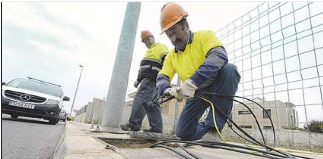
La paralització del projecte d'urbanització del PAI Madrigal va ser la causa de la falta d'enllumenat.

L'actuació afecta les unitats 31, 36, 37, 43 i 46, situades al marge dret del camí de l'Ermida. "Es tracta d'unitats que estaven pràcticament acabades, però que, a resultes de la paralització que va patir el PAI durant la gestió urbanística del PP, l'any 2009, romanien encara sense llum pública. Encara que hauríem volgut poder donar aquesta notícia molt abans, la situació que vam trobar en el PAI en assumir el govern municipal i els problemes d'interlocució amb l'urbanitzador -fins fa uns mesos Bankia- han dificultat enormement les gestions", detalla Obiol. En aquesta línia, el responsable de Territori recorda que el consistori es va oferir fins i tot a assumir el cost de la instal·lació,