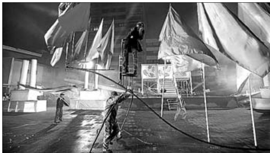
La de Vila-real és la cinquena estació internacional d'una obra en constant renovació.