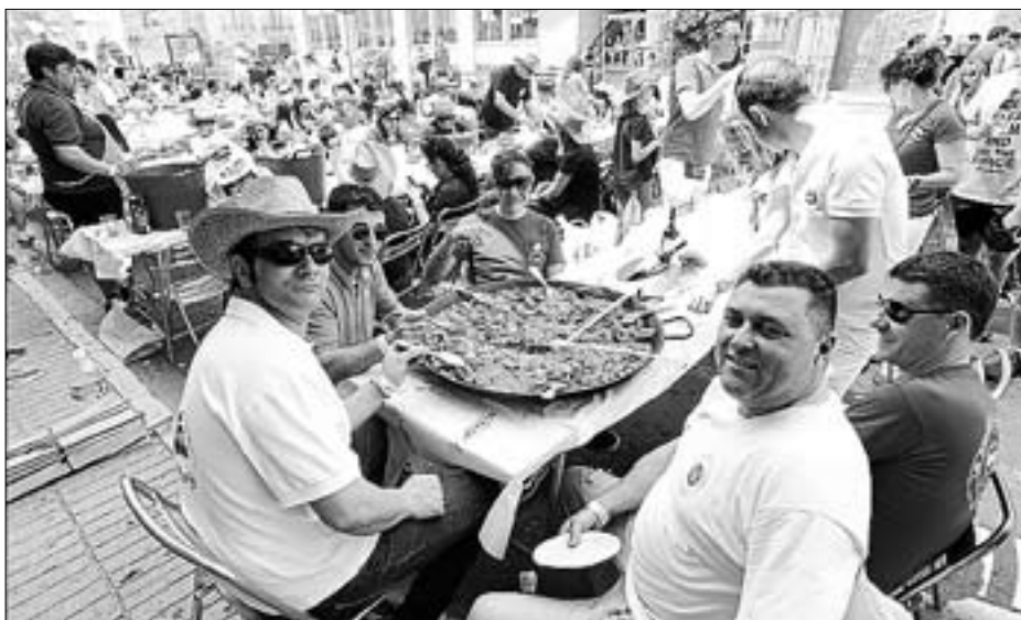
Los actos gastronómicos cobran especial importancia durante estos días de festejos.