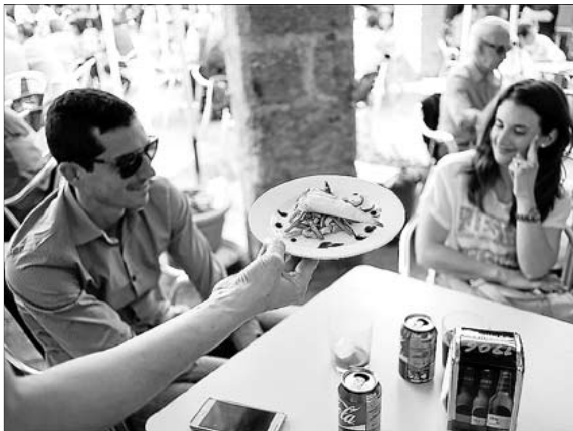
La Ruta de la Tapa vila-realenca és la degana a la província i espera superar les 40.000 unitats venudes.

En aquesta nova edició, els 32 bars i restaurants que participen ofereixen, un any més, la possibilitat de degustar una tapa de creació pròpia acompanyada d'una beguda per tan sols 3 euros. "Si fa un any, amb 30 participants, es van vendre 37.288 tapes i es va generar un volum econòmic de 93.220 euros, enguany amb 32 locals esperem superar els 100.000 euros i les 40.000 unitats de tapes venudes", assenya-