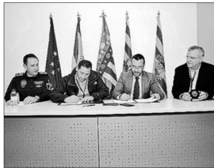
Los responsables de los entes implicados rubricaron el acuerdo.

"A esta problemática", agrega Valverde, "se añade el efecto de las raíces de los árboles, que habían levantado los adoquines, por lo que los vecinos nos habían hecho llegar el riesgo de caídas por las irregularidades, así como los problemas que se originaban en días de lluvia, cuando se generaban escorrentías hacia las casas". "Se trata de una obra relativamente pequeña pero significativa para la calidad de vida y la seguridad", dice Valverde. ■