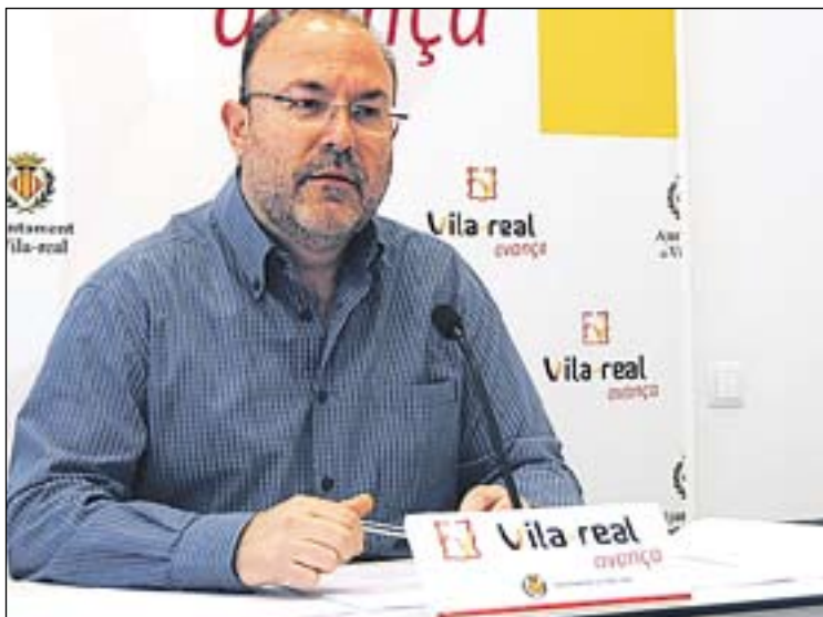
Obiol va explicar amb detall les actuacions previstes en la zona.

d'uns 60.000 euros, per a desbloquejar la situació.