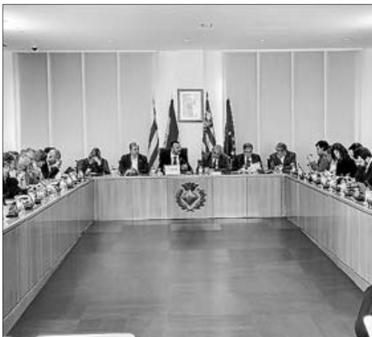
L'Ajuntament va aprovar la sol·licitud a l'ens provincial.