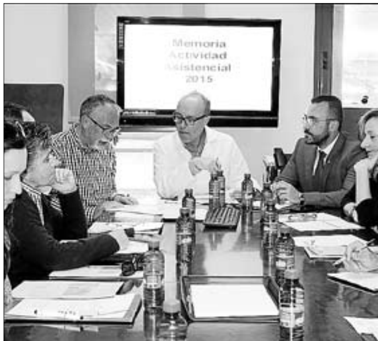
El Consejo cuenta como referencia con el hospital la Plana.