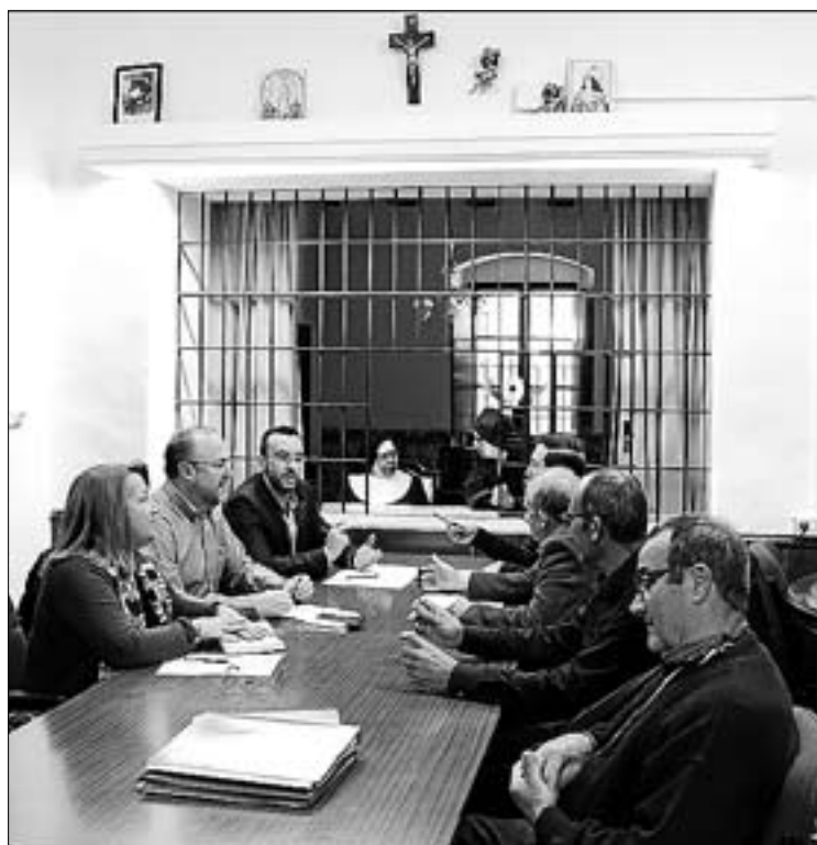
La Fundación pudo oficializar su creación hace unos meses.