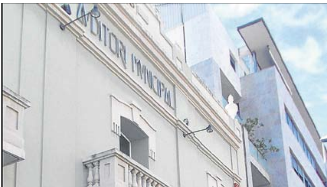
Un 10% de l'energia subministrada als immobles o instal·lacions municipals ha de ser d'origen renovable.