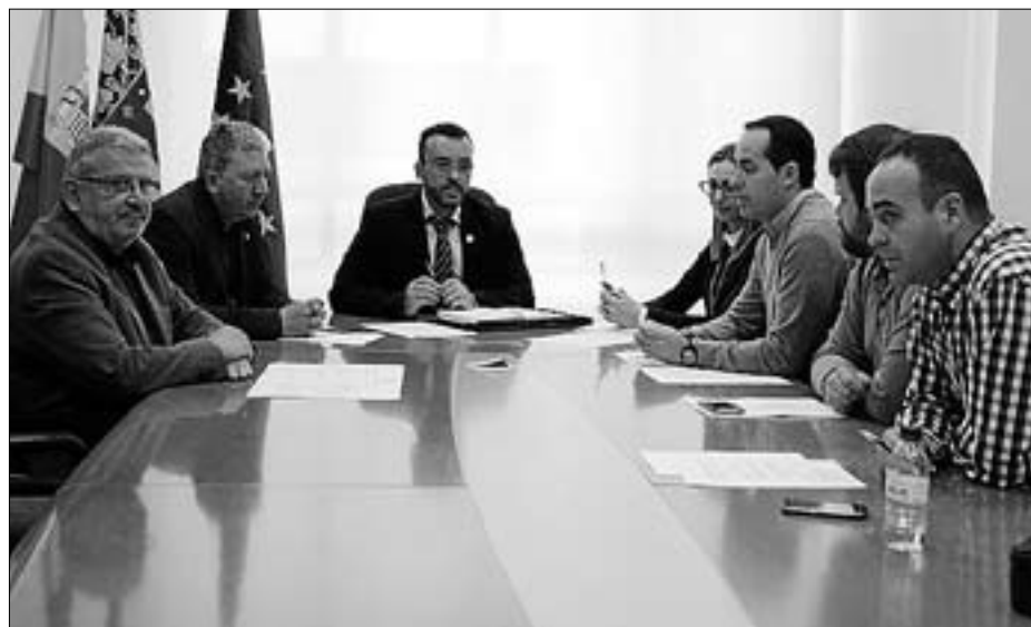
Los representantes de los partidos trataron la reivindicación del centro educativo.

"Para el curso 2016-2017, en Vila-real hay 563 niños y niñas por escolarizar en educación infantil de 3 años. Si se considera la unidad del colegio Bisbe Pont, tenemos un total de 22 unidades en la localidad, por lo que se podrían repartir 25,5 alumnos por aula. Si la unidad de este colegio desaparece, la distribución sería de 26,8 alumnos por aula", argumenta el manifiesto. El acuerdo se remitirá a la Conselleria para trasladar el apoyo unánime de la corporación municipal al centro docente y evitar la supresión de una unidad de educación infantil. ≡