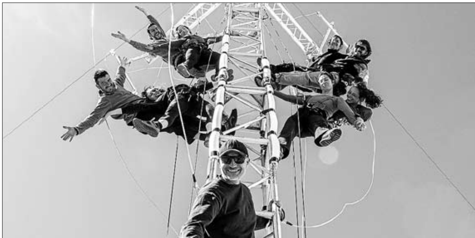
L'espectacle aeri 'Eterfeel' és una coproducció del 29è FitCarrer, que agradarà molt a tots els públics a causa de la seua espectacularitat.