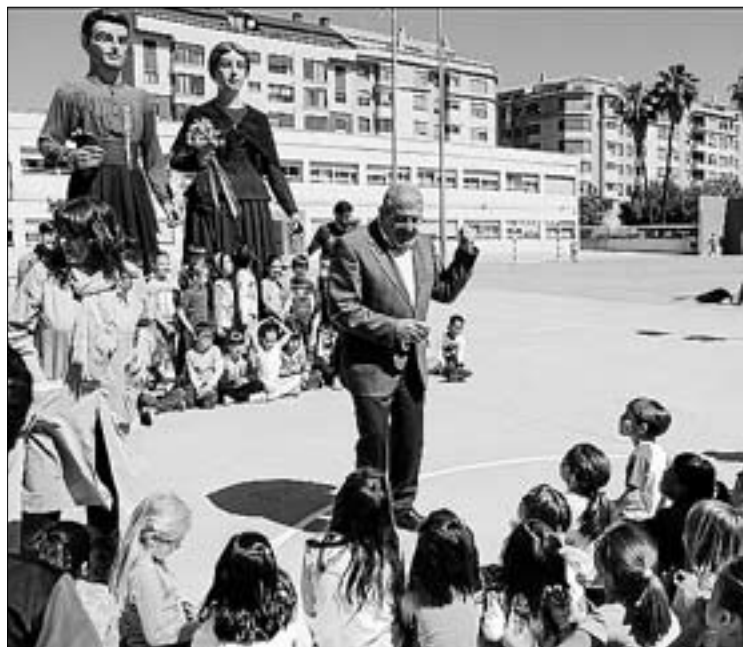
Els xiquets coneixen els detalls de com són els gegants per dins.

"Es tracta d'una iniciativa molt interessant que permetrà que tots els xiquets gaudeixen dels actuals gegants", explica el regidor de Tradicions, Pasqual Batalla. ≡