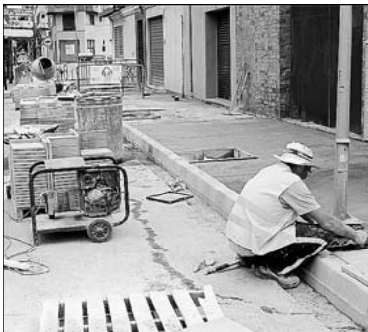
Los trabajos mejoran la seguridad y accesibilidad del vial.

"Uno de los ejes fundamentales del trabajo en SPV es, sin ninguna duda, dar respuesta a las demandas de los vecinos para tener una ciudad más accesible, amable y mejor para todos. En este caso, con mayor motivo si cabe, ya que estamos hablando de una de las principales avenidas de la ciudad que, por este motivo, está sometida a una impor-