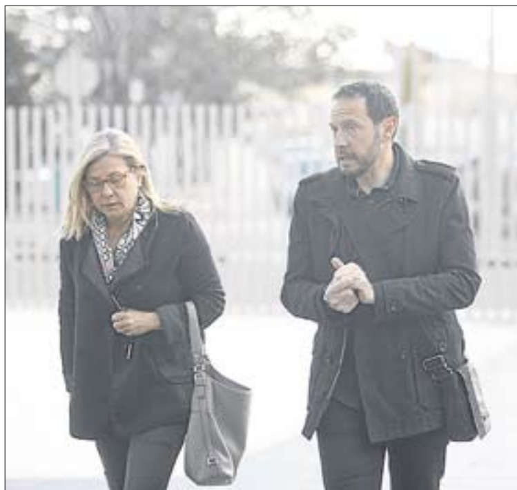
El Palau de Justicia acogió las declaraciones de los citados.