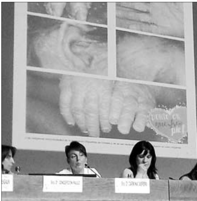
Carmina usó en su ponencia imágenes como ésta para ejemplificar.

Además, comenta Carmina, solicitan ayudas para la compra de los productos que necesitan aplicar a la piel con una alta frecuencia y que no bajan de los 30 euros. ≡