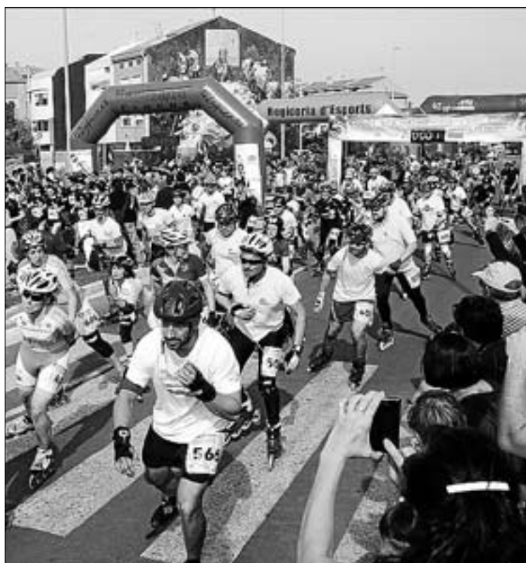
Més de 500 esportistes estaven citats en aquesta prova a la ciutat.

Una de les novetats d'aquesta edició va ser que el circuit que van completar els patinadors fou més