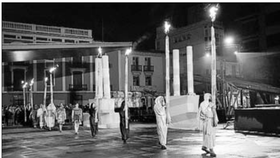
Un dels objectius de la companyia és aconseguir que el públic reflexione.