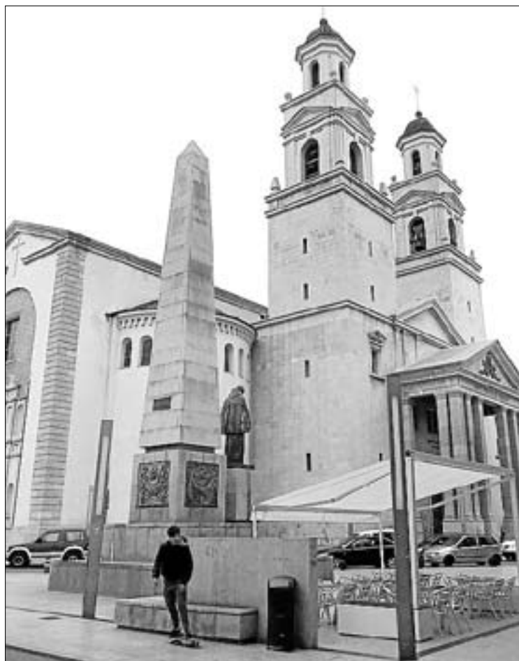
La iluminación y la edición de audioguías, entre las actuaciones.

"Son dos iniciativas sencillas pero de gran relevancia para dar a la basílica y el entorno de San Pascual la prestancia que merecen y comenzar a caminar con paso firme en la potenciación del monasterio y la figura de nuestro patrón como referente en turismo religioso en toda la Comunidad Valenciana", señala Obiol, que recuerda que cada semana visitan el complejo una media de cuatro autobuses de turistas procedentes de diferentes puntos del país. "Vila-real, con la basílica de San Pascual como eje principal, tiene mucho que decir en el ámbito del turismo vinculado a la fe. A través de proyectos como éstos, al trabajo de la Asociación Amics del Pouet del Sant y, desde hace unas semanas, a la Fundación Pro-Monasterio y Basílica de San Pascual, vamos avanzando y consolidando este proyecto", apunta Obiol. ■