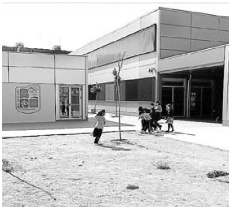
L'Ajuntament ha assumit, fins ara, les reparacions del centre escolar.

"Parlem d'un centre que es va recepcionar durant el primer any del govern progressista, el 2011, i hi ha