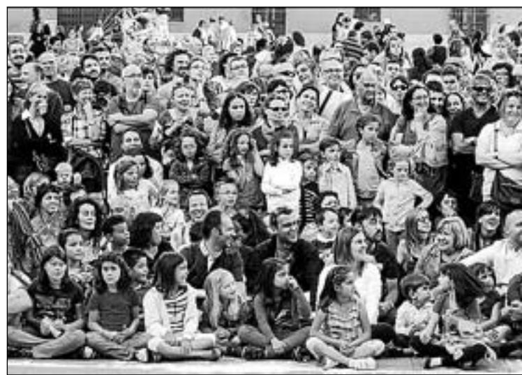
Públic de totes les edats poden gaudir dels espectacles del festival.

"El FitCarrer és el festival més veterà i arrelat a Vila-real i l'únic a la Comunitat Valenciana", destaca el regidor de Cultura