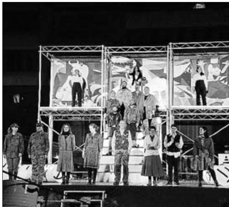
Més de vint professionals han fet possible la representació.

Així doncs, es van ampliar les escenes sobre l'escenari per a facilitar la visibilitat a un major nombre d'espectadors, es va potenciar el maquillatge màscara dels soldats durant les escenes de guerra, algunes escenes que s'havien realitzat de manera itinerant es van situar en l'escenari i també, per exemple, es va adaptar la llum i la pirotècnia. ■