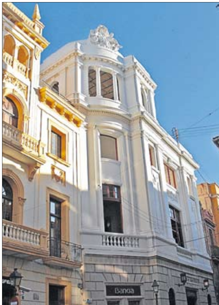
El edificio, inaugurado en 1933, presentaba problemas estructurales.

A estas mejoras, el informe técnico de Patrimonio suma actuaciones destinadas a limitar y corregir los procesos patológicos y las lesiones derivadas que afectaban a la integridad del edificio, centradas sobre los revestimientos de fachadas, así como sustituir algunos sumideros y reparar la carpintería de la fachada principal protegida, que ya está en marcha, con una restauración