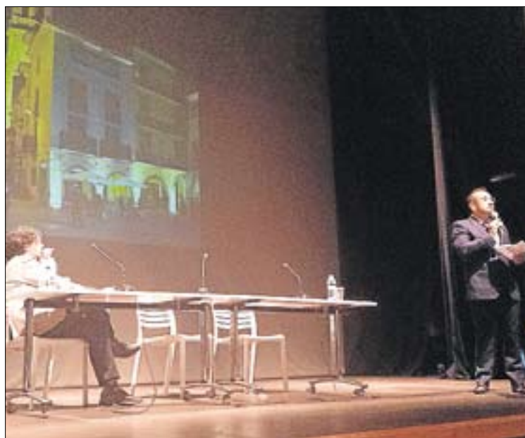
El alcalde explicó las ideas de desarrollo para el futuro de la ciudad.