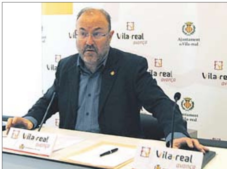
Obiol va detallar l'article que incorpora la nova contractació.

Per a això, l'article 16 de la plica detalla que "l'empresa adjudicatària es compromet al fet que un mínim del 10% de l'energia elèctrica