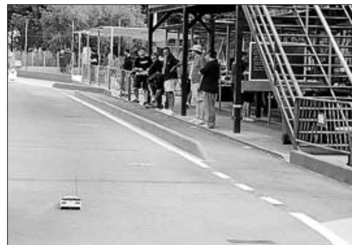
La competició es va realitzar a la pista exterior del recinte.

L'SME ha inaugurat una innovadora pàgina web, http://www.circuitcarrerpopularsvila-real.com/ , amb tota la informació per a practicar aquest esport i per a facilitar la seua participació en el Circuit de Carreres Populars. La següent cita esportiva és el 8 de maig. ≡