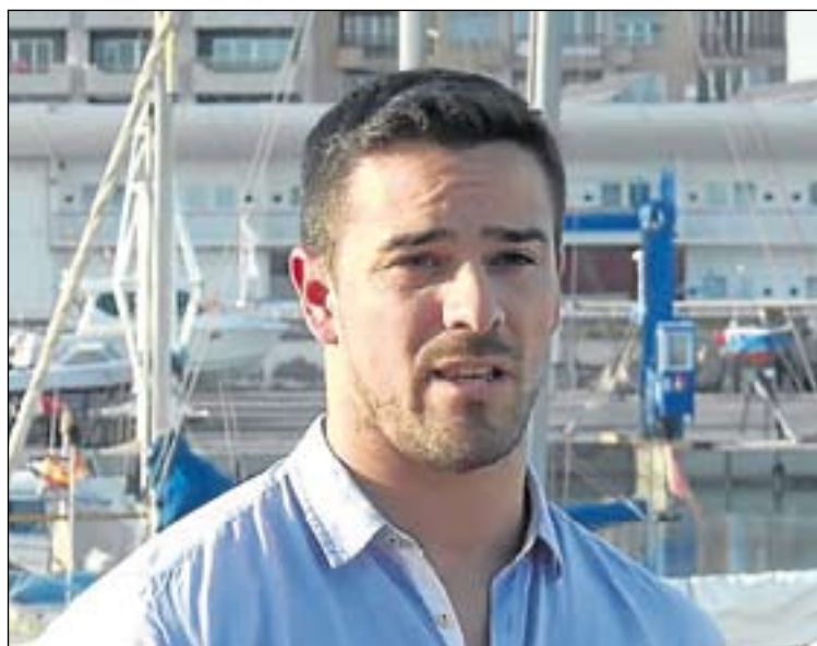
La idea surge para superar el escollo del alto coste de comprar.

El joven apunta que son conocidos de los atractivos y las desventajas de lanzarse al mar. "Comprar y mantener un barco tiene un elevado coste por lo que pensamos que la gente no debía renunciar a disfrutar de una embarcación por el precio", comenta y añade que, con este modelo, ganan todos: los armadores, que pueden sobrellevar mejor el coste del mantenimiento del barco, y los navegantes ocasionales, a los que permitirá disfrutar de su pasión a un precio razonable.