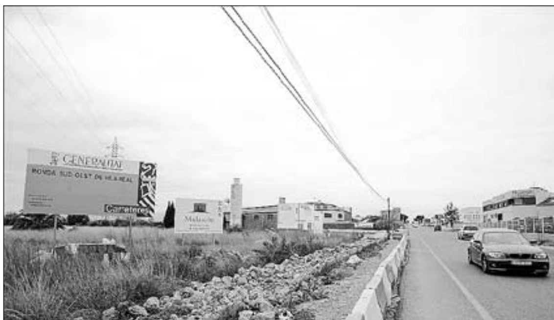
La ronda suroeste se adjudicó en el 2008 y se paralizó solo un mes después de que se iniciara el trabajo.

“Debemos trabajar por consolidar esta red y es importante que se incorporen más ayuntamientos e instituciones, particularmente en Castellón, donde la presencia del Fondo es reducida”, dice el edil.