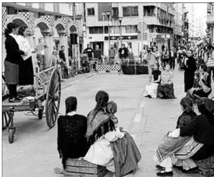
Teatre, exposicions i conferències han protagonitzat el III Memorial.

Audicions acadèmiques, una nova sessió del cicle Auditiva, a càrrec de ZAI, el concert de la Banda Municipal de València o les exhibicions de final de curs de les escoles municipals de dansa o de teatre completen la programació, que commemorarà també el Dia Internacional dels Museus i comptarà amb el cicle Imaginària Fotografia a la primavera 2016, del 13 de maig al 26 de juny, que mostrarà els treballs 'Pequinesos' i '6000 Estúpids i 10 més'. Al juny arriben concerts i una exposició. ≡