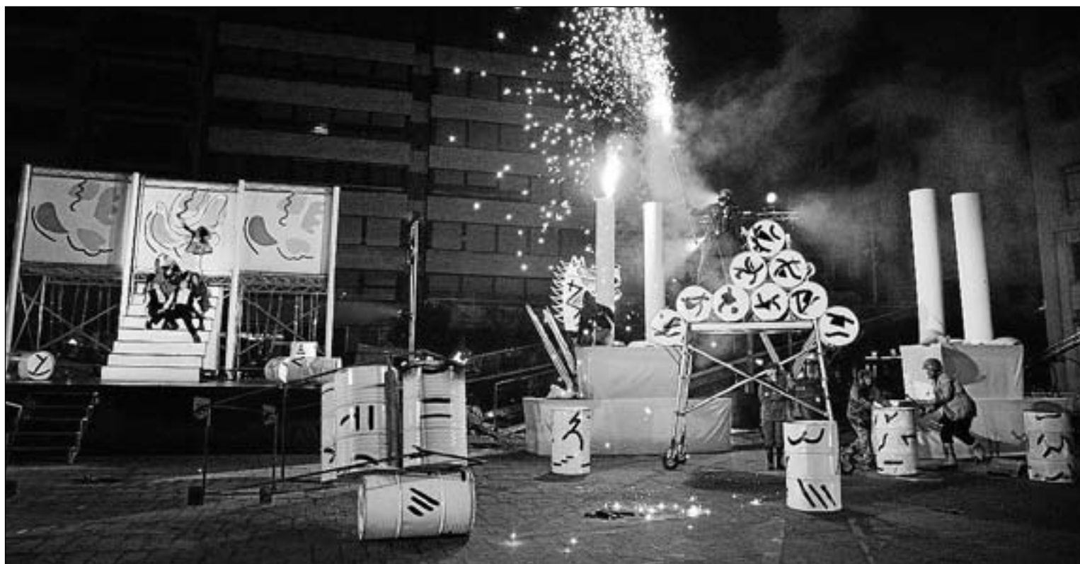
'Ara Pacis' és una imponent exhibició amb elements característics de Xarxa com la llum, el foc, la itinerància, el color, la pirotècnia i el so.