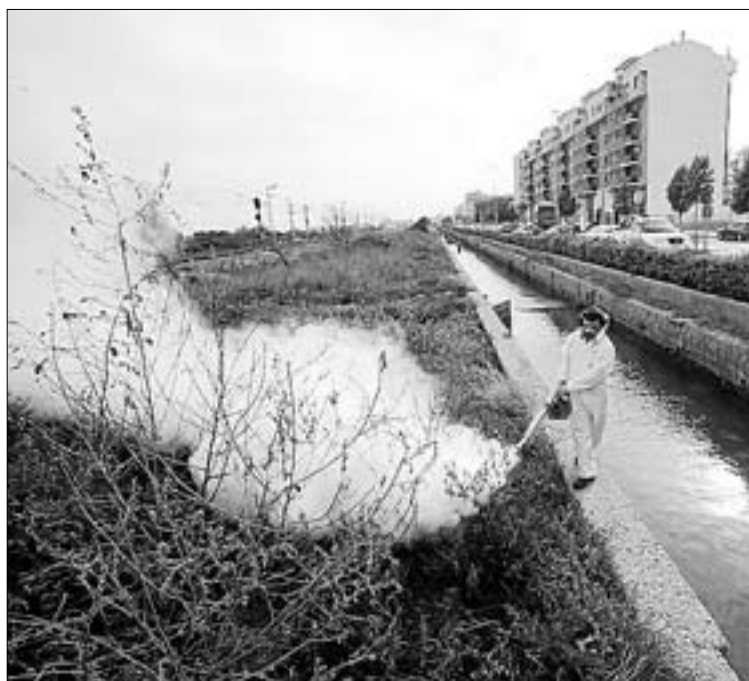
Los trabajos antimosquitos comenzaron hace unas semanas.