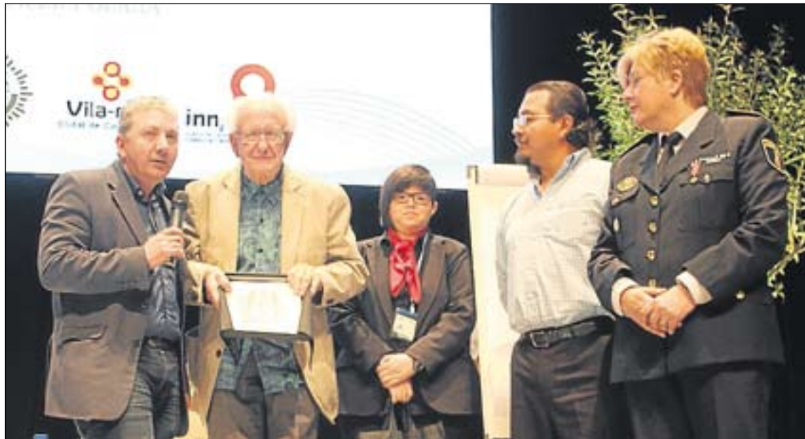
El experto mundial en resolución de conflictos, Johan Galtung, participó en la última jornada.

El propio presidente del Consell destacó en su discurso el apoyo de la Administración autonómica a la práctica mediadora como un ejemplo de "innovación social" que aborda la resolución de conflictos como "gestión de la diversidad garantizando condiciones de