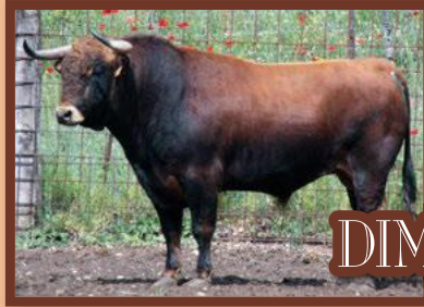
Núm. 28 G. 2 - Pilar Moreno ACT 1 BOU +