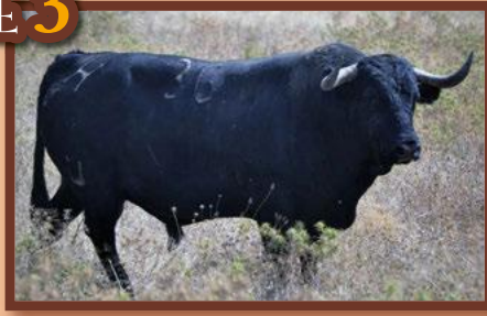
Núm. 36 G. 1 - Hijos de D. Celestino Cuadri JUNTA DE FESTES