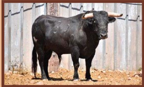
Núm. 133 G. 2 - El Pilar COMISSIÓ DE PENYES