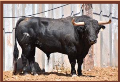
Núm. 22 G. 2 - El Pilar COMISSIÓ DE PENYES