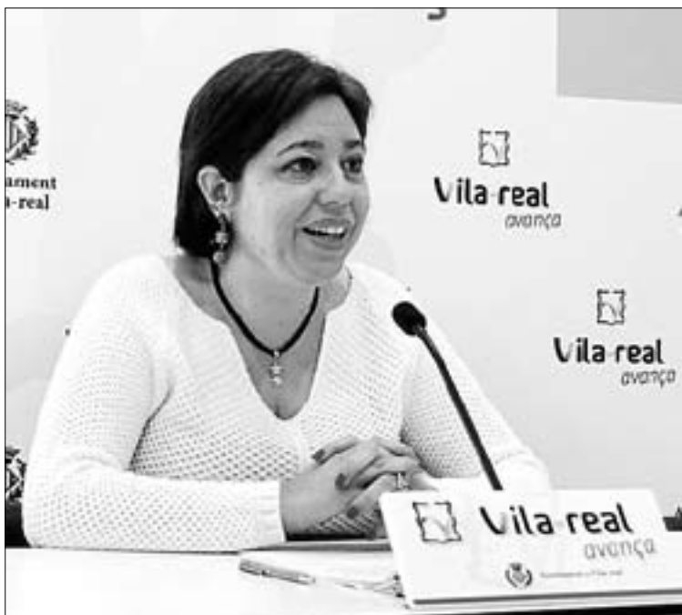
Escrig agradeció el “apoyo del Gobierno valenciano” a las familias.

→ NATURALEZA. El Consorcio del Mijares aconseja dejar de hacer algunas actividades para no molestar a la avifauna como la pesca continental en las balsas que se forman en el lecho del río, la práctica del senderismo y de la bicicleta de cross por fuera de las rutas señaladas o la fotografía de naturaleza, entre otros, para garantizar el éxito del proceso de reproducción.