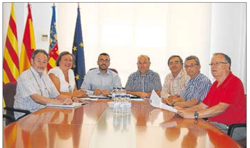
Els integrants de l'Associació es van reunir amb els responsables municipals.

Benloch defensa que aquest projecte suposarà una millora substancial de la mobilitat en la ciutat, per a evitar els perills que generen els vehicles pesants en el seu trànsit per Vila-real, a més de reduir les molèsties i les emissions contaminants que aquest trànsit pot generar i donarà més seguretat als conductors dels vehicles pesants. ≡