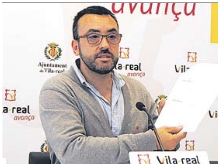
El alcalde valoró que, por ahora, dos carriles serán "suficientes".

El nuevo vial tendrá cuatro kilómetros de longitud con un carril para cada sentido de circulación, con amplios márgenes para la ubicación de aceras. Comenzará en la CV-20 y, por detrás de la Ciudad Deportiva del Villarreal CF, conectará con la N-340.