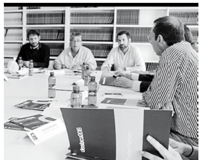
El comitè organitzador es va reunir fa unes setmanes a la BUC.