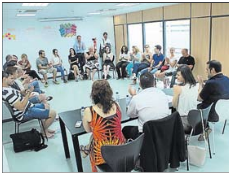
Responsables municipales han visitado una de las sesiones.

Desde el consistorio continuarán apostando por una "colaboración total" para evitar los asaltos "con controles y vigilancia durante 24 horas, aunque intentar evitar estos episodios al 100% es complicado". El edil recordó que son "la única localidad que mantuvo la Policía Rural" y añadió que en los meses más intensos de la temporada seguirán "apostando por reforzar la vigilancia en los campos". Los agricultores esperan una buena campaña. ≡