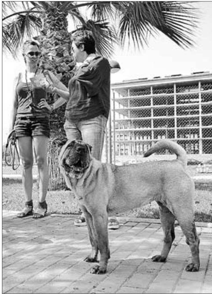
La empresa de limpieza viaria ha asumido el coste de la actuación.

Escrig ha hecho hincapié en la necesidad de que los dueños tomen conciencia sobre la limpieza de los excrementos de las mascotas, tanto en la vía pública como dentro de los