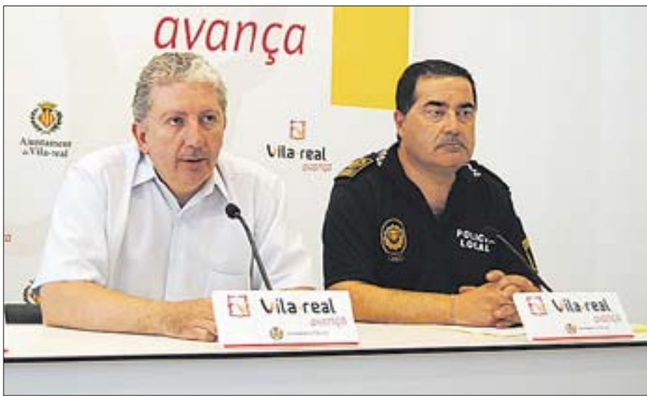
Serralvo i Martínez van detallar en què consisteix la nova distribució policial.