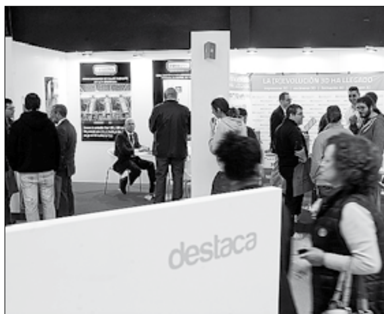
Destaca va celebrar la primera edició l'any 2014 a Vila-real.

la capacitat d'innovació que han detectat en l'estructura empresarial, cosa que es veu reflectida també en l'organització de la Fira Destaca i en la qual seguirem treballant per a afavorir el canvi de cultura i model productiu que necessitem per a seguir generant oportunitats en el nostre entorn", conclou Benlloch.