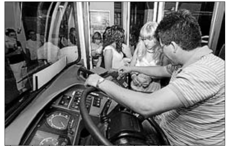
El servei uneix Vila-real amb Benicàssim els dissabtes.

"Les tècniques de l'àrea es posen en contacte amb la persona o empresa responsable perquè corregisca l'error i després avisen l'usuari que ho ha enviat", assenyala Batalla que incideix en què són moltes les variants del nom de la ciutat. ≡