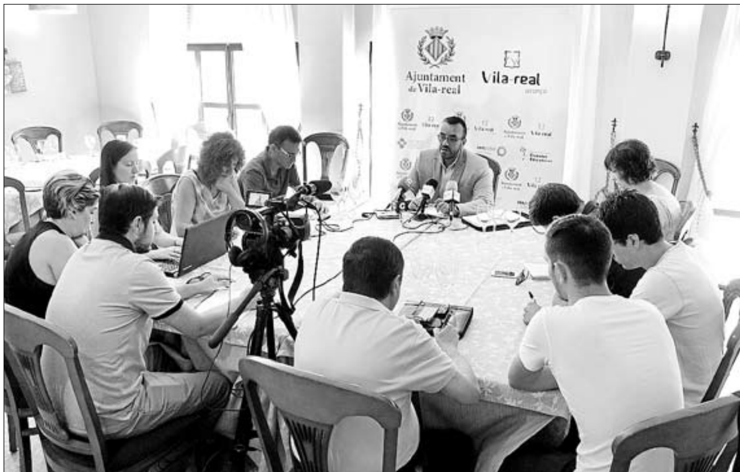
L'alcalde va explicar, en una convocatòria al restaurant El Molí, els detalls del pla d'ajust que s'aplica el segon semestre de 2016.

Les mesures anunciades per l'alcalde de la ciutat suposen un estalvi d'uns 500.000 euros fins a finals d'aquest exercici