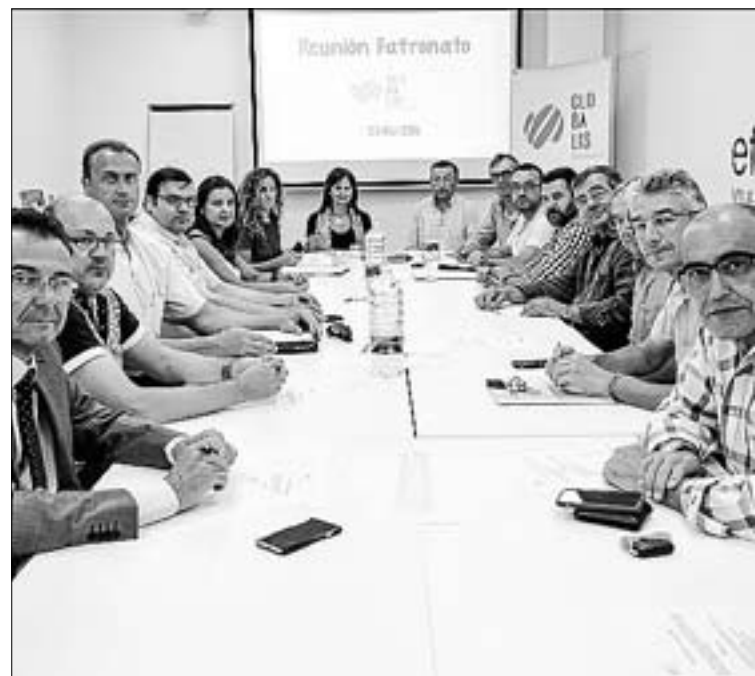
La cita se celebró en las instalaciones del centro Efecte Vila-real.