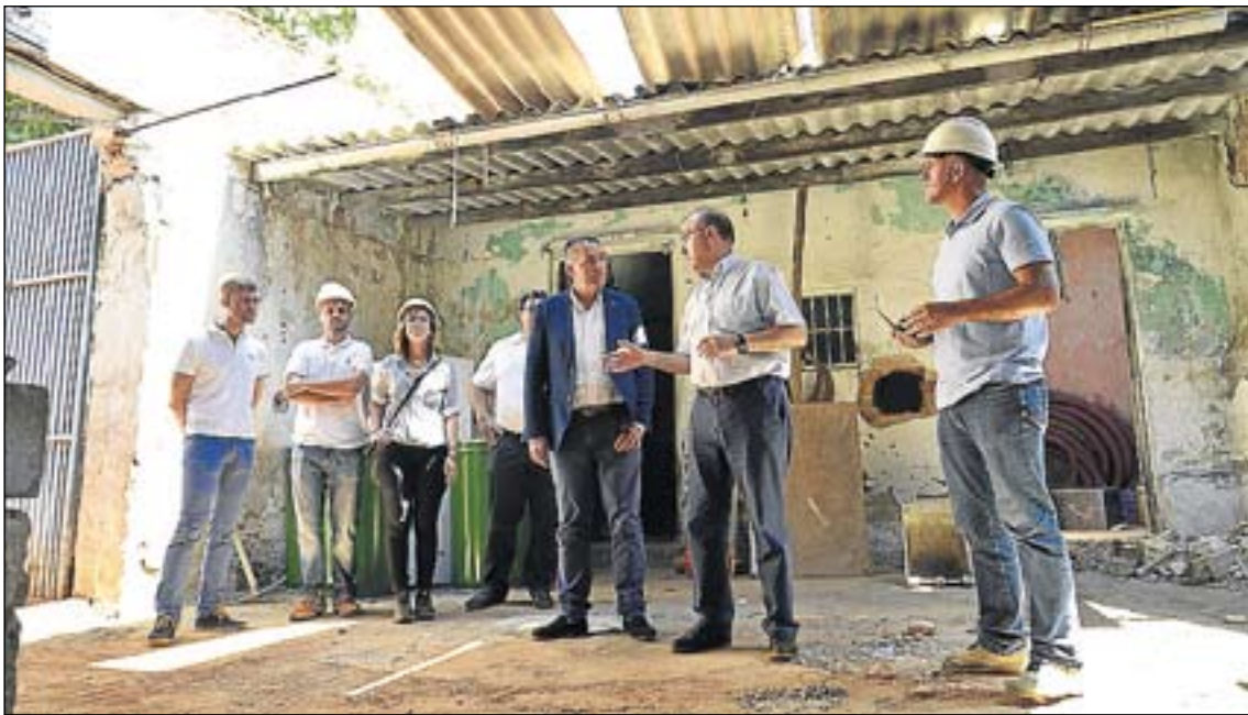
L'objectiu es recuperar el valor del molí, una peça patrimonial de la localitat que data del segle XVI.