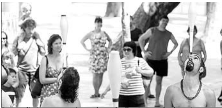
Desenes d'artistes mostren els seus dots amb tallers i espectacles de tot tipus.