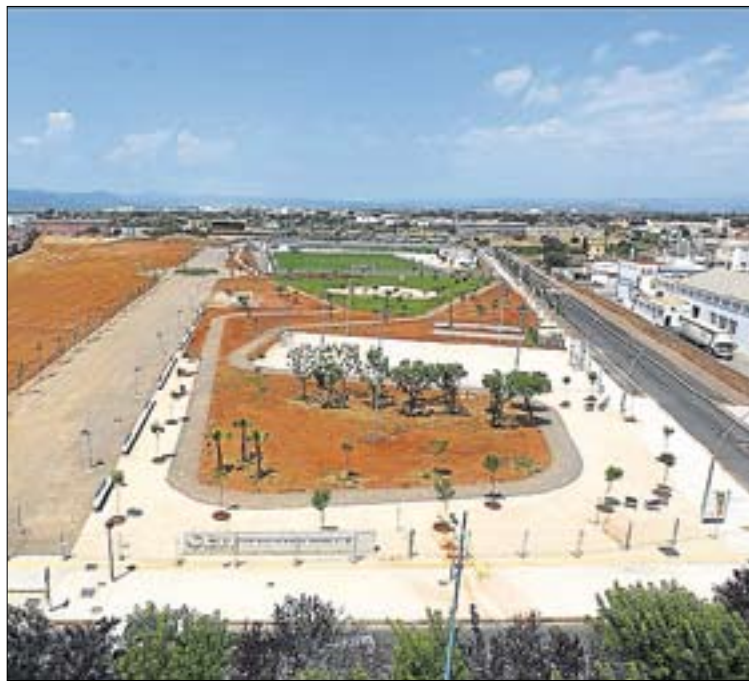
Esta actuación mejora el estado del barrio de San Fernando.

Una vez recepcionada la obra, las previsiones del equipo de gobierno son las de abrir al público el 4 de agosto toda la zona de jardín, que incluye también el carril de running y la pista polideportiva, con arbolado, zonas de descanso y una fuente con chorros de agua en la que está permitido el acceso para refrescarse.