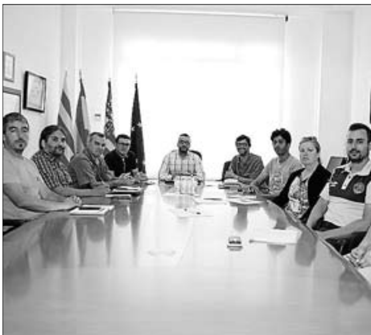
Representants de diferents sectors van mantenir una reunió.

Els alumnes participants en els cursos de formació contínua en Mediació policial 2015-2016 i en el curs de Mediació en l'àmbit de la construcció i l'edificació 2016 han respost a una enquesta en finalitzar la formació que revela el seu alt nivell de satisfacció amb les classes rebudes.