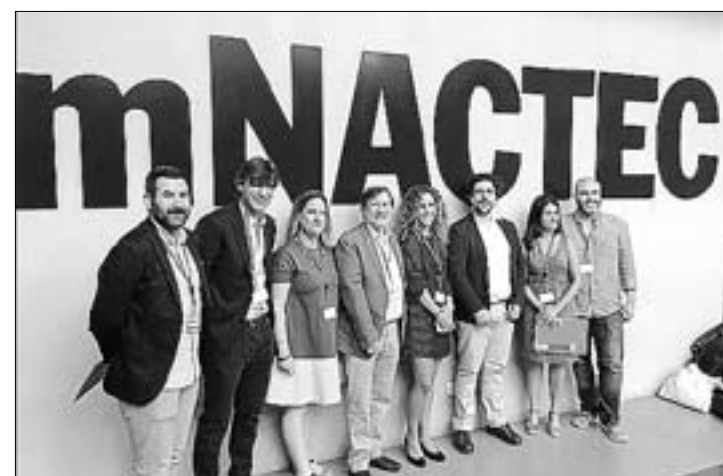
La cita de la red Innpulso se celebró en la localidad de Terrassa.

El CEEI de Castellón es una asociación privada sin ánimo de lucro, constituida en 1997. ≡