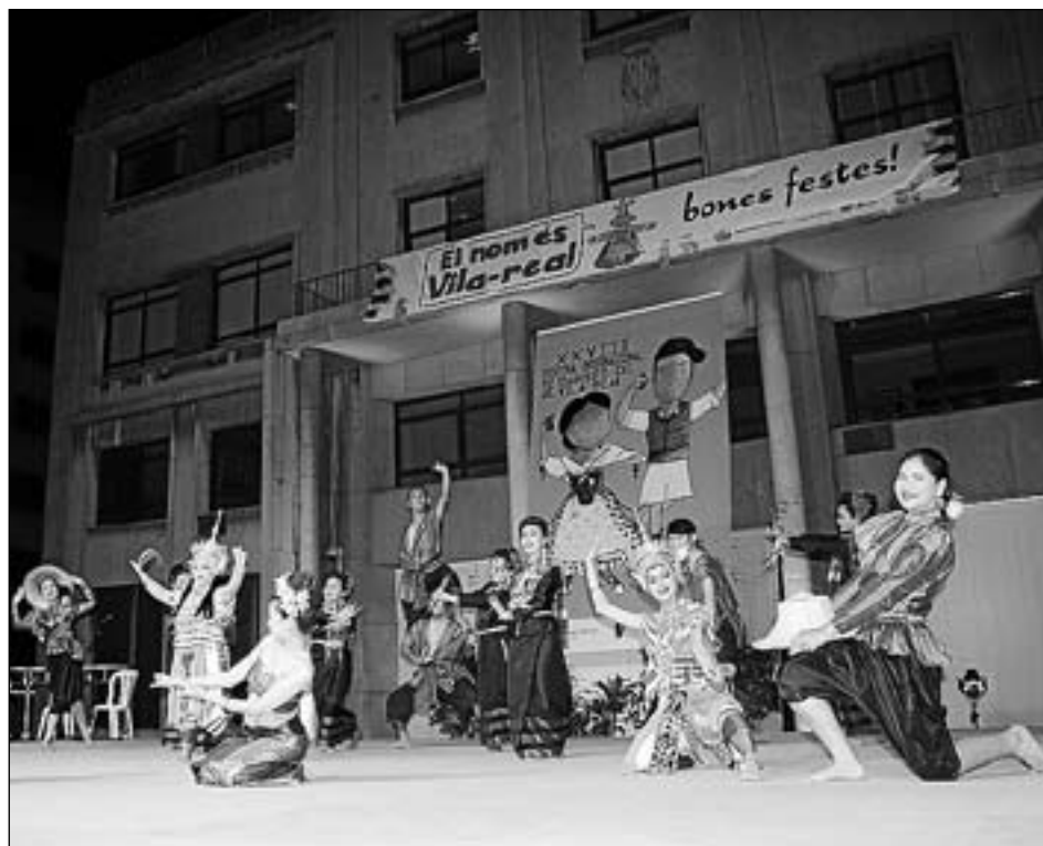
El Festival Internacional de Danses no s'organitzarà després de la renúncia d'El Raval.

qual cosa generem un estalvi d'uns 6.000 euros", detalla Pérez. Quant al Festival Internacional de Danses, el regidor de Cultura adverteix que la decisió del Grup de Danses El Raval de no fer-se càrrec del certamen, sumada a les dificultats burocràtiques i administratives que aquesta decisió comporta, ha portat a prescindir de la cita ja que, segons Pérez, seria complex que l'Ajuntament assumira l'organització. A més, el Cicle de Música Antiga eliminarà un dels concerts i se suprimeix una actuació coral, a més de reduir les despeses del Festival Coral i la Setmana Tàrrrega en uns 5.000 euros aproximadament, entre altres.