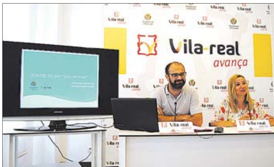
Agost y Gómez detallaron las atenciones realizadas por el centro el pasado año.

El objetivo del proyecto es el intercambio de buenas prácticas y la transferencia de herramientas para la integración infantil