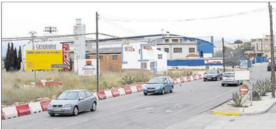
La creación de esta carretera de circunvalación de la ciudad se remonta a hace más de dos décadas.