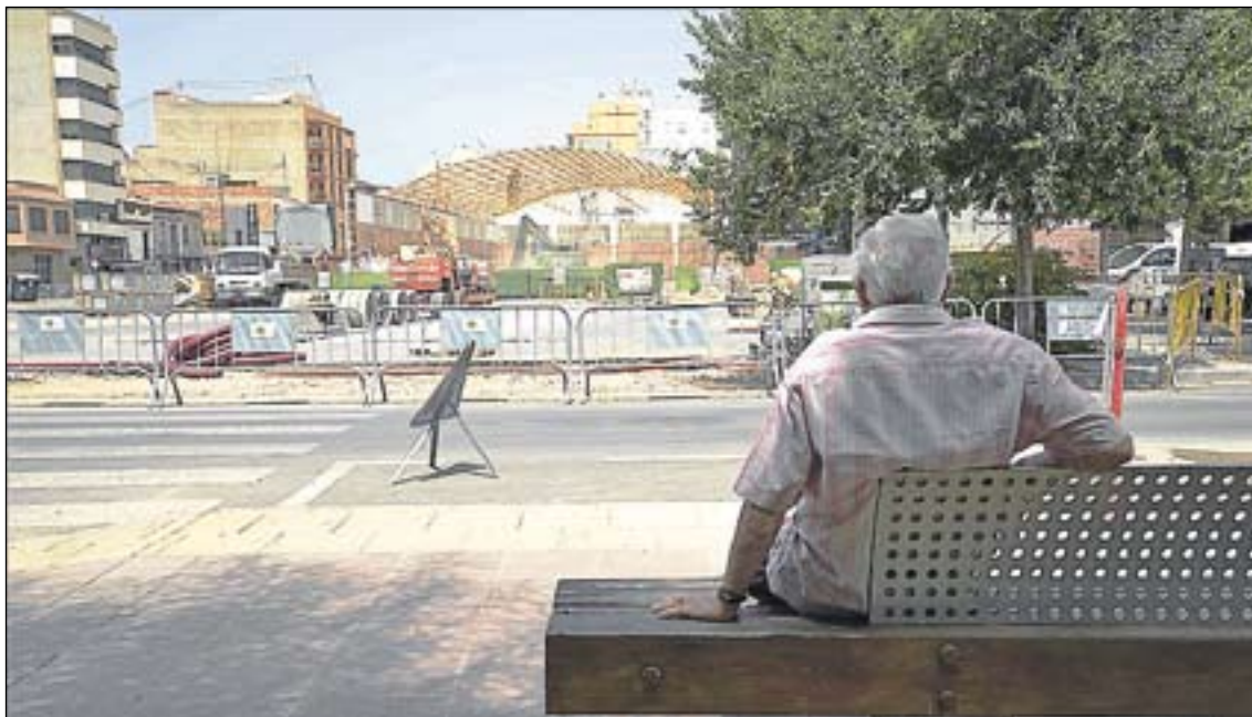
L'enderrocament del pavelló permet generar un espai més útil, atractiu i segur per a la ciutadania.

Amb aquest objectiu, el projecte contempla crear una plaça diàfana al costat de l'estadi que comptarà amb paviment antilliscant de tons grisos dissenyat exclusivament per a l'espai amb característiques específiques de flexibilitat i durabilitat. A més, es marcarà amb un taulell d'una tonalitat diferent la superfície que ocupava el pavelló, de manera que s'aconseguirà "una nova plaça