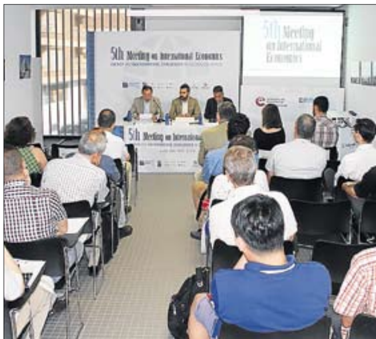
Académicos, políticos, expertos y profesionales en la BUC.