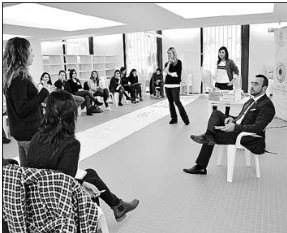
Vilabeca queda suspès per a evitar duplicitats amb 'Avalem Joves' de la Generalitat.