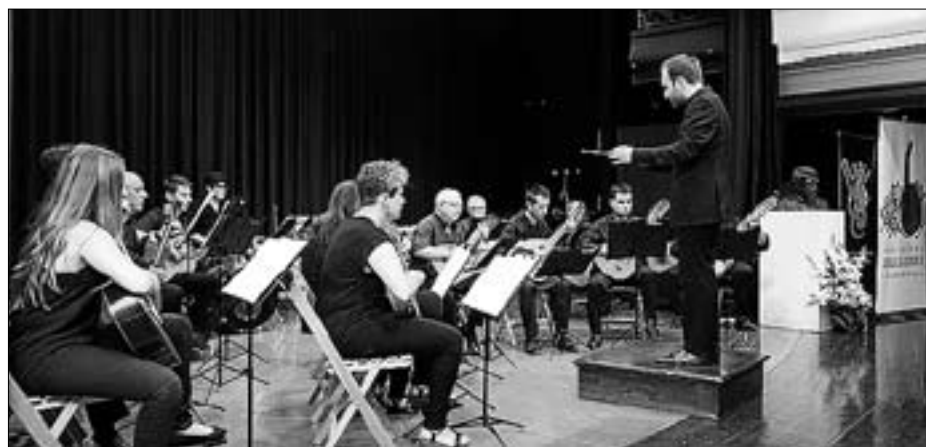
L'esdeveniment vol apropar i captivar amb els sons de pols i pua el públic general.

En aquest sentit, des de la direcció de l'esdeveniment apunten en el web 'www.malabarat.com' que "gràcies a l'organització, voluntaris, artistes, tècnics, artesans, espontanis i al públic que s'entrega, hem aconseguit que amb la nostra trobada estival, Vila-real forme part, a dia d'avui, del mapa del circ europeu". ≡