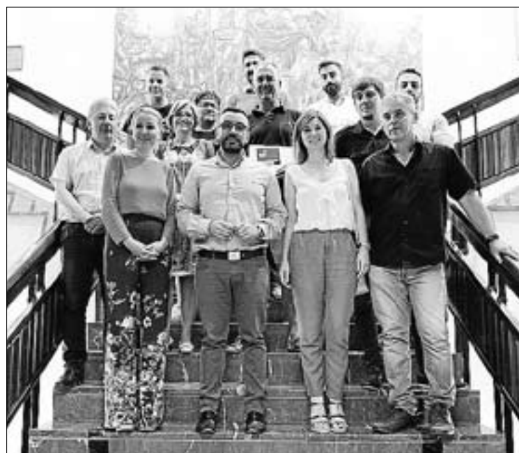
Els participants van rebre un distintiu que acredita la formació.

Sorgit el 2009 en el marc del conveni de col·laboració entre la Delegació del Govern per al Pla Nacional sobre Drogues i la Federació Espanyola d'Hostaleria, el programa es basa en el foment de les bones pràctiques professionals del sector hostaler i d'oci nocturn. ≡