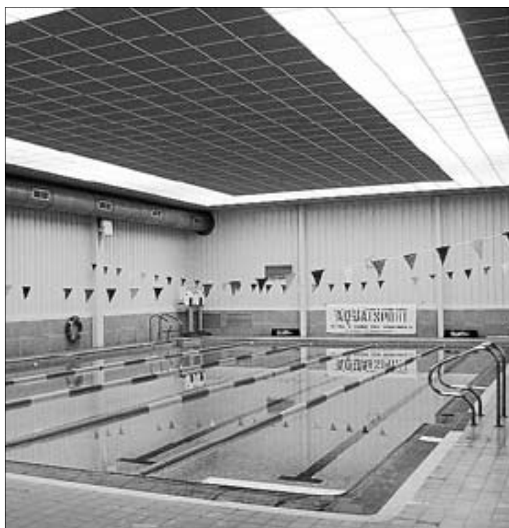
Las instalaciones de Aqua Esport albergarían este nuevo servicio.

Benlloch asegura que el objetivo del equipo de gobierno es poten-