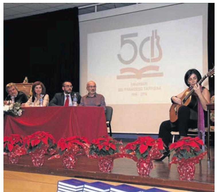
La sala d'actes de l'institut va acollir la presentació del llibre commemoratiu.

En l'actualitat, el centre educatiu atén 1.300 estudiants i, a més, és la seu de l'aulari a Vila-real de l'Escola Oficial d'Idiomes, la qual cosa suposa altres 700 persones. «Són unes xifres elevades, que fan més complexa la gestió de l'institut, però la veritat és que tot funciona molt bé i, fins i tot, responsables educatius que han visitat el centre s'han mostrat sorpresos», explica Portalés.