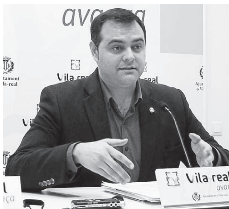
Ochando recuerda que se trata de una medida pionera en la provincia.

Ochando insiste en que la aportación es «a fondo perdido» y se enmarca «dentro del fomento de la cultura europea».