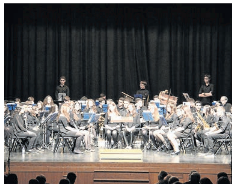
El concierto de Socarrats con la Banda Jove y el coro de Botànic Calduch.

■ Entre las novedades, un concurso para decorar las calles y las actuaciones de grupos locales de música