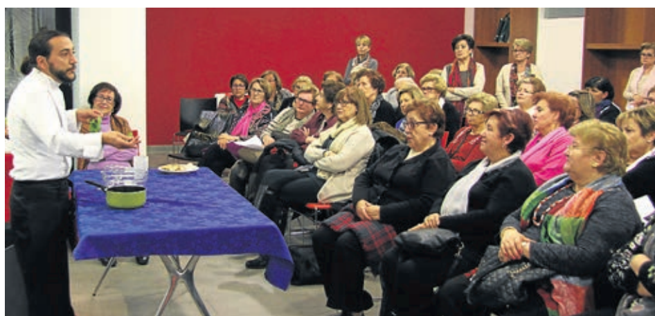
La sede de la Asociación de Amas de Casa acogió un taller de cocina para elaborar platos navideños.