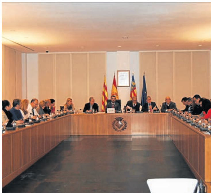
Tots els regidors van donar suport a aquesta eina de futur per a la ciutat.

A partir d'aquesta anàlisi, l'estratègia DUSI estableix reptes i zones d'actuació prioritària per a complir els objectius marcats per la UE: la protecció de l'entorn i eficiència de recursos, la millora de l'accés a les tecnologies de la informació, la lluita contra l'exclusió social i els nous models econòmics. Per a aconseguir aquests objectius, l'estratègia contempla la creació d'itineraris per als vianants i el foment de l'ús de la bicicleta, la creació d'un parc d'habitatge tutelat o la regeneració de barris com Miralcamp o Melilla-Progrés.