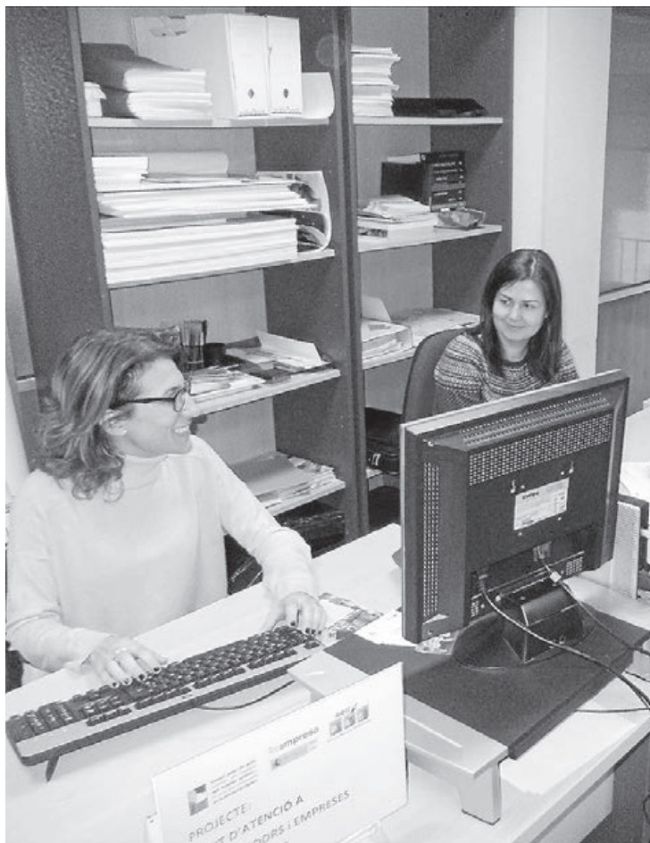
Los beneficiarios estarán de tres a seis meses desarrollando diversas tareas.

El tercer plan, EMCOLD, comporta la contratación de tres orientadores laborales desempleados para atender y confeccionar itinerarios laborales personalizados a un total de 360 parados de larga duración de Vila-real du-