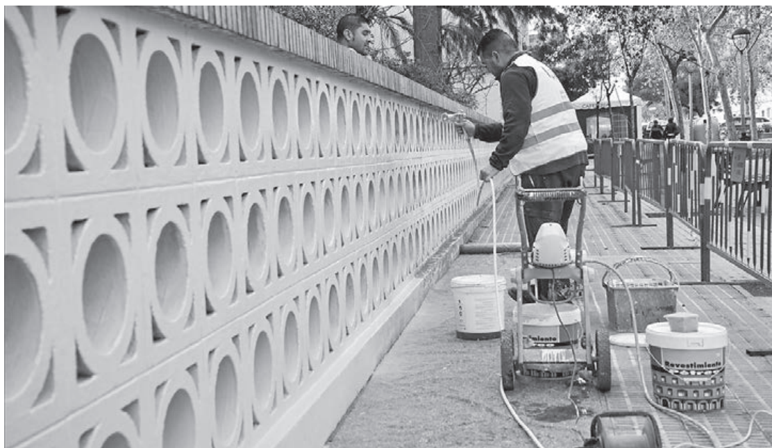
La millora de les tanques perimetrals, la pintura d'algunes parets i elements o la reparació dels banys, part de les obres.

■ Més de 3.000 alumnes i alumnes d'infantil, primària i secundària dels centres docents de Vila-real han participat en els 20 tallers de Recicla amb els 5 sentits, un projecte de la Conselleria d'Agricultura, Medi Ambient, Canvi Climàtic i Desenvolupament Rural de la Generalitat Valenciana, que ha comptat amb la col·laboració de l'Ajuntament. Els tallers s'han impartit als CEIP José Soriano, Escultor Ortells, Cervantes, Concepció Arenal, Carles Sarthou, Pasqual Nácher, Pintor Gimeno Barón, Angelina Abad, Pius XII, i en els col·legis Ntra. Sra. de la Consolació i Fundació Flors. A més, s'han impartit tallers de Risoteràpia i Excuses per a no reciclar a grups de professorat de diferents centres, amb una participació d'unes 30 persones. El programa compta amb la participació dels Sistemes Integrats de Gestió de residus: Ecoembes, Ecovidrio, Fundació EcoRae's, Ambilamp, Fundació Ecotic, Fundació Ecoléc, Ecoasimelec, Ecofimática, Ecolum, European Recycling Platform, Tragamóvil i Sigre.