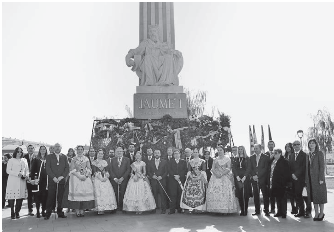
La ciutat retrà homenatge als seus orígens al febrer i inclourà l'acte d'homenatge a la cort d'honor de les festes.