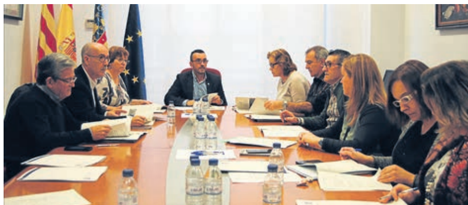
Els representants de les diferents administracions es van reunir a la sala de comissions.

Benloch recorda que l'Ajuntament, a través de la Regidoria de Serveis Socials, va desemborsar 12.000 euros a l'inici del curs per a pagar els llibres a alumnes que no podien fer front a la seua adquisició. Aquests materials s'incorporen també al banc de llibres creat per la Generalitat, que gestionen directament els centres educatius.