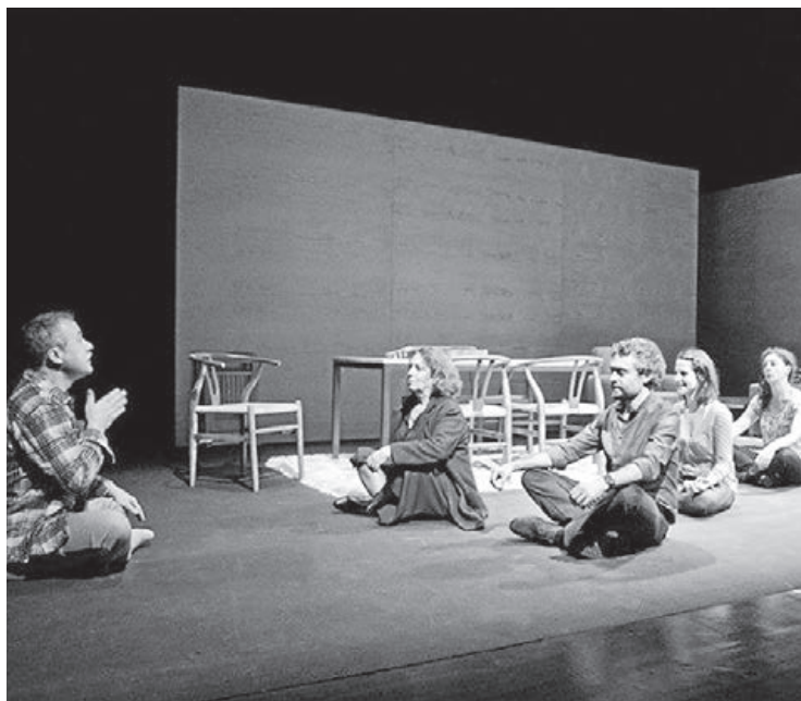
'La respiración' arribarà el mes d'abril a l'Auditori dins de l'abonament.

Tampoc faltarà la cita amb el cicle de música emergent Auditiva amb actuacions a la sala Japan. Aquest inici d'any estaran presents bandes valencianes però també d'altres punts de la geo-