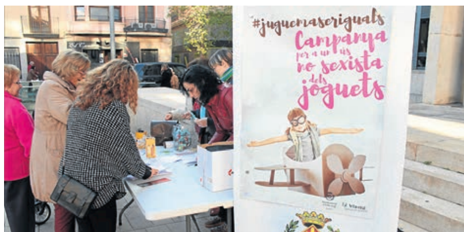
Igualdad ha promovido la campaña por un uso no sexista de los juguetes con varias actividades.