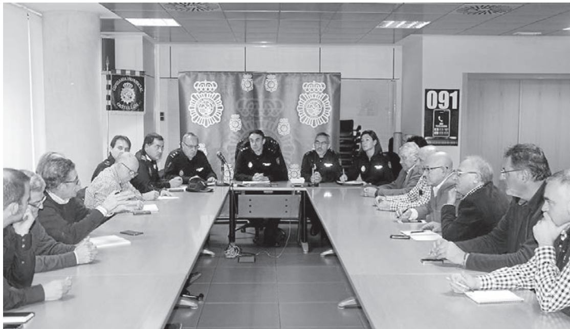
La reunión, celebrada en Castellón, abordó la necesidad de inspeccionar las viviendas rurales ocupadas ilegalmente.