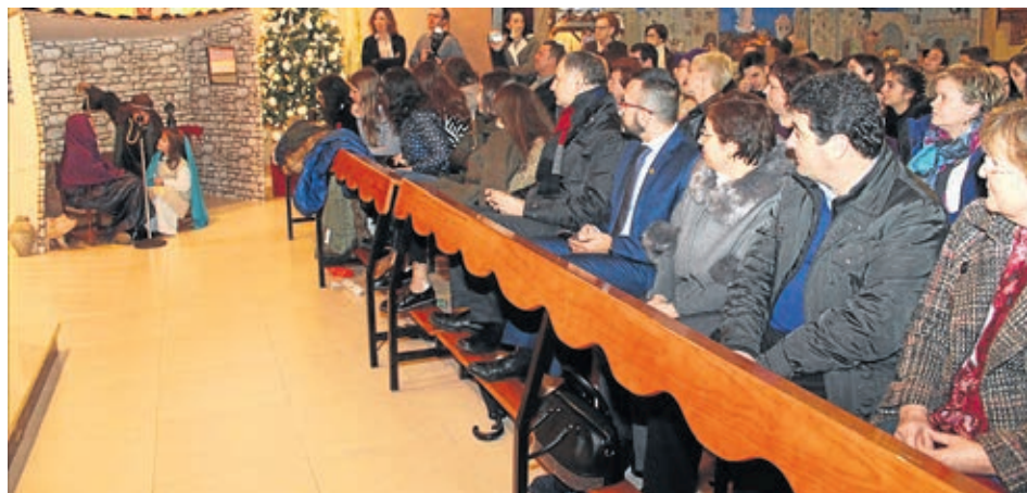
La iglesia de Santa Isabel acogió el belén viviente que no pudo realizarse en la calle por las lluvias.