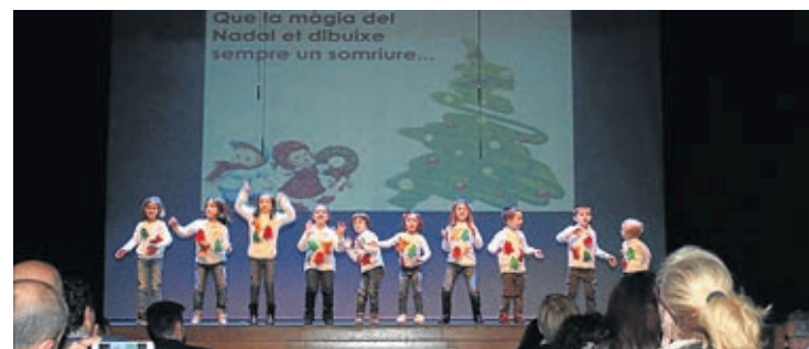
Desde Joventut Antoniana también organizaron el ya arraigado Pregón.