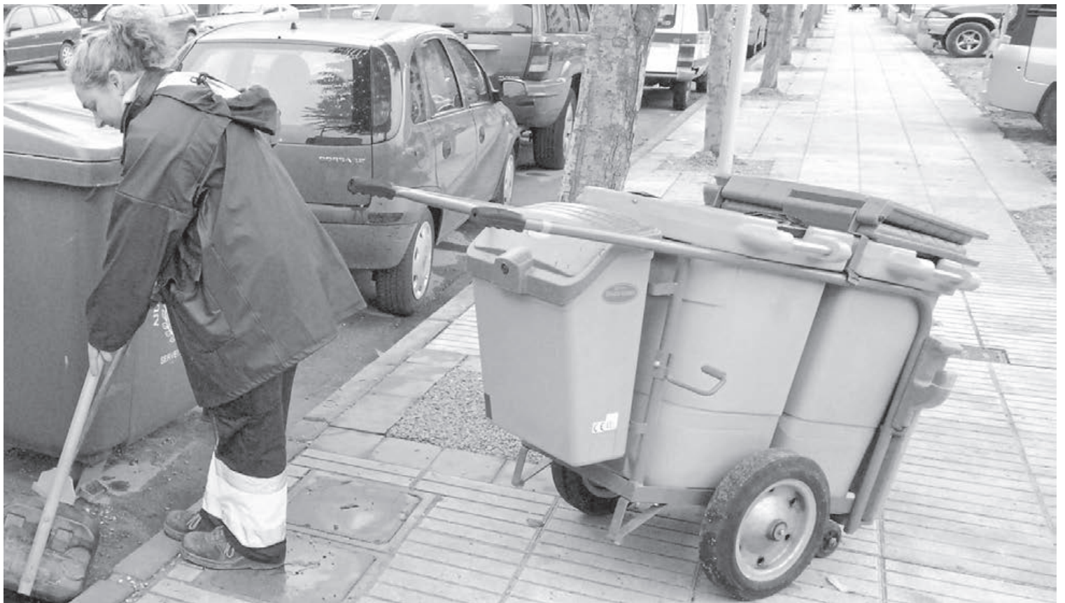
La partida de neteja viària s'incrementarà el màxim legal possible, fins al milió d'euros, per a atendre les reivindicacions de la ciutadania en aquesta matèria.

Tot això, amb el nou escenari de la col·laboració d'administracions com la Generalitat i la Diputació,