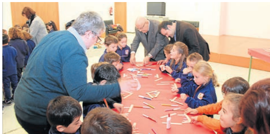
Los más jóvenes también fueron los protagonistas de los talleres sobre las tradiciones navideñas.