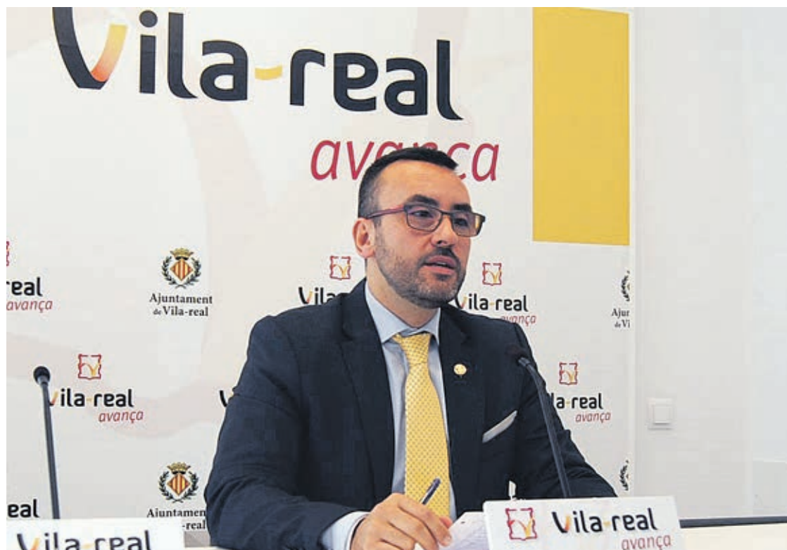
El alcalde explica las gestiones realizadas para bloquear los elementos que ponen en riesgo la viabilidad de la ciudad.