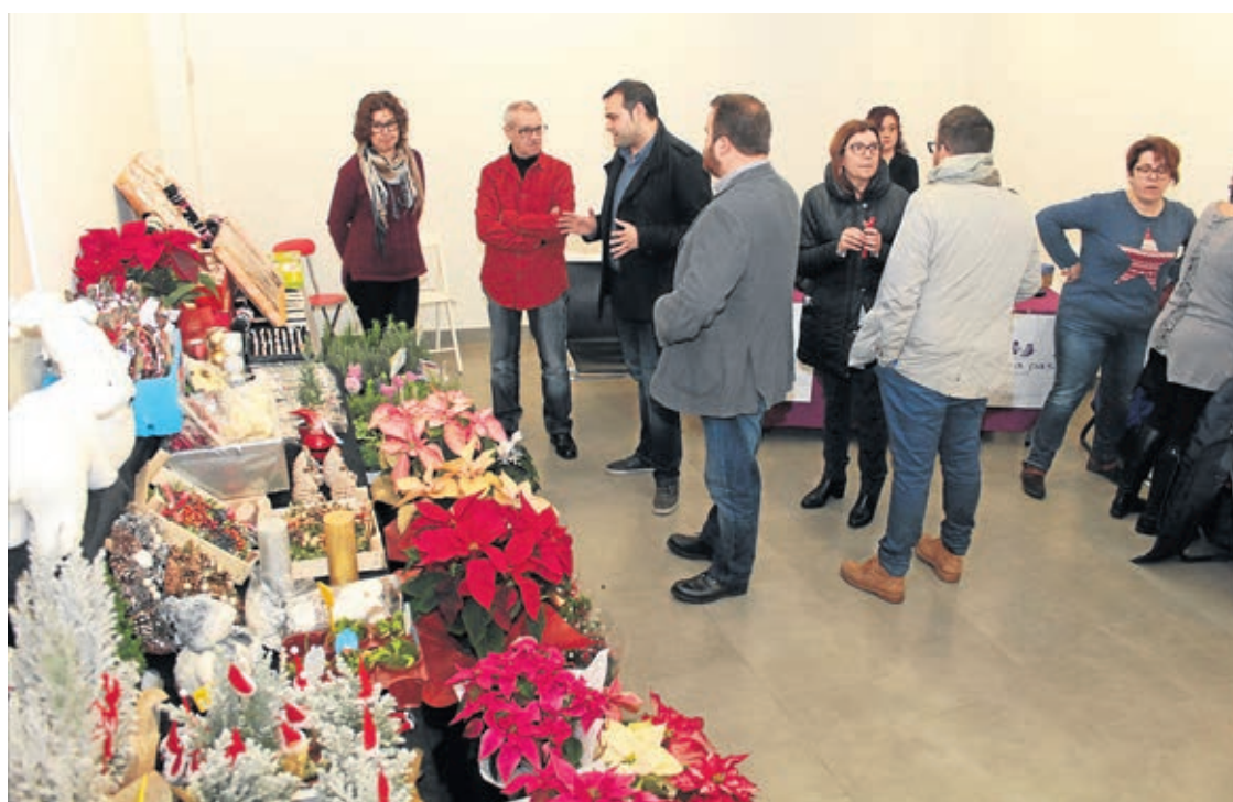
La feria que organizó UCOVI se trasladó a las salas de exposiciones de Fundació Caixa Rural a causa de las precipitaciones.