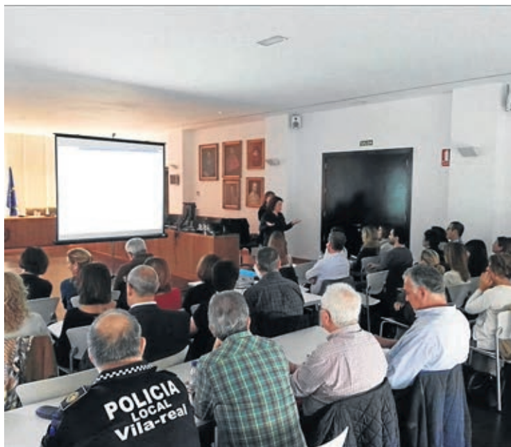
El personal de todas las áreas municipales ha recibido formación específica.

Para poder implantar el expediente electrónico, el departamento de Nuevas Tecnologías, en colaboración con una empresa especializada, ha realizado una formación específica durante varias semanas a personal de todas las áreas municipales sobre los nuevos protocolos de gestión de los expedientes. Más de 150