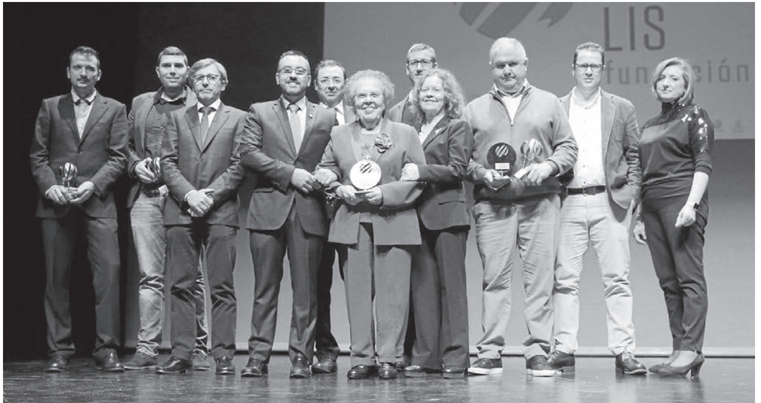
L'Auditori Municipal Músic Rafael Beltrán Moner va acollir la celebració del IV Fòrum d'Innovació impulsat per Globalis i que va servir per a entregar els premis.

En aquesta edició, des de la Fundació Globalis van agrair la tasca realitzada pels patrocinadors ja que «sense ells, no seria possible aquest projecte». Les empreses patrocinadores han