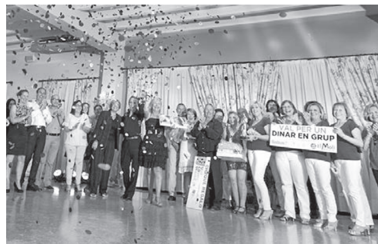
Los participantes mostraron sus dotes de baile en diferentes categorías.

El Soledat Meneitos Grup, formado por vecinas del barrio de La Soledat, ha sido el ganador en la categoría de baile en grupo.