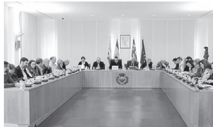
La aprobación tiene la intención de reducir al máximo la deuda municipal.

El Ayuntamiento ha aprobado el pago de 241.565 euros más en facturas a proveedores. Una medida que contribuye a seguir avanzando en el camino iniciado por el equipo de gobierno de liquidar cualquier adeudo con las empresas locales y de cumplir con el principio de puntualidad en el pago.