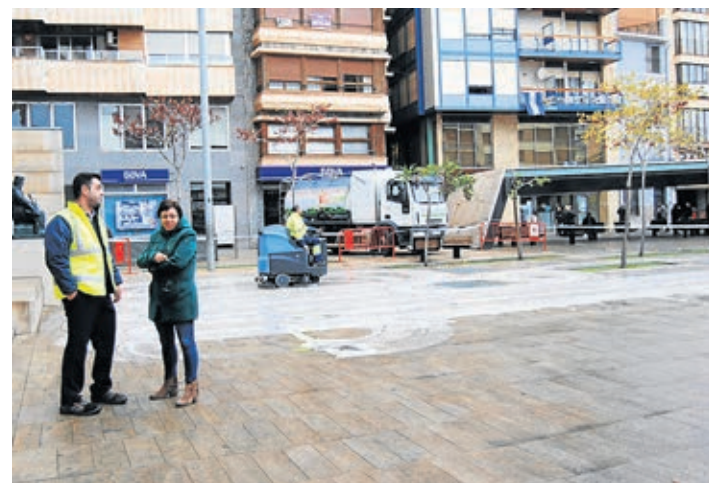
La plaza Mayor ha sido, durante varios días, una de las zonas de actuación.