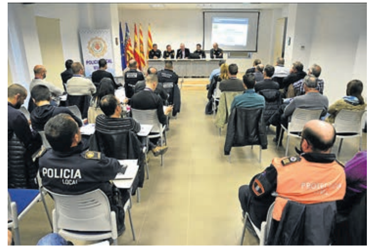
La Prefectura va acollir una sessió respecte a l'actuació en esdeveniments.