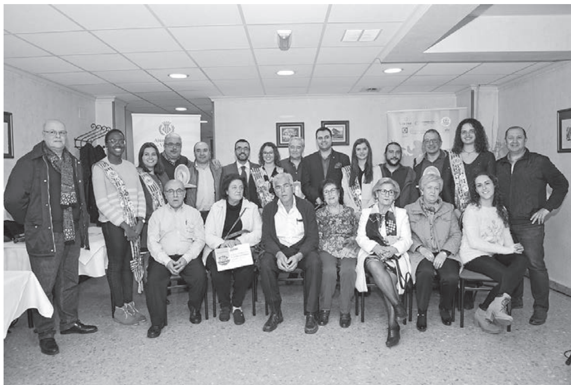
La clausura de las jornadas gastronómicas contó con representantes municipales y la reina y damas de las fiestas.