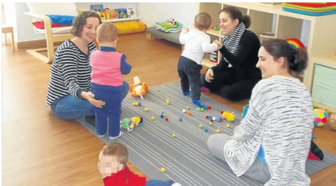
Los más pequeños pueden disfrutar del juego con sus padres, que comparten experiencias y dudas sobre la crianza.

Las sesiones, comenta Arenós, tienen una duración aproximada de una hora y media. En la pri-