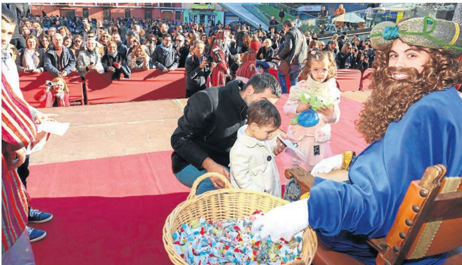
La llegada de los mensajeros reales, gracias a la organización de Joventut Antoniana, atrajo a miles de persona a la plaza Mayor el día 26 de diciembre.

A estas dos iniciativas de animación comercial se sumó la Feria de Navidad, que a causa de las lluvias ocupó las salas de exposiciones de la Fundació Caixa Rural y en la que comercios de la ciudad ofrecieron su selección de productos para estas fechas. La programación incluyó también un sorteo que «responde a una campaña de fidelización para que los vila-realenses se queden aquí a la hora de hacer sus compras», señala Arrufat. Y es que los