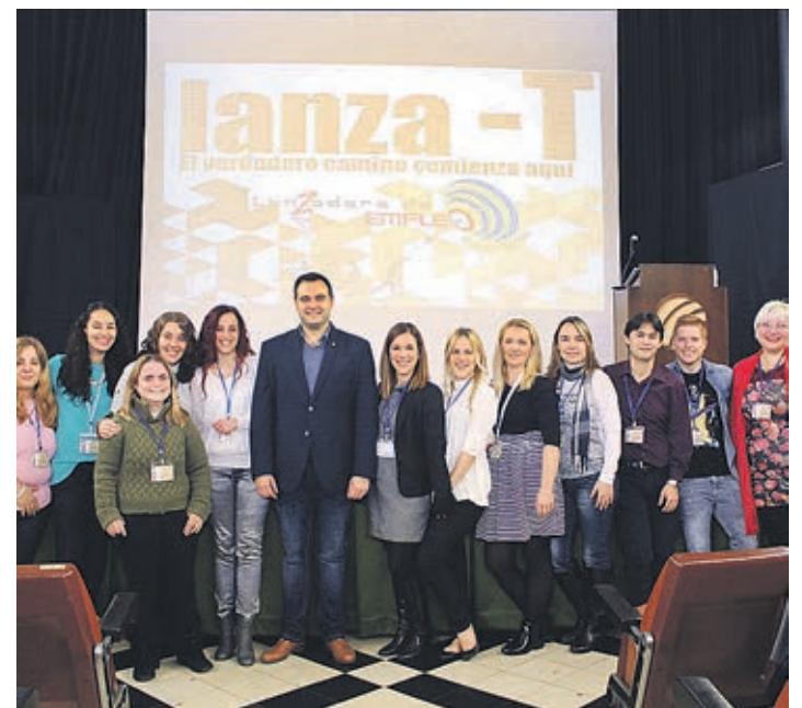
El salón de actos de Caixa Rural acogió el acto de clausura de la Lanzadera.

El equipo de gobierno ha acelerado los pasos para solucionar el problema de los aprovechamientos urbanísticos reservados en los años de gobierno del PP y «taponar» el riesgo de 231 millones de euros por lo que se ha remitido el documento a la Conselleria de Vivienda, Obras Públicas y Vertebración del Territorio para agilizar al máximo su tramitación. «Esta modificación del plan es la única solución sería, posible y realista al desastre de gestión del PP», aseguran desde el gobierno.