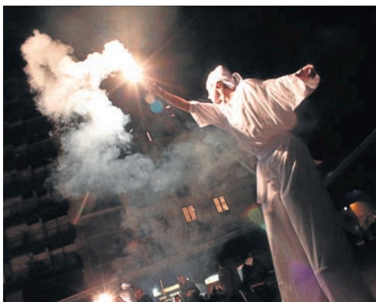
La animación de estas navidades estuvo a cargo de la compañía La Fam.

clientes de los comercios locales pudieron optar a un premio cercano a los 1.500 euros.