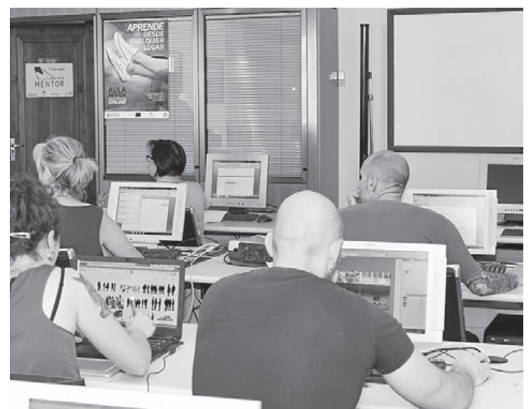
El programa Aula Mentor, que s'ofereix amb Caixa Rural, es reforça enguany.

■ L'Ajuntament rebrà més de 800.000 euros d'aportacions de la Generalitat i la Diputació