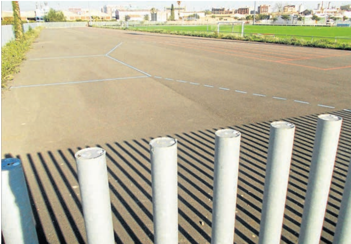
La CEM ocupa un espai proper als 59.000 m 2 i s'espera que aquesta primavera pugui tenir un espai d'atletisme.