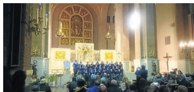
La coral Sant Jaume organizó, un año más, un festival con varias formaciones.