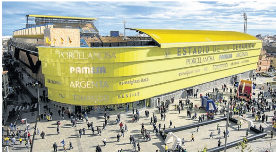
Els canvis també permetran guanyar espai a l'interior del recinte amb la idea de situar un museu del Villarreal CF.