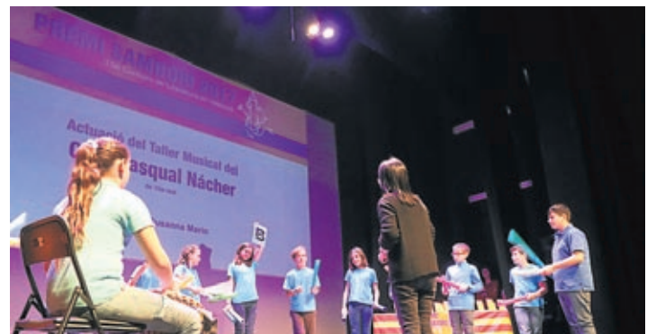
L'Auditori va acollir dues gales consecutives amb les diferents etapes.