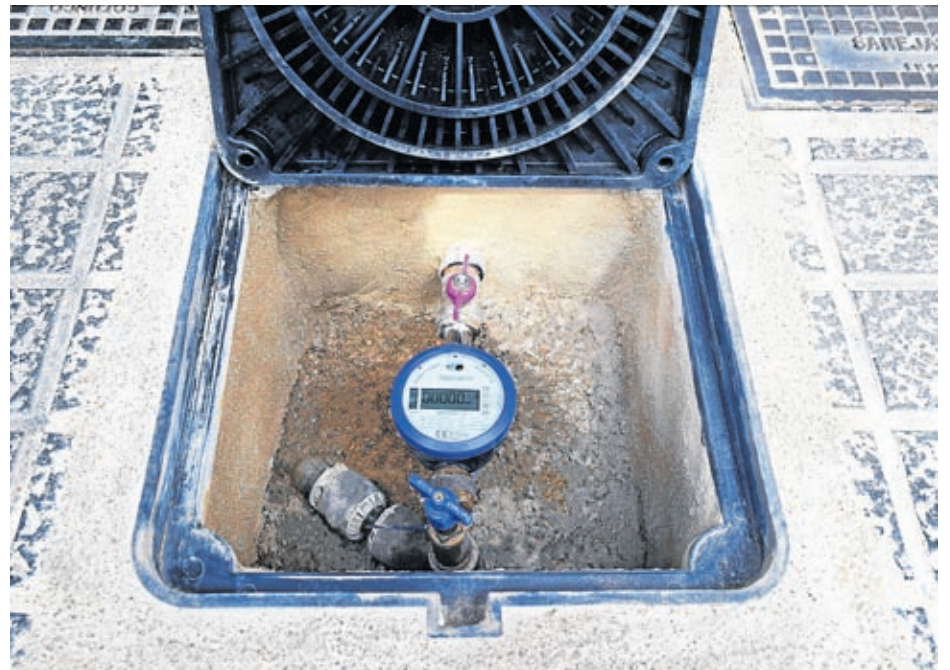
Imagen de un contador inteligente instalado por la concesionaria en una acometida particular.