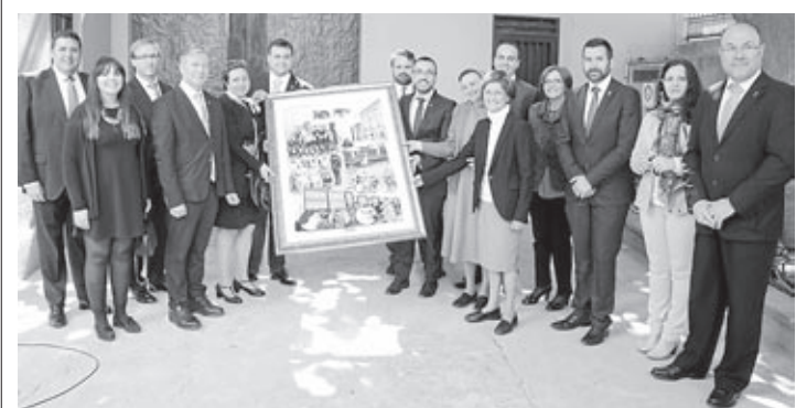
Parte de la corporación municipal participó en los actos organizados.