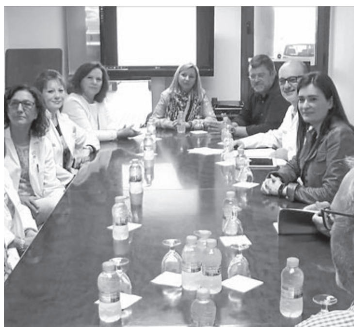
La consellera presentó el Plan de dignificación de infraestructuras sanitarias.

miento estamos trabajando de la mano para adoptar la mejor solución para el centro de Torrehermosa», comenta la concejal. «Para ello, se está trabajando en el estudio de necesidades sanitarias de Vila-real, para que cualquier decisión que se tome al respecto esté basada en criterios objetivos, con la única finalidad de garantizar la mejor atención y cobertura sanitaria para todas las personas, tanto en Vila-real como también en los municipios de nuestro entorno», señala la titular municipal de Sanidad.