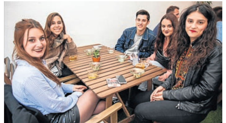
Grups de totes les edats recorren els diferents establiments de la Ruta.

Vila-real està immersa en l'onzena Ruta de la Tapa, la més veterana de la província, que torna per a oferir els millors aperitius en 28 locals.