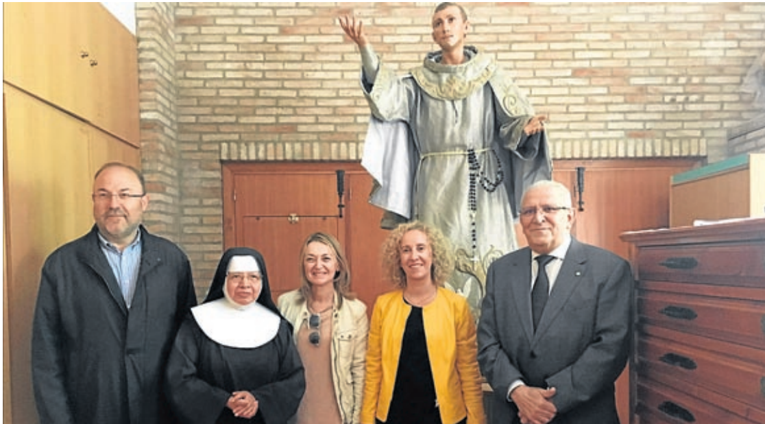
Les responsables de la restauració i els regidors van acudir a la basílica per a conèixer de primera mà els treballs fets