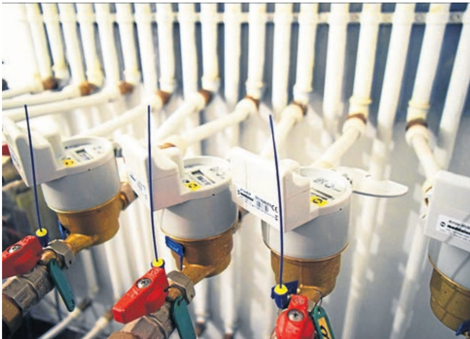
Imagen de contadores inteligentes instalados en batería como parte del proyecto piloto.