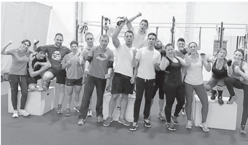
Algunos de los usuarios de este espacio deportivo que propone numerosas disciplinas.