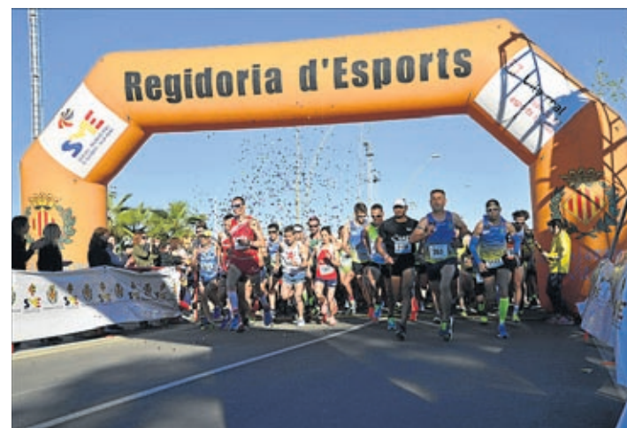
La cursa va tenir el punt d'eixida i arribada a la Ciutat Municipal Esportiva.