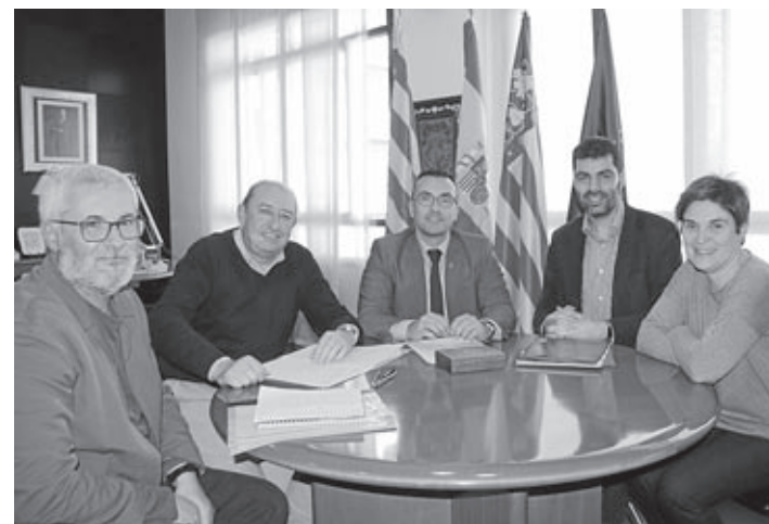
Los representantes de la entidad y los responsables municipales en la cita.

El desempleo juvenil se sitúa en Vila-real en un 16,10%, por debajo de la media española y de la provincia de Castellón.