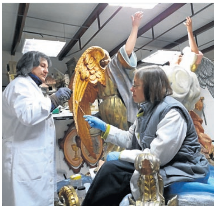
Els treballs de la carrossa continuen a les instal·lacions de la basílica del sant.

L'actuació s'ha finançat a parts iguals entre l'Ajuntament i la Generalitat, que han aportat 8.500 euros cadascuna, a més de 900 euros de costos imprevistos assumits pel consistori. «La col·laboració entre administra-