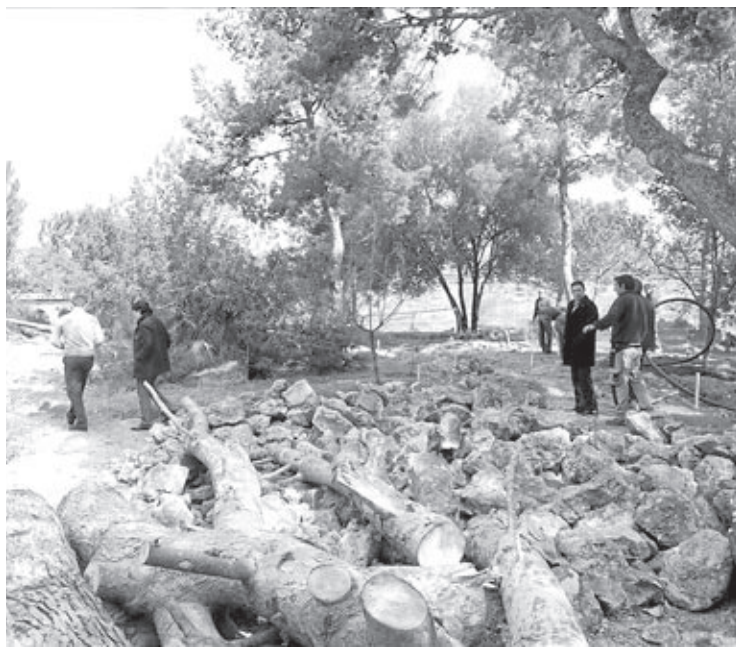
La Generalitat lanzó T'avalem como relevo de las antiguas Escuelas Taller.

El objetivo es redefinir la iniciativa local para que, en combinación con el Plan de Garantía Juvenil, pueda llegar a unas 30 o