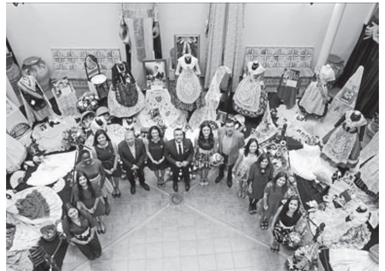
Uno de los actos previos es el manifiesto con los vestidos de la corte de honor.

Tampoco faltarán actos ya arraigados a los festejos locales como el macrosopar de vecinos, la cabalgata, el concurso de paelas o la 'nit de xulla'.