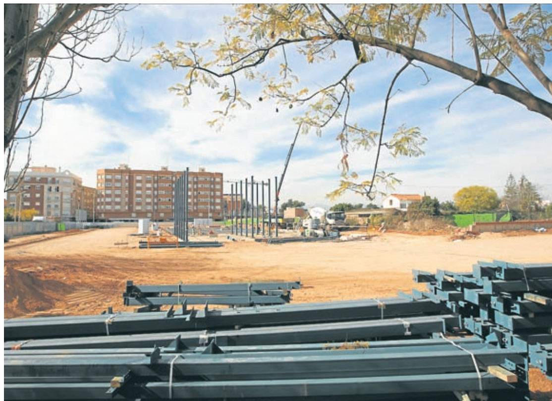
El centre educatiu es va construir en un terreny dividit en tres parcel·les i un dels titulars no va voler cap tipus d'acord.

No obstant açò, Benlloch explica que tant el propietari com