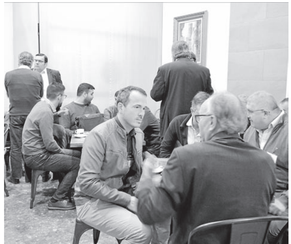
La campaña vinculada con la tecnología ha sido impulsada por la Fundación Globalis.

Son reuniones para presentar a emprendedores y empresarios de éxito