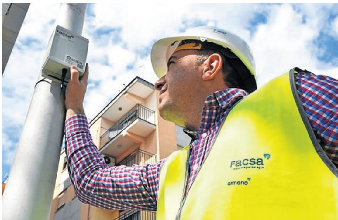
Uno de los técnicos en el momento de la instalación de los concentradores del novedoso servicio de telelectura.

Los trabajos, que comenzaron a finales de marzo, consisten en la sustitución de 632 contadores por dispositivos inteligentes de lectura remota. Un sistema que, entre otras ventajas, además de evitar el acceso a las viviendas para obtener las lecturas, permite obtener datos de consumo en tiempo real, de manera que mejorará la facturación y, sobre todo, «existirá un mayor control del consumo por parte del usuario, que podrá activarse alarmas generales o personalizadas para detectar cualquier anomalía», según explica el concejal de Servi-