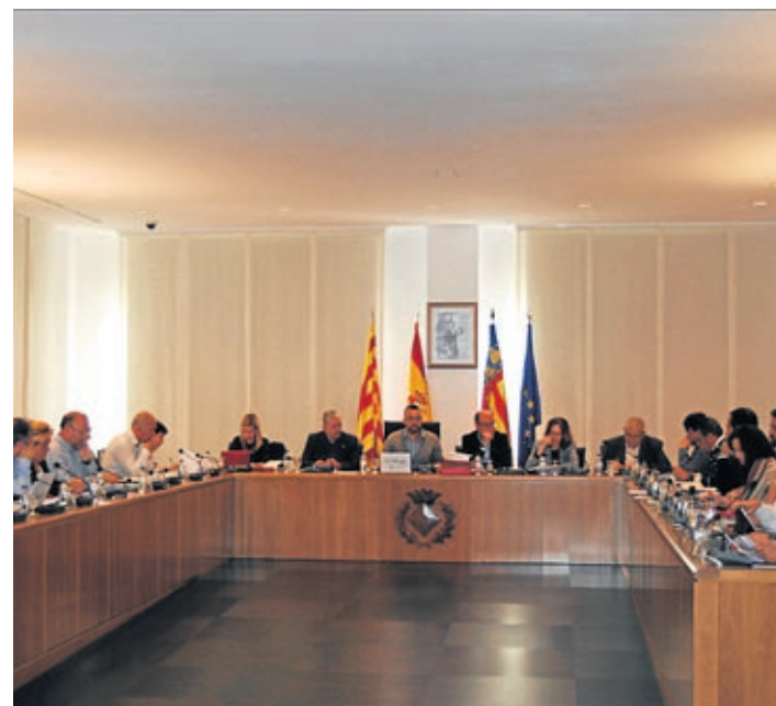
Imatge de la sessió plenària ordinària corresponent al mes d'abril.

El màxim responsable municipal agraeix a tots els funcionaris municipals «l'enorme esforç que han realitzat en els últims anys, en els quals hem comptat amb menys plantilla i, malgrat açò, han pogut sostenir uns serveis i atenció de qualitat».