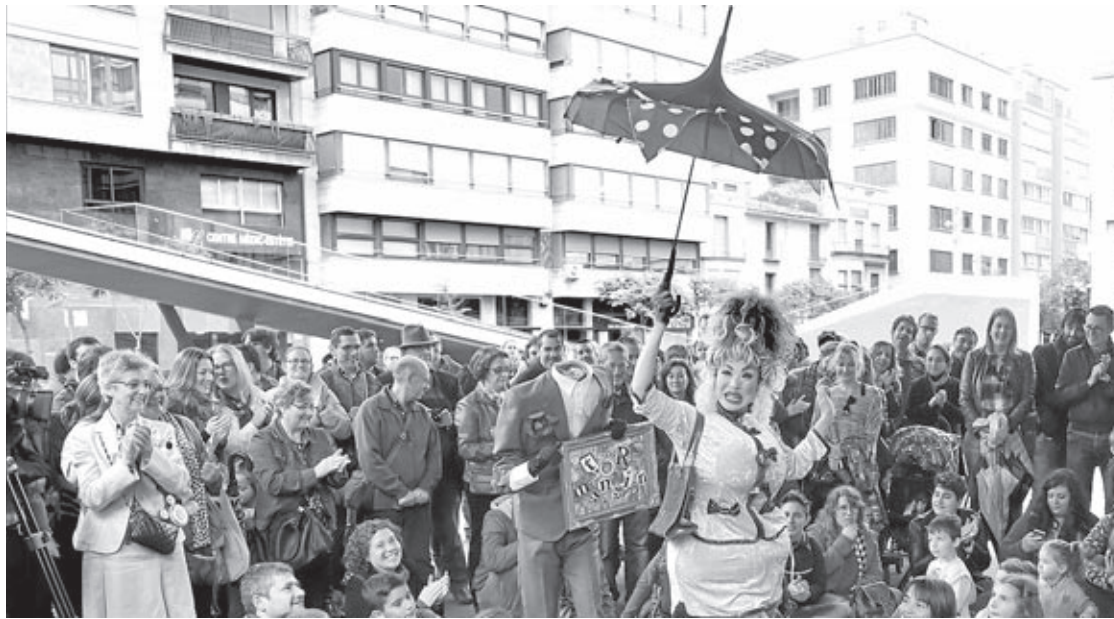
El FitCarrer, entre els dies 4 i 7 de maig, és un dels esdeveniments més destacats de l'agenda cultural de la ciutat.

L'actuació del Grup de Danses El Raval; la mostra de Pascual Canós Cotelí, la XX Nit de Ronda i la re-