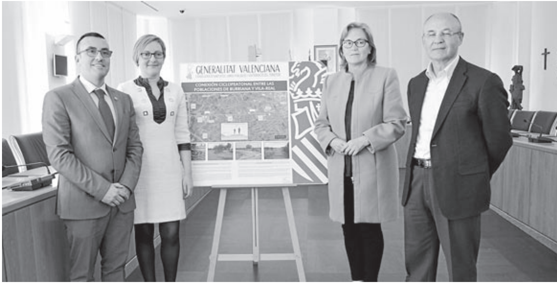
Representantes autonómico y de ambos consistorios se dieron cita en el municipio para presentar el proyecto.