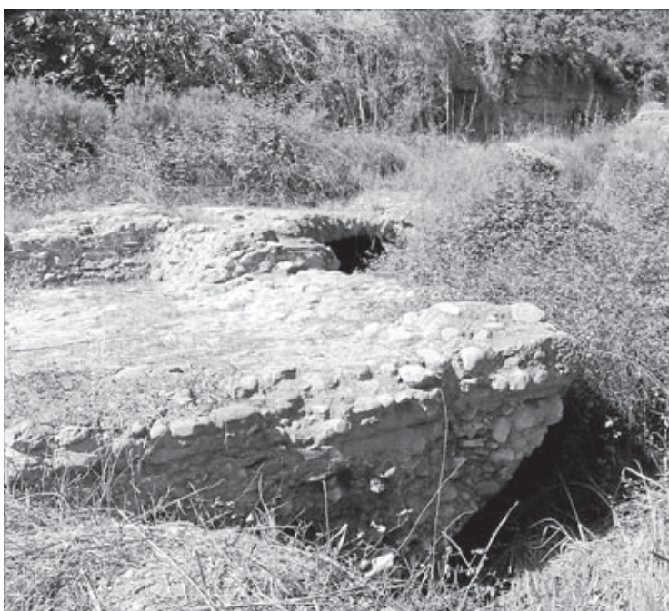
Els Corrents está en la actualidad prácticamente cubierto por cañas y zarzas.

Ochando ha animado a los vecinos a participar, inscribiéndose de manera gratuita en la página web 'http://economia.vila-real.es'.