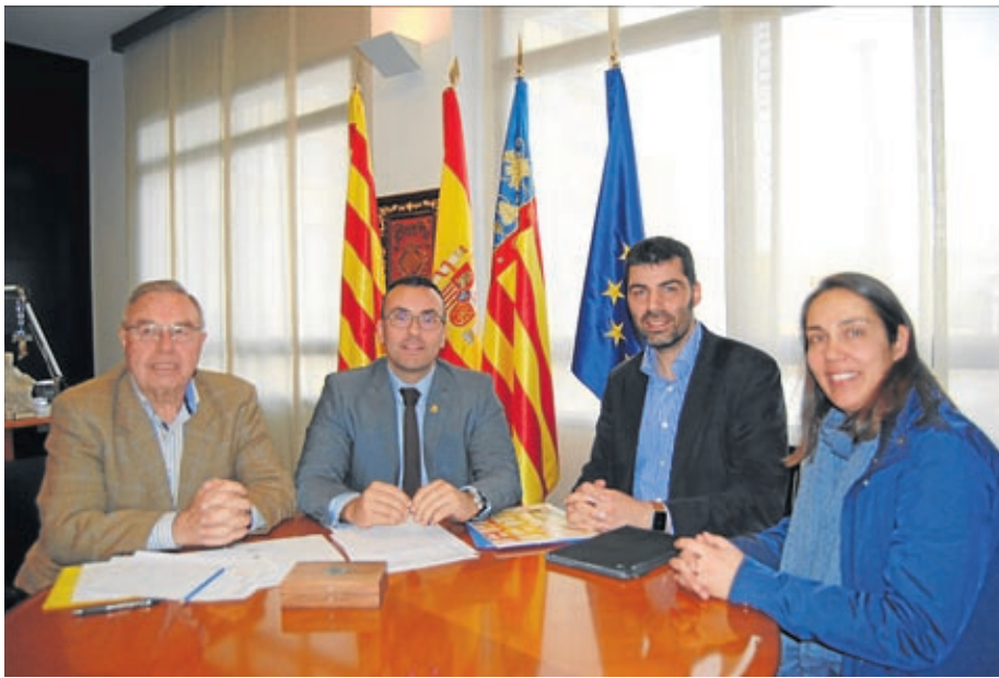
Representantes municipales y de la entidad social y religiosa en un momento de la reunión.