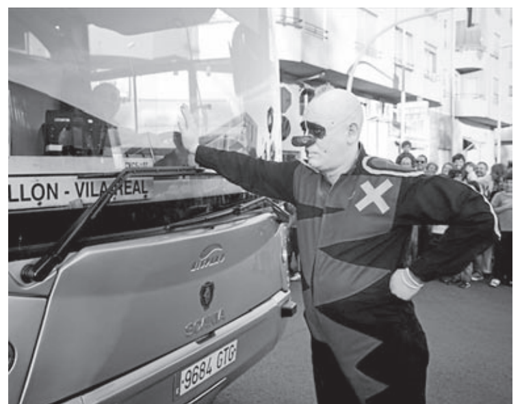
Un dels espectacles de la 25a edició al web 'www.teatrecarrervila-real.com'.

participació dels alumnes de l'Escola Superior d'Art i Tecnologia (ESAT) de València així com els de les escoles municipals de dansa i teatre així com la presència de 22 companyies, entre les quals es troben sis de la Comunitat Valenciana, tres de les quals (Visitants, A Tempo Dansa y Nafra) són de Vila-real, i la resta d'altres punts del globus terraqüi, que actuaran en espais com