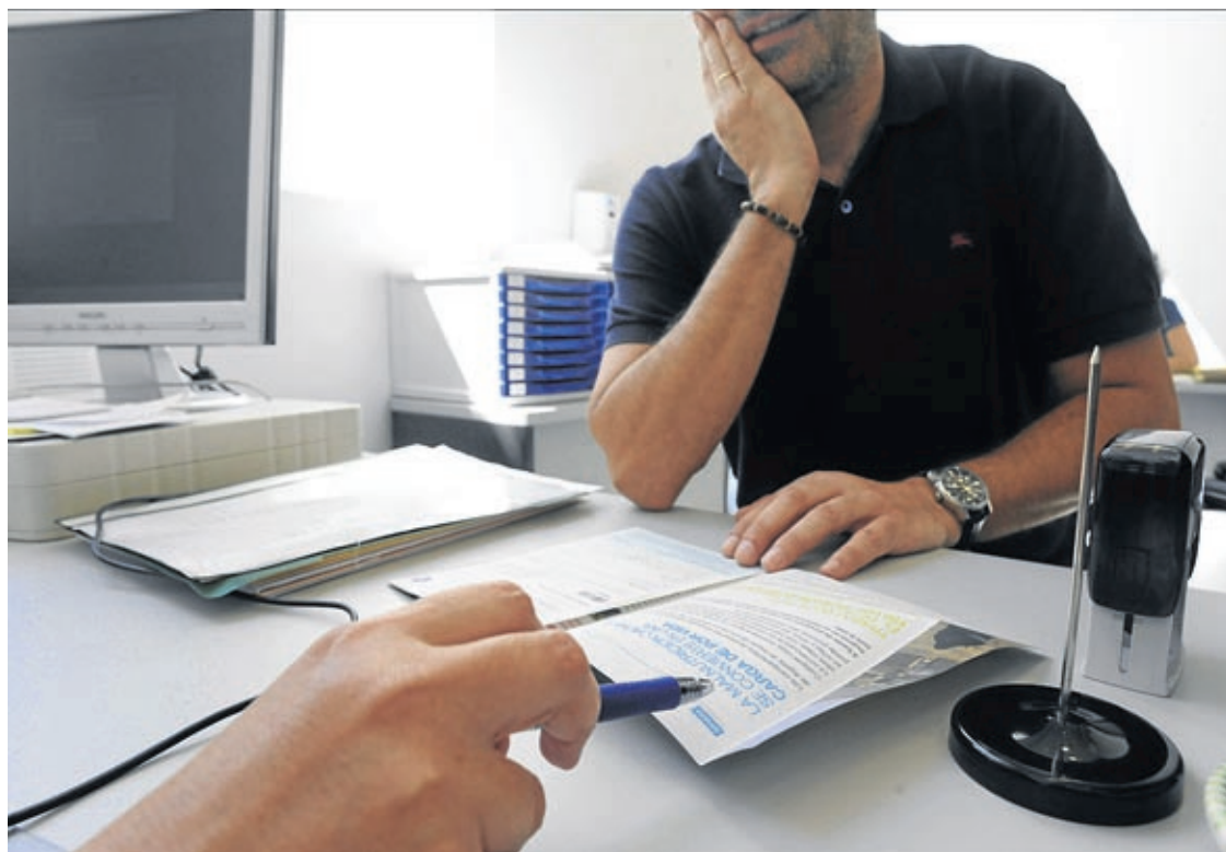
El consistori ha pogut crear enguany quatre places, dues de tècnics d'Administració General i dues per a Serveis Socials.