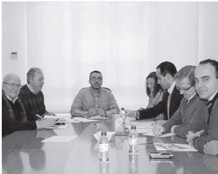
La Junta de Portavoces inició el proceso de la concesión de estas distinciones.

La Medalla de Oro servirá también para reconocer a otra entidad centenaria en la ciudad, la Agrupación Coral Els XIII, nacida en el año 1915 y clave en la importante tradición teatral en la ciudad. Un siglo de vida que la entidad celebró con diversas actividades como una misa en la basílica de San Pascual, la instalación de una plaza conmemorativa en el el pasaje Mossèn Seraffi