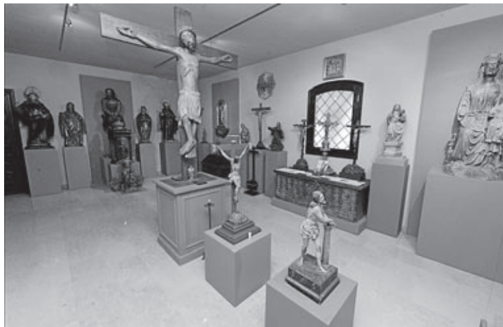
Una mostra sobre sant Pasqual i Llorens Poy serà una de les novetats.

presentació de 'D'anada i tornada' i 'Draps bruts' dels alumnes de l'Escola Municipal de Dansa completen la programació del mes.