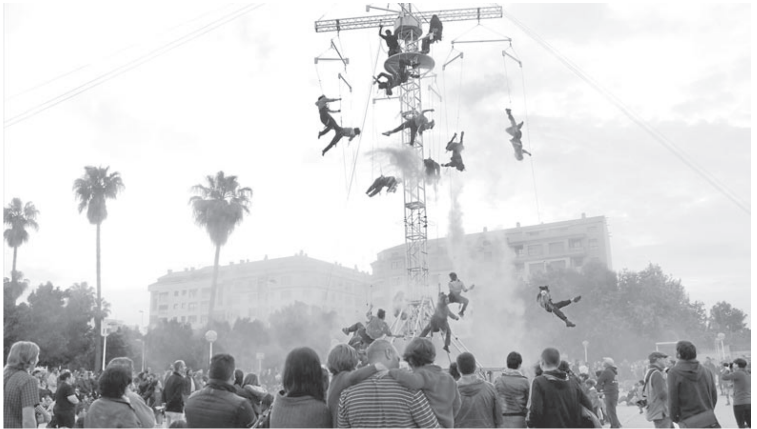
Enguany està previst un nou espectacle aeri, una cita que es va programar en edicions anteriors com l'espectacle 'Eterfeel' que va arribar a la Maiorasga el 2016.