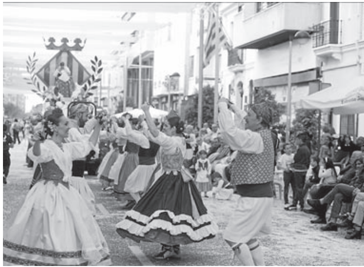
Los festejos acogen citas multitudinarias tanto lúdicas como gastronómicas.

Seis toros de la ganadería de Torrehandilla protagonizarán el sábado 13, a las 10.00 horas, el encierro de cerriles con el que arrancará la programación taurina. Cinco de estos astados se