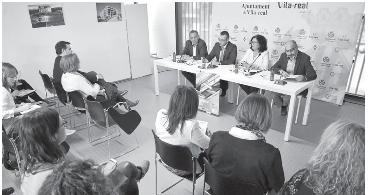
Responsables d'Educació d'àmbit nacional i autonòmic van estar a la localitat per a mostrar l'aposta per aquest tipus de formació proposada per Vila-real.

Aquestes quatre àrees sorgeixen de les necessitats detectades a través d'una taula de formació professional, creada en el marc de la xarxa de Ciutats Educadores, amb participació de centres d'FP de la ciutat, Efecte Vila-real i la Regidoria d'Educació. Els cursos tindran una periodicitat