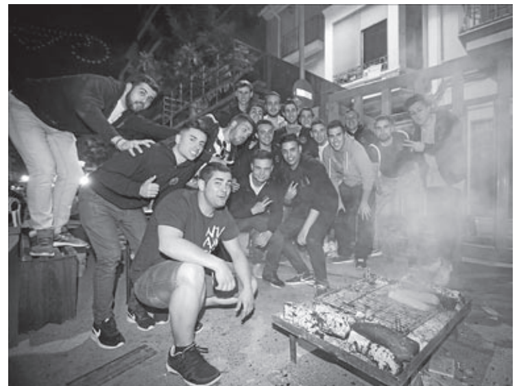
La tradicional nit de xulla envuelve a la ciudad con un ambiente único.