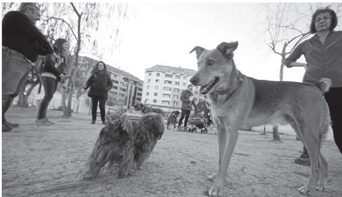
El nuevo contrato prima la adopción o el retorno de los animales a su hogar y relega la muerte como última opción.

«La Agencia Valenciana de Turismo tiene la intención de ramificarse por todo el territorio valenciano para interceptar talento y multiplicarlo, como ocurrirá en Vila-real», señala el secretario autonómico. El alcalde ha agradecido poder desarrollar este programa pionero en Vila-real. «En los últimos años, hemos venido trabajando mucho, de la mano de la sociedad civil, en canalizar el talento local y asentar las bases de un modelo de ciudad innovador en el que este programa pionero encaja a la perfección». «Un modelo», apunta Benlloch, «que no sería posible sin entidades como Efecte Vila-real y Caixa Rural Vila-real».