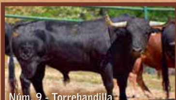
Núm. 9 - Torrehandilla GUARISME 3 - JUNTA DE FESTES - ENCIERRO