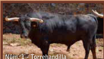
Núm. 1 - Torrehandilla GUARISME 3 - JUNTA DE FESTES - ENCIERRO