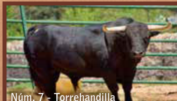
Núm. 7 - Torrehandilla GUARISME 3 - JUNTA DE FESTES - ENCIERRO