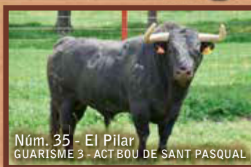
Núm. 35 - El Pilar GUARISME 3 - ACT BOU DE SANT PASQUAL