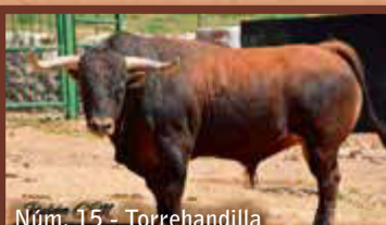
Núm. 15 - Torrehandilla GUARISME 3 - JUNTA DE FESTES - ENCIERRO