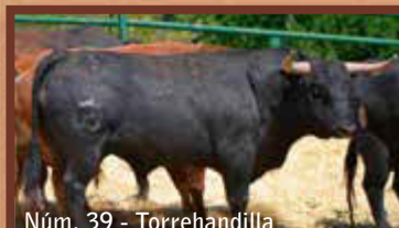
Núm. 39 - Torrehandilla GUARISME 3 - JUNTA DE FESTES - ENCIERRO