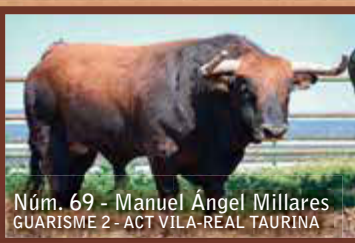
Núm. 69 - Manuel Angel Millares GUARISME 2 - ACT VILA-REAL TAURINA