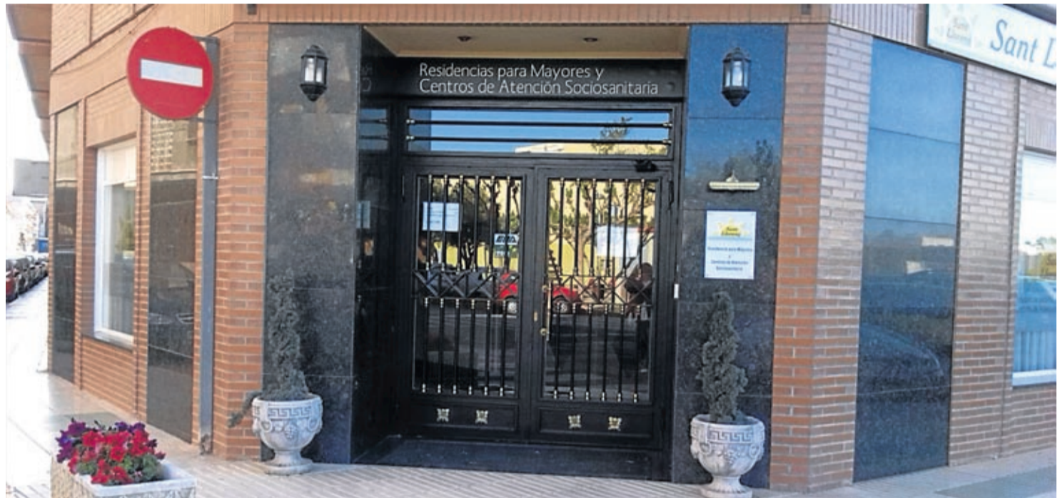
La residencia, ubicada en la avenida Penyagolosa, dispone de 105 plazas en 81 habitaciones, todas ellas individuales de las cuales 24 pueden ser compartidas.

Además, en Sant Llorenç se mima la asistencia sanitaria. Los profesionales sanitarios realizan una valoración integral de los mayores y se realizan tanto el tratamiento de patologías leves como la administración de medicamentos con la garantía de la presencia, durante las 24 horas del día, de diplomadas en Enfermería y Auxiliares. Asimismo, el centro dispone de personal formado en Fisioterapia que lleva a cabo los procesos de re-