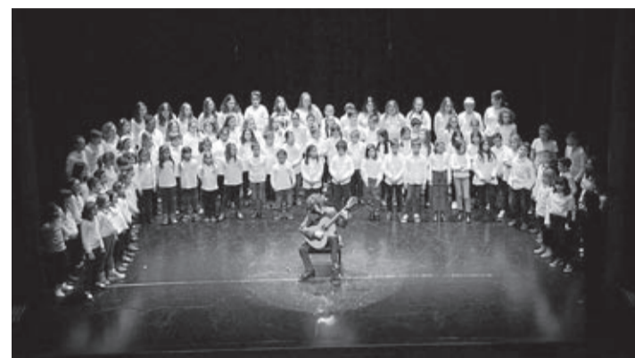
Músics de renom internacional van protagonitzar la Setmana Tàrrega.

Vila-real commemora el Mes Tàrrega, que durant els mesos de novembre i desembre programa activitats culturals per a posar en valor l'il·lustre compositor i guitarrista vila-realenc. El departament de Museus se suma a la celebració amb una activitat dirigida als centres docents de la ciutat, perquè els més xicotets coneguen la trajectòria del músic de la localitat.