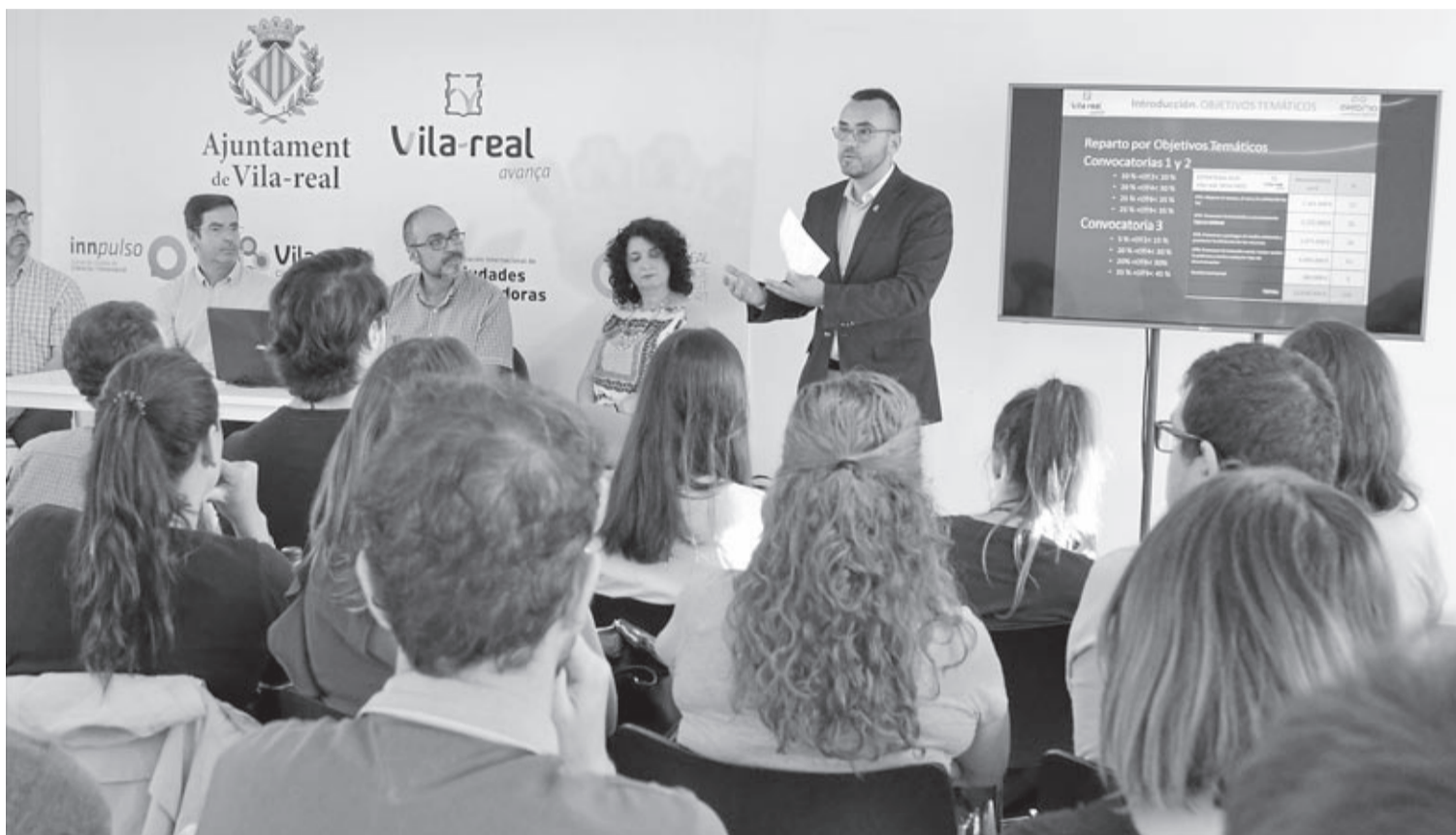
El consistori va implicar el jove talent local en l'Estratègia DUSI i va crear un equip de treball amb els 55 joves beneficiaris dels programes autònoms Avalem.

Una altra de les principals novetats de l'EDUSI és el procés participatiu que s'ha seguit per