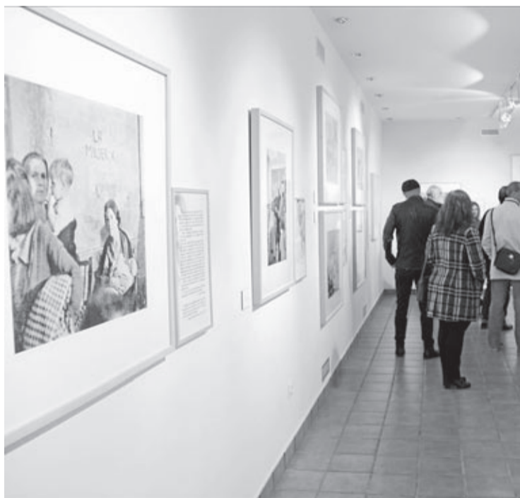
Una exposició ha tancat enguany a Vila-real el Memorial Democràtic.

«Els treballs que s'estan duent a terme a Paterna, en el conegut com a Paredón d'Espanya, no són en absolut aliens a Vila-real. Hem de recordar que, entre les més de