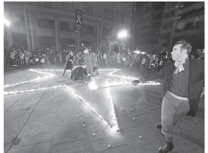
La iluminación navideña se encendió el último viernes de noviembre.

La ciudad ha dado la bienvenida a la época navideña con la tradicional 'Encesa' de la iluminación, acto que abre una programación especial que abarca todo el mes de diciembre y los primeros días del nuevo año. Ya el 1 de diciembre dio comienzo la campaña comercial de Navidad, organizada por Ucovi, en la que se sortearán 1.000 euros en premios entre quienes hagan sus compras durante todo el mes en los comercios de Vila-real.