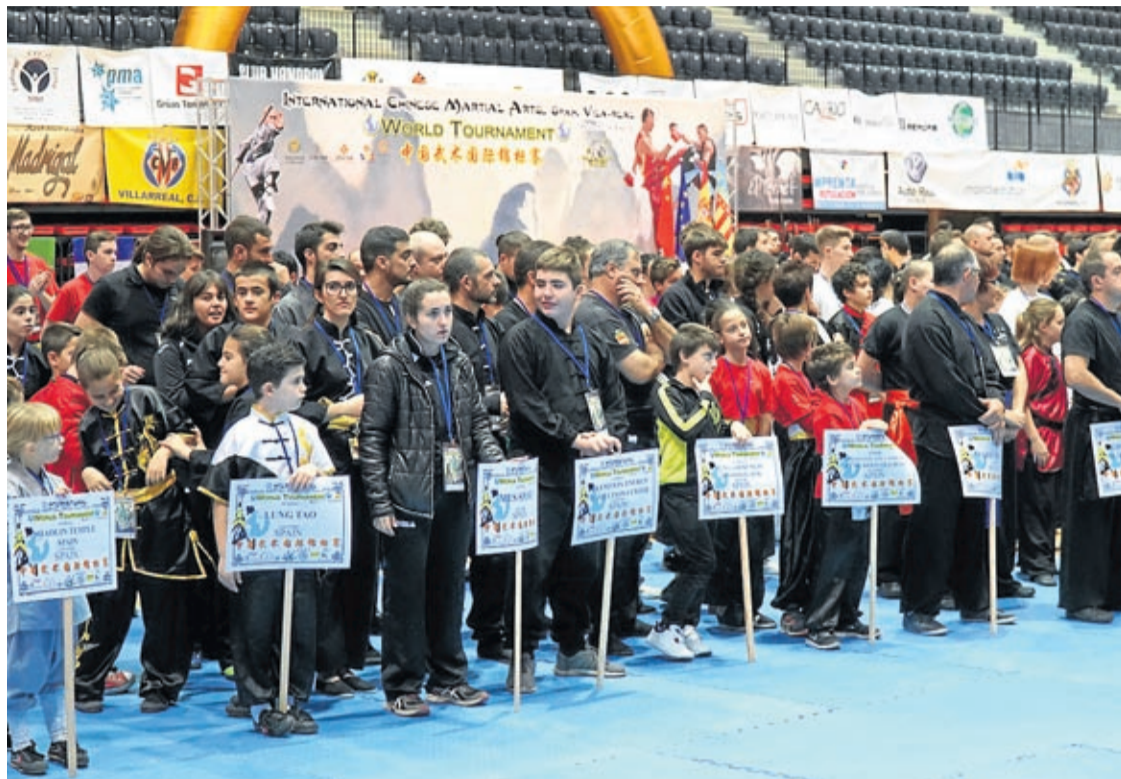
Esportistes de 42 escoles i grups d'Espanya, Alemanya, Itàlia, França i Portugal van formar part de l'esdeveniment.