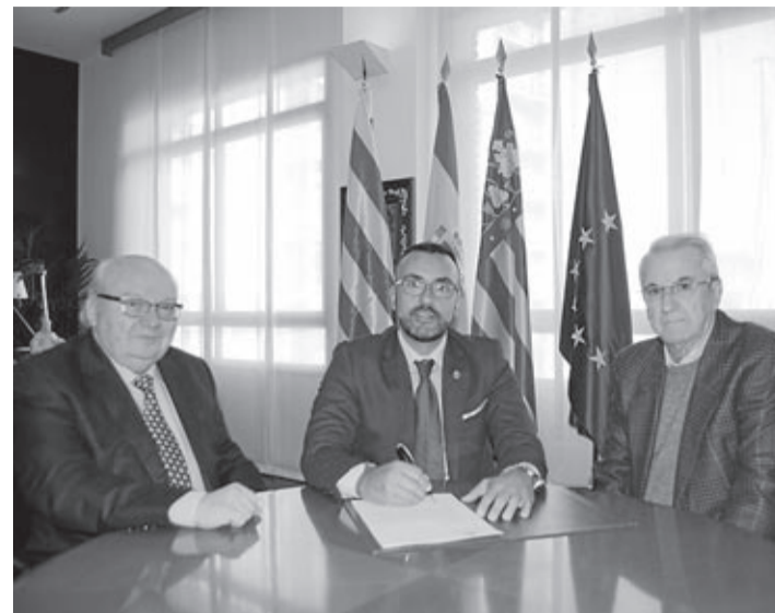
El alcalde recibió a los encargados de elaborar la música y los textos.