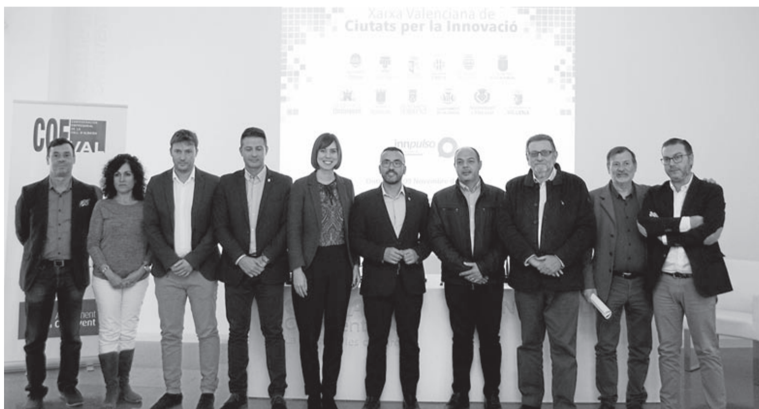
El primer edil va defensar la tasca innovadora que realitza el municipi amb col·laboració amb la societat i el teixit productiu local per a trobar noves oportunitats.

L'ens autonòmic es va constituir oficialment el darrer maig. «Des del primer moment, vam creure en la importància d'afavorir la unió entre les poblacions de la nostra Comunitat que hem fet un esforç en innovació i, per això, vam participar com a ciutat promotora en la creació de l'associació de municipis valencians de la xarxa Innpulso», va detallar l'alcalde.