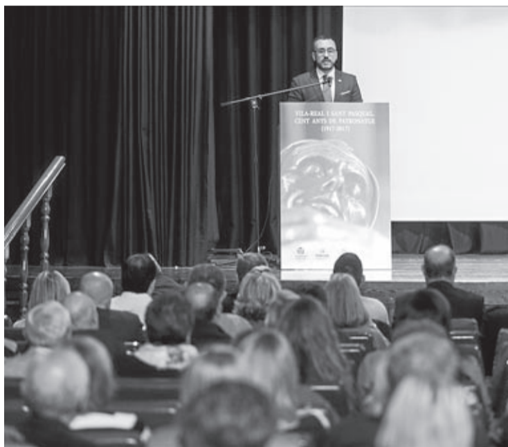
La sala de la Fundació Caixa Rural acogió el estreno de la pieza al completo.

Para grabar las entrevistas, el documental se desplaza a los paisajes y municipios en los que vivió el fraile de Torrehermosa y Alconchel a Jumilla, Elche, Monforte o Valencia, con especial énfasis en Vila-real y en la basílica y convento de San Pascual. En los 14 minutos de duración del documental, para el que se han utilizado las últimas tecnologías audiovisuales, el filme aborda cuestiones como el significado de los