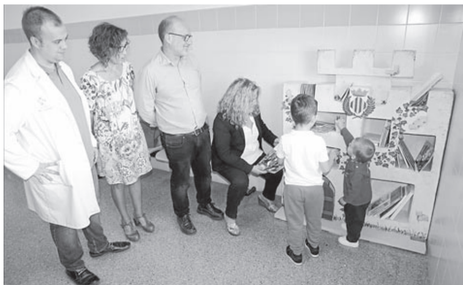
Las salas de Pediatría de Carinyena tienen ya dos estanterías con cuentos y fichas para colorear.

■ Tras la buena acogida, se prepara un tercer punto de lectura, un segundo ‘niu de llibres’ que se instalará en el jardín de Jaume I