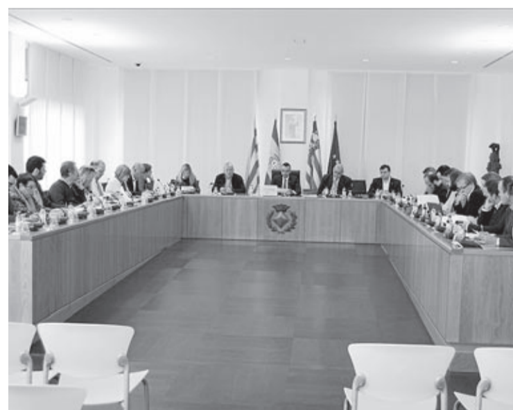
El Ple Municipal va aprovar la concurrència a la tercera convocatòria.

únic, que diferencia Vila-real del que s'està fent en altres punts», conclou l'alcalde.