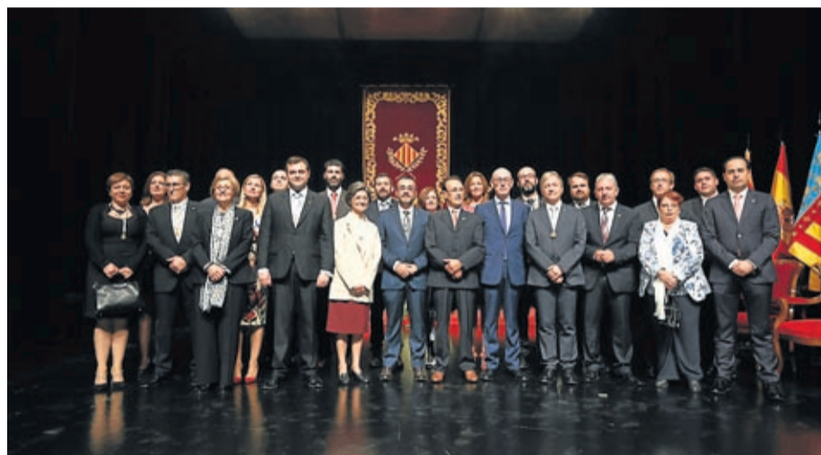
Integrants de les diferents entitats reconegudes van estar presents a l'acte oficial a l'auditori.