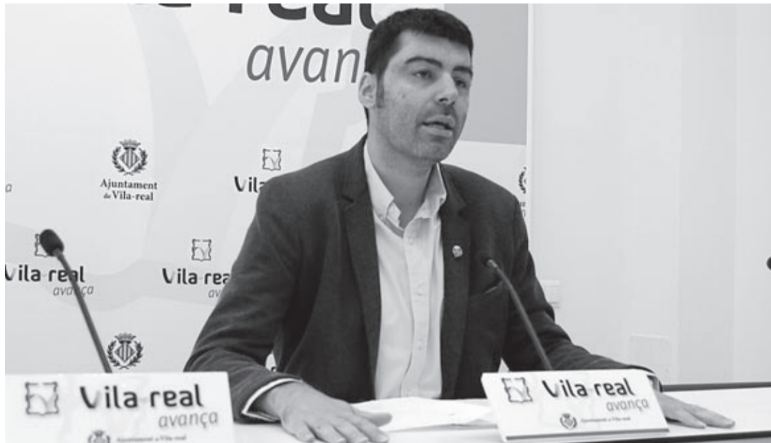
Escorihuela va detallar les aportacions autonòmiques per als diferents projectes i treballs de la Regidoria.