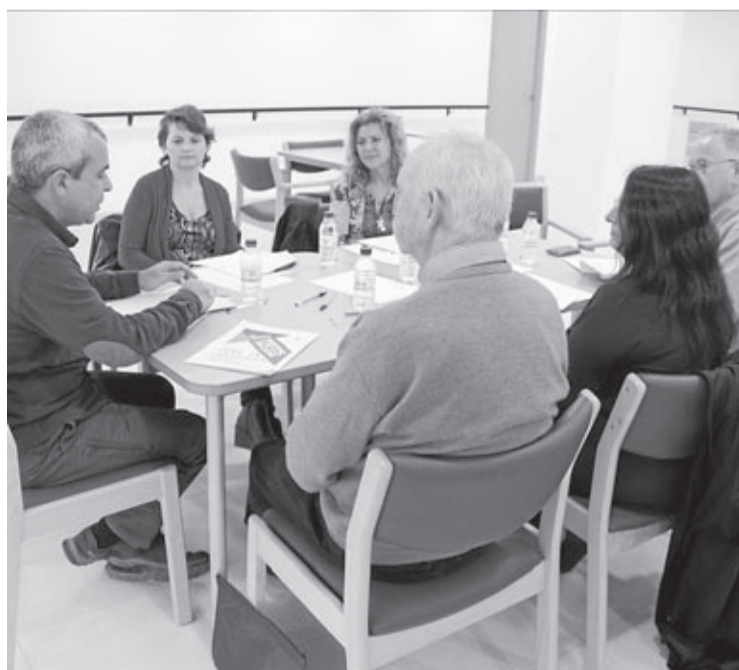
La segunda fase del proceso fue la evaluación del Foro de Presupuestos.

La feria Nadalàndia -del 27 al 30 de diciembre en el Centre de Congressos, Fires i Trobades-, el concierto solidario de la Banda Jove de la Unió Musical La Lira -29 de diciembre- y una sesión de cine en valenciano el 3 de enero precederán a la cabalgata de los Reyes Magos, que tendrá lugar el 5 de enero a las 19.30 horas.