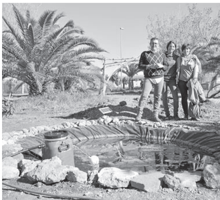
Sancho va visitar la parcel·la amb una usuària i la responsable de la campanya.

La Unitat Canina (UCAN) de la Policia Local ha intervingut dos quilos de marihuana en un habitatge cèntric. La troballa s'ha produït quan un dels gossos detectors ha realitzat un marcatge positiu. Els agents que acompanyaven els gossos han realitzat diligències per un presumpte delictes contra la salut pública.