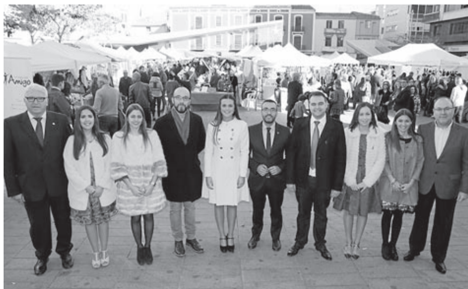
Los ediles de la corporación municipal tampoco quisieron perderse este estimado evento.

■ Más de 240 vendedores ofrecieron los productos típicos como turroneos, juguetes y decoración, así como moda y complementos