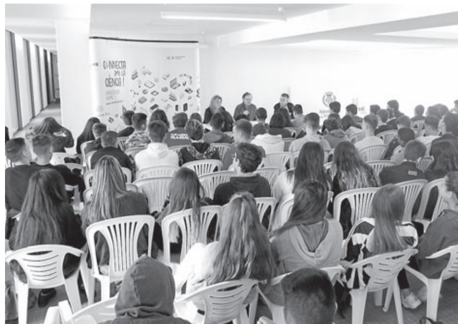
La BUC acogió las charlas y talleres de una iniciativa impulsada por la Universitat Jaume I.

Las jornadas buscaban aumentar el interés por los estudios científicos