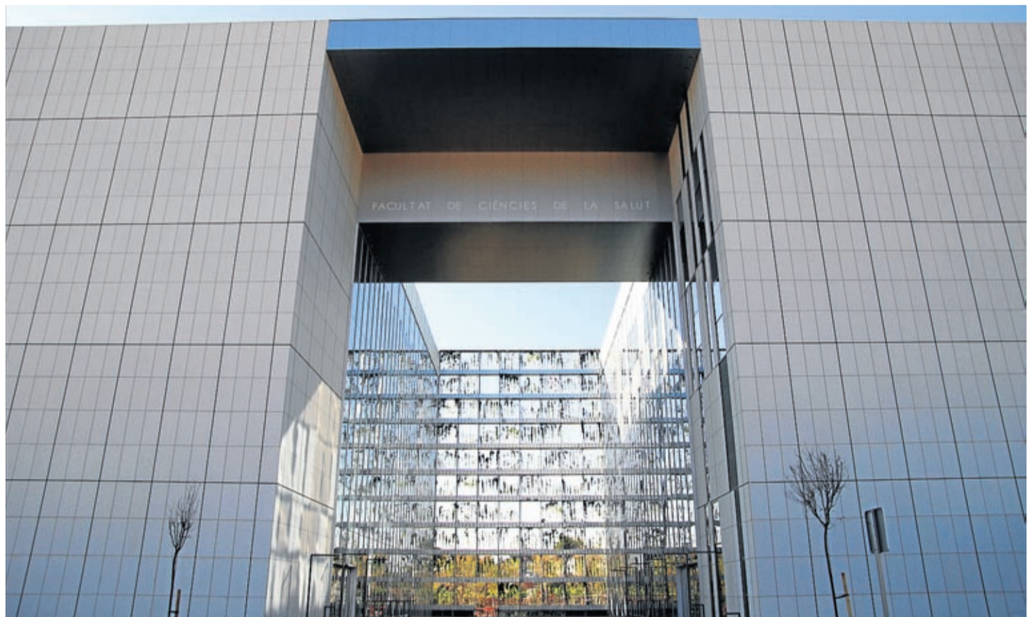
La obra está dividida en dos bloques, el primero de ellos acoge servicios comunes, mientras que el segundo se componen básicamente de las aulas.

Para ello, se han aplicado fachadas acristaladas con la utilización de paneles composite con aislamiento térmico en su trasdós; se ha empleado una fachada cerámica ventila-