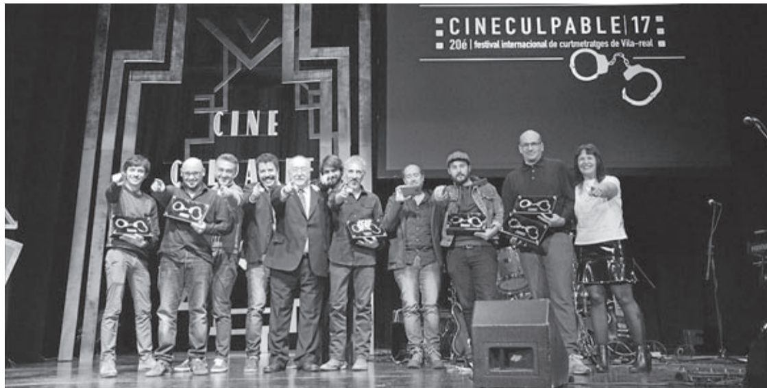
Los estudiantes de la Escola d'Art i Superior de Disseny de Castellón se encargaron de la decoración del evento.