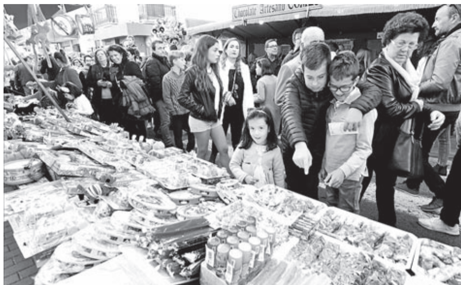
La buena climatología favoreció que la participación fuera elevada durante todo el día.