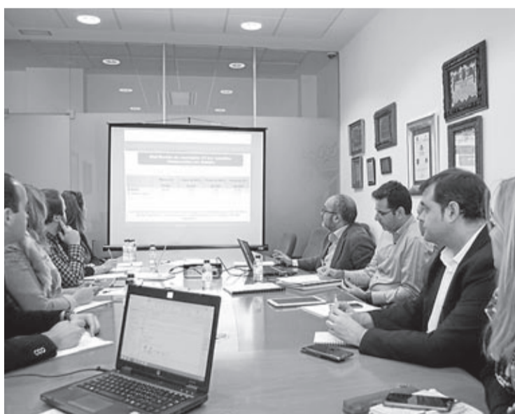
Els grups municipals van participar en una reunió amb la consultora.

a la seua elaboració. En aquest punt, Benlloch destaca la implicació dels 55 joves beneficiaris dels programes Avalem Joves, que «s'han bolcat en el disseny de l'estratègia de ciutat». Entre altres qüestions, els joves han col·laborat en la realització d'enquestes directes a la ciutadania sobre la base d'una mostra representativa de la població. «Un instrument molt interessant i