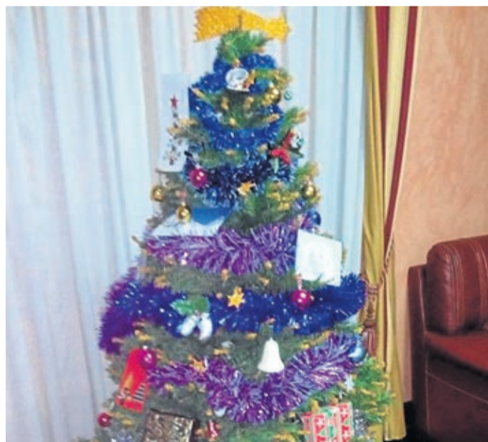
Llegadas las fechas navideñas, los usuarios se vuelcan con los preparativos.

En las instalaciones, los usuarios también disponen de animación socio-cultural con un variado programa de actividades. La residencia dispone de 105 plazas en 81 habitaciones, todas ellas individuales de las cuales 24 pueden ser compartidas. Unos cuartos están dotados con todo lo necesario para facilitar la estancia a los usuarios: aire acondicionado, teléfono manos libres, alarma personal, cama ar-