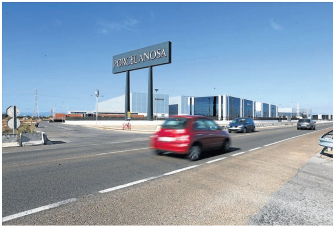
La rotonda de 120 metros de diámetro propuesta por la Generalitat conectaría con la N-340, en el entorno de la ITV.

El alcalde recuerda que la ciudad ha tenido que pagar ya más de cinco millones de euros por las expropiaciones de terrenos desde 2011. «El PP expolió los terrenos a los propietarios sin pagarles ni un euro, cuando en el resto de municipios este tipo de infraestructuras las había asumido íntegramente la Generalitat. Tuvo que ser este gobierno quien, al asumir la responsabili-