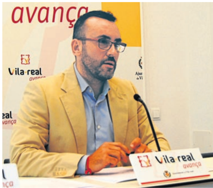
El alcalde detalló los pasos seguidos para solicitar la revisión catastral.

«Es decir, el estudio elaborado por la Intervención municipal prácticamente multiplica por tres la rebaja de valores que se habría producido en los últimos años respecto a las previsiones de la Dirección General», señala Ben-