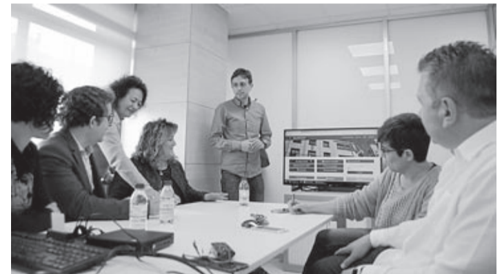
Mañas y técnicos municipales recibieron a una delegación de Peñíscola.

El Ayuntamiento, pionero en la implantación de la Administración electrónica, se ha convertido en un referente para otros municipios valencianos, que ya toman nota y siguen el modelo de digitalización de los expedientes y procedimientos administrativos de la ciudad.