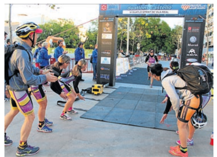
VILA-REAL ACULL LA CELEBRACIÓ DEL VI DUATLÓ SPRINT D'ÀMBIT AUTONÒMIC

En primer lloc, es van reparar els vidres que recobreixen gran part dels vestidors, es van instal·lar diverses infraestructures amb xarxes parabolons o malles de protecció en els laterals dels camps de futbol i també està previst crear un accés més restringit a les instal·lacions per a controlar millor qui entra i ix del recinte.