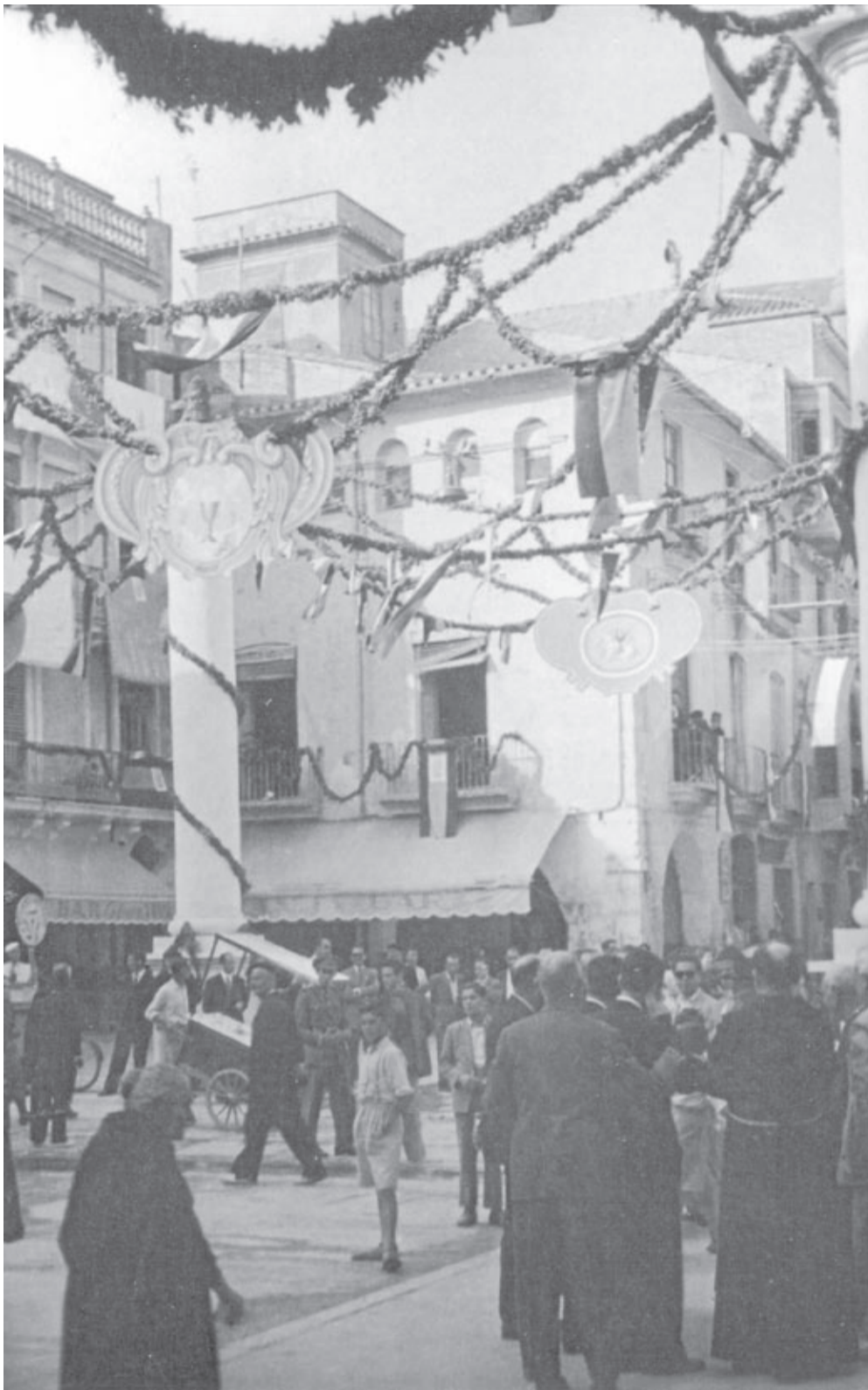
La plaça de la Vila era epicentre de nombroses festes.