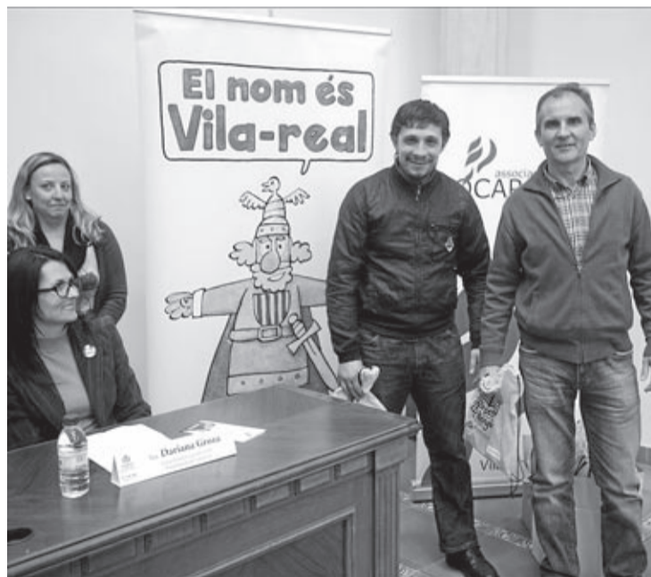
La iniciativa ja està consolidada a Vila-real i arranca de nou aquest mes.

No obstant això, el Voluntariat pel valencià no deixa d'innovar i enguany, a la modalitat presencial, amb persones residents a Vila-real que hauran de quedar una hora a la setmana, se suma la modalitat en línia, que ajudarà que aprenents amb poc de temps aprofiten les xarxes socials o altres instruments virtuals per