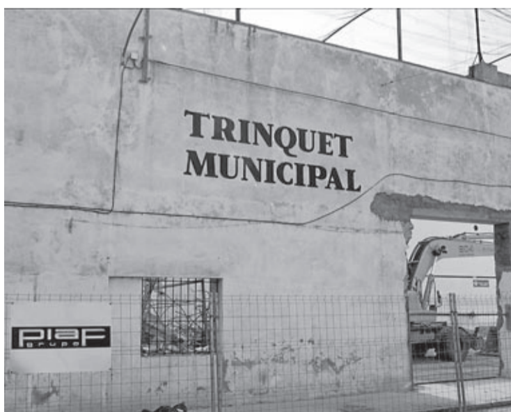
El cas de les factures de Piaf, en procés judicial, també consta en l'informe.

reclamen» o el jardí de Botànic Calduch.