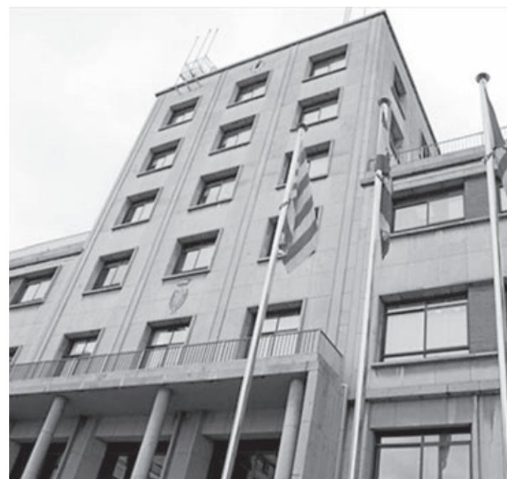
Benlloch lamenta que «el casino urbanístic del PP, que ha arruïnada la ciutat».

«Tenim un deute menor del que vam trobar el 2011 i hem acabat l'any amb diners sobrants gràcies a haver actuat amb responsabilitat, renunciant a projectes que podien esperar», diu.