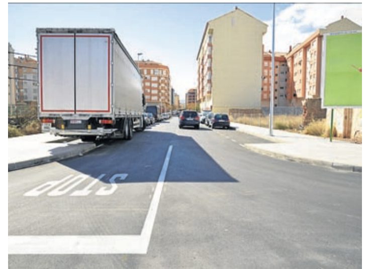
Territorio invierte más de 83.000 euros para la apertura de ambos viales.

Las calles Corts Valencianes y Alfons el Magnànim ya están abiertas al tráfico, después de la actuación integral realizada por el Ayuntamiento para dar respuesta a una demanda histórica de los vecinos.