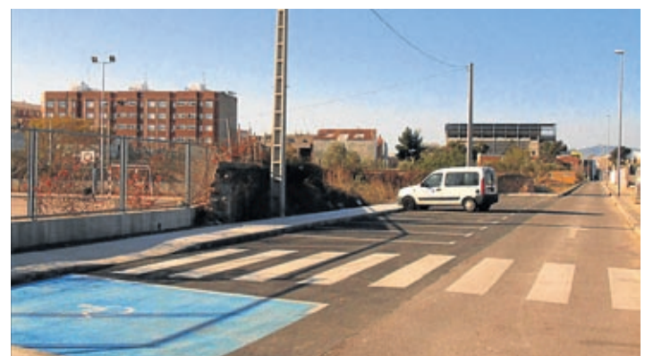
En Serra de les Santes se ha permitido la conexión con la calle Sant Pau.

Con estas obras que ha realizado BECSA por encargo del Ayuntamiento de Vila-real, se aumenta la confortabilidad y viabilidad de varias zonas del municipio. De este modo, los vecinos de la localidad pueden circular mejor con cualquier medio de transporte por las distintas calles de Vila-real.