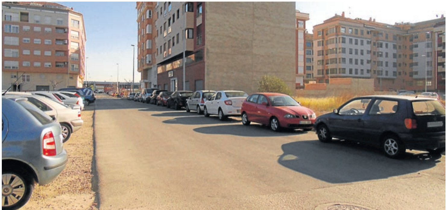
Las actuaciones en Alfons el Magnànim y Corts Valencianes, reivindicaciones de los vecinos de la zona, han tenido un presupuesto de unos 83.000 euros.

La actuación contó con un presupuesto de unos 17.000