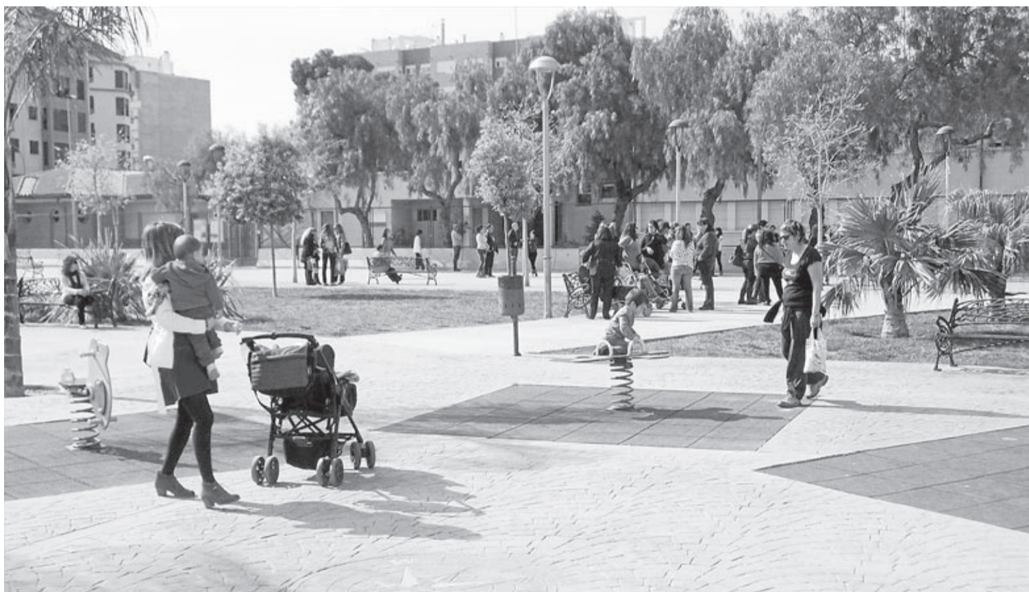
Una part dels 48 milions correspon a reclamacions en tràmit en la via judicial que coincideixen amb 37 plets, entre els quals es troba el jardí de Botànic Calduch.

Per aquest motiu, el consistori, a petició del Govern, ha remès l'informe elaborat per tècnics municipals, que posa de manifest que, a curt termini, la ciutat podria tenir l'obligació de pagar fins a 48,5 milions d'euros. «El pitjor de tot és que mai sabrem quan es dictarà una sentència ni quan pot venir, gestionem amb una inseguretad total», afirma el primer edil. De fet, recorda que dels 48 milions d'euros, un poc menys de la meitat, 20,1 corresponen a reclamacions en tràmit en la via judicial, que coincideixen amb 37 plets, entre els quals es trobarien les factures falses de Piaf, «que encara se'n