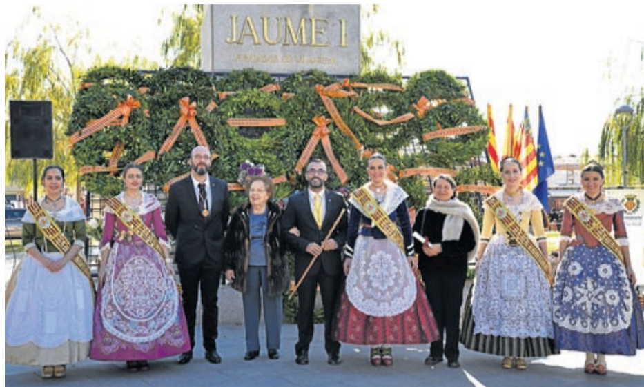
La corporació municipal i la societat civil van retre homenatge al rei Jaume I al jardí dedicat a ell.