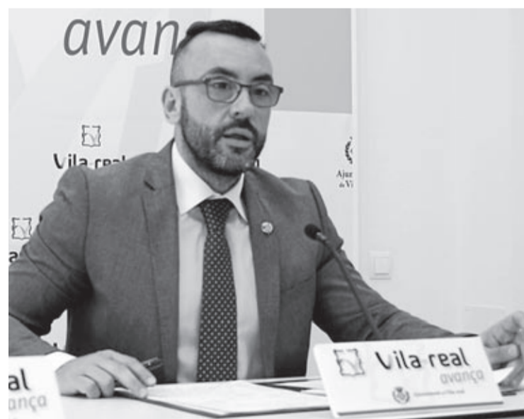
Benlloch va detallar les dificultats que suposa aquesta situació per a la ciutat.

■ L'alcalde lamenta haver de dedicar «tants esforços a gestionar el passat» en referència als governs del PP