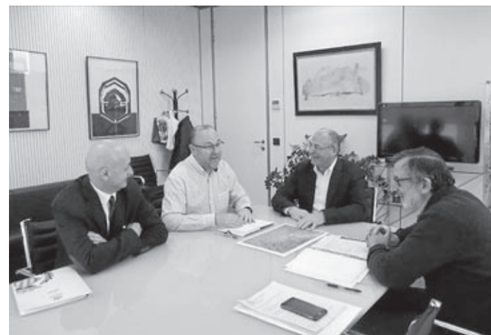
Obiol mantuvo un encuentro sobre el eje con responsables autonómicos.

La ciudad acogerá el III Congreso Iberoamericano de Mediación Policial el 21, 22 y 23 de marzo.