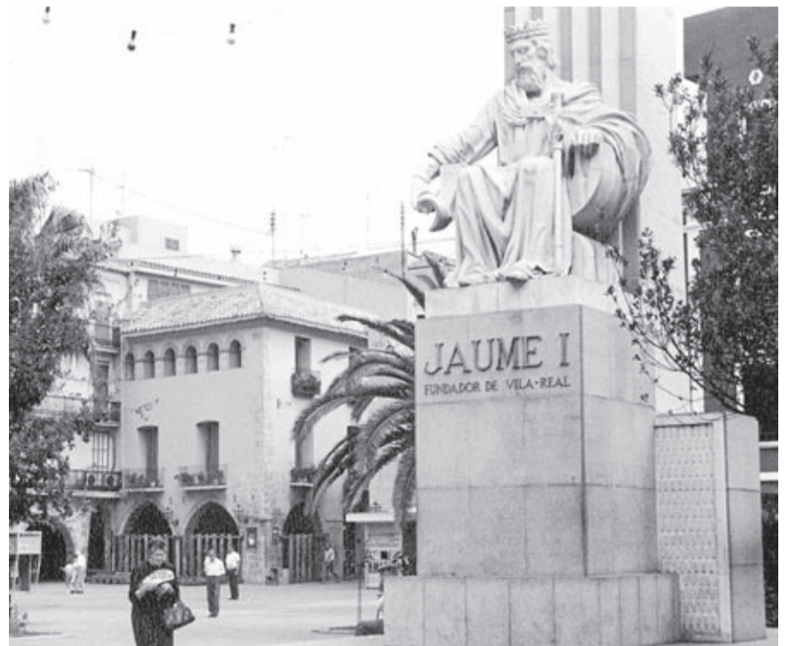
L'escultura de Jaume I amb l'Hostal del Rei al fons.

palacio que dicen fundado por el rey Don Pedro», «con la obligación de ser posada de reyes», qüestiona la tradició del naixement de la reina d'Aragó (Inza, Escuder, p. 17-18, 60) i demostra que a l'hostal va morir la reina Maria de Luna el 28 de desembre de 1406, tal com consta en el testament de la reina i en documentació de l'Arxiu Municipal.