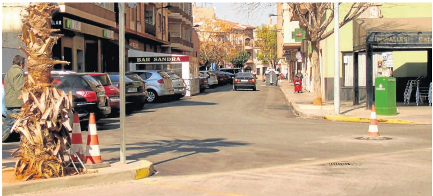
El último trabajo realizado ha sido en la calle Valencia, tanto el cruce con Serra d'Irta como el tramo comprendido entre la avenida Pio XII a la calle Hospital.

Con estas obras se aumenta la confortabilidad y viabilidad de varias zonas para circular con cualquier medio