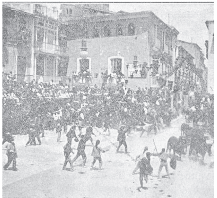
Els actes taurins congregaven milers de persones.