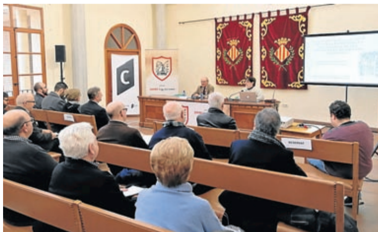
La Jornada Jaume I i el seu temps va reunir experts en diferents àmbits.

Diumenge 18 va tenir lloc un dels actes centrals de la programació, l'acte d'homenatge i ofrena al fundador de la ciutat. Cortells recorda que l'acte va comptar amb la participació de la Colla Gegantera i el Grup de Dolçainers i Tabaleters El Trull, que van posar la nota de color a