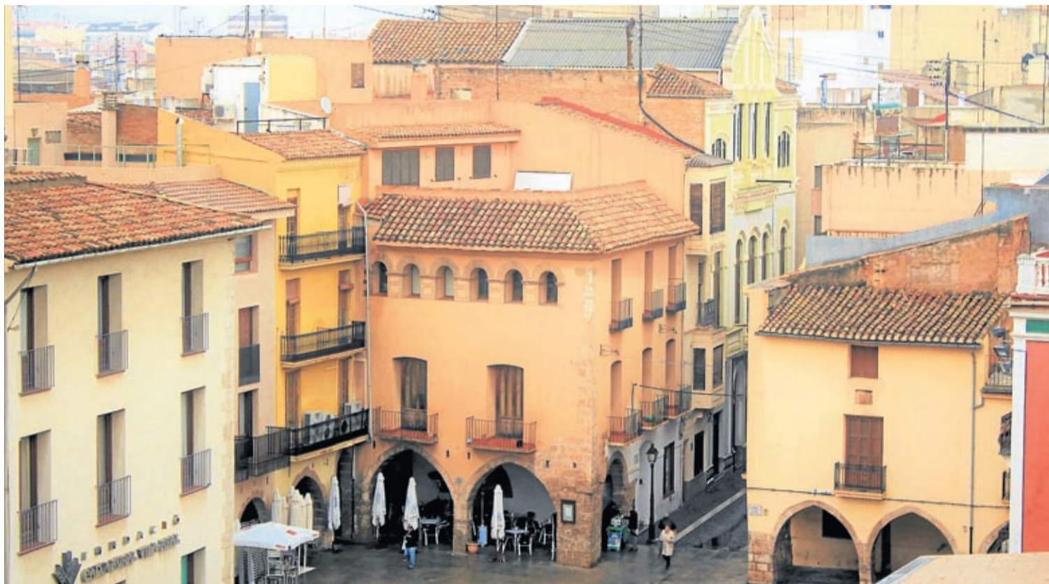
L'Ajuntament va activar fa uns mesos una campanya informativa, de sensibilització i valoració per a salvar aquest immoble i que passe a ser patrimoni local.

En els capítols de l'arrendament de l'immoble («alberch», hostal, posada, de totes les maneres s'anomena a la documentació) tenia prioritat l'allotjament de les autoritats reials i dels seus repre-