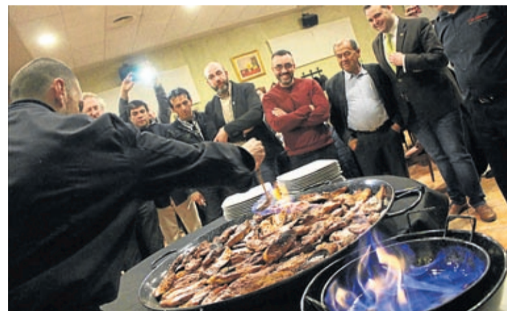
El sopar i la Fira Medieval van traslladar la ciutat a l'època de la fundació.