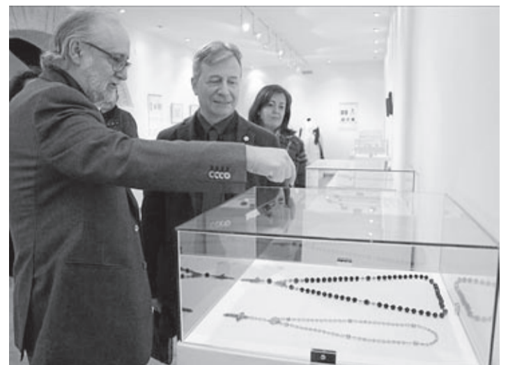
LA JOIERIA TRADICIONAL DEL MUSEU DE BELLES ARTS ARRIBA A LA CASA DE POLO

La cita, el 10 de març a les 20.00 hores a l'Auditori Municipal.