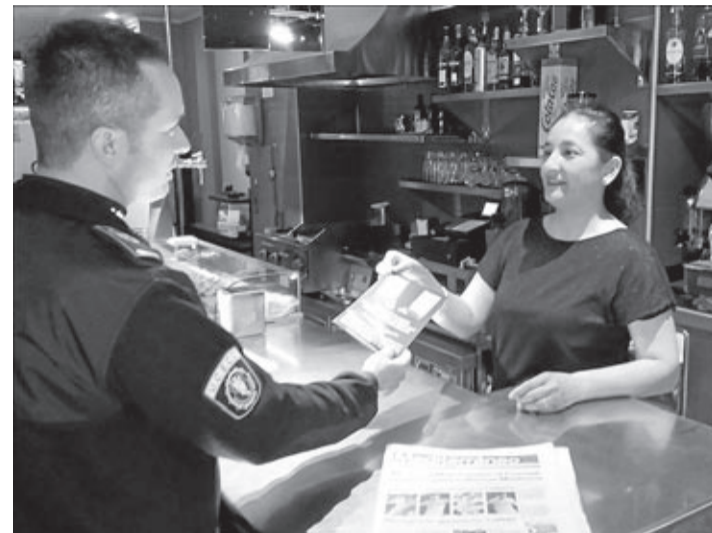
La unidad también realiza campañas informativas en comercios locales.

La Unidad de Control de Establecimientos y Consumo (UCECO) de la Policía Local ha intervenido durante el año 2017 un total de 9.643 productos que infringían la normativa y ha interpuesto 61 denuncias.