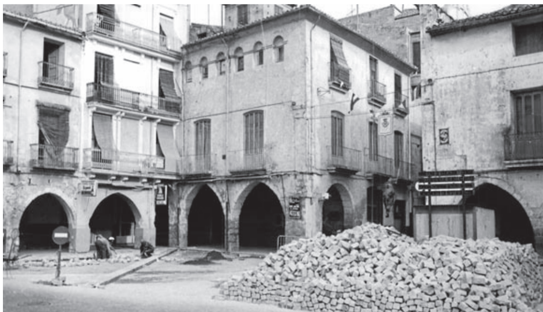
L'entorn de la infraestructura ha patit canvis i actuacions de millora amb el pas del temps.