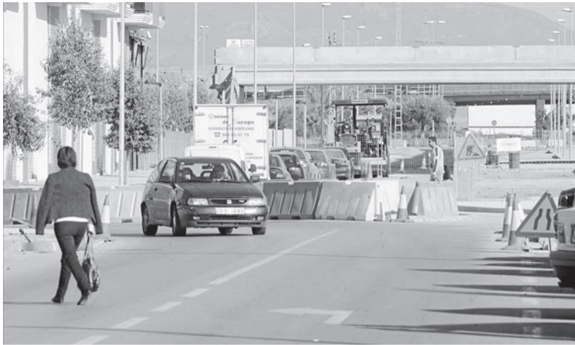
A la xifra marcada pel Jutjat en aquest cas de l'obertura de l'avinguda es podrien sumar 300.000 euros d'interessos.

«Poc ens quedava ja per veure d'un equip de govern irresponsable que tenia una gran ima-