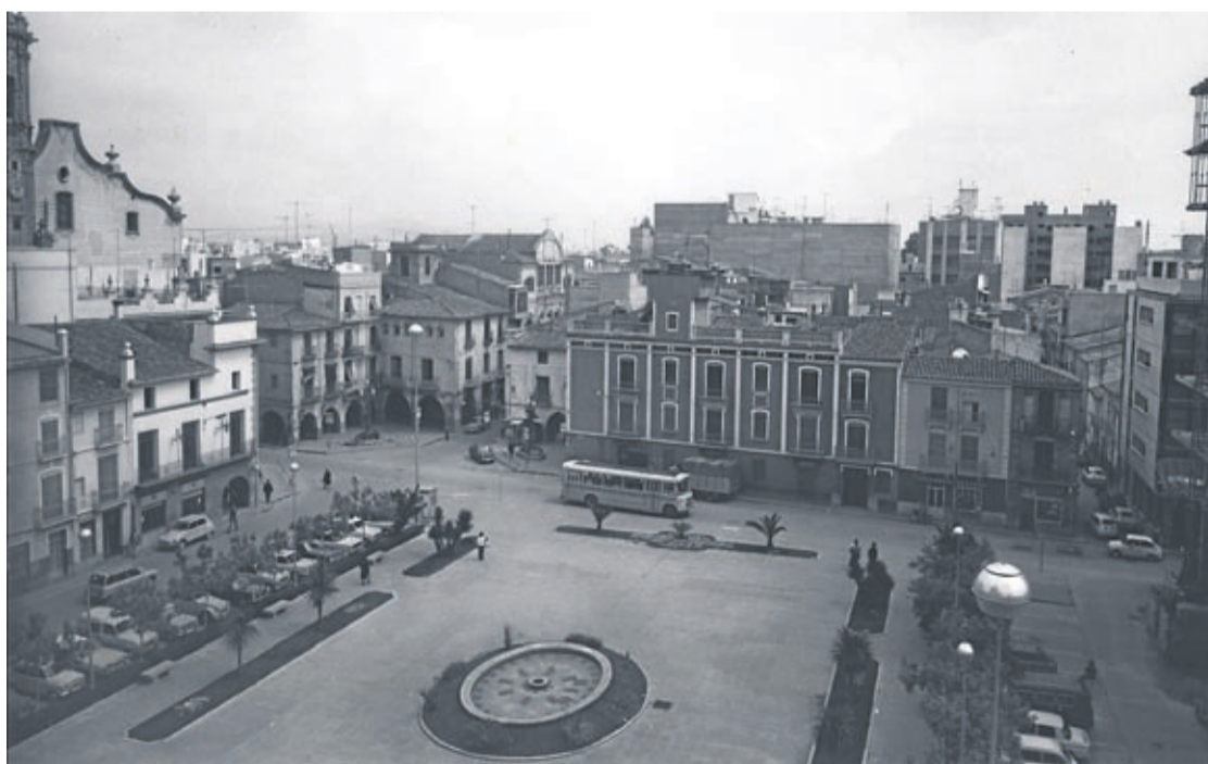
Imatge de la plaça Major amb el pas de vehicles i vista de l'emblemàtic edifici.

sentants. El 1406 allotjà la reina Maria de Luna; el 1416, l'infant Joan; el 1490, els ambaixadors del rei de França; el 1563 o el 1668, les autoritats militars en trànsit.