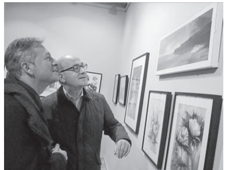
MARTÍNEZ SABATER EXPOSA PER PRIMERA VEGADA ELS SEUS TREBALLS D'AQUAREL·LES

El Museu de la Ciutat Casa de Polo acull fins al 15 d'abril la mostra 'Joieria tradicional al Museu de Belles Arts de Castelló' amb peces que representen la tradició com a símbols d'una cultura.