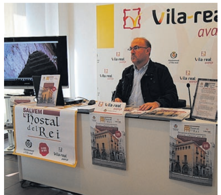
El regidor de Territori durant la presentació de la iniciativa de sensibilització.

«Volem una campanya cordial i que no s'entenga com cap tipus d'amenaça cap a ningú però l'Ajuntament no renuncia al seu deure d'aconseguir-lo», va dir.