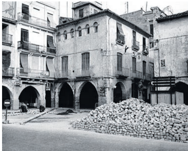
L'entorn ha patit canvis amb el pas del temps.

19 d'octubre, de la Generalitat, de modificació de la Llei 4/1998, d'11 de juny, del patrimoni cultural valencià [2004/10667] (DOGV núm. 4867, de 21.10.2004), està vinculada a esdeveniments del passat i tradicions populars de la història de Vila-real.