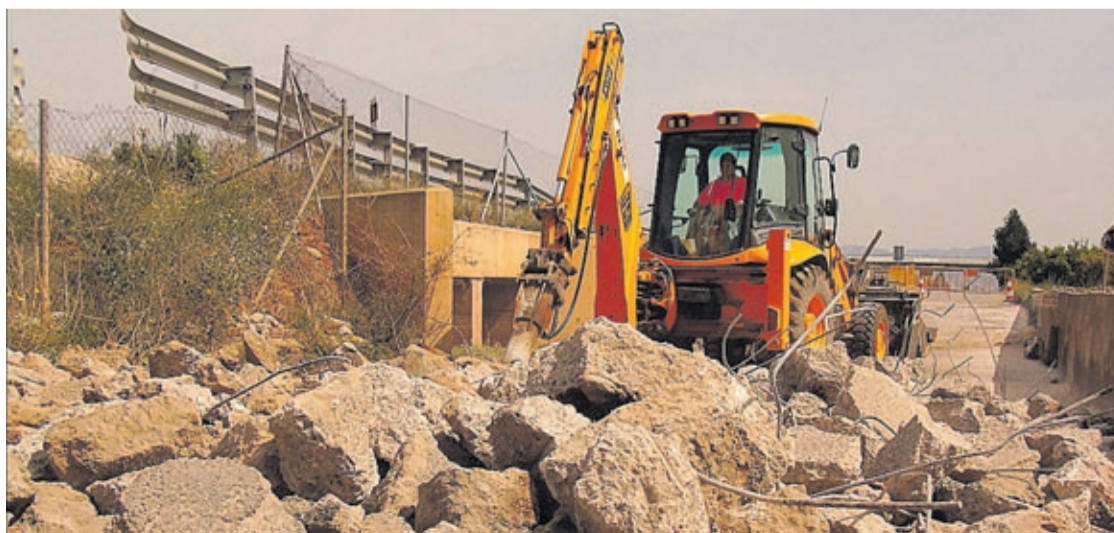
El paso del tiempo, el tráfico de vehículos agrícolas e industriales o las inundaciones han provocado el deterioro.

distintos caminos y vías rurales del término municipal de Vila-real se verá reforzada y también contribuirá a una mejora de acceso a las zonas agrícolas de la localidad.