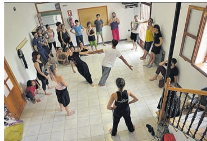
El teatre i la dansa són protagonistes del segon semestre cultural.

La programació cultural del segon trimestre de l'any arriba carregada. Concretament, són prop de 60 els actes programats fins al mes de juny, entre els quals no faltaran les exposicions, concerts i audicions, una nova edició del Memorial Democràtic, conferències, esdeveniments d'associacions locals i dos dels festivals estrella de la ciutat: Vila-real en Dansa i el FitCarrer, que compleix 31 anys traent el teatre als carrers de Vila-real -més informació de l'esdeveniment en la pàgina 14.