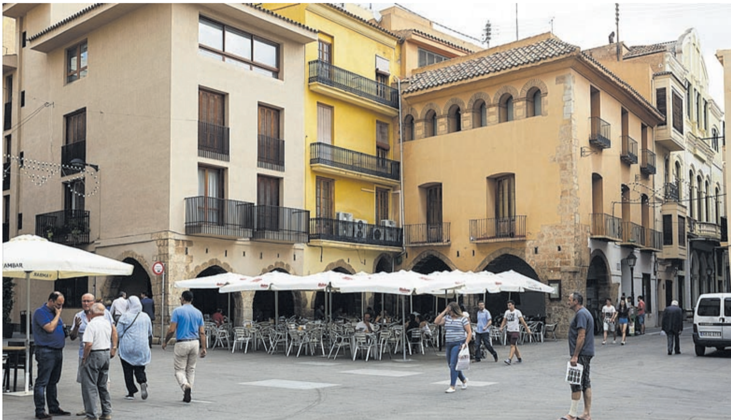
L'edifici de l'Hostal del Rei, situat a la plaça porticada de la Vila, va ser declarat Monument Nacional l'any 1974 i ha tingut diferents usos durant la seua història.

«Quan es va tancar l'oficina de Bancaixa als baixos de l'immoble, ja ens vam interessar per l'edifici, però la situació econòmica de la ciutat era molt complicada. El que demanàvem és que l'Hostal del Rei no es tractara com qualsevol solar, perquè és un edifici de