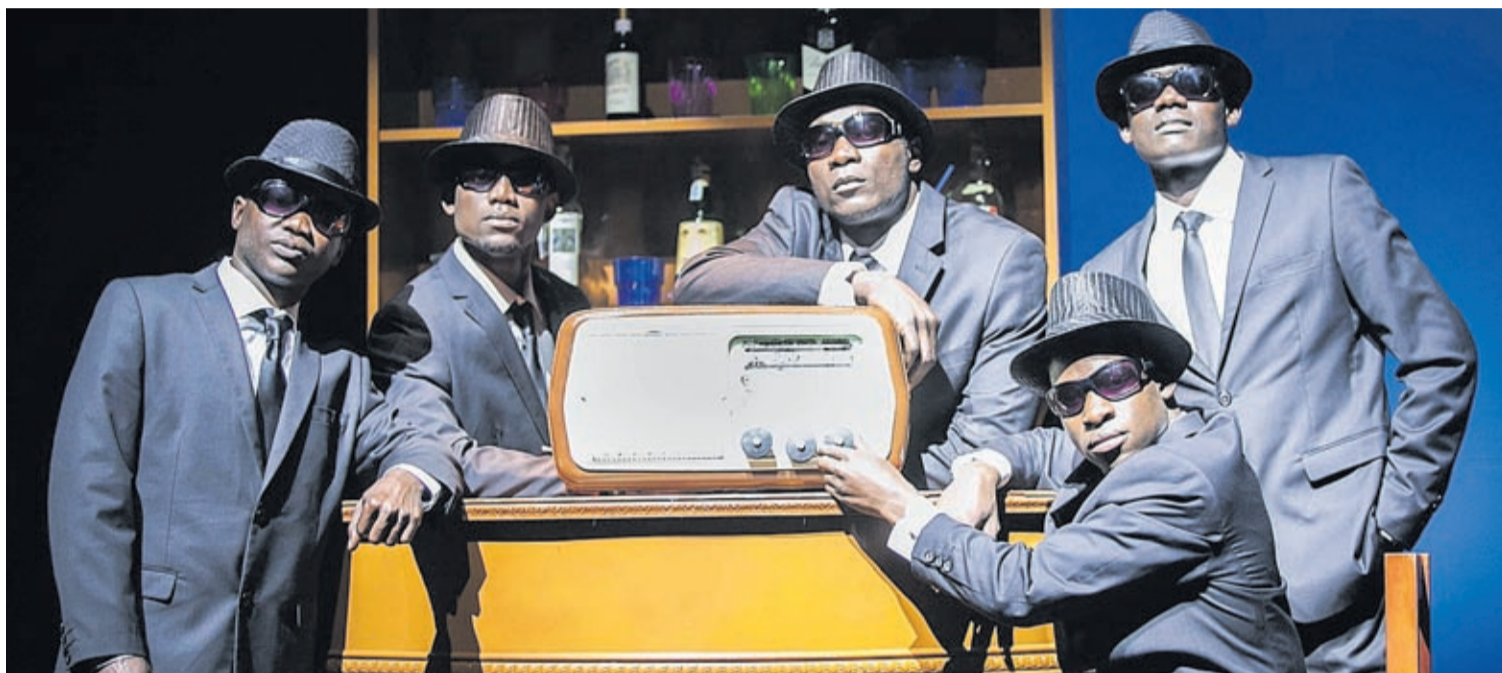
Un dels espectacles més destacats, per no ser habitual la presència al festival de companyies africanes, serà l'ofert pels kenyans The Black Blues Brothers.

El responsable d'aquesta cita comenta que, com sempre, s'ha intentat que hi haja una representació de diferents àmbits del món de les arts de carrer com el circ, la música, les acrobàcies o la dansa. Representacions que arribaran a diferents espais de la ciutat i estan pensats, especial-