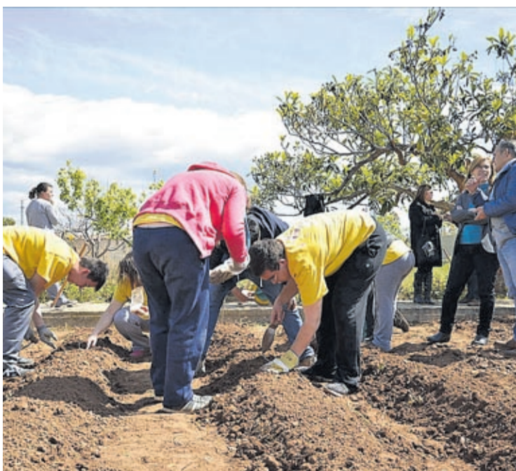
Los alumnos ya trabajan en el terreno con varias semillas de judía tradicional.

La Policía Local ha interpuesto 17 denuncias a conductores por utilizar el teléfono móvil al volante y una por usar cascos o auriculares conectados a lo largo de la campaña especial de vigilancia y control del uso del teléfono móvil durante la conducción. Los agentes realizaron controles a 368 vehículos.