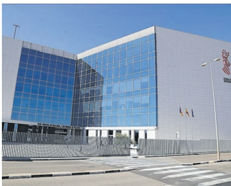
El Jutjat de Primera Instància i Instrucció núm. 5 ha admès a tràmit la demanda.

gran valor cultural, patrimonial i emotiu per als vila-realencs; i que no es tractara l'Ajuntament, que són tots els ciutadans, com a qualsevol altre postor. En lloc d'això, el que va haver-hi és un tracte de mala fe i un absolut desconeixement del funcionament de les institucions públiques, citant-nos a acudir un dia i a una hora determinada amb 600.000 euros en la butxaca; cosa que ens