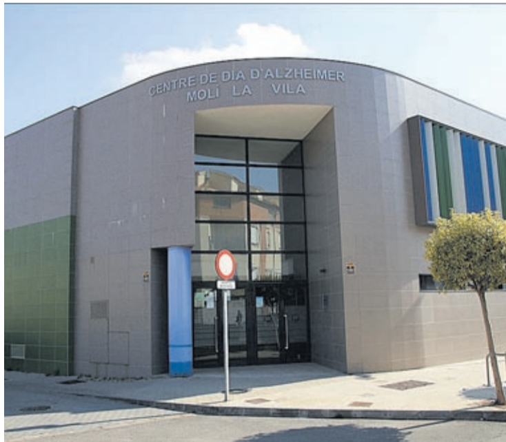
El actual edificio está preparado desde su creación para culminar el proyecto.