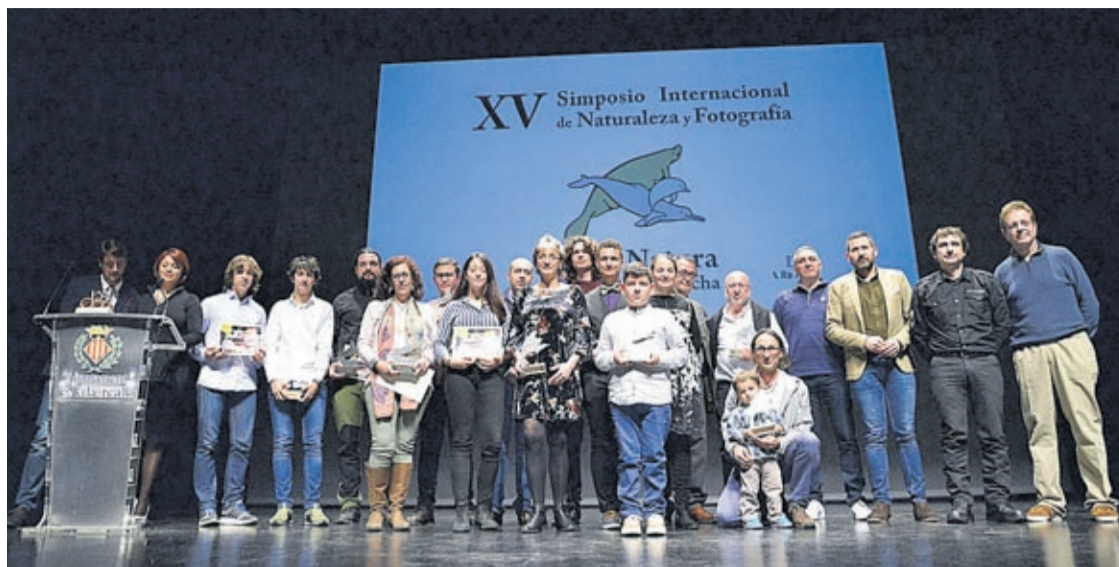
L'Auditori Municipal Músic Rafael Beltrán va ser l'escenari de l'entrega de guardons, un dels principals actes de la cita.