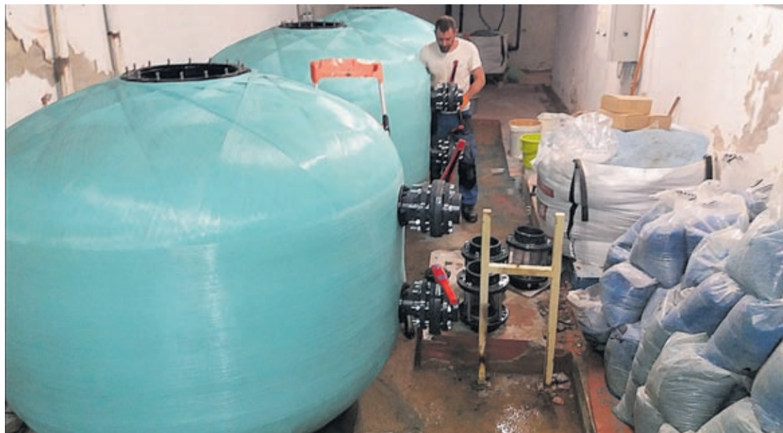
Els operaris han treballat en el sanejament de la sala de màquines així com en la substitució de les canalitzacions.