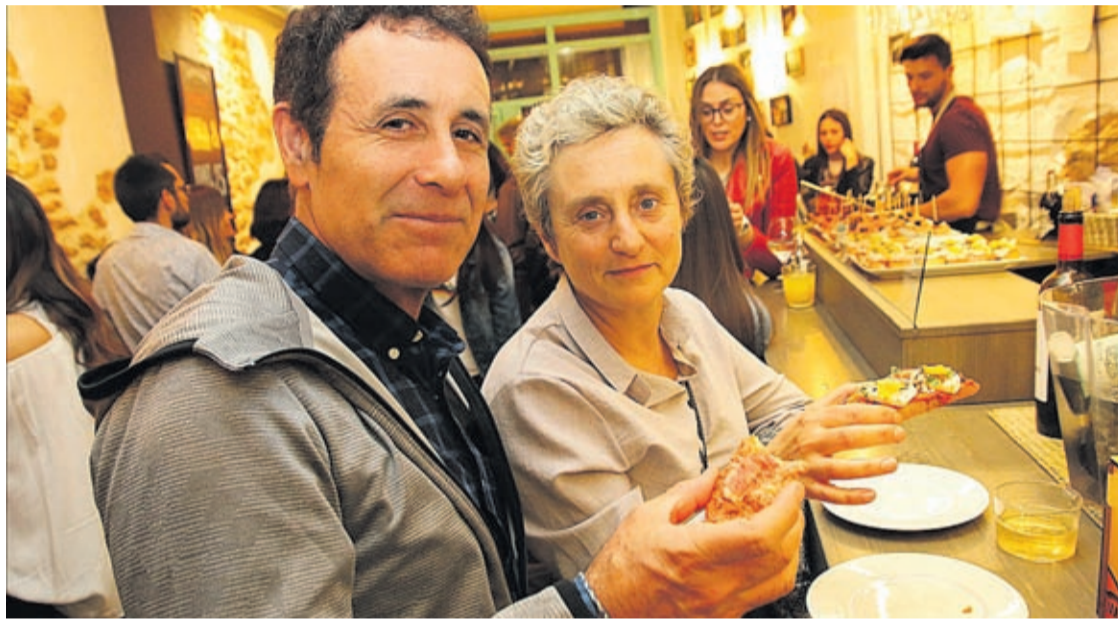
Un total de 32 establiments, quatre més que la darrera edició, s'han afegit a aquesta convocatòria gastronòmica.

Aquesta edició, a més, incorpora una important novetat: tota la informació de la Ruta, locals participants, tapes i mapa d'ubicació dels establiments serà accessible, per primera vegada, en el mòbil i dispositius electrònics, a través de l'app Vila-real i el web rutade-latapa.vila-real.es . «Un web modern, d'accés directe a través de l'app, que ens permetrà seguir creixent i que ha comptat amb la col·laboració indispensable de les