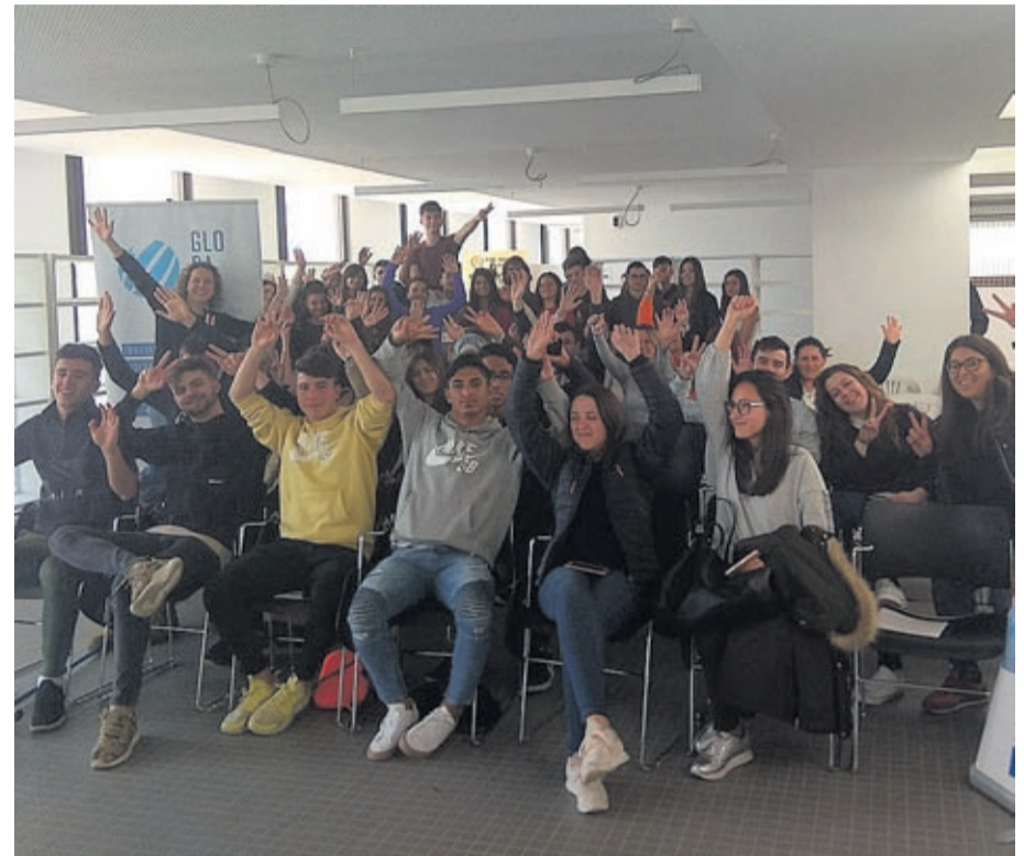
El objetivo del concurso es impulsar y acompañar a los jóvenes que deseen emprender.

Una charla sobre Habilidades de comunicación cerró las ponencias