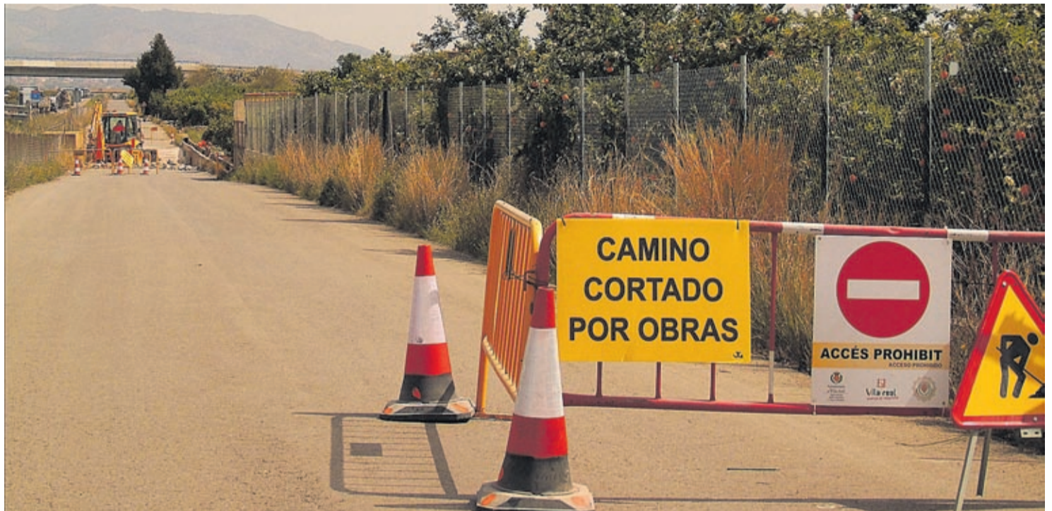
Becsa ya ha iniciado la ejecución de los trabajos con la demolición y posterior reconstrucción de un badén situado en el camino de servicio de la CV-10.

Con estas actuaciones, la seguridad y la vialidad de los