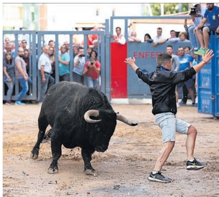
Los aficionados taurinos disfrutarán de una completa programación.