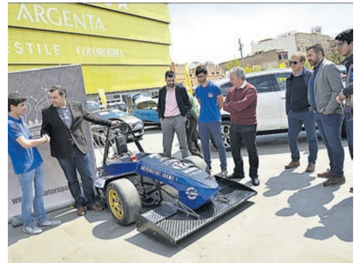
La plaça del Llaurador va acollir vehicles de 14 marques diferents.

La Fira del Vehicle d'Ocasió de Vila-real Motor-2, organitzada per la Regidoria d'Economia, ha assolit la 18a edició. Una majoria d'edat celebrada amb l'ampliació de dos a tres dies de l'esdeveniment, que va tenir lloc a la plaça del Llaurador, amb 14 estands que oferiran 220 vehicles seminous, de quilòmetre 0 i gerències en perfecte estat i totes les garanties.