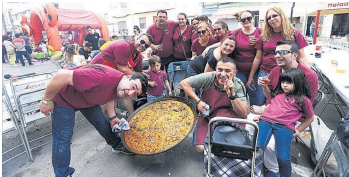
El concurso de paellas organizado desde hace décadas por la Comissió de Penyes se abre este año a no peñistas.

Tampoco faltarán las grandes orquestas y espectáculos que amenizarán el macrosoapar de veïns o la nit de xulla .