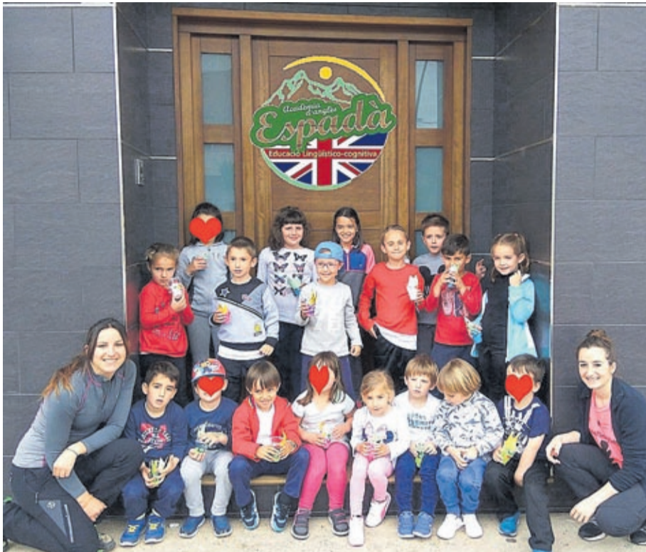
Con sede en Artana, esta academia fue una de las participantes en los Premios Globalis 2017.