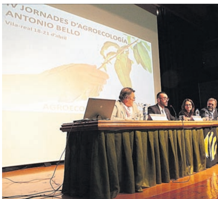
Experts en diferents àmbits d'agricultura van portar projectes i innovacions.

Ochando apunta a la llarga trajectòria i a aquest incessant creixement de la fira com a principals motius pels quals Motor-2 «s'ha convertit en tot un referent a Castelló». I és que, tal com indica, «hem passat de vuit a catorze expositors, ha augmentat en un 100% el nombre de vehicles en exposició». «L'Ajuntament pretén, amb aquesta fira, d'una banda, facilitar l'accés dels ciutadans a vehicles en millors condicions i, per una altra, donar suport a aquest sector comercial tan important en la nostra ciutat que ha sabut reinventar-se», diu.