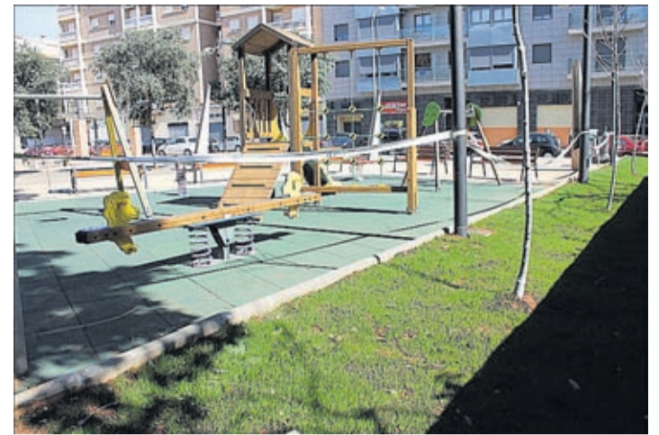
Serveis Públics atén així les peticions del veïnat i les propostes dels tècnics.

«Actualment, hi ha 12.732 expedients en les nostres bases de dades, la qual cosa significa que, des que tenim registres, un 62% de les famílies de Vila-real han sigut ateses en algun moment de la seua vida pel nostre departament», conclou.