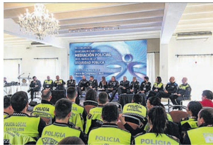
El Congreso Iberoamericano es uno de los actos de referencia en la materia.

El proyecto consiste en cinco acciones formativas en tres ramas distintas, con 10 alumnos por acción. Así, se ofrece la formación Actividades auxiliares de comercio (imparte la Fundació Tots Units); Actividades auxiliares de almacén (Tots Units); Operaciones auxiliares de montaje y mantenimiento de sistemas microinformáticos (Ayuntamiento de Vila-real); Atención al cliente consumidor o usuario y, Organización del transporte y la distribución (Cámara de Comercio).