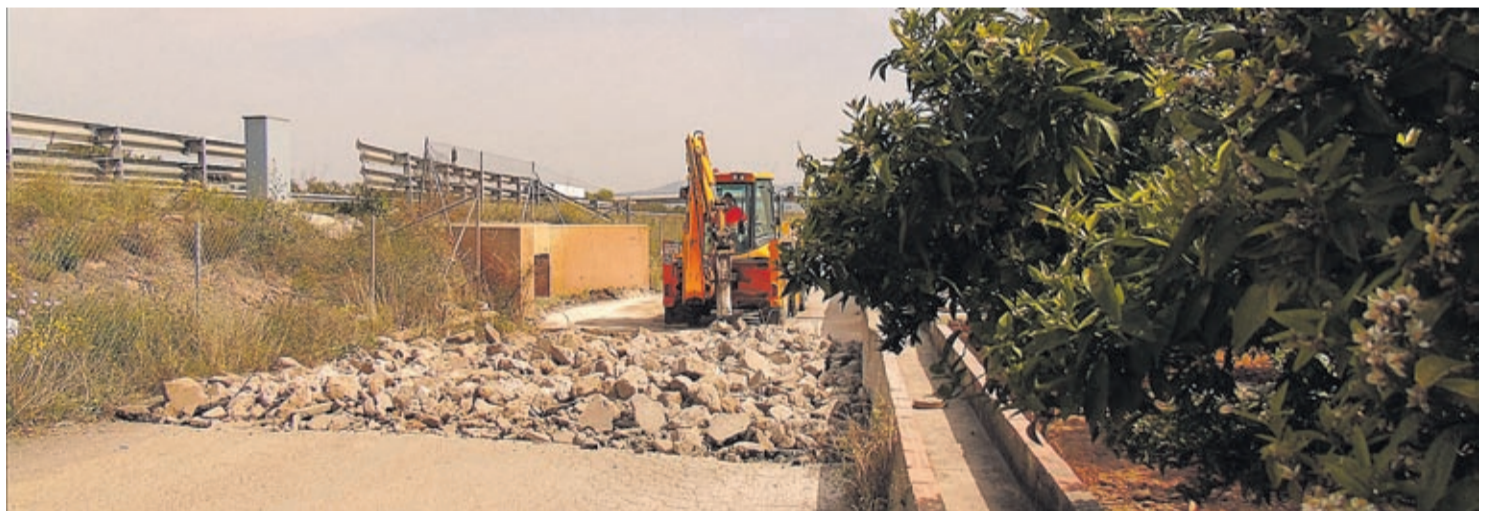
Entre los caminos incluidos en el programa se encuentran algunos como Na Boneta, Sant Jordi, Molí Paquero o Assagador de Artana, entre otros.