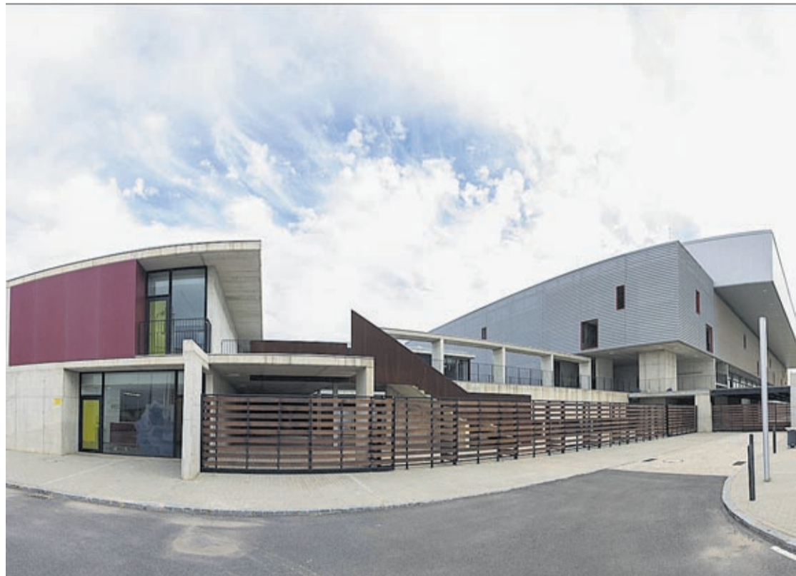
La major reclamació és la del propietari de part de la parcel·la del Centre de Tecnificació, valorada finalment en 1,3 milions.

corresponen a vuit reclamacions de propietaris per actuacions «que els ciutadans de Vila-real ja tenen interioritzades com a pròpies, però que el PP ni tan sols va pagar». En concret, el Jurat d'Expropiació acaba de valorar dos dels solars on es va construir el jardí de Jaume I i altres terrenys al costat del jardí de Botànic Calduch, el Centre de Tecnificació Esportiva, el jardí del Pilar, l'obertura del carrer del Músic