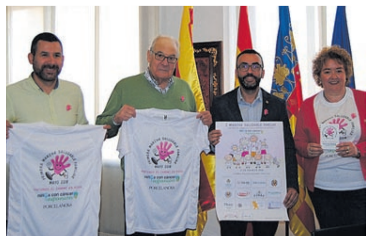
L'entitat organitzadora ha hagut de sol·licitar més samarretes solidàries.

Vila-real acull el 13 de maig, durant les festes patronals en honor a sant Pasqual, la I Marxa Saludable Familiar, organitzada per Pintando el camino en rosa a benefici de l'Associació de Pares de Xiquets amb Càncer Aspanion. El recorregut, pensat per a fer-lo en família, arrancarà a la plaça del Llaureador i finalitzarà a l'ermita de la Mare de Déu de Gràcia. Durant el trajecte, els participants disposaran de quatre controls d'avituellament. Al final del recorregut hi haurà diferents sorpreses, per la qual cosa des de l'organització, que compta amb el suport de l'Ajuntament animen els veïns a participar.