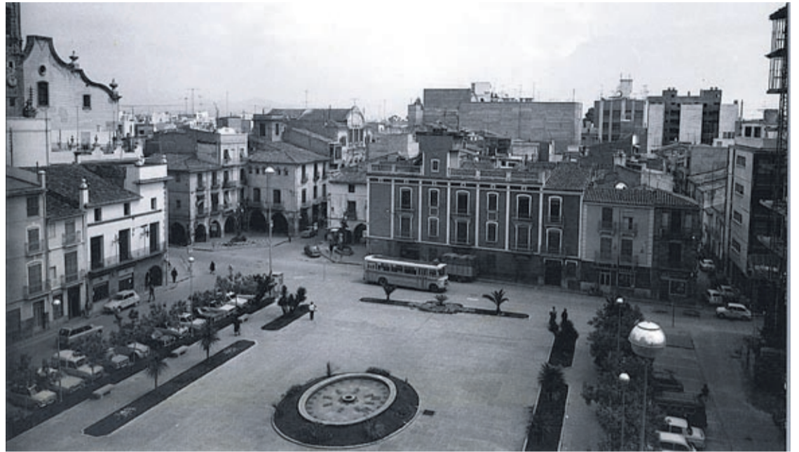
Imatge de la plaça Major amb el pas de vehicles i vista de l'emblemàtic edifici.

La història de l'immoble, com a lloc històric, d'acord amb el que disposa la Llei 7/2004, de