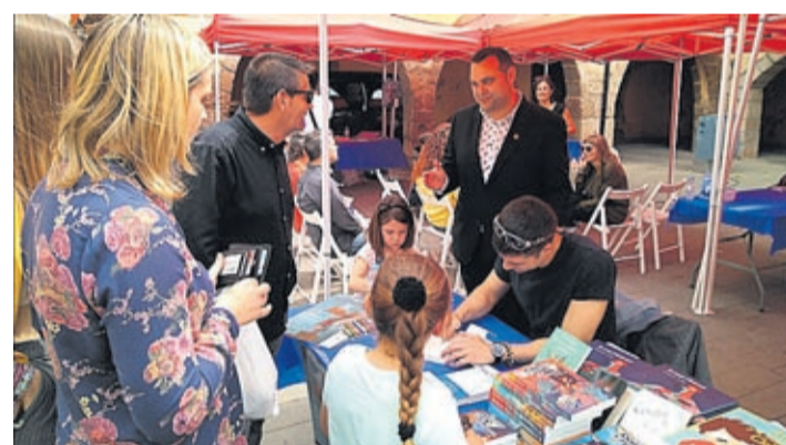
La plaza de la Vila acogió la programación, antesala de la Feria del Libro.

La cita, organizada por la Asociación Cultural de Bombos y Tambores y Turismo, tuvo lugar en la plaza Major.