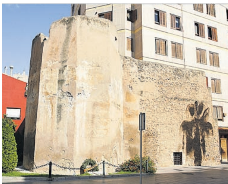
Un dels elements patrimonials que rebran inversió és la torre Motxa.

l'antiga Herarbo o la millora de parcs, a més de la instal·lació de noves àrees de jocs infantils de grans dimensions, són alguns projectes destacats per a millorar els serveis públics. També en aquest àmbit, es preveuen millores en instal·lacions esportives, com la renovació de calderes en els camps de Flors o del workout del parc d'Alaplana.