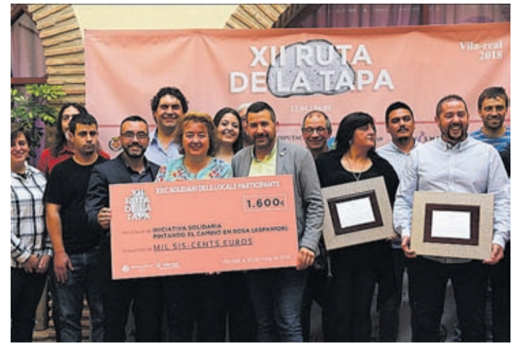
La Casa dels Mundina acogió el acto de entrega de los galardones.

Una carrera el mes pasado o un concurso solidario de pasteles han sido otras de las actividades organizadas dentro del 50 aniversario del Bisbe Pont.