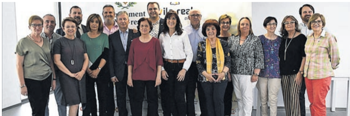
El reconocimiento a los profesores sirvió para poner en relieve su papel en la formación de los adultos del futuro.