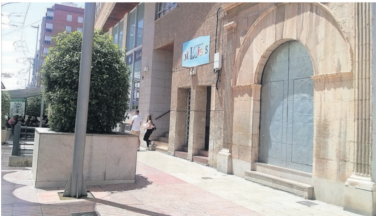
Dins del capítol d'accessibilitat, l'Ajuntament signarà un conveni de 70.000 euros amb Els Lluïsos per a poder adaptar la seu social ubicada a l'avinguda de la Murà.