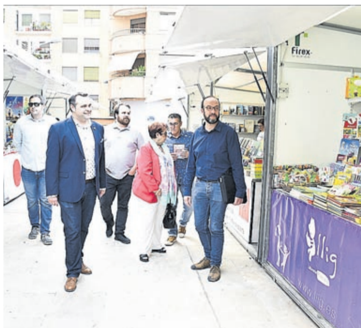
La feria, en la plaza Colom, contó con stands y una completa programación.

Esta edición fue accesible, por primera vez, en el móvil y dispositivos electrónicos. El primer balance concluye que han sido 4.400 las visitas a la web habilitada para consultas. «Han sido más de 2.700 los usuarios distintos individuales que han hecho uso de este medio tecnológico que pone a su alcance toda la información sobre el evento gastronómico», indica Vila. En total, 1.100 usuarios han accedido directamente a través de la app municipal, mientras que 400 han llegado hasta la página gracias a las redes sociales.