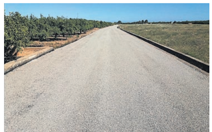
Urgía mejorar el firme de este tipo de vías que se encontraba deteriorado.