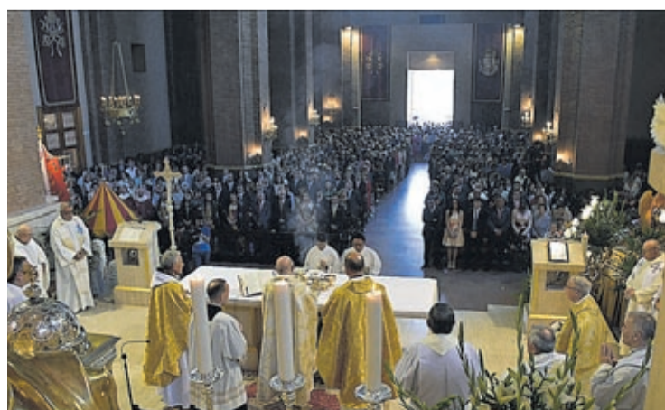
Un dels actes destacats del dia dedicat al patró va ser la santa missa pontifical.