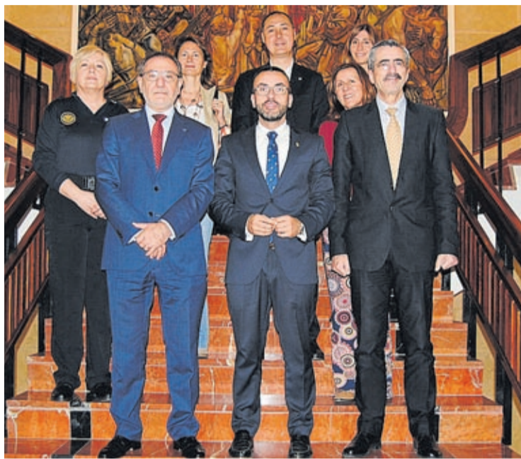
Los responsables de la ciudad, la universidad y el Ivaspe en el encuentro.

«Nuestra policía es un referente y un ejemplo en la aplicación de la mediación como método para la resolución de conflictos entre los vecinos desde la creación de la primera Unidad de Mediación Policial del Estado, en el año 2004. Hace unos años, dimos un paso más y, con la Universitat Jaume I, creamos la primera Cátedra de Mediación Policial Ciudad de Vila-real, incorporando el impulso de esta metodología a nuestra apuesta por el conocimiento como modelo de crecimiento. Nos faltaba la tercera pata, el reconocimiento de la Generalitat y del Ivaspe, que sumamos ahora, para seguir