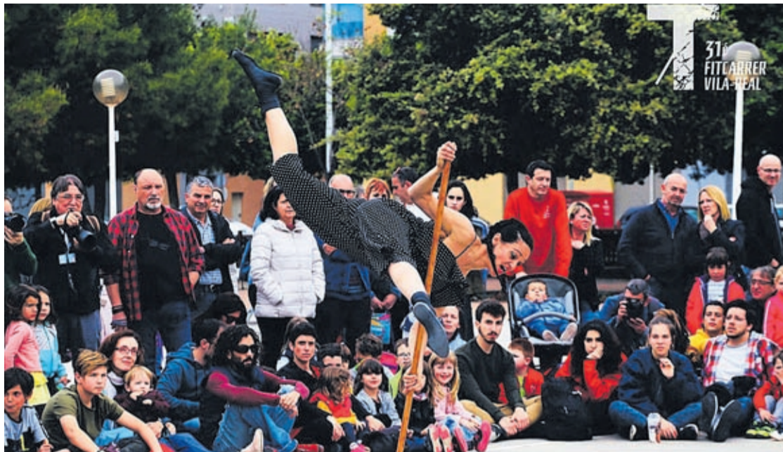
Las inclemencias meteorológicas obligaron a suspender alguna actuación pero el público pudo disfrutar del teatro.

Serralvo, por otro lado, agradeció a Pinosport su implicación en el evento. «Es un orgullo contar con empresas como esta, que se interesan en seguir fomentando algo tan importante como el deporte, haciendo de Vila-real un referente», señala el edil de Deportes.