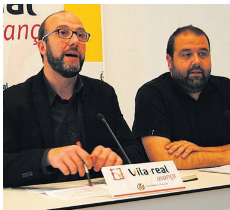
Cortells i Salmerón van parlar de la programació pels 30 anys d'activitat.

L'OAPMI-Pangea es troba al carrer de Betxi, 49 (edifici de Serveis Socials).