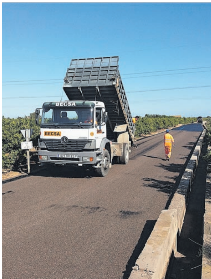
Con estas actuaciones se mejora el acceso a las varias zonas agrícolas.