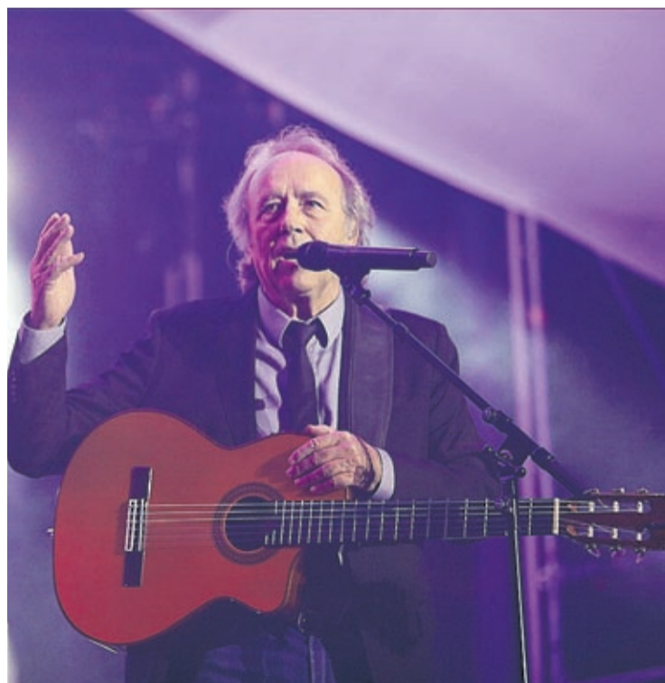
Joan Manuel Serrat va compartir escenari amb sis músics que han acompanyat el cantant «des de sempre» i que van oferir un gran espectacle.

«Del que es tractava era, no solament d'oferir als amants de la bona música l'oportunitat d'escoltar Serrat en directe, sinó, sobretot, de donar rendibilitat i viabilitat al Centre de Tecnificació, a través d'un pla pilot de