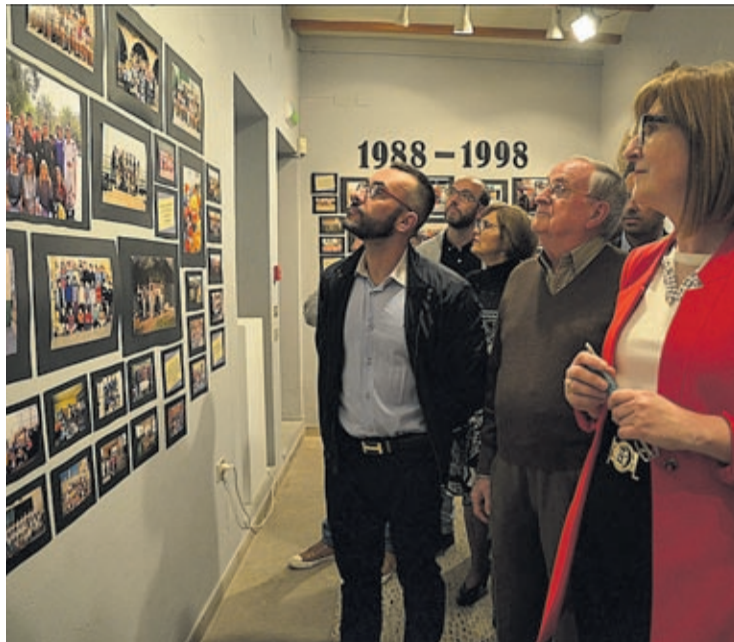
La Casa de l'Oli acogió una muestra con imágenes y material del centro.

El colegio ofrece actualmente, entre otros, la atención temprana para niños de 0 a 3 años, utili-