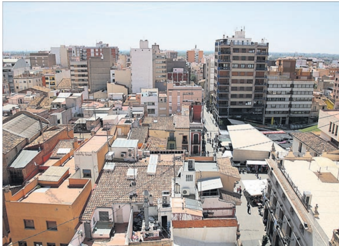
Un dels arguments de l'informe tècnic és que la ciutat està reiniciant la revisió del Pla general d'ordenació urbana.

El rebuig del consistori a aquesta proposta de revaloració es fonamenta, segons va indicar la regidora Escrig, «en els informes dels tècnics municipals, que detecten una greu dispersió de valors, en funció de la ubicació dels habitatges, la qual cosa generaria una aplicació injusta de