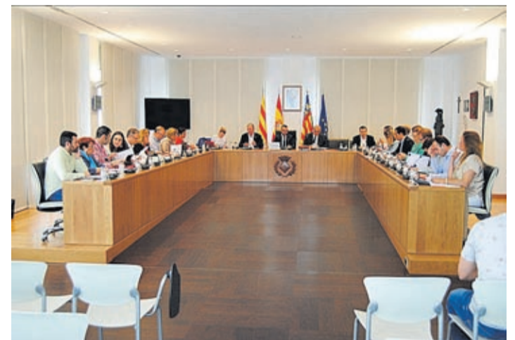
La corporació considera que hi ha motius suficients per a aconseguir-ho.

Els partits polítics amb representació a l'Ajuntament s'han unit en una declaració institucional per a sol·licitar a la Generalitat Valenciana la declaració de Festa d'Interés Turístic Provincial per a la nit de xulla.