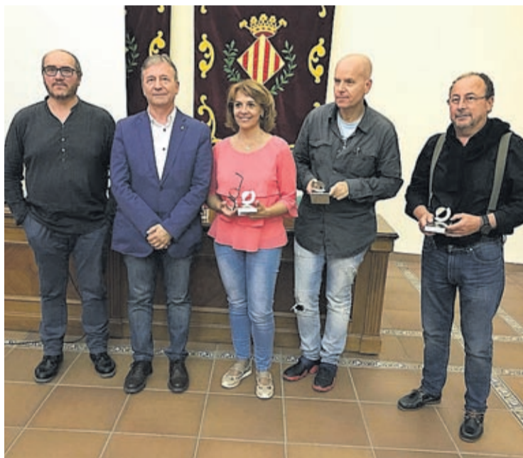
Un Jurat d'excepció va ser l'encarregat de valorar els nombrosos treballs.

A més de l'afluència de treballs a la convocatòria, el concurs destaca també pel prestigi del Jurat.enguany, van ser el perio-