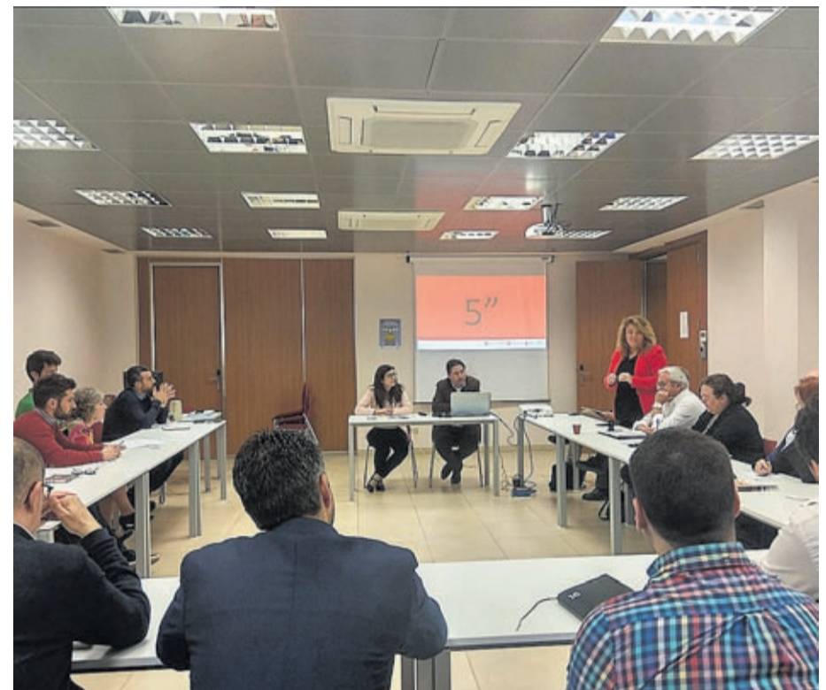
El Vivero de Empresas de la Cámara de Comercio de Vila-real ha sido el escenario del encuentro.

Una treintena de empresarios y autónomos acuden a la primera sesión