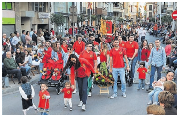
Centenars de persones de totes les edats van honrar amb flors el patró.