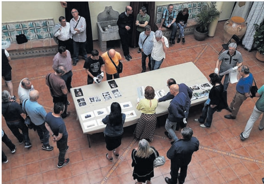
La Casa dels Mundina va acollir l'acte de deliberació de la convocatòria nacional de fotografia de l'entitat de Vila-real.