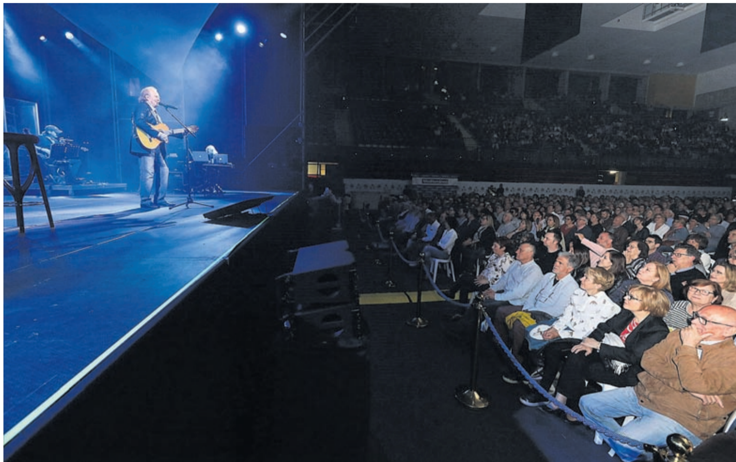
'Lucía', 'Aquellas pequeñas cosas', 'Pueblo blanco', 'Barquito de papel' o el mític 'Mediterráneo' van sonar per a fer les delícies dels fans del cantautor català.