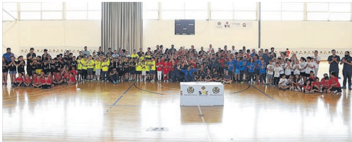
La clausura se realizó en el pabellón polideportivo Sebastián Mora, donde se entregaron los trofeos y medallas.