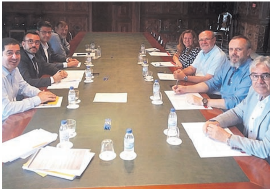
En el encuentro con responsables de la Agencia también estuvo presente el alcalde de Alcoy.