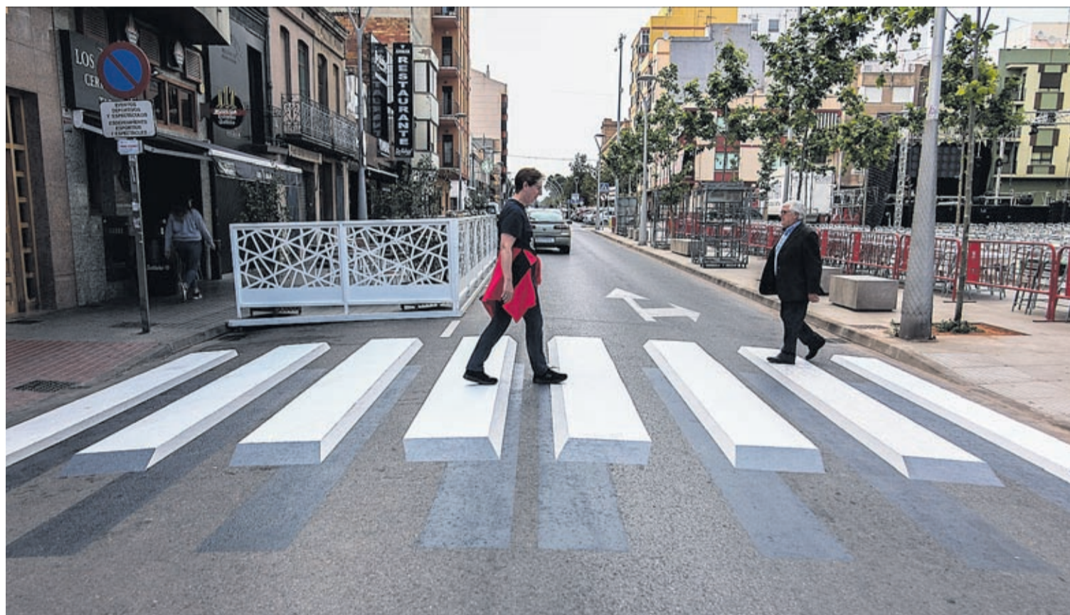
L'entorn de la plaça del Llaurador ha estat el primer espai on s'ha pintat el pas de vianants 3D, una tècnica que s'ha aplicat a municipis d'Islàndia o l'Índia.

«Els passos de vianants és una de les iniciatives sorgides del projecte de convertir Vila-real en un living-lab de les innovacions de les nostres empreses. En aquest objectiu, comptem amb quatre parts fonamentals: ciutadà, empresa, coneixement i Administració», explica la responsable d'Innovació. «El primer pas és escoltar les peticions i propostes dels veïns, a través