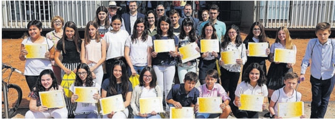
Es el quinto año consecutivo que se celebra esta entrega de los premios extraordinarios al rendimiento académico.

Además, la BUC acogió el acto de entrega de los premios extraordinarios al rendimiento académico, que otorga la Conselleria de Educación a los mejores expedientes académicos de la Comunitat. Es el quinto año consecutivo que se celebra esta cita, donde se han entregado galardones a 24 estudiantes (21 de Primaria y tres de ESO) de los centros Fundació Flors, Consolación y Virgen del Carmen (ESO) y en Primaria al alumnado de Angelina Abad, Botànic Calduch, Carles Sarthou, Cervantes, Concepció Arenal, Escultor Ortells, Pasqual Nàcher, Pintor Gimeno Barón, Pius XII, Consolación y Virgen del Carmen.