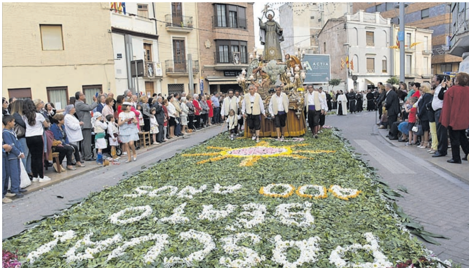
Milers de veïns van acompanyar la imatge del patró pel recorregut de la tradicional processó per alguns dels carrers més cèntrics de la localitat.

En el balanç policial, les festes s'han saldat amb la impressió de normalitat, malgrat la gran afluència de visitants. Les queixes per molèsties de les penyes s'han reduït enguany (50 enfront de les 65 de l'any anterior). Sí que s'han interposat més denúncies per molèsties al veïnat: 14 per horari i traure aparells de megafonia al carrer amb excés de soroll, cosa que contrasta amb 2017, quan no va haver-hi cap denúncia, «ja que en el primer avís cessaven les molèsties». El mateix passa amb les denúncies per embrutar la via pública, que han sigut dues. No obstant això, en aquesta ocasió no s'ha interposat cap sanció per venda ambulants, enfront de les vuit de 2017.