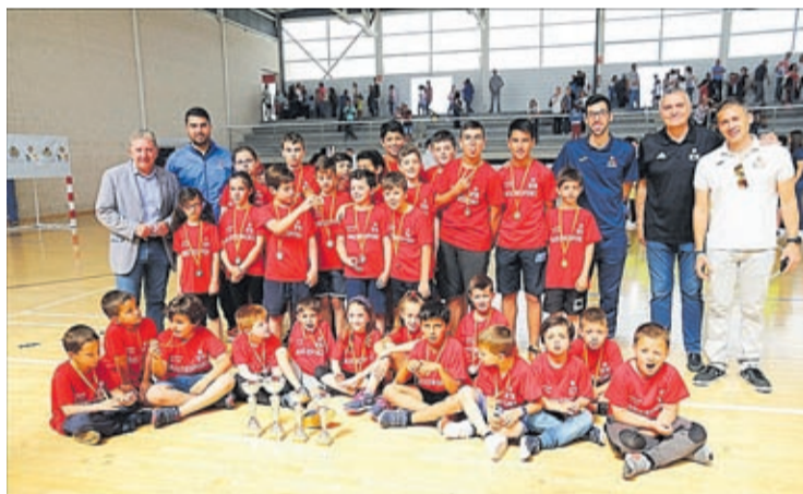
El colegio campeón del curso 2017-2018 ha sido Angelida Abad.

La actividad del deporte escolar se completa con el programa de natación para alumnos de cuarto de primaria, que han acudido a la piscina una hora cada semana con el objetivo de familiarizarse con este deporte y participar en