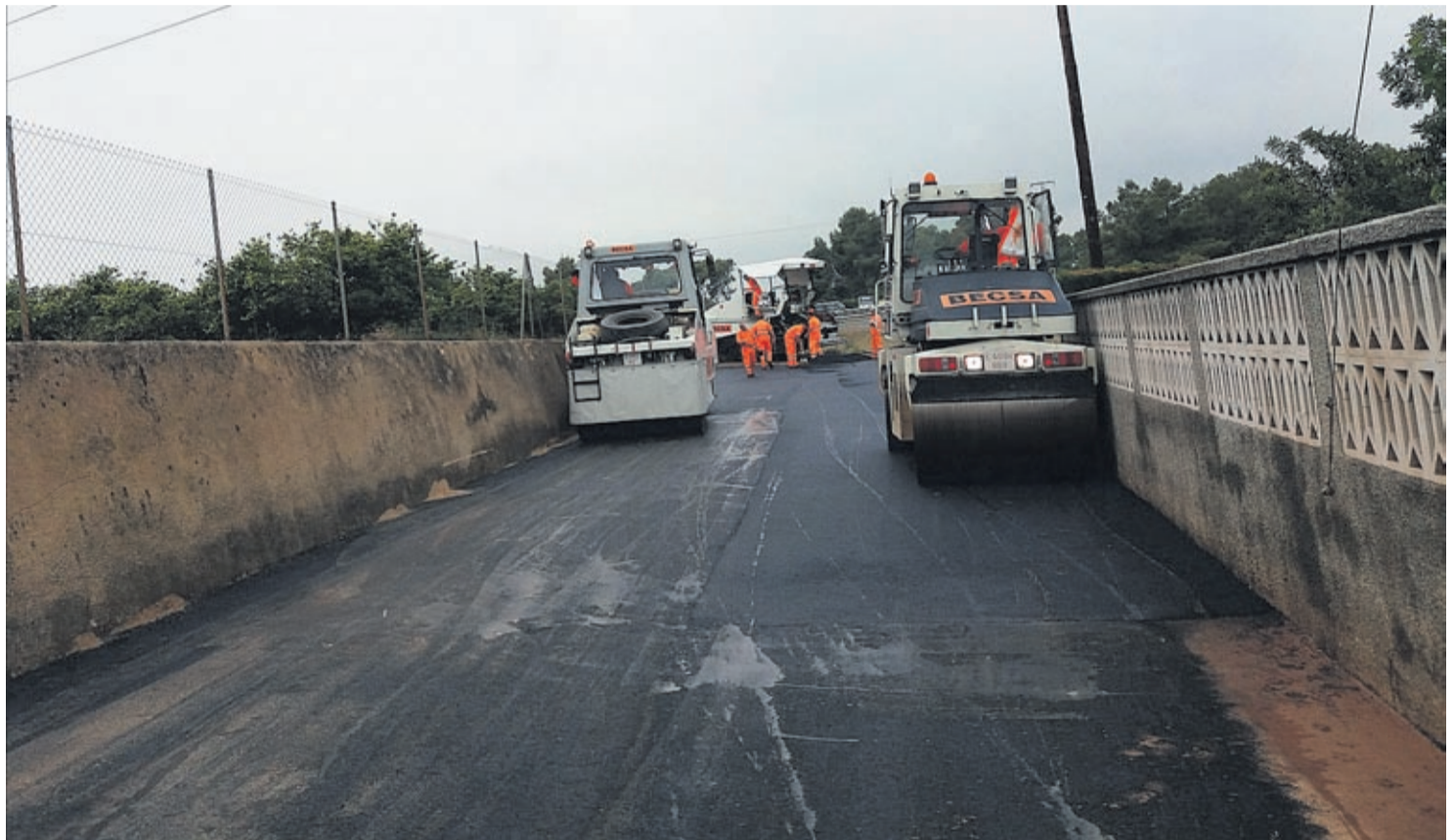
Algunos de los caminos del término municipal que se han mejorado han sido Sant Jordi, Na Boneta, Tercer y Quart Sedeny, Molí la Roqueta y Assagador.

Con estas actuaciones, la seguridad y la vialidad de los distintos caminos y vías rurales se ha reforzado y también se ha contribuido a conseguir una mejora de acceso de los vehículos a las zonas agrícolas de la localidad.