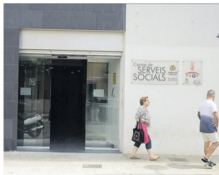
S'impulsarà un programa de Serveis Socials amb 14 nous professionals.

■ Benlloch apunta que aquest pressupost, que encara no s'ha aprovat pels empastres del PP, és «l'únic possible»