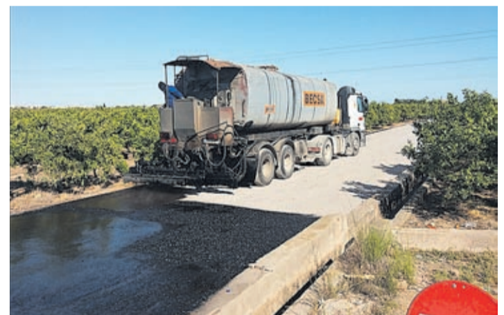
BECSA realiza un completo trabajo de mejora de las superficies.