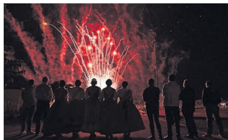
Un correfoc i el castell de focs van concloure 10 dies d'intensa activitat.