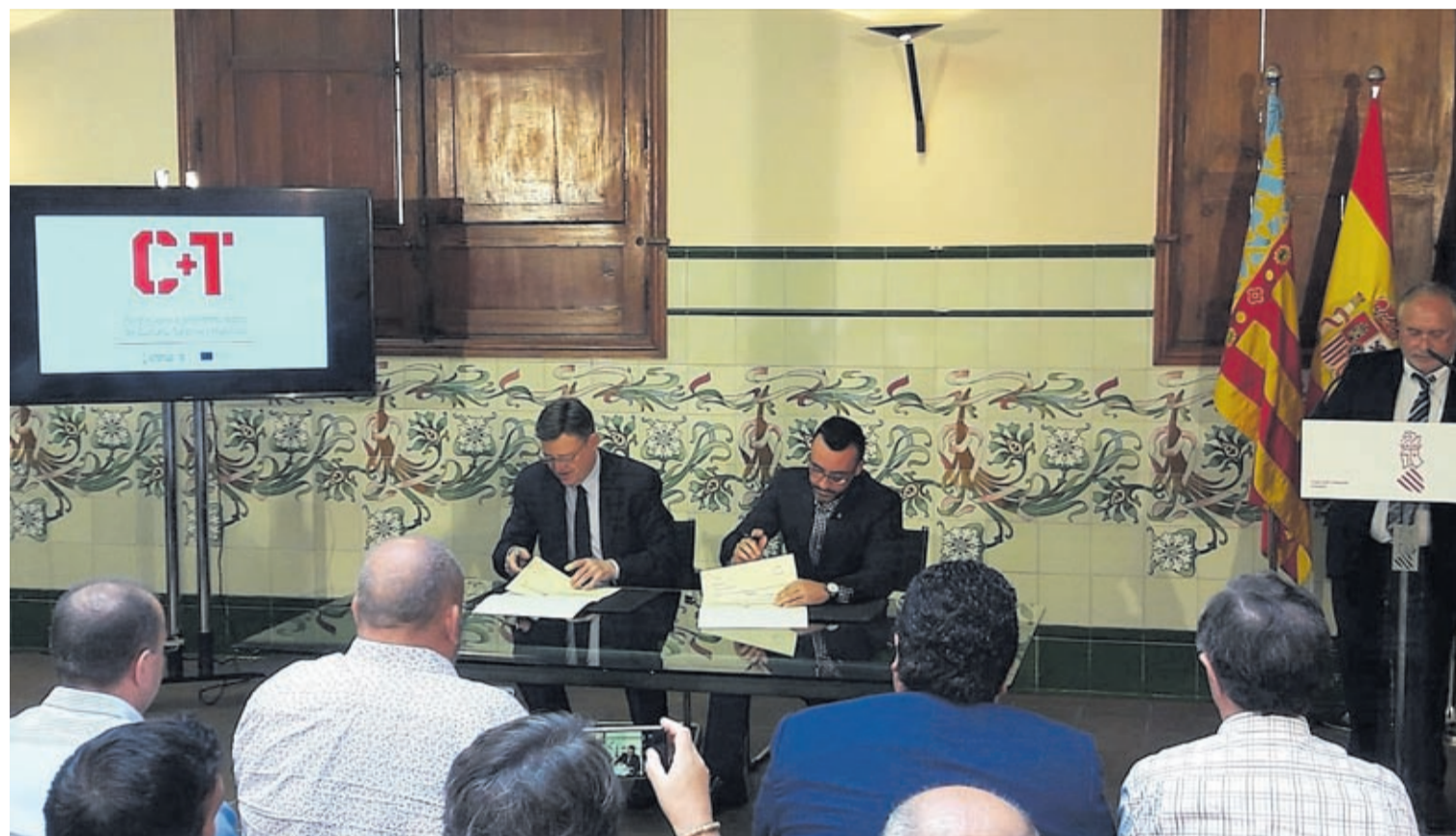
En un acte que ha tingut lloc a la Casa dels Caragols de Castelló, Puig i Benlloch han rubricat l'acord pel qual la ciutat rebra dues subvencions econòmiques.

El primer edil agraeix les gestions realitzades per la Regidoria de Territori, juntament amb un equip de tres arquitectes del projecte T'Avalem, per a la consecució d'aquestes ajudes. «Aquesta concessió representa tenir ja preparada la institució per a afrontar nous projectes europeus, ja que durant el govern del PP, que