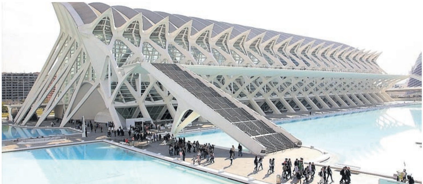
La Ciutat de les Arts i les Ciències de València tiene mucho que ofrecer al visitante durante los meses de verano, gracias a un programa muy variado.

Y además, Travelling Bricks , la novedad del verano en el Museu de les Ciències, desde el 4 de julio. Una exposición de 800 metros cuadrados donde conocer la historia de los avances científicos relacionados con el transporte a través de 120 figuras y maquetas de gran formato realizadas con piezas de Lego, entre las que destacan maquetas del Titanic, un zepelín o la nave espacial Carl Sagan , e incluye una