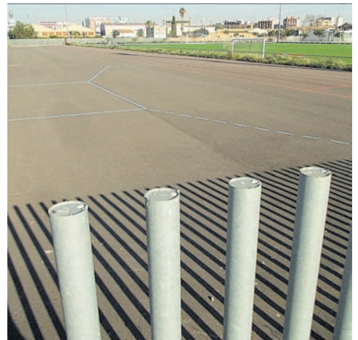
Espai que ocuparà la pista a la CEM, que setembre complirà dos anys.