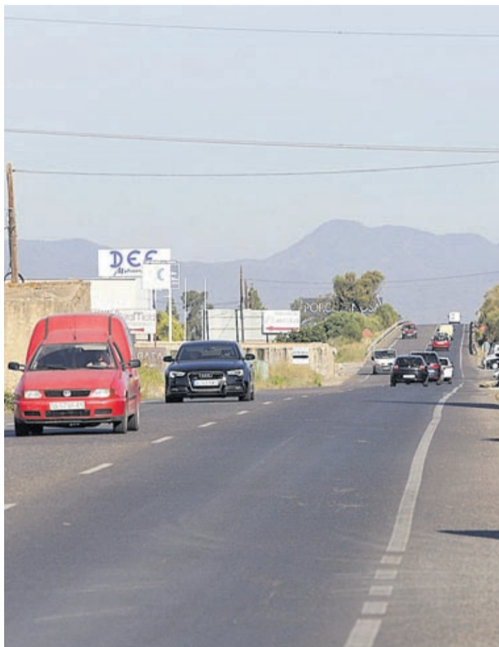
Uno de los proyectos más destacados, por su necesidad, es vial a Onda.

Consideran que son unas obras «vitales» para garantizar el desarrollo de las zonas industriales. Las iniciativas presentadas se llevarán a cabo en los próximos dos años, ya que el dinero se recibirá en dos anualidades: 1.308.459,51 euros este 2018; y los restantes 1.840.020, 45 el próximo año. Intervendrán en una superficie de 2.478.410 metros cuadrados.