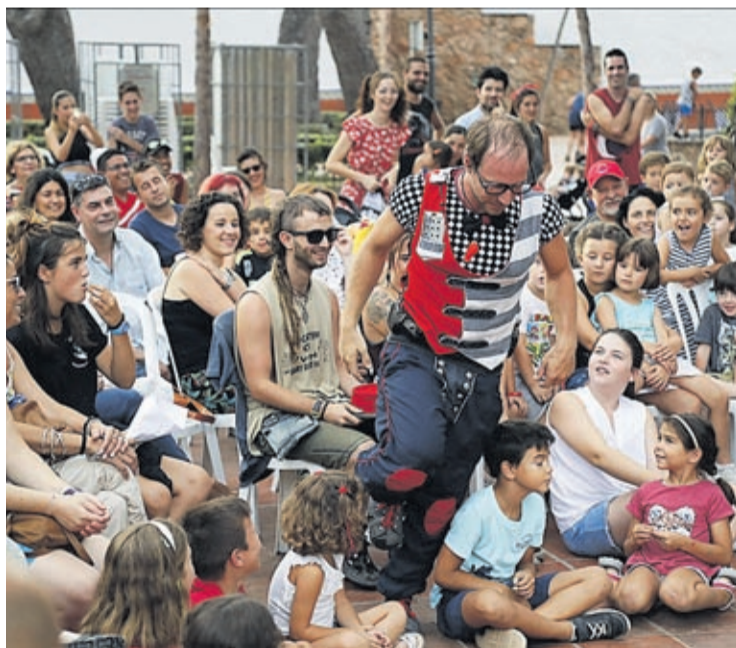
És una cita multidisciplinària amb música, olimpíades, malabars i tallers.

La segona jornada, el dissabte 14, va oferir activitat tot el dia. «Als tallers de circ i màgia que van tenir durant el matí, a la vesprada es van sumar espectacles de reconeguts artistes i agrupacions, sense oblidar la Gran Gala Malabara't, entre altres esdeveniments», indica Martín. El diu-