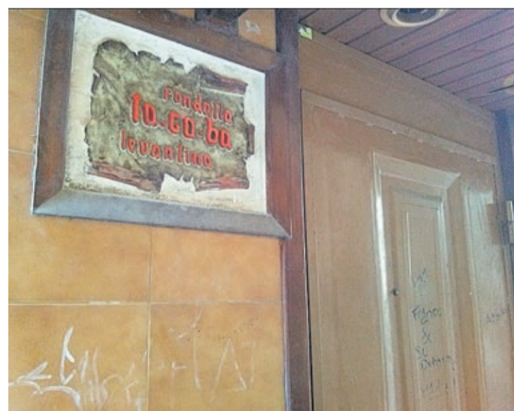
La Tagoba tindrà un caràcter cultural amb sales d'exposicions i d'actes.

estava a altres coses, mai es va apostar per aquesta línia», indica i valora que «aquest procés ens ha servit d'aprenentatge i ara ho convertirem en experiència».