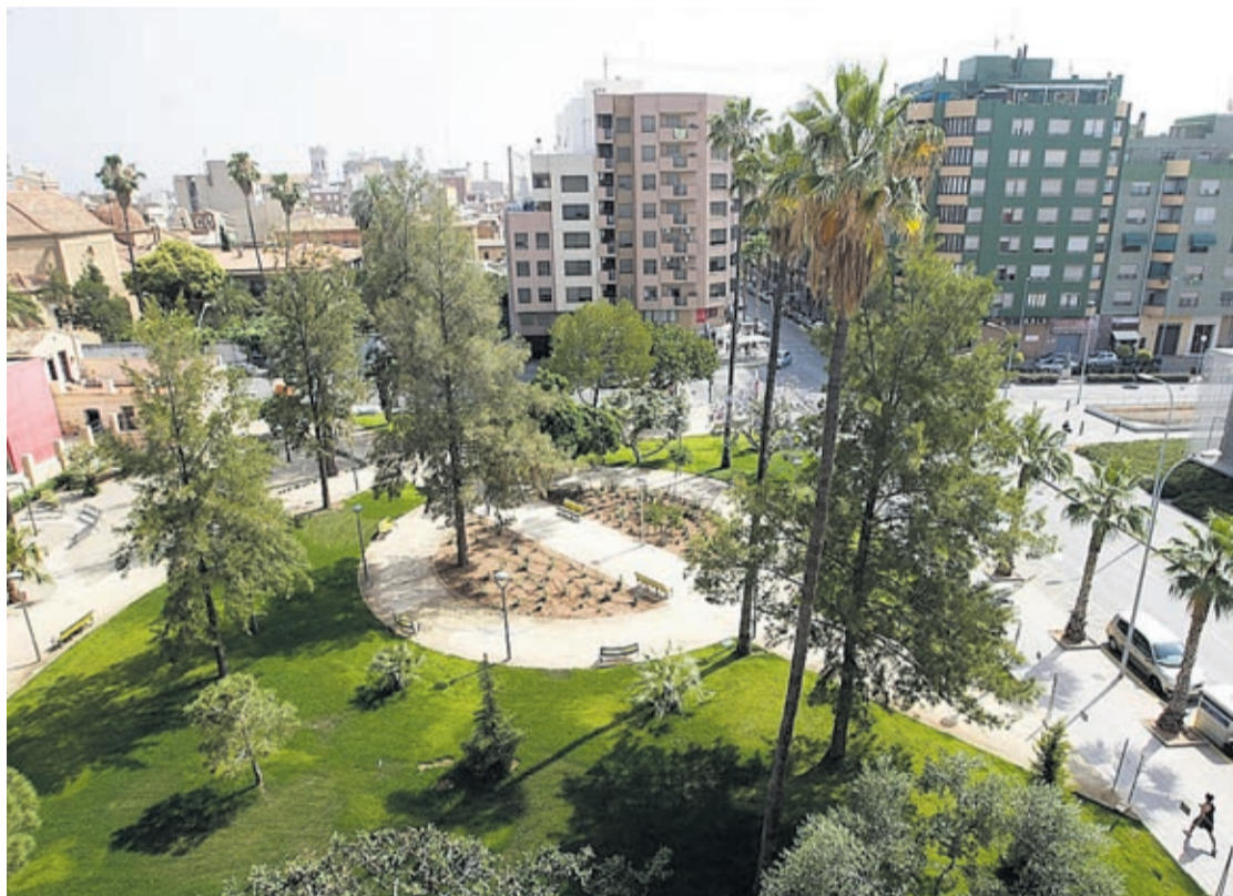
El convenio urbanístico fijaba que la orden tenía derecho a obtener 14.000 metros de techo a cambio del terreno.

Así, ha recordado que en 2010 se firmó un documento en el que se manifestaba la intención del Ayuntamiento de adquirir toda la manzana donde se ubica el convento -ahora museo-, la capilla barroca del Cristo del Hospital, y el jardín exterior, tras expresar las monjas su intención de abandonar la ciudad.