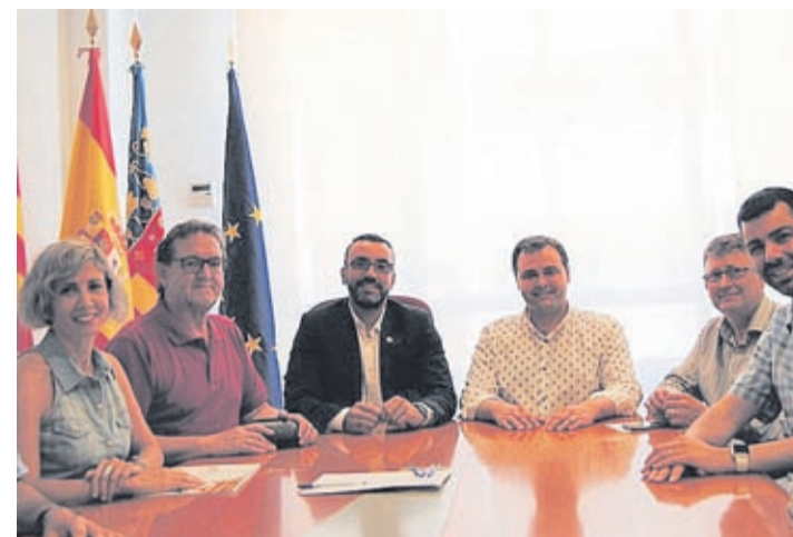
Encuentro entre responsables municipales y de la asociación.

En el proyecto ha colaborado la Asociación Española Contra el Cáncer (AECC).