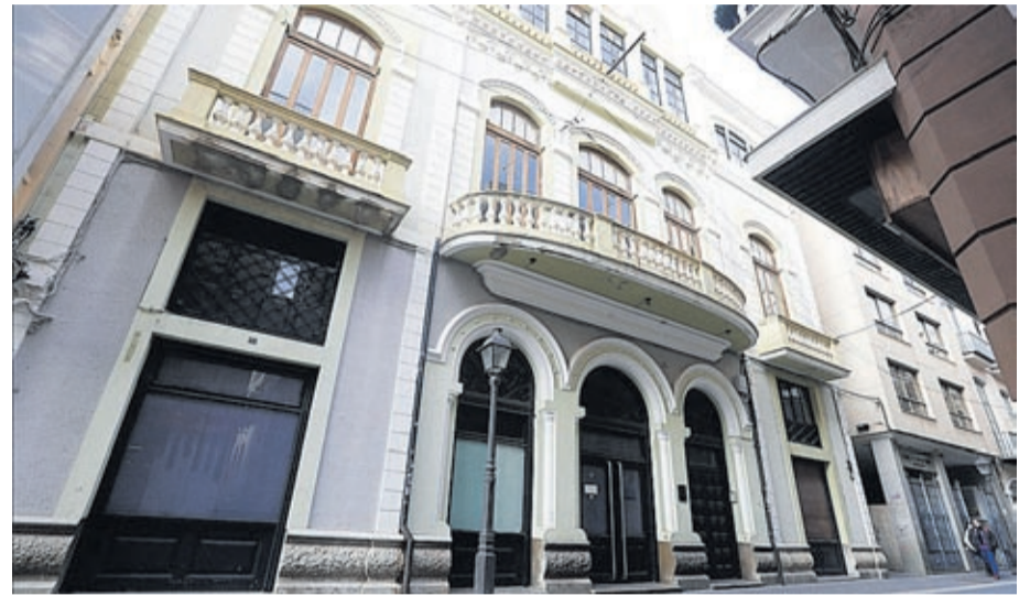
A l'edifici, adquirit fa uns anys per l'Ajuntament, es traslladaran serveis per a la ciutadania.

La rehabilitació de l'espai està pressupostada en uns 630.000 euros