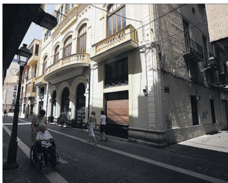
El Gran Casino acollirà, després de les obres, alguns serveis municipals.