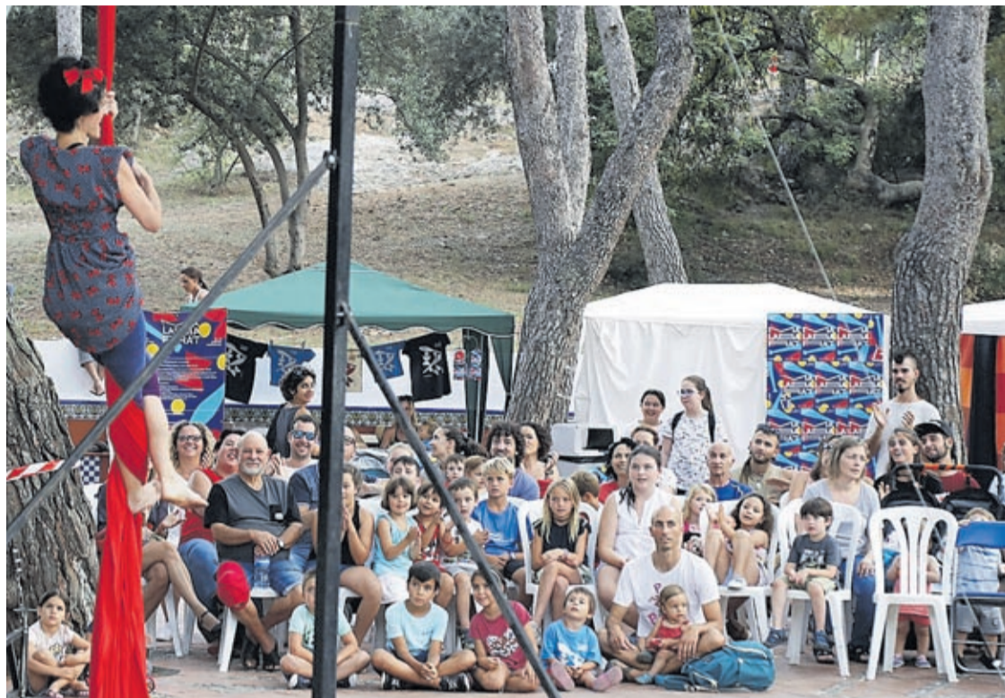
El Festival Malabara't va programar actuacions i espectacles d'artistes de tot el món per a delit del públic assistent.