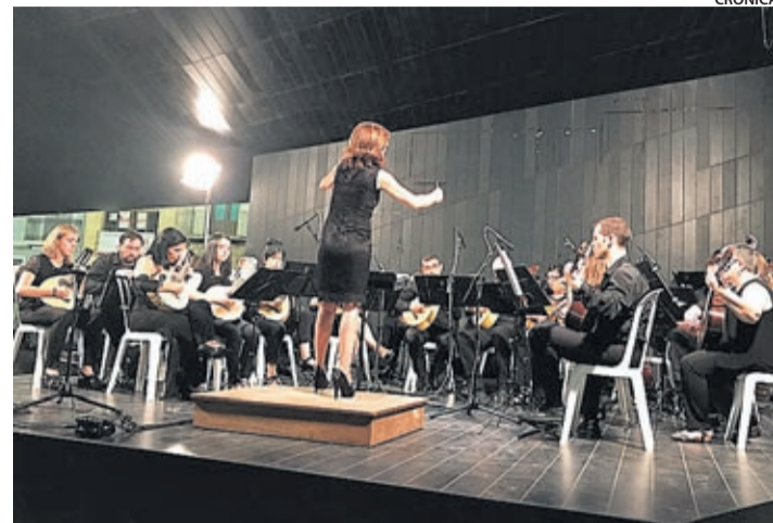
Els amfitrions, la Francesc Tàrrega, va realitzar l'actuació a la plaça Major.

Com consta en el web de l'esdeveniment, malabarat.com , l'entitat va presentar en aquest moment un projecte per a crear una trobada de circ en el territori valencià. Amb l'ajuda d'entitats i professionals que van regalar «el seu treball per amor a l'art», va sorgir Lánzalo! AMACA aconseguia amb això el seu objectiu de realçar més aquesta disciplina en la cultura i sobretot a la província de Castelló. Vila-real, afirmen els organitzadors, forma part del mapa del circ europeu.