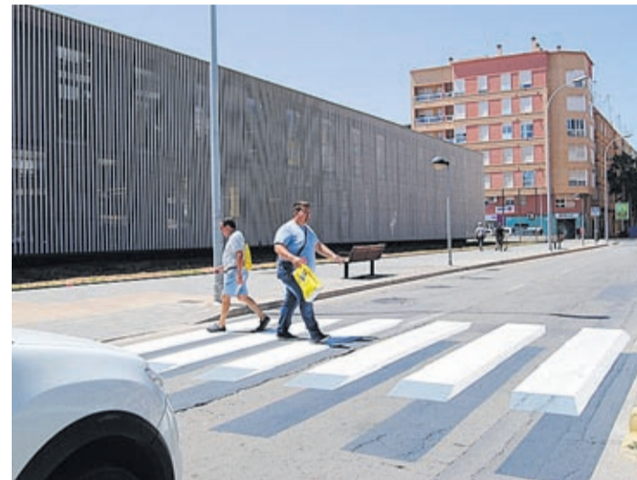
La ciudad ya dispone de dos pasos 3D, uno de ellos en la avenida Pius XII.

Tras la buena acogida de la aplicación de los dos pasos de peatones 3D -uno en la calle Ermita y otro en la avenida Pius XII-, un proyecto persigue llamar la atención de los conductores y obligarles a reducir la velocidad sin necesidad de crear un resalto, mejorando la seguridad del tráfico y de los peatones, llegan ahora los inteligentes. Así pues, el Ayuntamiento instalará, en un nuevo proyecto pionero, pasos de cebrá que se iluminarán de forma autónoma cuando detecten la presencia de los viandantes en sus proximidades. El sistema incorpora la iluminación con tecnología led en el asfalto que alerta de la presencia de personas.