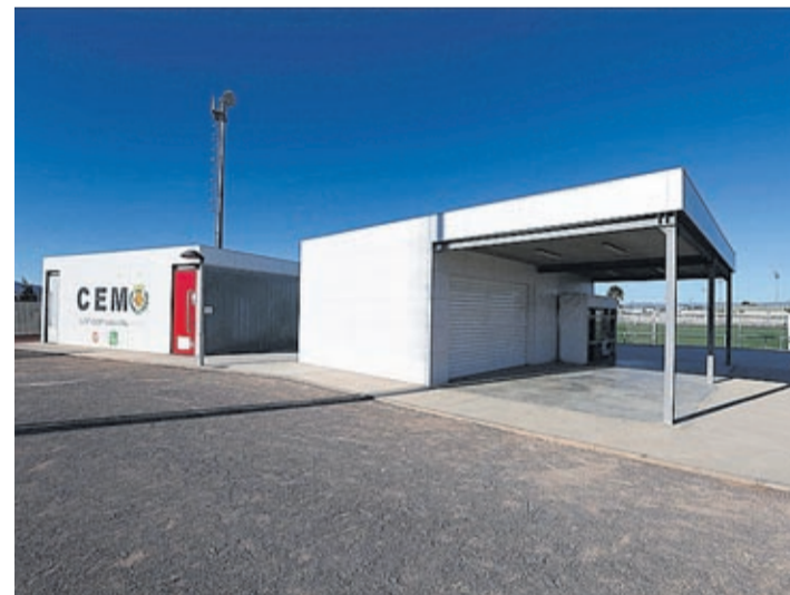
El Ayuntamiento ya realizó hace meses algunas intervenciones el local.

«Esperamos que, una vez los adjudicatarios preparen a su gusto el recinto, a lo largo del mes de agosto ya pueda estar en activo la cafetería, que completa así un espacio deportivo del que ya hacen uso miles de ciudadanos, que hemos mejorado y que en breve, además, contará con la tan esperada pista de atletismo –más información en la página 7», manifiesta Serralvo que añade que «también esperamos que con este nuevo servicio los usuarios estén más satisfechos».