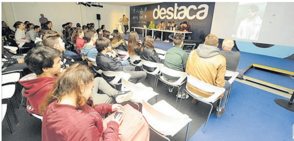
La fira de transferència tecnològica Destaca tornarà a reunir un nombrós públic, tant professionals com investigadors.

Congrés Internacional de Futbol (185); el Congrés de Psiquiatria i Noves Tecnologies (120); el Congrés d'Especialitats Hospitalàries (110), i European Master in Business Studies (120). «També hem col·laborat amb el torneig de futbol femení Girl's Cup, amb 800 assistents, i amb la marxa solidària d'Aspanion, amb 1.200 participants», diu l'edil.