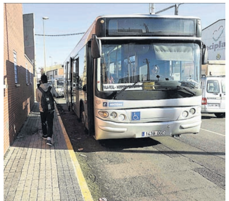
Es vol un transport públic de qualitat que afavorisca no usar el vehicle privat.

Afavorir l'ús de la bicicleta, aconseguir una distribució urbana de mercaderies i productes àgil i ordenada o impulsar la intermodalitat per a aconseguir un ús eficient de les diferents maneres de transport són altres línies que fixa l'estudi.