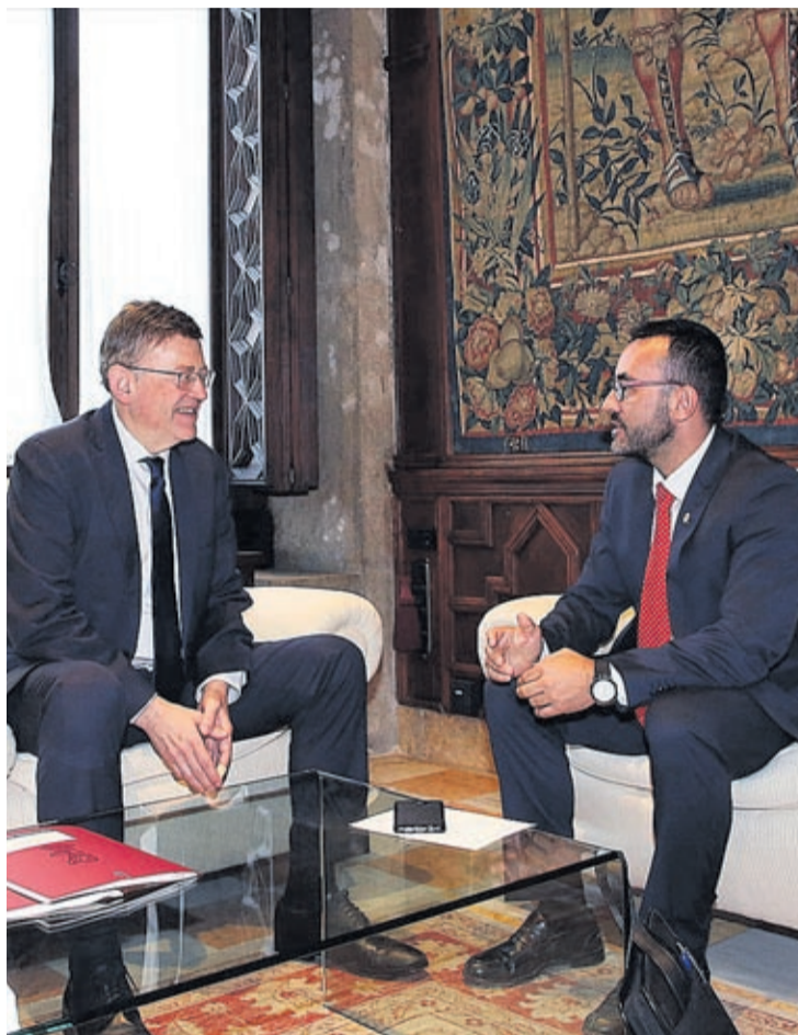
El presidente autonómico y el alcalde en un momento de la reunión.