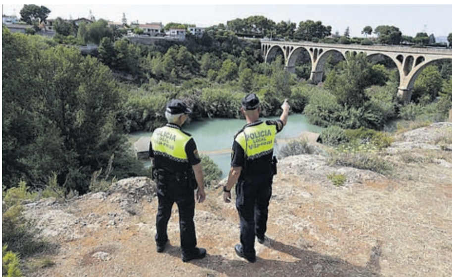
La Policia Local ha incrementat la vigilància per a evitar la presència de persones a la zona.

■ L'objectiu de la trobada va ser conscienciar-los de la imprudència que cometen per llançar-se a l'aigua en aquests punts del Millars