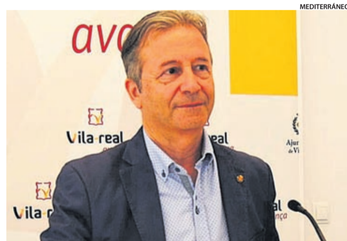
El regidor de Cultura va detallar els eixos destacats del pressupost actual.