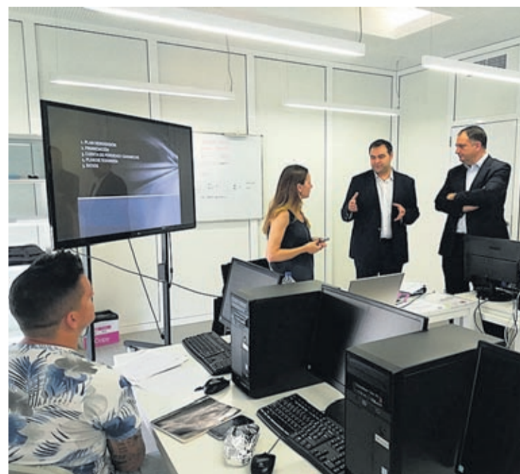
La BUC ha acogido algunas de las sesiones previas del programa de formación

Información e inscripciones en http://portaltreball.vila-real.es .