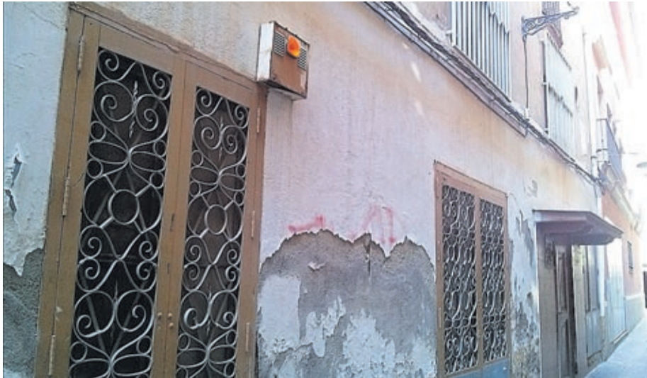
L'immoble, de principis del segle XX, serà un espai que donarà cabuda a iniciatives culturals.