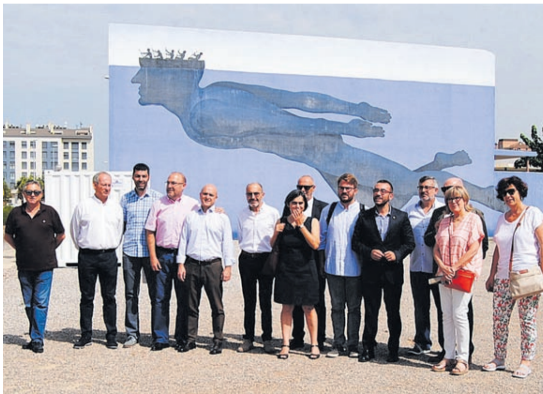
Responsables municipals, autonòmics i de l'entitat van visitar l'espai que ocuparà el centre en uns mesos.