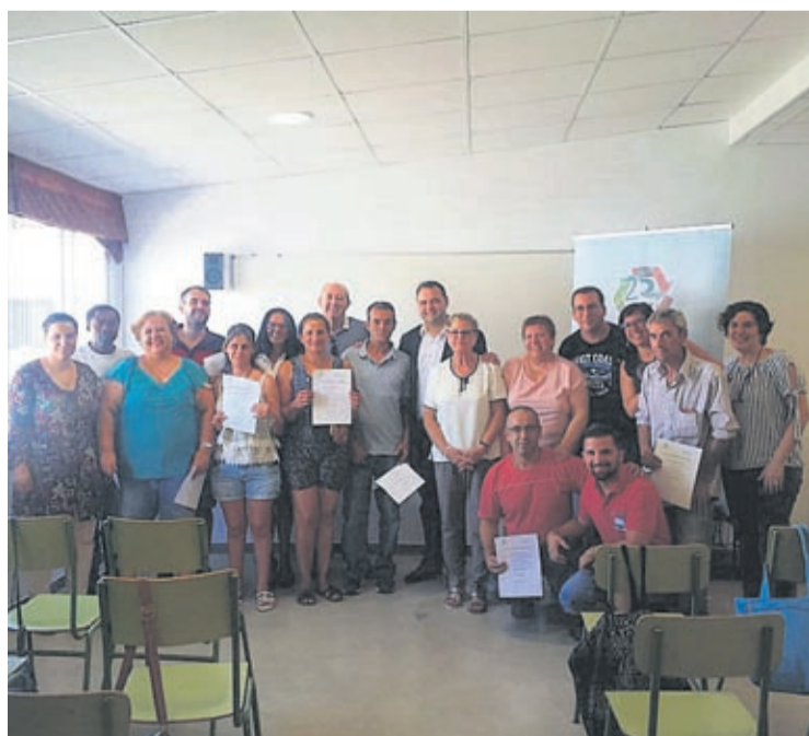
Ochando asistió al acto de despedida de los beneficiarios de la formación.