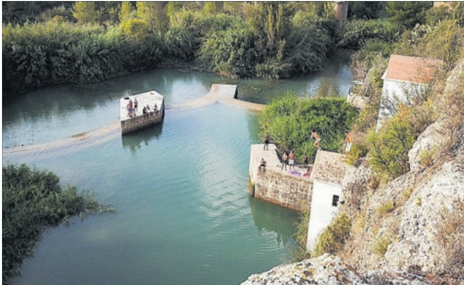
Un informe del Consorci del Millars alerta del perill de banyar-se en infraestructures hidràuliques.