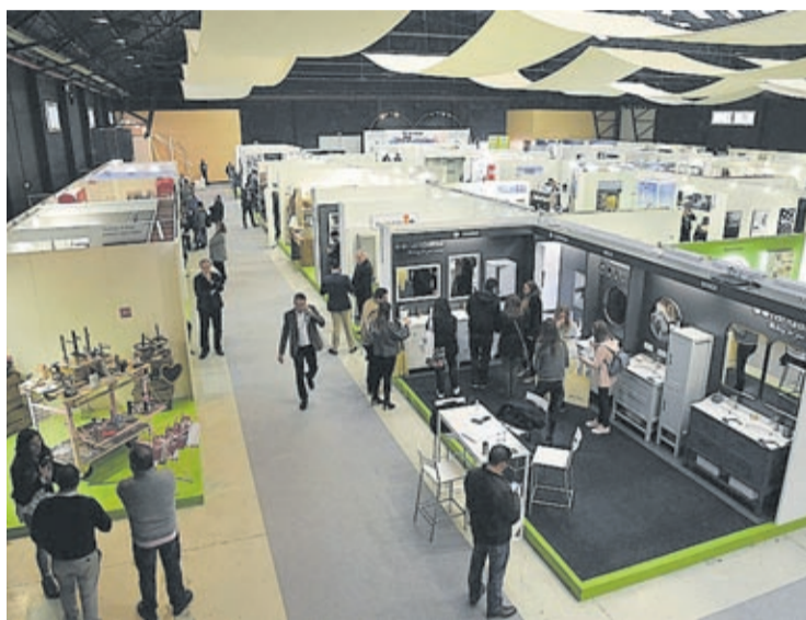
La Fira de Proveïdors de Leroy Merlin ha estat un dels actes més participatius.

Al llarg de l'any s'han celebrat les Jornades d'Alumnes Mediadors, amb 1.890 assistents; el Congrés Iberoamericà de Mediació Policial, amb 750; la Fira de Proveïdors de Leroy Merlin (4.500); el Simposi Internacional de Naturalesa i Fotografia (350); el VII Meeting on Economics (150); el