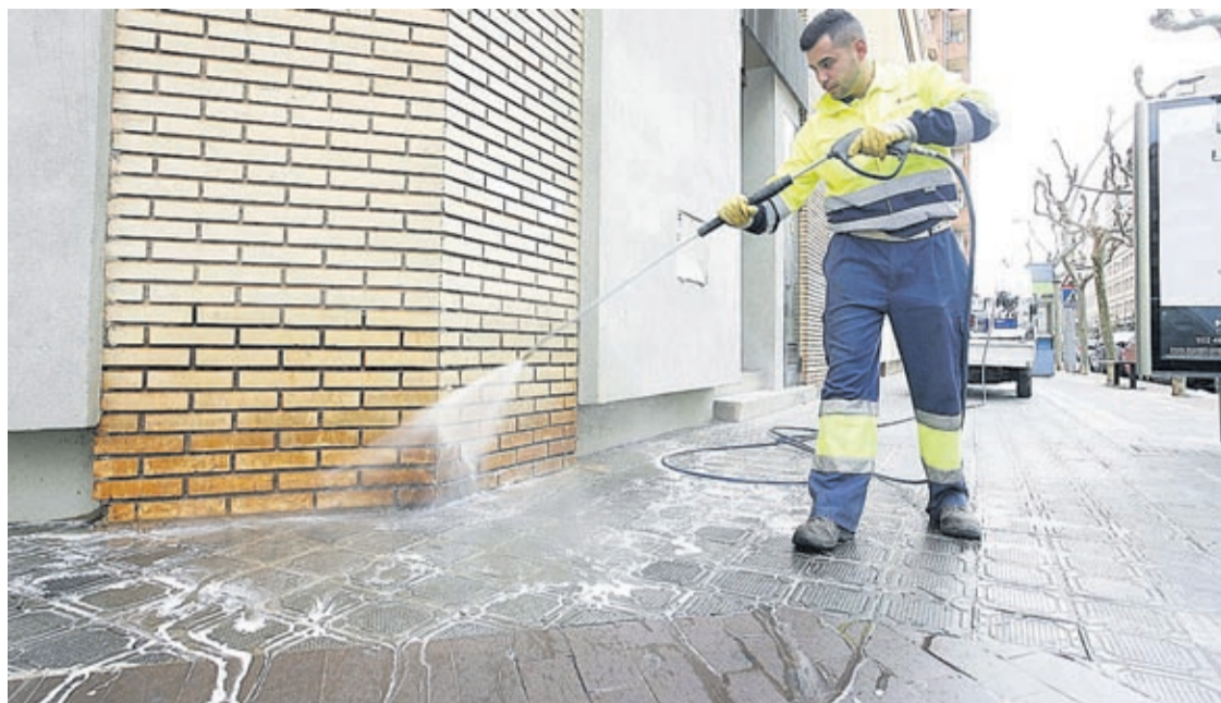
La limpieza de edificios públicos, la limpieza viaria o la recogida de basuras, los suministros con mayor inversión.