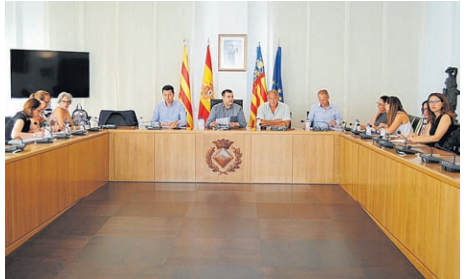
Representants de les diferents associacions que conformen la Mesa en una de les reunions.