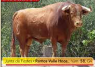
Junta de Festes • Ramos Valle Hnos., núm. 58, G4