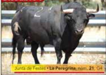
Junta de Festes • La Peregrina, núm. 21, G4