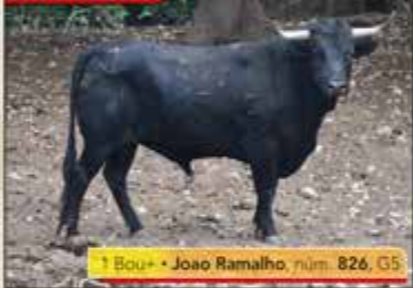
1 Bou+ • Joao Ramalho, núm. 826, G5