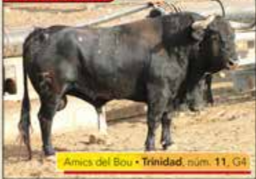
Amics del Bou • Trinidad, núm. 11, G4