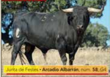
Junta de Festes • Arcadio Albarrán, núm. 58, G4