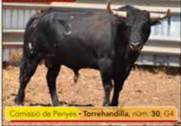
Comissió de Penyes • Torrehandilla, núm. 30, G4