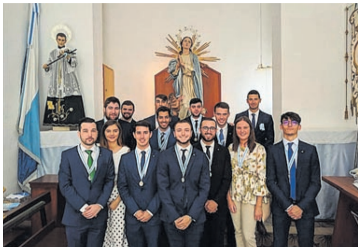
Els Lluïsos también ha celebrado sus festejos anuales.

Entre el abanico de actos no pueden faltar los gastronómicos como concursos de paellas, torràs de sardina, chocolatadas o