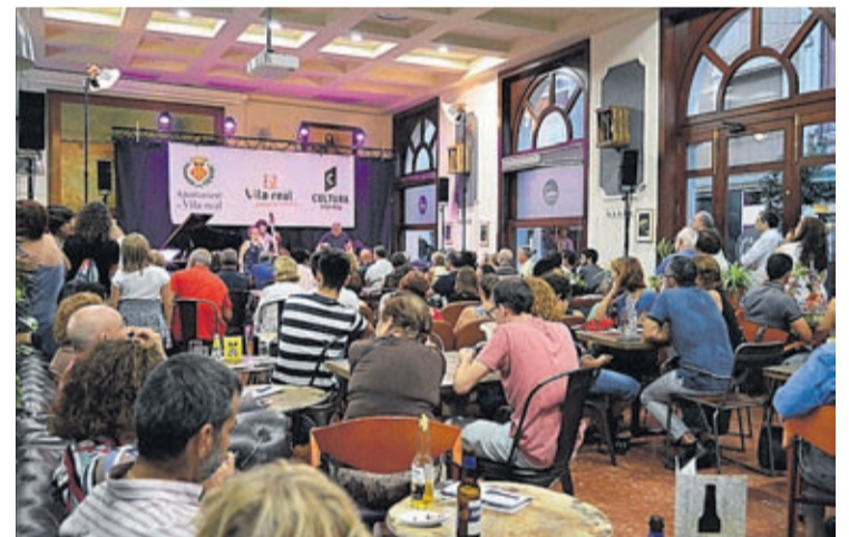
Todas las actuaciones contaron con una gran afluencia de público.

figuras más representativas del jazz valenciano, una figura histórica y referencia internacional, que supondrá el gran colofón final a esta tercera edición de Real Jazz», concluye Colonques.