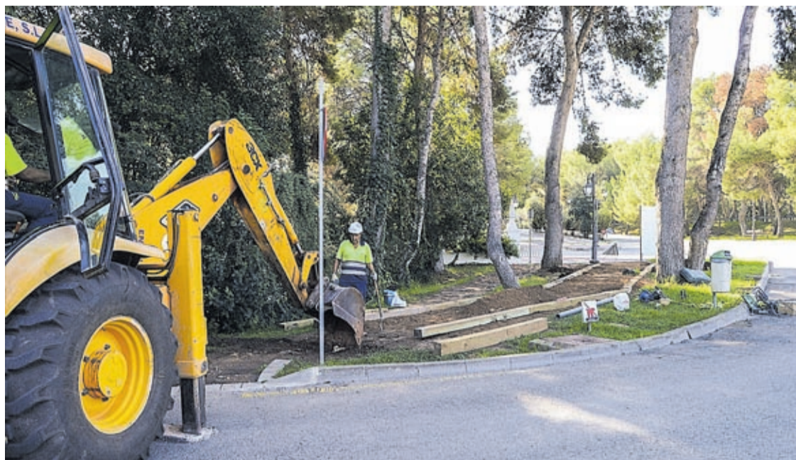
El circuito de 'running' fue construido en 2014 y, desde entonces, son muchas las personas que lo utilizan.