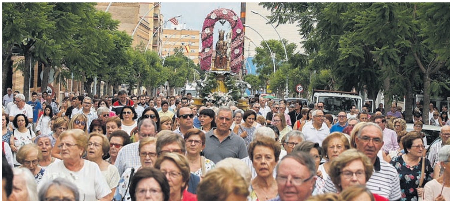
Després de l'ofrena a l'església Arxiprestal per part d'autoritats així com reina i dames, la imatge de la Mare de Déu de Gràcia va tornar a la seua ermita.

■ Un total de 497 són els casals registrats, com obliga la normativa des de fa uns anys, a l'Ajuntament. D'aquests, sols un de cada cinc forma part de la Comissió de Penyes, de manera que d'alguna manera «van per lliure», com apunten des d'aquest col·lectiu que valora de forma positiva l'anunci de crear una comissió de treball per a elaborar la nova normativa. No obstant això, des de l'organització festiva no amaguen el temor que les noves iniciatives incloguen que els casals hagen d'abandonar el centre i, més concretament, el recinte de la vila. Un temor que l'alcalde, José Benlloch, ha dissipat ja que assegura que el que es pretén és compatibilitzar el dret al descans del veïnat amb aquest tipus d'espais. En aquest sentit, el consistori aposta per establir uns límits de sorolls més severs, així com d'incidir en la neteja de la via pública i la salubritat dels locals amb sancions «més importants» que les actuals que no superen els 600 euros i, a més, s'incidirà en la responsabilitat del titular del local.