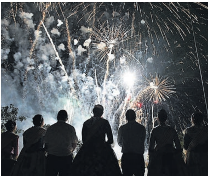
La traca, el correfoç i el castell de focs d'artifici van marcar el final de les festes.