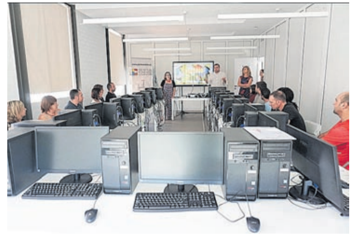
La formación cuenta con 50 horas de teoría y 60 de prácticas no laborales.