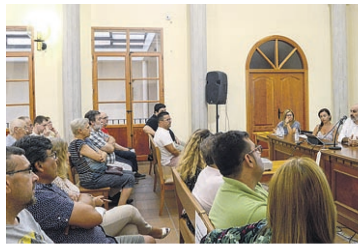
La Casa dels Mundina acogió una de las sesiones sobre el PMUS.

El 4 de octubre está previsto, a las 19.00 horas, un taller global sobre el proyecto en l'Espai Jove.