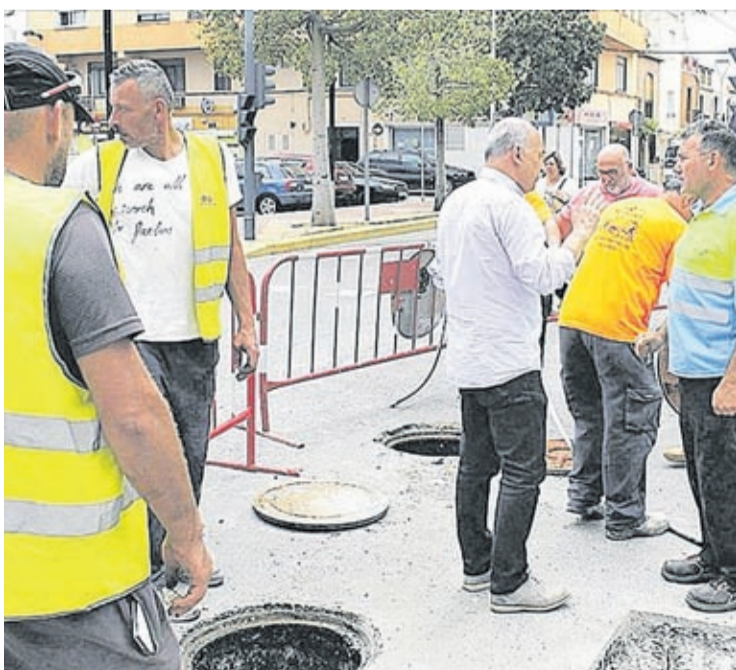
El uso de las nuevas tecnologías permitirá actuar en las canalizaciones.

El consistorio ha sacado un concurso, por 180.000 euros y un año de plazo, para reformar pasos de peatones y construir otros nuevos para hacer posible la accesibilidad en el casco urbano.