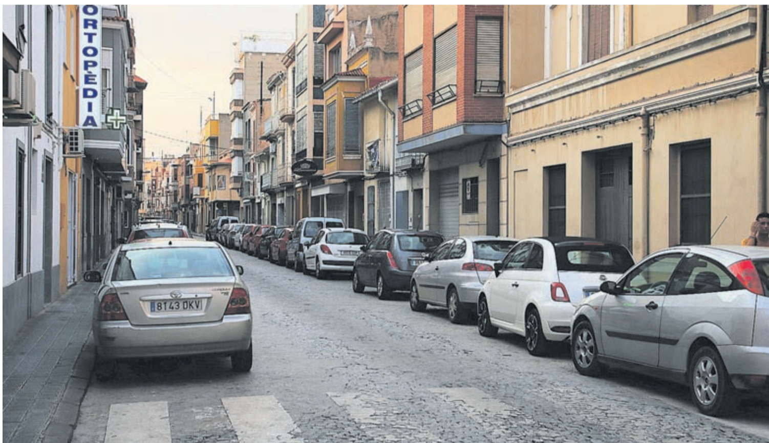
Les queixes veïnals per l'activitat de les penyes se centren en vials com el carrer del Salvador, Santa Anna, Sant Joaquim o Tremedal, entre d'altres.