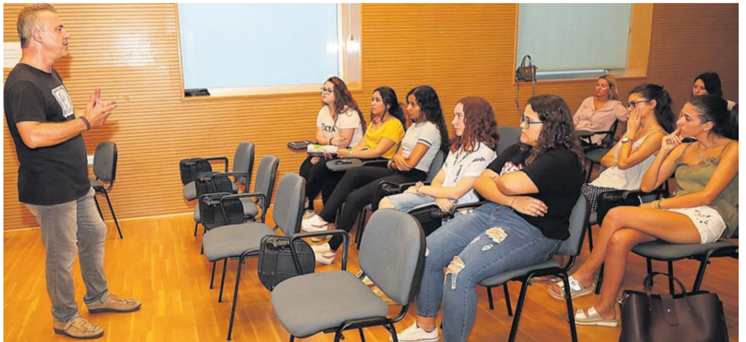
La convocatòria té com a objectiu incorporar penyistes d'entre 14 i 35 anys a un projecte amb continuïtat en el temps per a la prevenció de riscos pel consum.

«Tots els integrants aprendran a actuar de mediadors en situacions en les quals la convivència estiga en perill i ajudaran a afavorir la comunicació i la bona