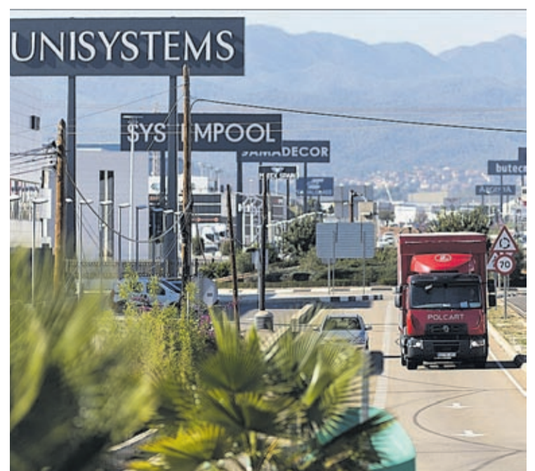
La sesión incide en la labor de las azulejeras para evitar la aparición de legionela.