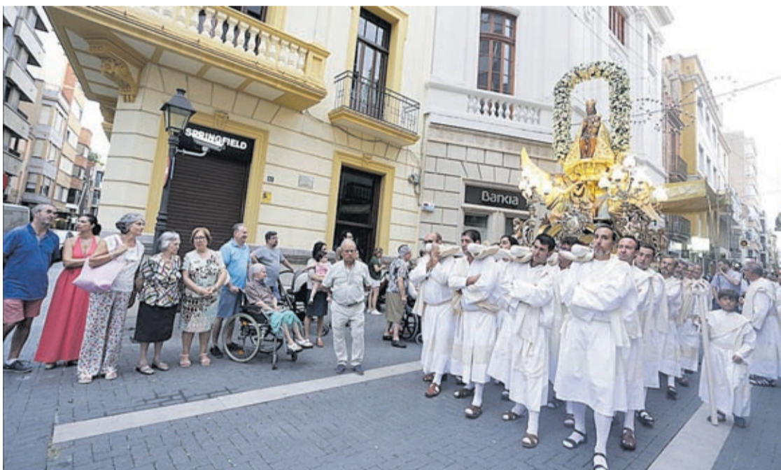
La ciutat va retre homenatge a la patrona amb la missa solemne a l'església Arxiprestal, seguida per la processó.

«Encara que ha sigut difícil organitzar les festes, hem seguit