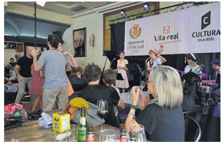
Algunas parejas se animaron a bailar durante la actuación de Nina Dinamita.

Jazz, «permite dar visibilidad a la presencia femenina en el jazz, con mujeres como instrumentalistas». El colofón del festival llegó a las 20.00 horas del domingo con Perico Sambeat plays Zappa . «Perico Sambeat es una de las