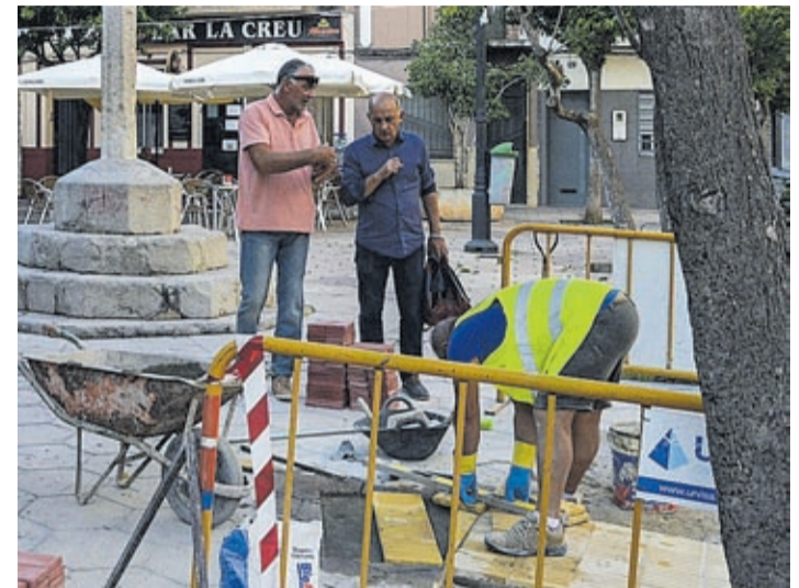
La obra permite hacer accesible la plaza desde las calles que la bordean.