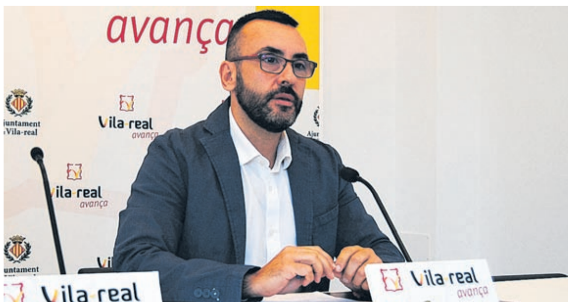
Benlloch espera disposar de les conclusions en un màxim de tres mesos i aprovar el document abans de maig.

na, Festes i de Participació Ciutadana, la Junta de Festes i la Comissió de Penyes i tots els partits polítics del consistori.