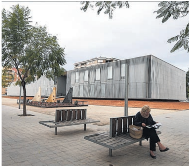
La BUC es uno de los espacios que cobra fuerza para trasladar la sede.

«No podemos olvidar que la EOI llega a Vila-real gracias a la reivindicación histórica del Ayuntamiento y la comunidad educativa, pero también gracias a la voluntad del Consell de crear