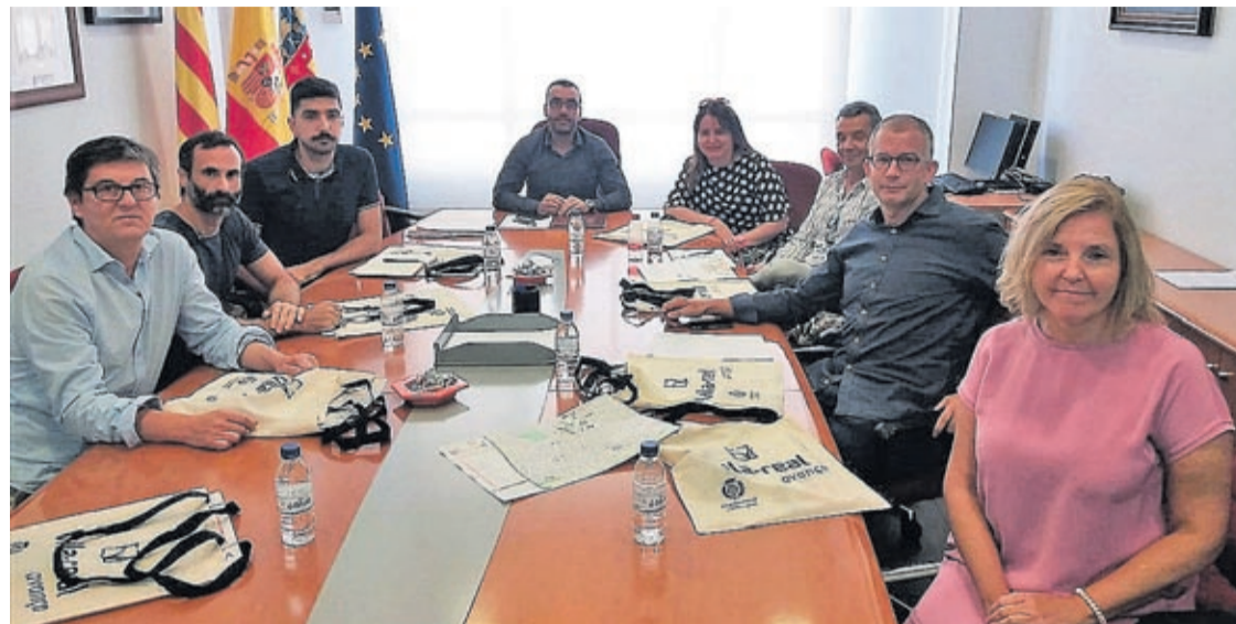
L'alcalde i els representants de l'EASD es van reunir a la ciutat per a tractar els detalls de la col·laboració.