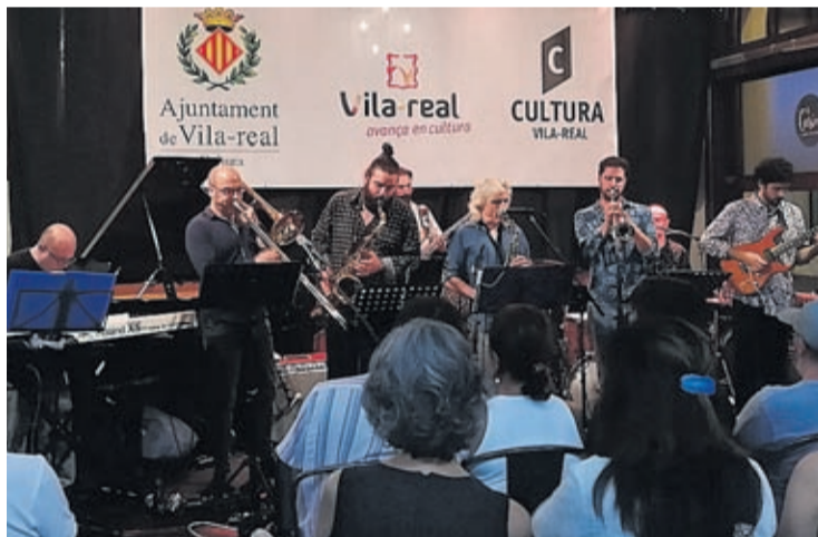
La propuesta musical de Perico Sambeat sirvió de broche del festival 2018.