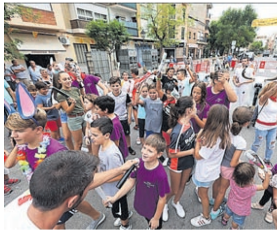
Una concentración motera o actividades para los más pequeños son algunos de los actos de los diferentes barrios.