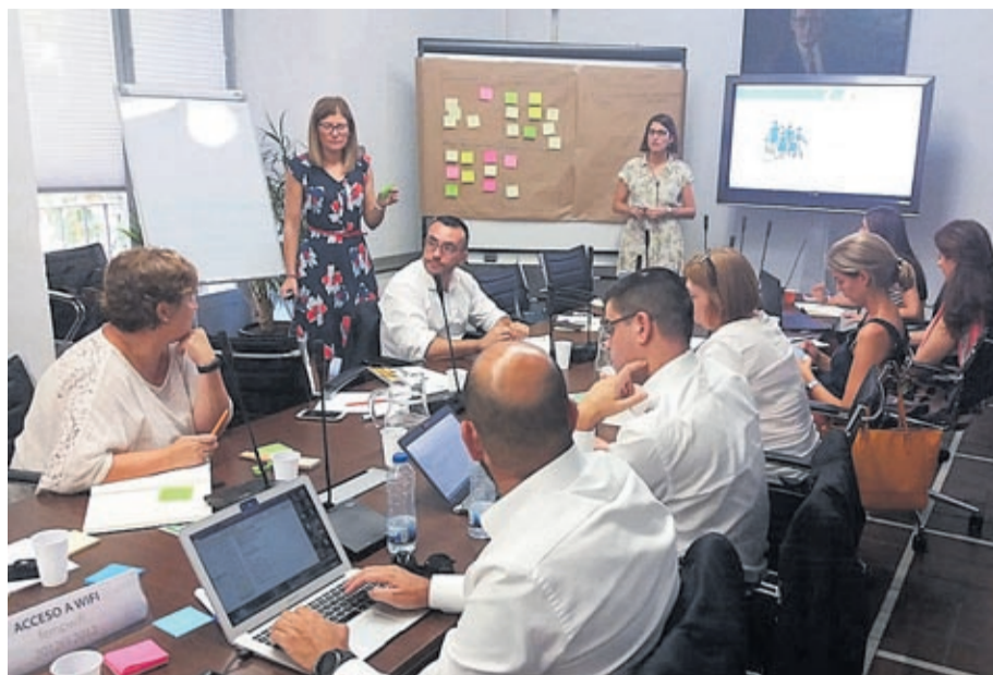
El alcalde participó en una reunión para identificar los retos y problemas de la CPI.