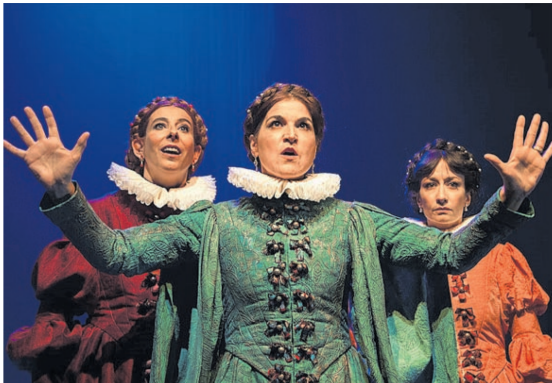
'La Ternura' és una comèdia romàntica amb illes desertes, naufragis monumentals, reis fràgils i reines somiadors.