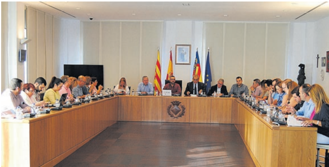
Un Pleno extraordinario y urgente ha aprobado abonar el primer paquete de facturas del plan de pagos anunciado.