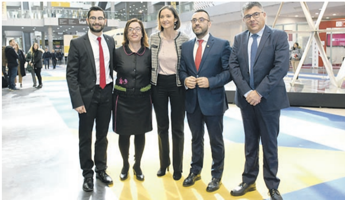
Benlloch en la jornada inaugural con la ministra de Industria, Reyes Maroto, y la subdelegada del Gobierno, Soledad Ten.