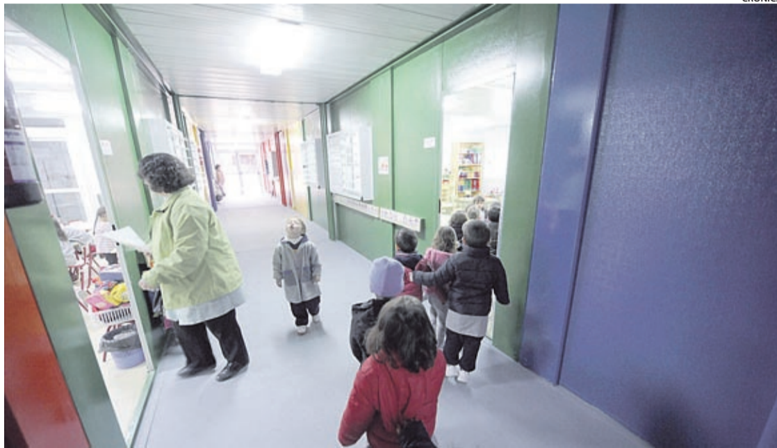
Els alumnes d'infantil del col·legi van haver de ser traslladats a les aules prefabricades actuals l'any 2013.

«La construcció d'aquest aulari és una necessitat urgent i, per això, hem treballat des del pri-