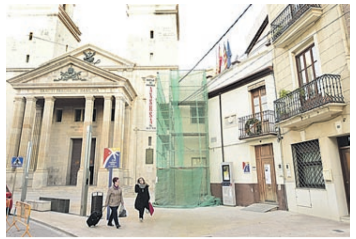
Los andamios ocuparon durante varias semanas el exterior del edificio.

«En Vila-real nos sentimos orgullosos de nuestra gente y de nuestra historia, por eso es importante que reconozcamos con el honor que merecen a aquellos que han contribuido a hacer de Vila-real la ciudad avanzada, rica en cultura y comprometida que somos», agrega.