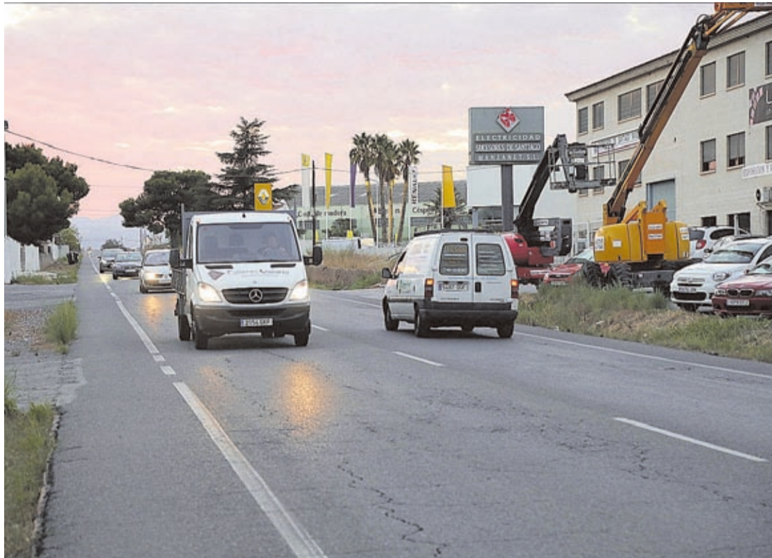
Una de les iniciatives més destacades per la seua necessitat és la reforma del vial que connecta amb Onda.