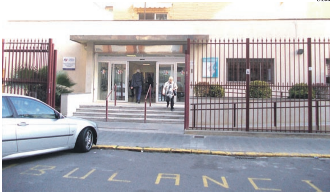
En la actualidad, el centro sanitario presta servicio exclusivo de especialidades y no de atención primaria.

«Ya dijimos que no habíamos abandonado a los vecinos de la zona norte y centro. Torrehermosa era ya un ambulatorio desahuciado por el Partido Popular,