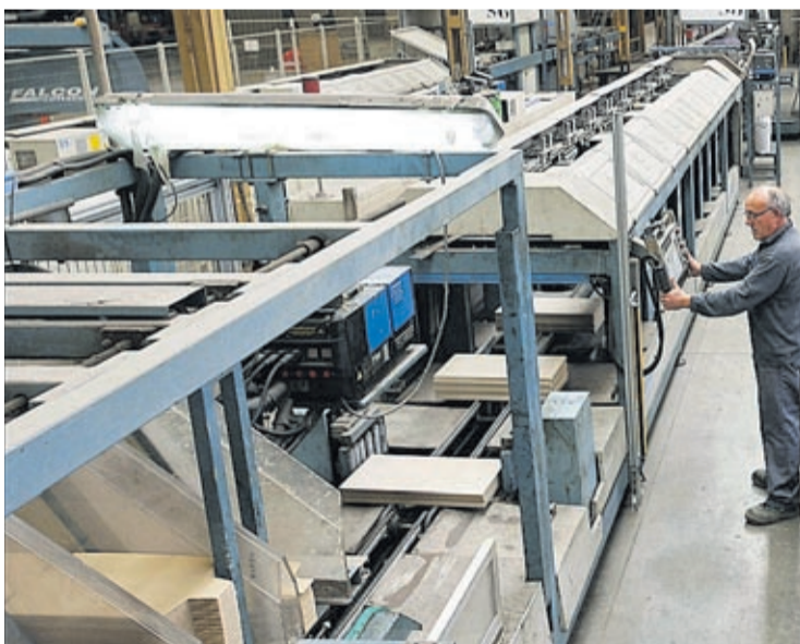
El sector ceràmic és un dels motors econòmics i empresarials a la ciutat.

es genere ocupació, Uns nivells que fan que Vila-real estiga per damunt de la mitjana dels registres d'Espanya.