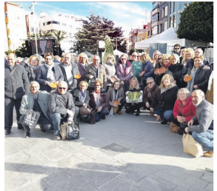
Centenares de personas participaron en la convocatoria del consistorio.