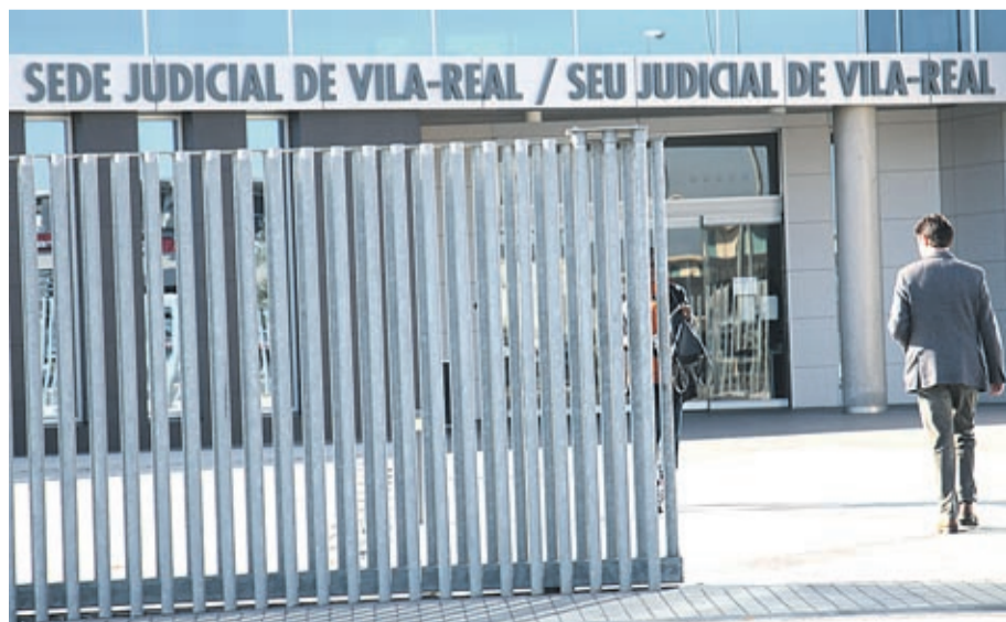
Víctimas de género de Segorbe y Nules tendrán el traslado gratis, en taxi y acompañadas, a Vila-real.

■ Este año se prevé activar una unidad comarcal de evaluación de riesgo que agilice los informes que se requieren para la protección