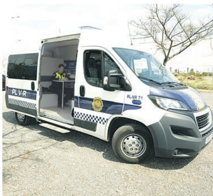
La Unitat d'Atestats i Investigació d'Accidents instrueix aquestes actuacions.

d'activitat d'aquesta unitat, un total de 58 casos dels 86 posats a la disposició judicial per delictes contra la seguretat viària correspon a persones que conduïen sota els efectes de l'alcohol, seguits de 16 que no tenien el corresponent permís de conducció, sis que es van negar a sotmetre's a les proves d'alcohol i drogues i altres tres per conducció temerària. Dues persones van ser detingudes per conduir sota els efectes d'estupefaents i una per imprudència greu amb resultat de lesions.