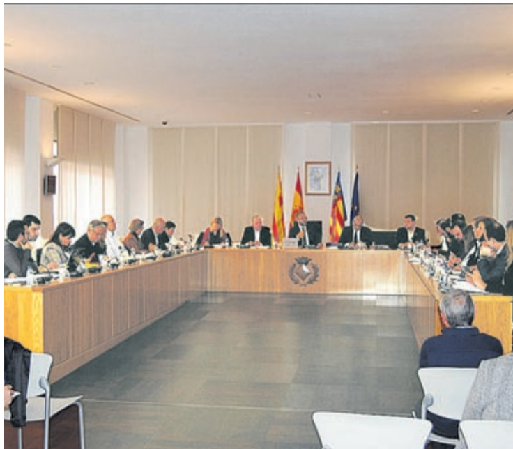
El pleno dio luz verde a la normativa presentada desde el equipo de gobierno.

Para poder dar respuesta a esta situación, el equipo de gobierno ha estado analizando modelos de normativas en municipios con similares características a las locales, con el objetivo de crear una regulación específica para las peñas –que hasta ahora se rigen por la Ordenanza de Convivencia Ciudadana-, que parta del consenso entre los diferentes grupos