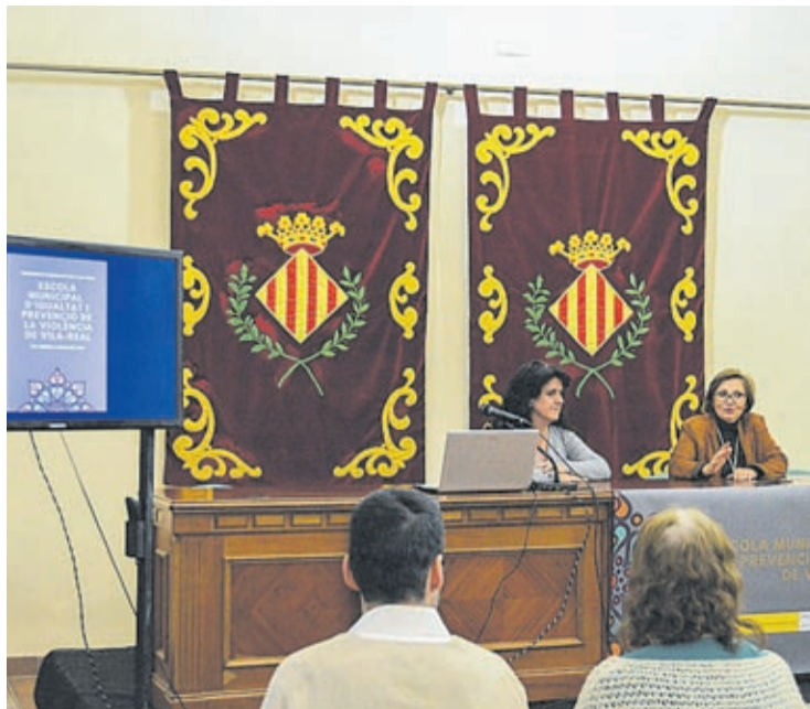
La Escuela de Igualdad es una de las medidas activadas gracias a la ayuda.

Además, los 12 agentes que forman parte de la unidad están recibiendo un curso de formación de siete módulos, de 50 horas, específicamente destinado a la investigación y reconstrucción de siniestros viales y disponen del curso de uso de desfibrilador.