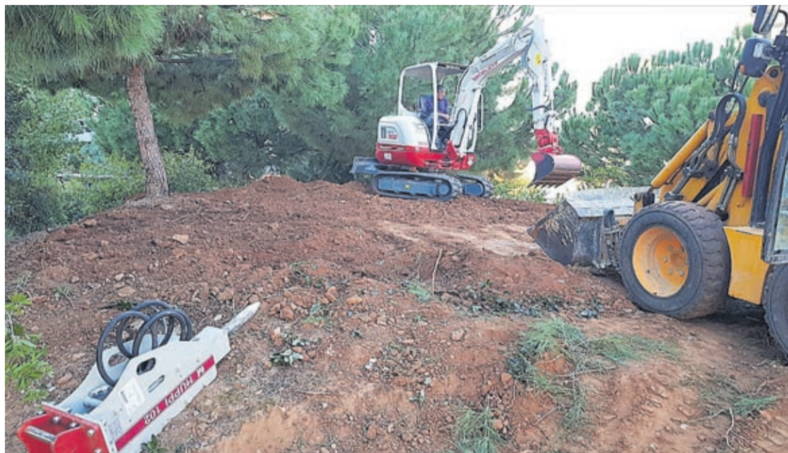
Las máquinas ya han comenzado las labores del rebaje del montículo que da nombre a este espacio verde de la ciudad.

Una pasarela sobre la Séquia Major unirá el espacio con la zona de juegos existente