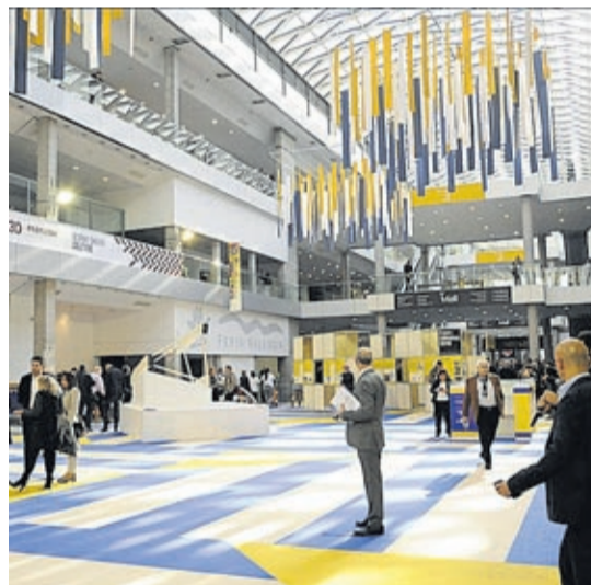
El evento cerámico de València atrae a miles de visitantes