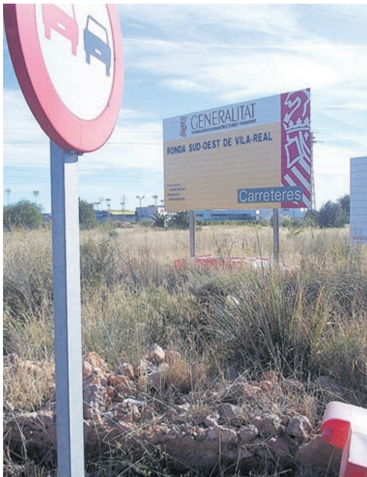
Responsables autonómicos y municipales visitaron un punto del trazado.

La gran cantidad de aspirantes a lograr la adjudicación de la construcción presagia un proceso de valoración más largo de lo previsto, aunque desde la propia Con-