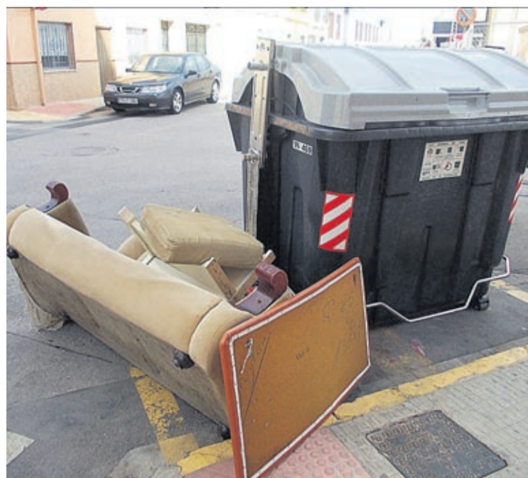
El objetivo de minimizar el abandono de enseres junto a contenedores.