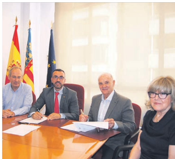
Reunión entre los responsables municipales y representantes de la entidad.

«El Consejo Local del Deporte se volverá a reunir para estudiar todas las propuestas de candidaturas y escogerá a los premiados por votación directa, con un voto por miembro y premio», afirma Serralvo.