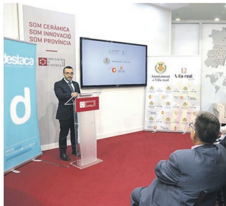
No es la primera vez que la Càtedra presenta en Cevisama su programación.

Por último, la Cátedra quiere sumarse al Año Internacional de la Tabla Periódica proclamado por las Naciones Unidas debido a su importancia. Para ello, desde la Cátedra organizarán actividades que está previsto desarrollar a finales de año.