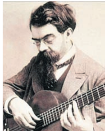
Francisco Tàrrega, guitarrista.