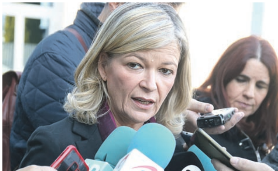
La consellera Bravo en un momento la atención a los medios tras la reunión en el Palau de Justicia.