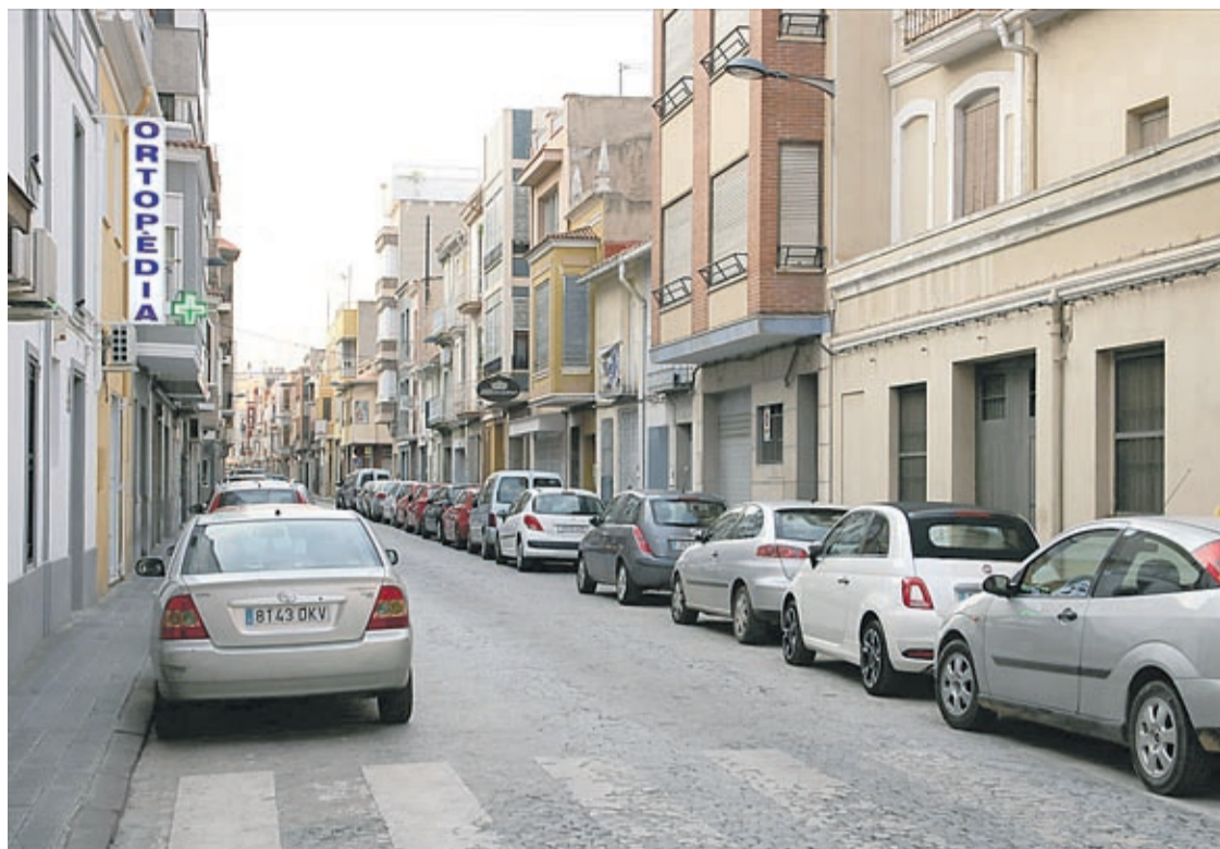
Los vecinos de calles como Salvador, Santa Anna, San Joaquín o Tremedal han presentado numerosas quejas.