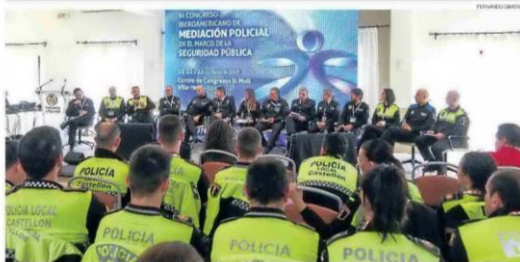
•• Responsables policiales de ciudades de Madrid, Alicante, Valencia, Zaragoza y Castellón debatieron sobre las unidades de mediación policial.

La ciudad lleva a la ley valenciana de policía su veteranía en mediación - Mediterráneo - 23/03/2018