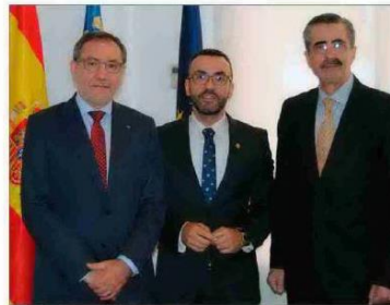
El alcalde, el rector de la UJI y el director de la Agencia de Seguridad. E. M.

creamos la primera Cátedra de Me- diación Policial Ciutat de Vila-real, incorporando el impulso de esta metodología a nuestra apuesta por el conocimiento como modelo de crecimiento. Nos faltaba la tercera