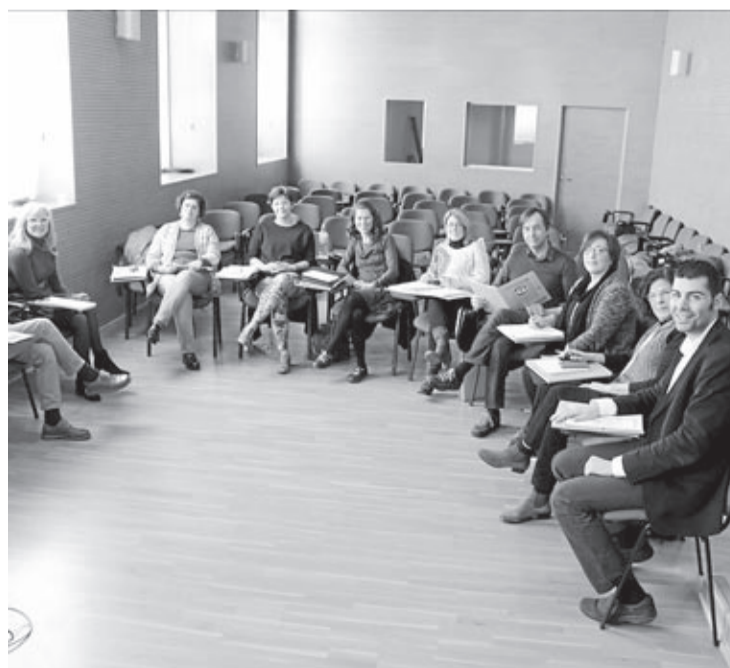
La sede de Servicios Sociales acogió el encuentro de las partes del proyecto.