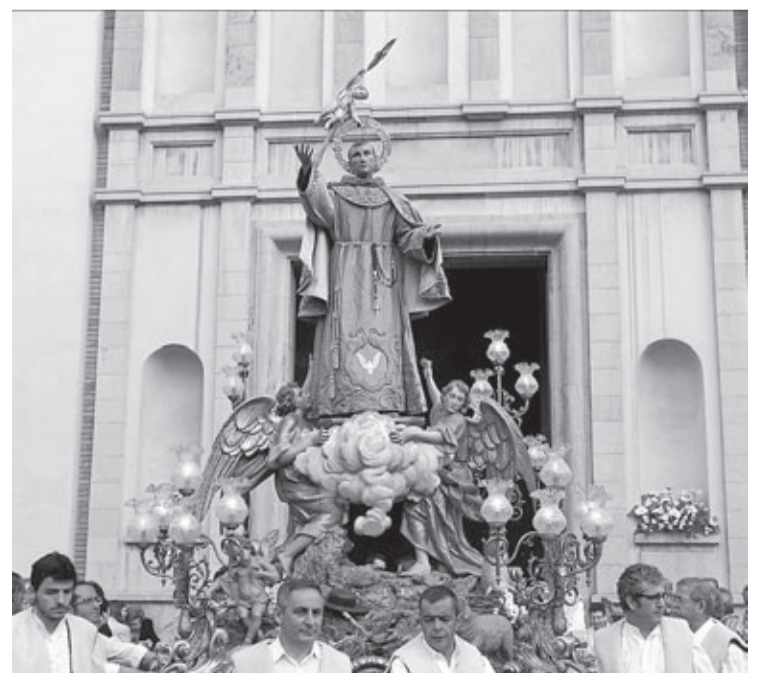
El Consell y el consistorio se comprometen a renovar la imagen antes de mayo.

El Ayuntamiento ha requerido que la actuación esté lista para el mes de mayo.