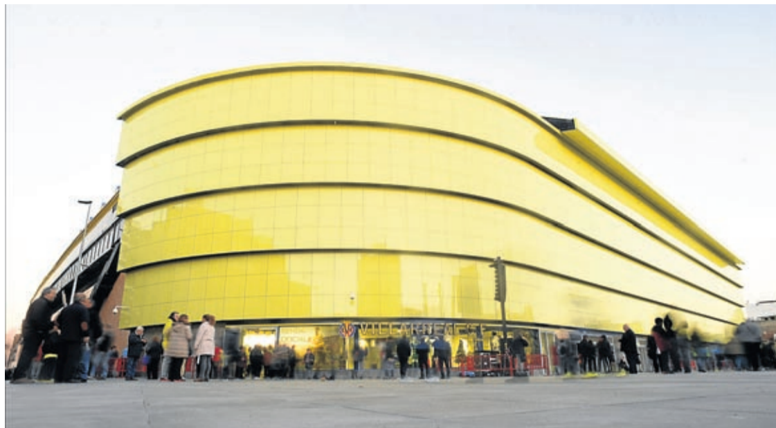
Serà una eixida neutralitzada cap a Almassora per a després completar quasi 200 quilòmetres fins a la meta a Sagunt.