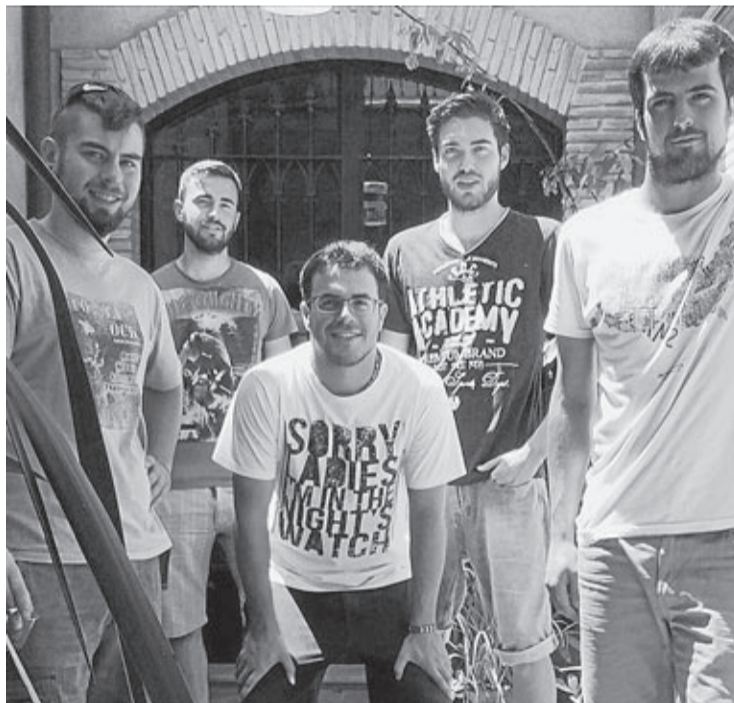
El núcleo de la empresa la forman informáticos, diseñadores y un CEO.

Los vídeos, comenta uno de los responsables de ProAddicts, pueden subirse a otras redes como Youtube o Instagram pero tienen limitaciones como la duración o la posibilidad de conseguir suscriptores o visitas. La solución de este joven equipo fue crear esta