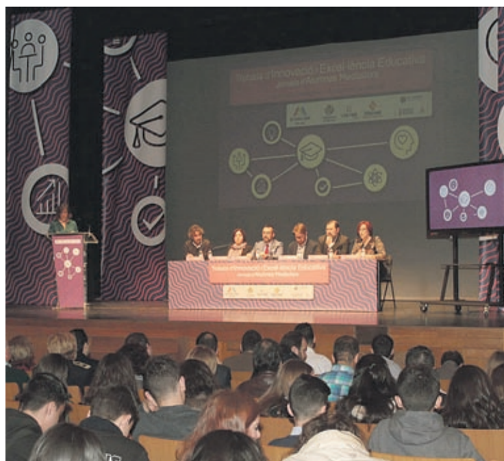
Es van abordar figures com els ciberajudants així com els observadors.

Els assistents també van conèixer iniciatives com la de l'IES Parque de Goya de Saragossa i la tasca amb els ciberajudants; la prevenció de conflictes amb el programa finlandès KiVa que actua sobre els «observadors» i els «reforçadors»; l'espai d'experiències amb el Villarreal CF com a convidat especial.