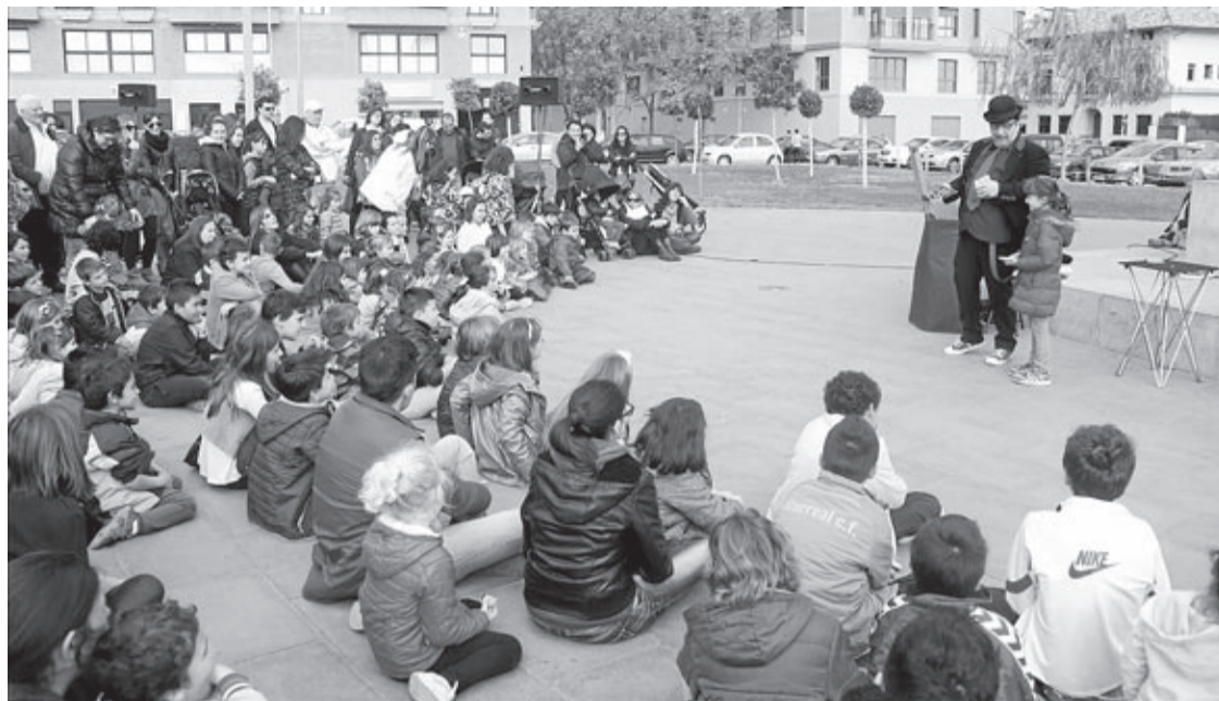
El festival celebra l'aniversari sense oblidar activitats fixes com la visita als majors i les actuacions als carrers.