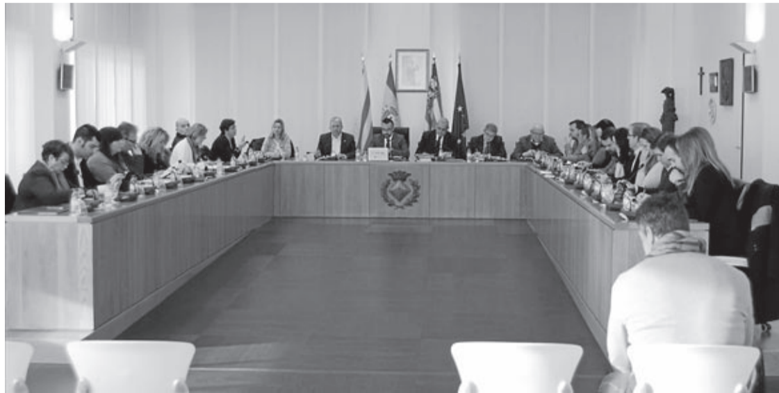
Amb aquest pas, el consistori preveu poder pagar els treballs de les companyies i autònoms en un màxim de 30 dies.

El Ple aprova el pagament 1,2 milions d'euros d'unes 1.000 factures i confia en poder tornar a pagar en 30 dies