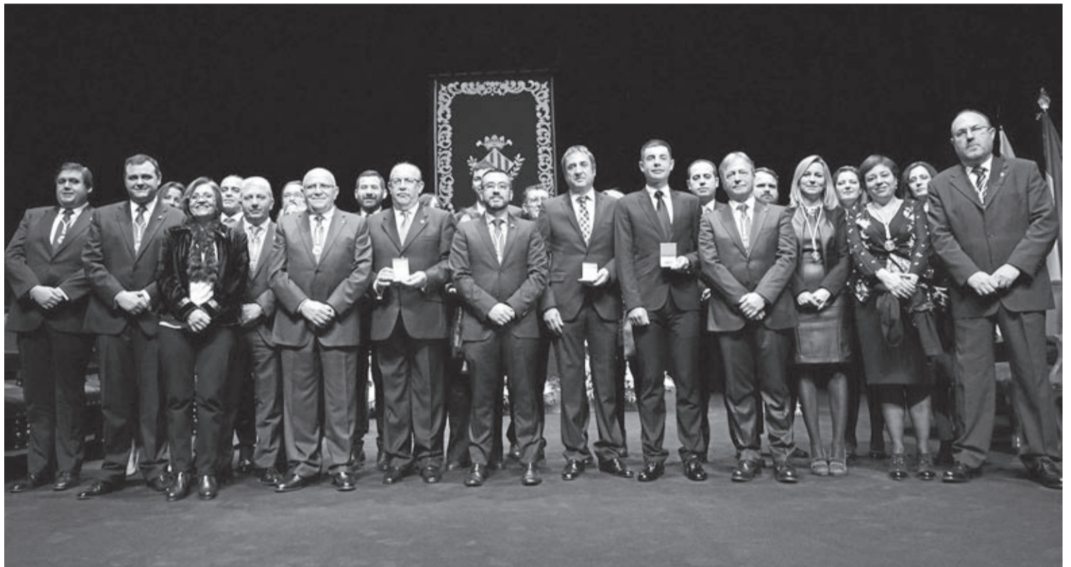
Amb un Auditori ple de gom a gom i dins del marc de les Festes Fundacionals, es va realitzar el solemne acte de les noves distincions de la ciutat.

Respecte a la Universitat Jaume I, tot i ubicada a Castelló, l'alcalde va indicar que «forma part de la nostra ciutat». Molts vila-realencs han estudiat en aquest centre universitari que també té presència a Vila-real després «de