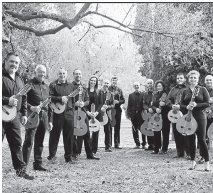
Part dels membres de l'orquestra de plectre que actuaran el 26 de març.

les bandes espanyoles més influents en el camp de la música alternativa», assenyala el regidor de Cultura, Eduardo Pérez. Bilbao, València, Barcelona, Girona o Saragossa són l'origen de les formacions emergents del panorama musical nacional.