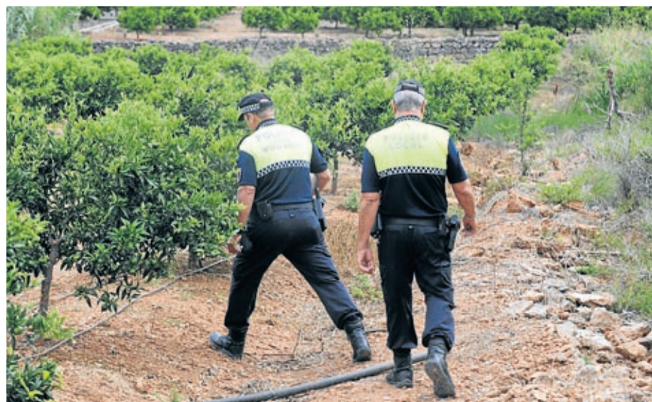
Las actuaciones de mediación en el ámbito rural siguen siendo de las más solicitadas.

■ La Policía Local atendió en 2016 un total de 351 procedimientos -110 menos que el año anterior-, de los que finalmente trató 322