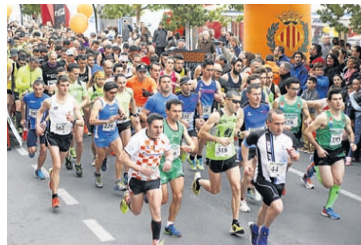
Les competicions s'inicien el 12 de març amb el 5K d'Animatemps.

El Circuit de Carreres Populars, impulsat pel Servei Municipal d'Esports, prepara una nova temporada amb una desena de competicions i més de 50 quilòmetres pels carrers de la ciutat.