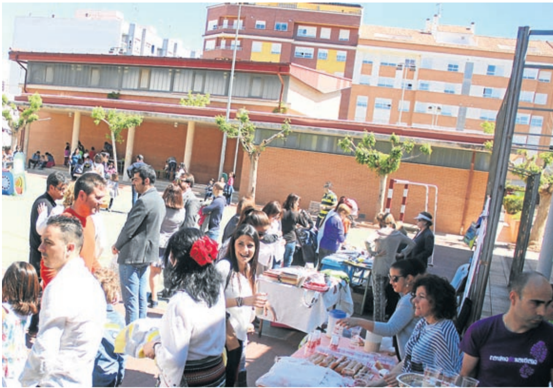
De los centros educativos interesados, solo Botànic Calduch queda fuera del resto del proceso por el «bloqueo» del PP.