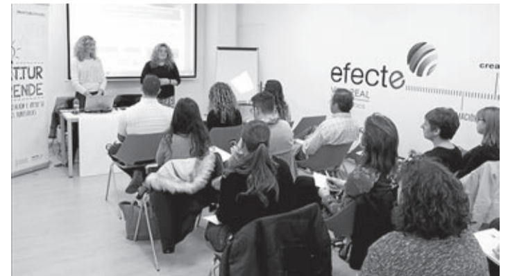
La iniciativa se presentó en las instalaciones de Efecte el pasado febrero.

El Instituto Valenciano de Tecnologías Turísticas (Invat-tur) ha presentado la octava edición del proyecto Invat-tur Emprende, un programa formativo integral que se impartirá por primera vez en la provincia de Castellón desde el centro de negocios Efecte Vila-real.