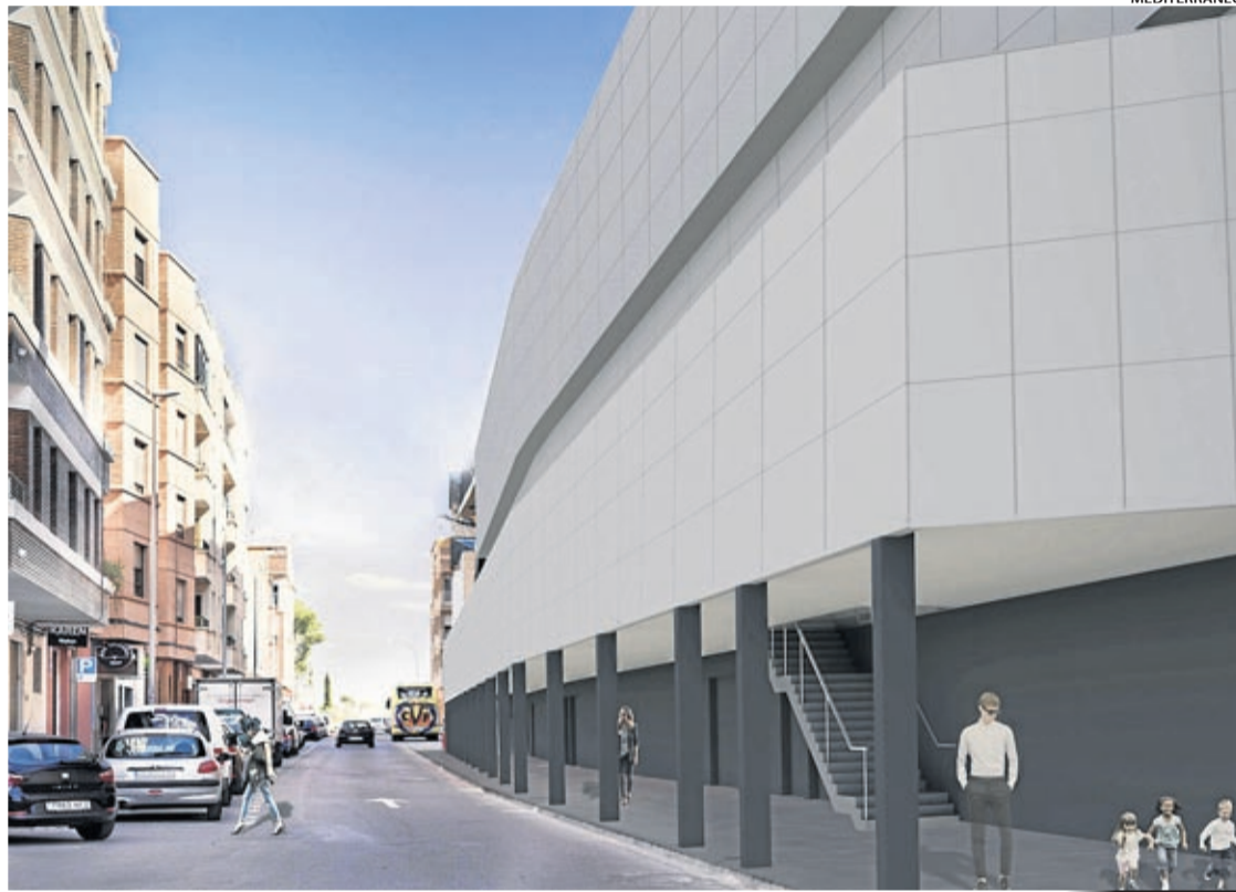
Infografía del diseño que se pretende dar a la fachada oeste del Estadio de la Cerámica, en la calle Blasco Ibáñez.

Un porche que, según explica el edil Obiol, «ya existió, en parte, tras la remodelación del campo que se efectuó en los años 80 ó 90», detalla.