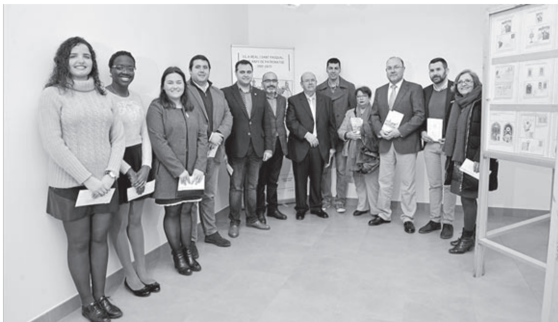
Los salones de Caixa Rural acogen, hasta el próximo 20 de marzo, elementos de gran valor documental del santo.

■ Unos 400.000 kilos de lodo, basura y objetos es lo que calcularon desde la Comunidad de Regantes que se retiró del sifón de la Acequia Mayor que salva la avenida Cedre –el único que existe en el tramo del canal que discurre por el casco urbano–, como consecuencia de los trabajos de limpieza especial. Esta labor de retirada del material acumulado en este sifón se acometió por última vez hace 20 años –en 1997– según explican desde el Sindicato de Riegos. «Entonces se encontraron incluso una bomba y balas de la guerra civil», afirman, lo que indica que, probablemente, este tipo de trabajo tan exhaustivo no se acometió desde antes de la guerra que acaeció de 1936 a 1939. Para acometer esta acción se desmontó la parte de la cubierta del sifón que da a la Glorieta 20 de Febrer, hasta ahora fija. «En cuanto acabe la retirada de lodo, aplicaremos un sistema desmontable que no obligue a romper la cubierta de obra y que nos permita realizar este tipo de limpieza, al menos, una vez cada dos años», dicen.