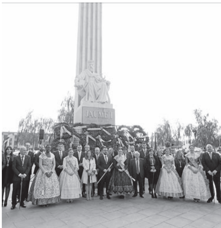
L'homenatge al rei Jaume I, l'acte en honor a la reina i les dames de 2016 o la Fira Medieval han aconseguit molta bona acollida per part de la ciutadania.