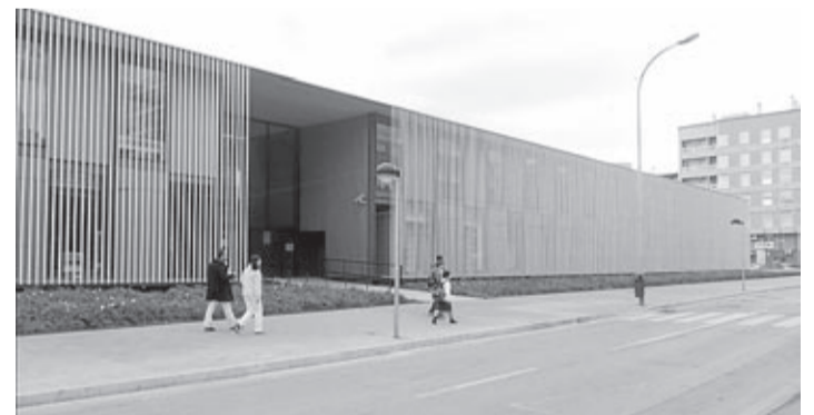
La propuesta busca acercar la administración electrónica a la ciudadanía.

La Concejalía de Innovación y Nuevas Tecnologías pone a disposición de los vecinos tres ordenadores con lector de DNI electrónico, para que puedan acceder de manera sencilla a los trámites telemáticos que requieren de esta herramienta. Los terminales provistos de lector de DNIe están disponibles en el aula informática de la Biblioteca Universitaria del Coneixement (BUC).