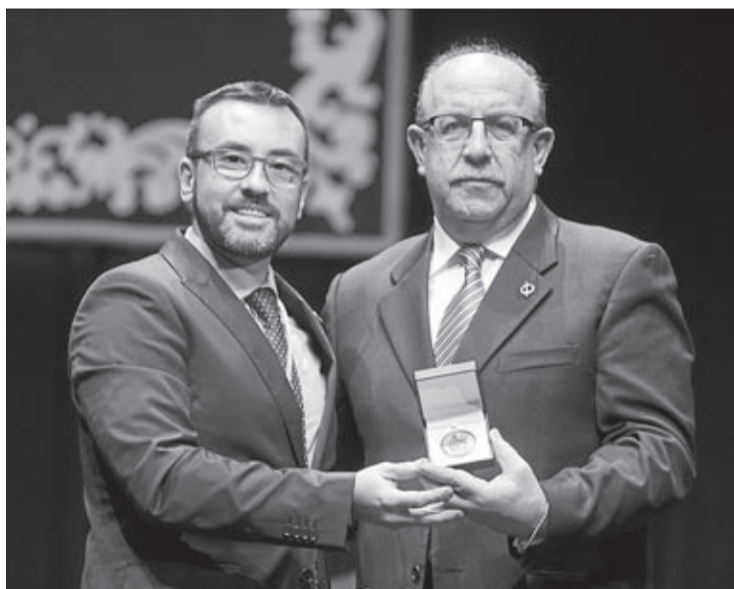
La Molt Il·lustre Confraria de la Sang de Jesucrist, Medalla d'Or de la ciutat.