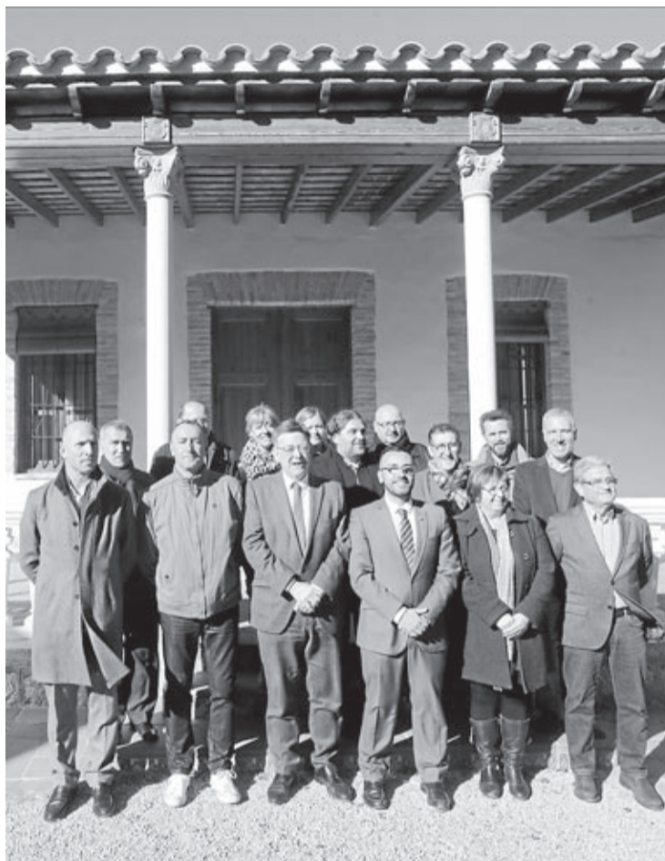
Puig conoció la labor del Consorcio, en una reunión con los responsables.

Puig ha destacado el ejemplo de «gobernanza común» que supone el Consorcio del Millars y la apuesta de la Generalitat por preservar la naturaleza como un compromiso con las generaciones futuras. «El Mijares es uno de los ríos más aprovechados del mundo; vinculado a la humanización, por el trabajo que se ha realizado permanentemente para adecuarlo a las necesidades de la población y conseguir, así, que la agricultura fuera ese factor de crecimiento económico que siempre ha sido», señala el presidente de la Generalitat. Por ello, Puig aboga por estudiar fórmulas que permitan combinar la naturale-