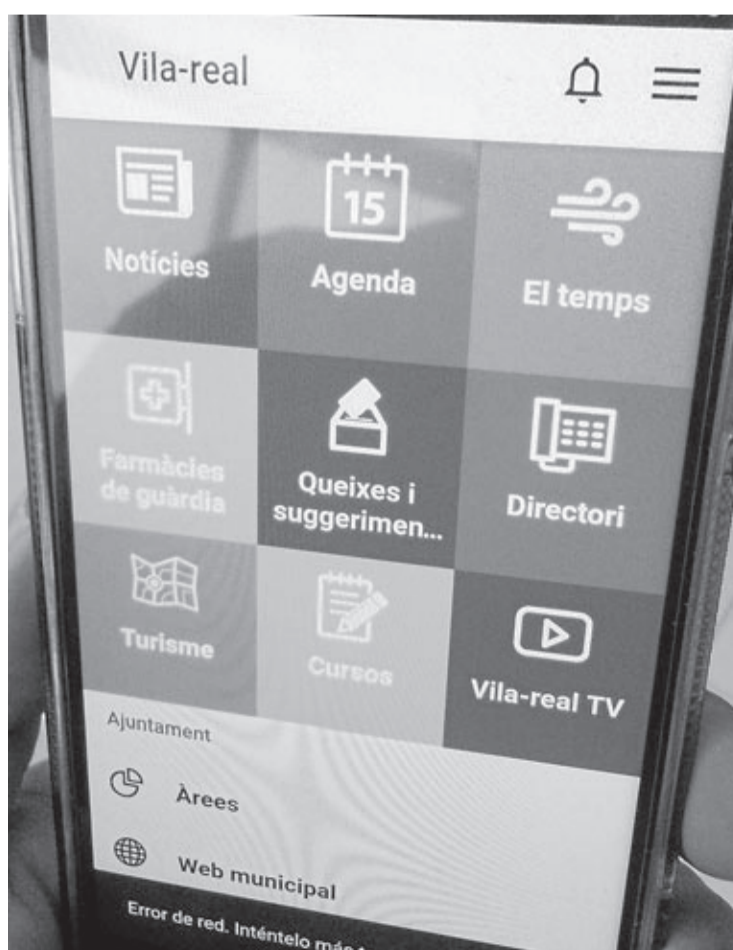
Detall de la nova aplicació presentada pel departament de Noves Tecnologies.