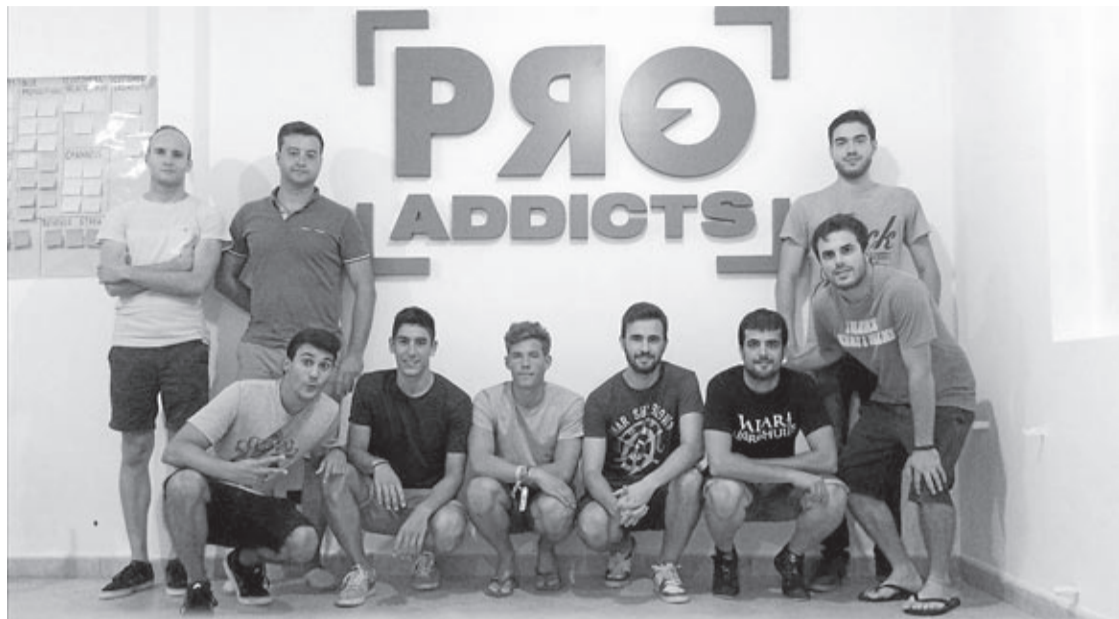
La empresa (proaddicts.com) centra su trabajo en los prácticos en la calle aunque prevén abarcar otros espacios.