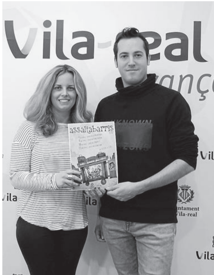
La edil de Participación Ciudadana y el director de la compañía La Fam.

Por su parte, el director de La Fam asegura que «además de poner en valor la vida en el parque, cada asociación de vecinos saca-