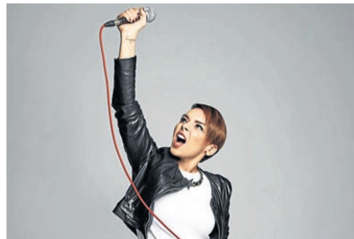
El de Chenoa será el primer concierto en la plaza del campo de fútbol.

Ya en septiembre, el cartel de las fiestas de la Virgen de Gracia estará encabezado por el cantante de rock and roll Loquillo el sábado 2. El jueves 7 ya está confirmada la actuación de la orquesta Centauro en el Recinte de la Marxa así como la del grupo Funambulista, el sábado 9 en la plaza Mayor, el Dúo Dinámico actuará el domingo 10 en la plaza Mayor.