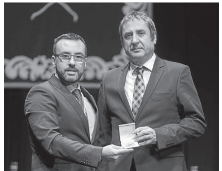
A l'UJI, per l'estret vincle a mb Vila-real, se li ha donat una Medalla de Plata.

molta lluita i gestions». Benlloch es va referir a l'obertura de la Seu de la Plana, a la Biblioteca Universitària del Coneixement que es complementa amb un altre fet important, la Càtedra d'Innovació Ceràmica Ciutat de Vila-real, que va nàixer «del consens i de la unió d'aquest centre universitari amb l'Ajuntament» així com la Càtedra de Mediació Policial.