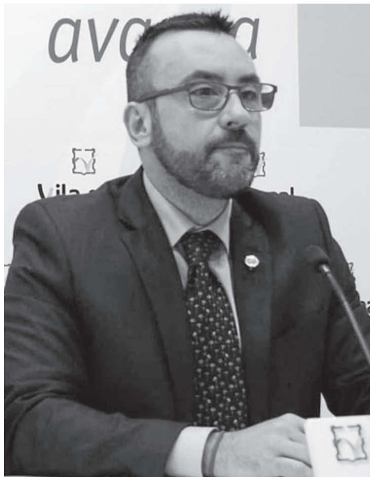
El alcalde dijo que la gestión urbanística del PP local en la zona fue un problema.

Entre los principales motivos expuestos para ubicar la intermodal en Castellón destacan la mayor superficie o los accesos. «La gestión urbanística del PP local, que creó un PAI en la zona, eliminando la posibilidad de instalar una intermodal, ha contribuido a este resultado, y también la dejadez, durante tantos años,