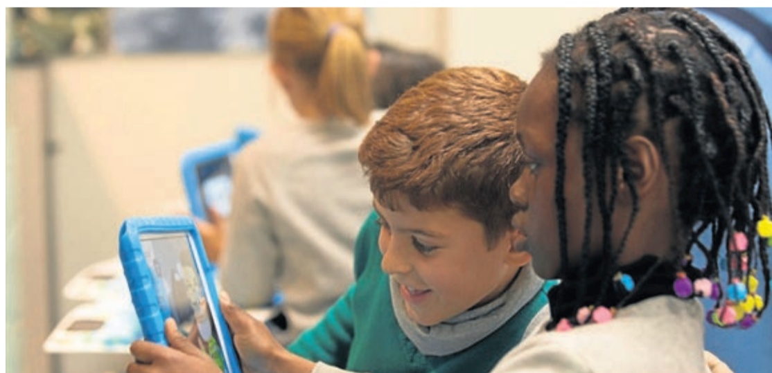
Realidad aumentada, vídeos animados en 3D, una APP propia y experimentos son las herramientas del alumnado.