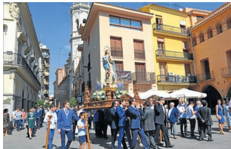
La missa i la processó van ser els actes centrals d'una completa programació.

La Congregació de Lluïsos ha celebrat durant el mes de setembre les festes anuals de l'entitat. Els actes principals han estat la tradicional missa en què s'han incorporat una vintena de nous congregants i la processó. La revista parlada 'Camino' i la tradicional nit de xulla han estat unes altres de les cites destacades del programa de festes de l'entitat juvenil, que ha comptat també amb activitats infantils, una torrada de sardina, un concurs de dibuix o l'actuació d'una orquestra divendres a la nit. Una representació de la corporació ha acompanyat la congregació en la seua festa major.