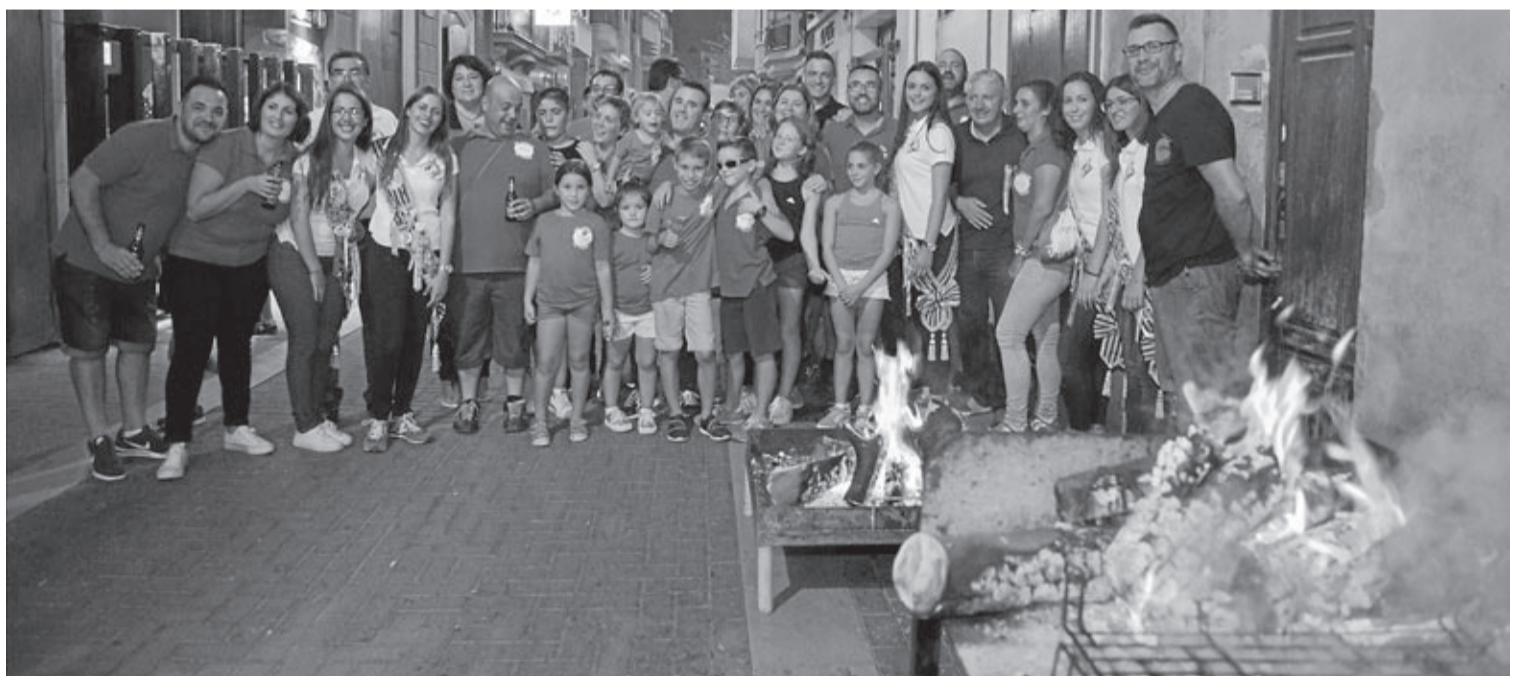
Durant la nit del dilluns de festes milers de vila-realencs, penyistes o no, van eixir als carrers de la ciutat per a gaudir de la tradicional xulla amb amics i familiars.

En l'apartat d'incidències, Serralvo destaca la «normalitat» en el desenvolupament dels festejos. Les dades aportades per l'intendent en cap de la Policia Local avalen aquesta conclusió: enguany s'han docu-