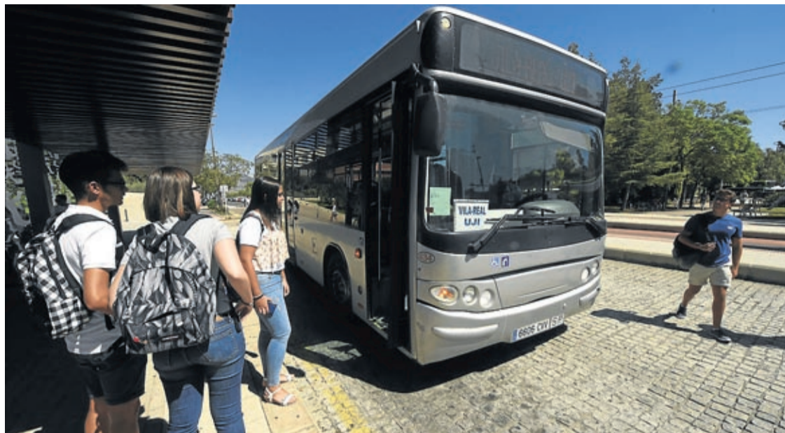
El servei, amb un cost d'uns 17.000 euros, naix de la col·laboració del consistori amb la Seu de la Plana de l'UJI.