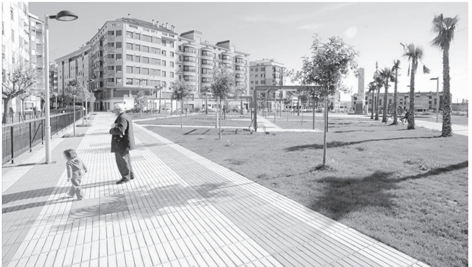
El jardí de Jaume I és un dels punts del conflicte urbanístic que més preocupa dins de l'informe remès per la Intervenció Municipal amb els diferents casos.

«Des que aquest equip de govern va arribar a l'Ajuntament el 2011 vam tenir molt clar que pagarem l'herència del PP, però