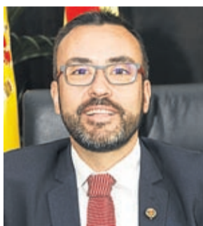
José Benlloch Fernández Alcalde