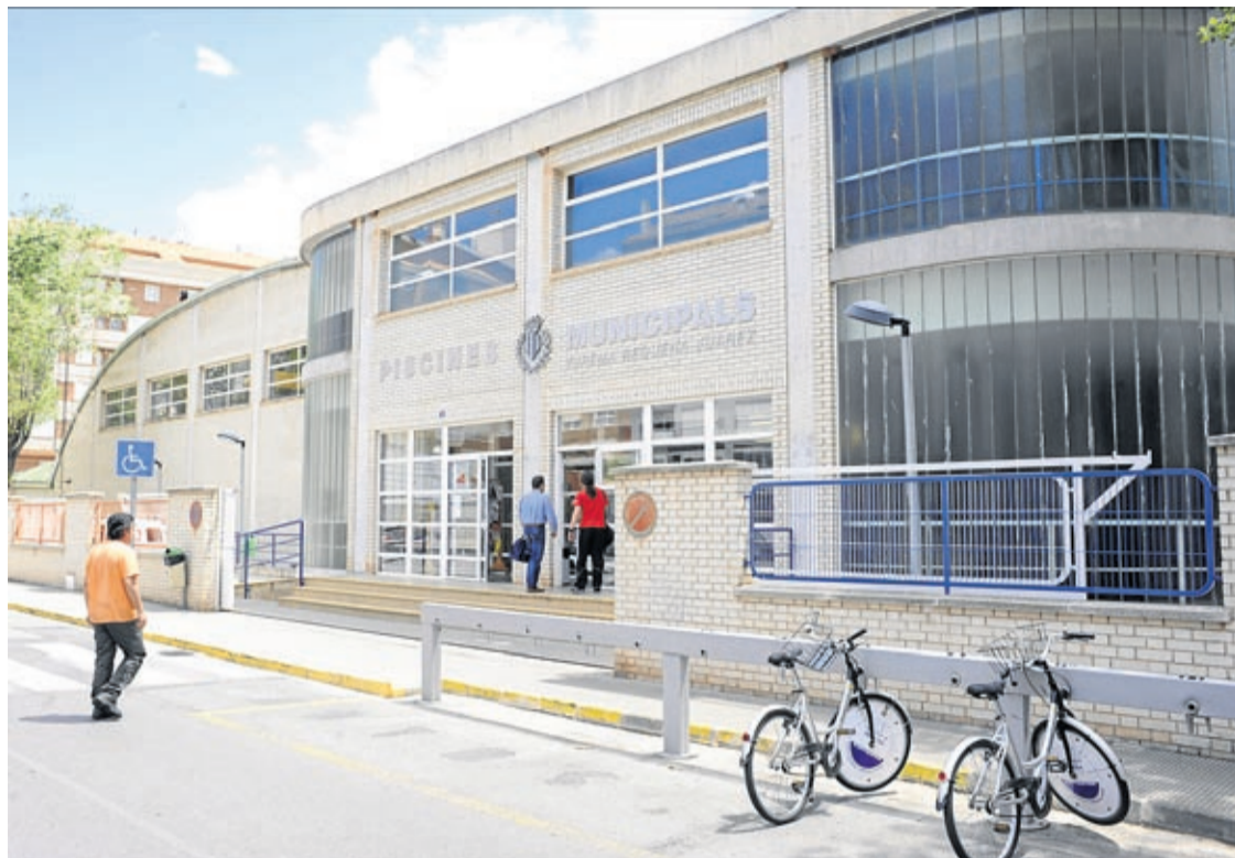
Les piscines, després de la parada tècnica de l'estiu, ja té en marxa totes les instal·lacions per a la pràctica esportiva.