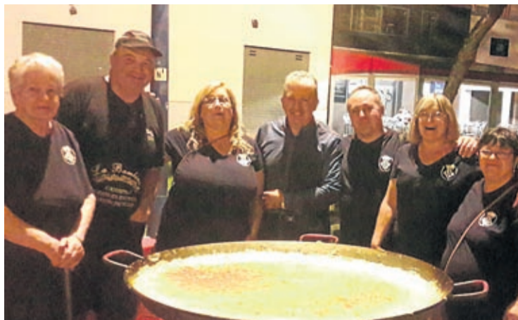
Una tortilla monumental fue una de las propuestas en Nou Crist del Calvari.

Unas jornadas que, según comentan los organizadores, sirven para estrechar lazos con los vecinos más cercanos. Incluso algunos, pese al cansancio que puede suponer realizar sus fiestas tras las patronales, consideran que un aspecto favorable puesto que sirven para ir cogiendo ritmo.