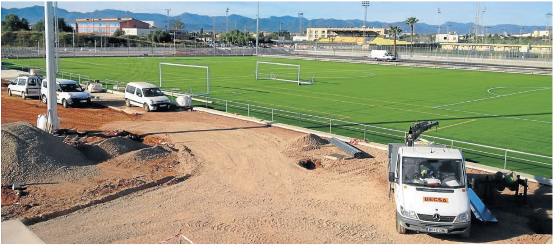
La nueva Ciutat Esportiva Municipal (CEM) de Vila-real se encuentra a pleno rendimiento, tras las obras realizadas por Beca y que permiten la práctica de varas disciplinas en un mismo emplazamiento.