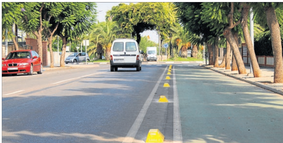
La modificación de estos elementos es una de las acciones incluidas en el Plan de mejora continua del Termet.