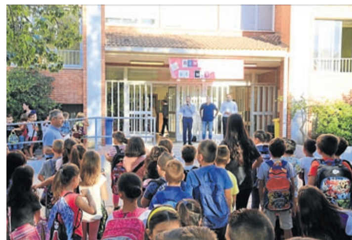
Pérez i Ochando van visitar el centre Carles Sarthou el primer dia lectiu.

Prop de 7.500 alumnes van iniciar el curs escolar als centres docents de Vila-real. En total, són 2.196 alumnes de secundària, 3.516 de primària i 1.571 xiquets d'infantil, entre els quals es troben les dues aules de 2 anys de Concepció Arenal i Carles Sarthou que formen part del pla pilot de la Conselleria d'Educació per a l'escolarització de 2 anys en centres públics.