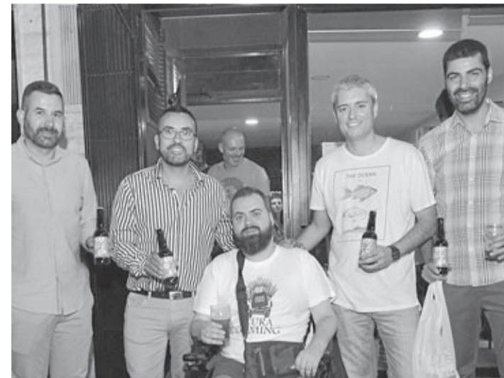
La presentación de la bebida solidaria contó con varios ediles municipales.

Vila-real dispone de una nueva cerveza artesana, autóctona y solidaria, impulsada por la Asociación Conquistando Escalones con el objetivo de recaudar fondos para luchar contra la distrofia muscular de cinturas tipo 1F y a su vez contra el virus del sida.