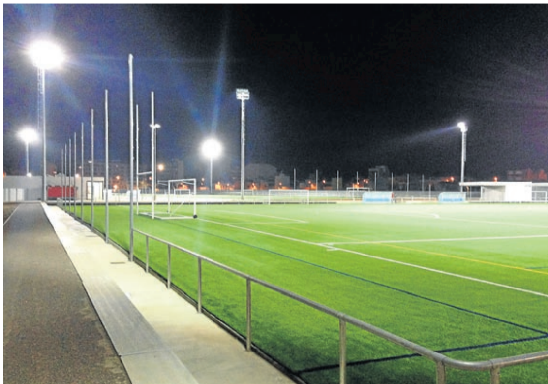
El complejo está dotado con dos campos de fútbol, que a su vez integran 4 campos de fútbol-7, entre otras opciones.

El complejo está dotado de las instalaciones necesarias para la práctica de varios deportes, pudiéndose compaginar así distintas disciplinas en un mismo espacio. De esta forma, cuenta con dos campos de fútbol, que además integran cuatro de fútbol-7, y que incluyen todos los elementos necesarios para que se desarrollen competiciones deportivas federadas. Incluso uno de estos campos de fútbol está preparado para la práctica de rugby, que cada año suma más adeptos, y cuenta con marcadores para todos los deportes.