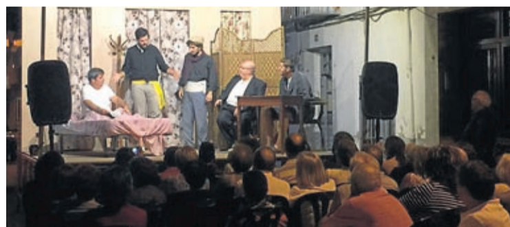
Uno de los grupos locales de teatro, Tabola, realizó varias representaciones.