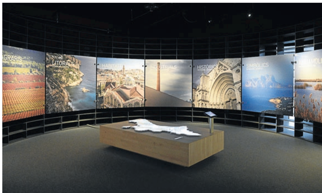
La exposición de la Universitat de València y la Agencia Valenciana de Turismo propone un turismo experiencial.

La muestra se divide en 4 ámbitos. En el primero se realiza una aproximación a la definición de paisaje mediante una Sandbox y mapas interactivos que pretenden hacer reflexionar al visitante acerca de lo que entiende por turismo y paisaje. En el segundo espacio, a través de una proyección de gran formato, se analizan los valores patrimoniales territoriales que dotan