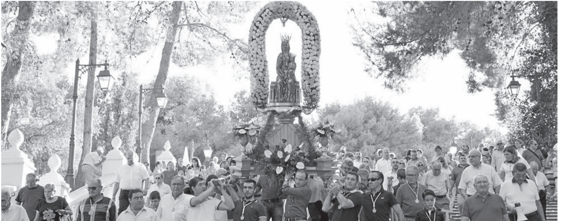
La tornada de la Mare de Déu a l'ermita va marcar el darrer diumenge de les festes de setembre, tot i que l'activitat va seguir després amb el concert del Dúo Dinámico i el llançament del castell de focs.