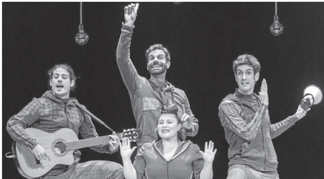
La representació 'Comedia Multimedia' és la primera a arribar a l'escenari de l'Auditori Municipal aquest mes.