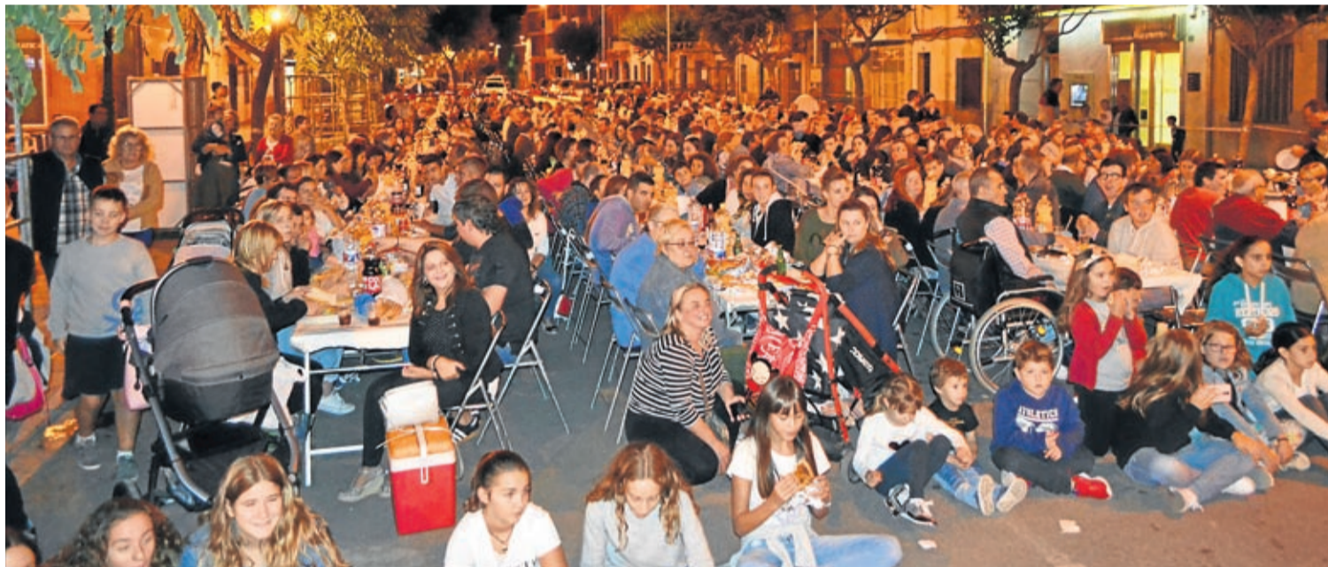
Unas 600 personas se calcula que participaron en la cena de hermandad en el Crist de l'Hospital donde los clavarios y festeros juegan un papel destacado.