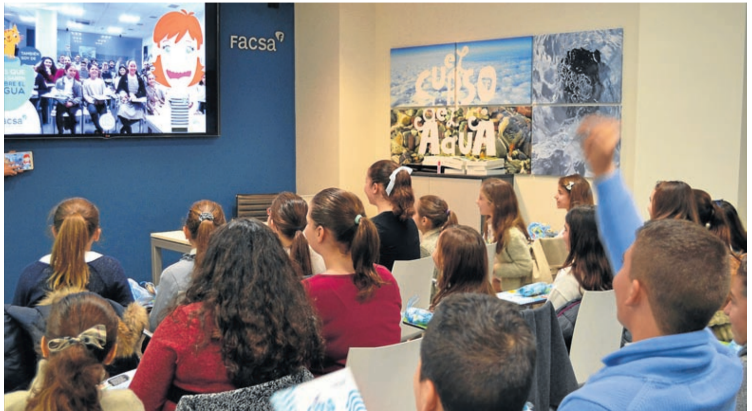
Cinco personajes animados son los encargados de guiar a los niños y niñas por las diferentes fases del proyecto educativo para conocer el ciclo del agua.

Y es que FACSA, consciente de que las nuevas generaciones son claves para proteger el medio ambiente, cuidar el entorno y salvaguardar los recursos naturales, ha apostado de nuevo por lanzar esta iniciativa, que tiene la educación y la sensibilización como factores fundamentales, para generar una mayor conciencia colectiva en torno a la necesidad de hacer un uso más responsable de este recurso, tan