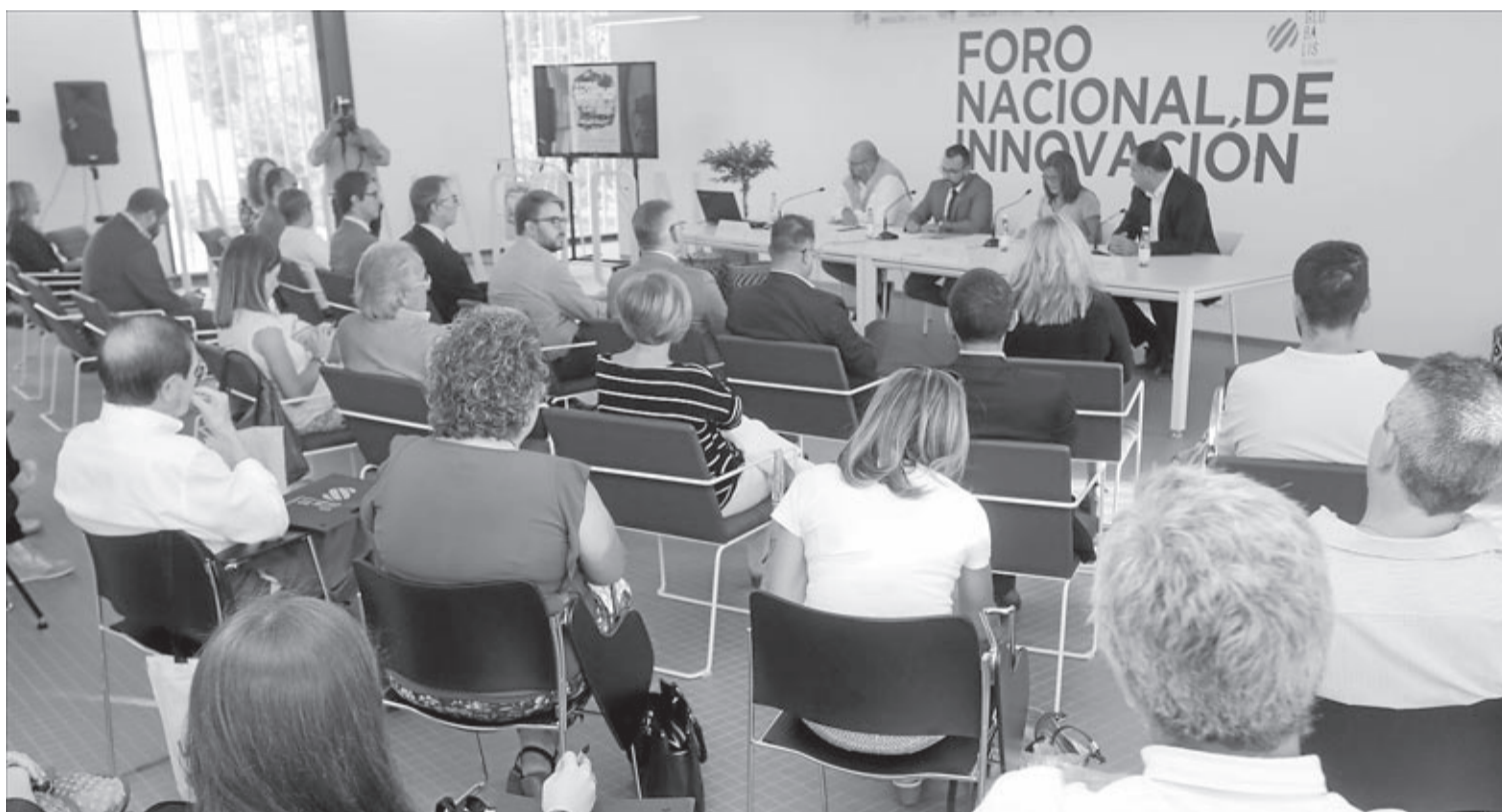
Responsables del consistori, la Diputació Provincial i la Generalitat van participar en l'obertura de la cinquena edició de l'activitat organitzada per Globalis.

També van participar PAYSOSPITAL que van detallar la labor que realitzen en els hospitals valencians amb els més menuts i van demanar més sensibilitat per part de les administracions i empreses per a continuar realitzant aquesta comesa. En la taula d'experiències es van explicar les labors que Patim, la Fundació Noves Sendes, Fundació Tots Units, l'Associació MEF2C o l'empresa