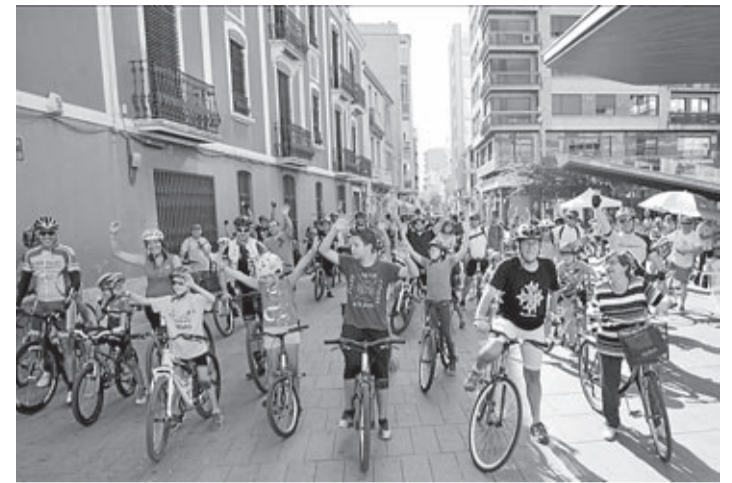
Una bicicletada popular sirvió de punto final del programa de actividades.