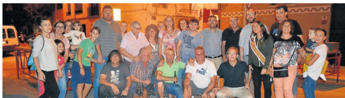
La tradicional 'nit de xulla' también fue una de las citas ineludibles como sucedió en el caso de la asociación la Soledat.