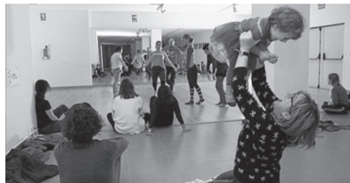
L'Escola Municipal de Dansa es realitza al Convent, espai d'art.

Les sisenes edicions de l'Escola Municipal de Teatre (EMT) i l'Escola Municipal de Dansa (EMD), iniciatives de la Regidoria de Cultura a càrrec de les companyies La Fam i A Tempo Dansa, inicien nou curs amb l'objectiu d'incrementar la participació amb nous grups i propostes.