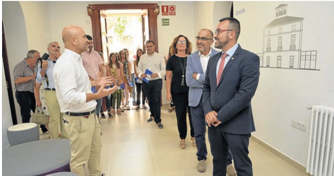
Las instalaciones se inauguraron durante la semana de fiestas de septiembre y se habilitan dos pisos supervisados.

La residencia se complementa con dos viviendas supervisadas vinculadas, una en Castellón y otra junto a las nuevas instalaciones en Vila-real. Los tres centros surgen para fomentar la recuperación, la autonomía y la inclusión de las personas con problemas de salud mental y contarán con 30 trabajadores especializados, entre