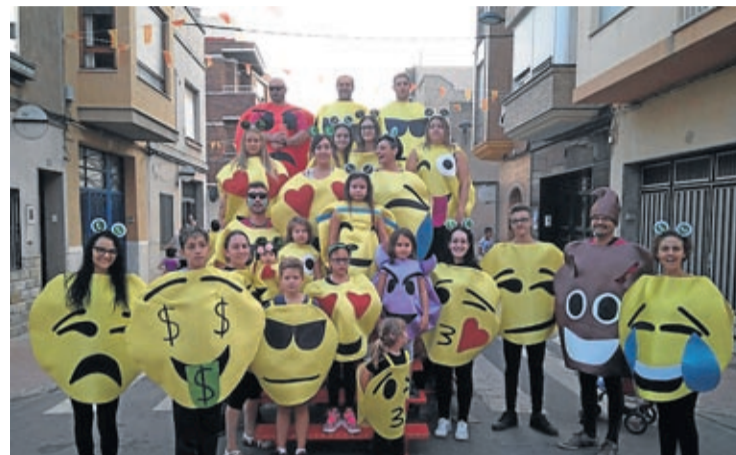
Los 'emojis' fueron los personajes elegidos en el Roser para los disfraces.