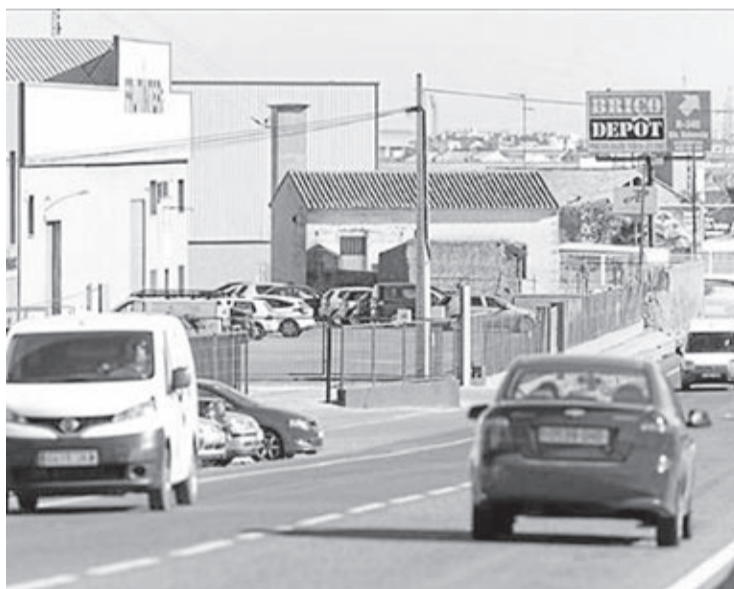
Una solució seria passar a residencials terrenys propers a la carretera d'Onda.

també que la nostra obligació és defensar els interessos de Vila-real amb absoluta sensibilitat als drets dels propietaris afectats per la gran estafa que va suposar l'urbanisme del Partit Popular», diu l'alcalde.