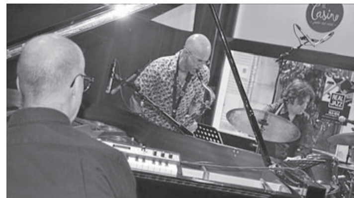
La segona edició ha portat actuacions i activitats per a totes les edats.