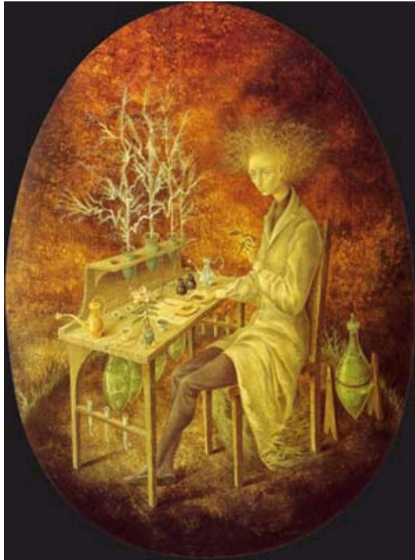
Remedios Varo. Planta insumisa