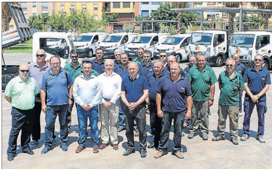
Imagen de la presentación de los nuevos vehículos que se incorporan a la flota de Serveis Públics.