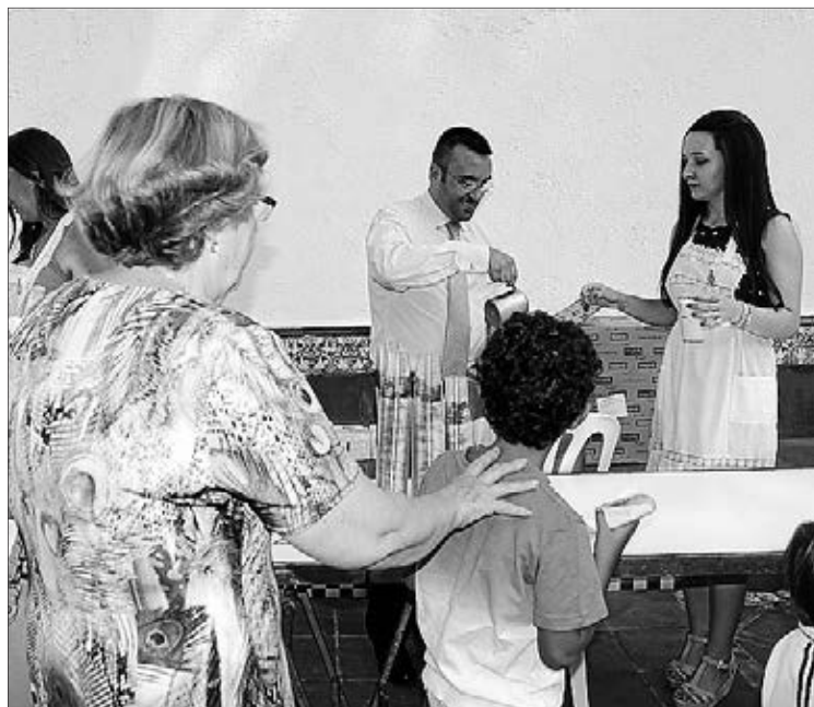
L'alcalde va col·laborar també en el repartiment d'orxata i fartons.