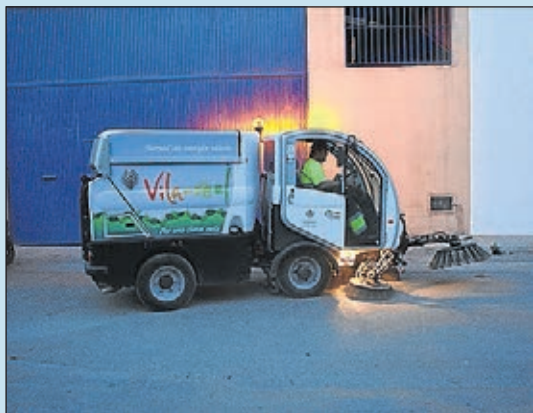
Serveis adaptats a les necessitats de cada zona.