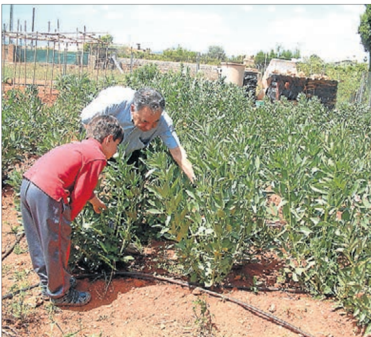
Vila-real aposta perquè els veïns recuperen l'agricultura ecològica.

El centre associat de la UNED a Vila-real ha tancat l'oferta de cursos d'estiu amb un taller centrat en la sexologia i la salut sexual. El monogràfic, que s'ha celebrat del 21 al 23 de juliol, ha oferit una visió actual sobre les disfuncions i altres problemes sexuals i també les solucions.