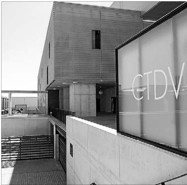
El Centro de Tecnificación todavía no se ha abierto al público.

Por eso, "la solución adoptada por el consistorio y consensuada con la Conselleria que hemos aprobado por urgencia ha sido la de eliminar del convenio los términos que hacen referencia al uso educativo y formativo de la cesión y modifi-