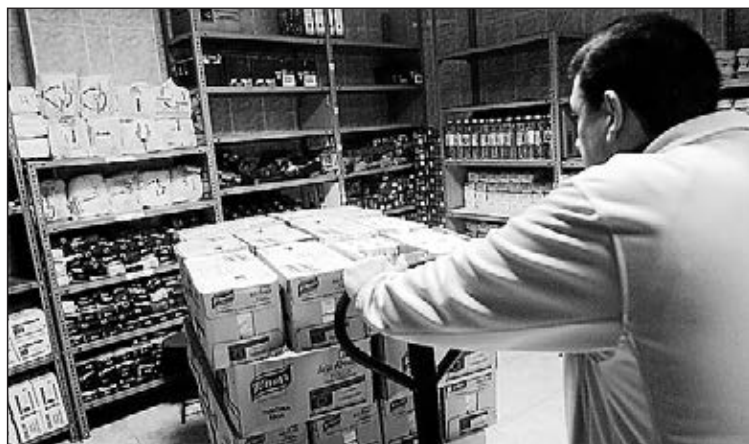
Al repartiment de menjar de les ONG se sumen aquests xecs.

(2.000 al Mercat i 4.000 al supermercat), ja s'han repartit entre les entitats socials, que han après a millorar els lots d'entrega d'aliments, ja que, tal com assenyalava la regidora "la mala nutrició entre les famílies d'exclusió social comença a ser un tema comú i molt preocupant per a Serveis Socials i les entitats. D'ací el reforç d'aquest programa fonamentalment