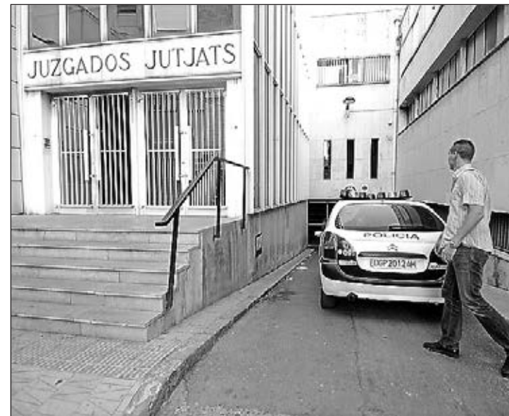
El edificio podría derribarse una vez pasados los festejos.

La demolición del edificio podría comenzar pasadas las fiestas de la Mare de Déu de Gràcia