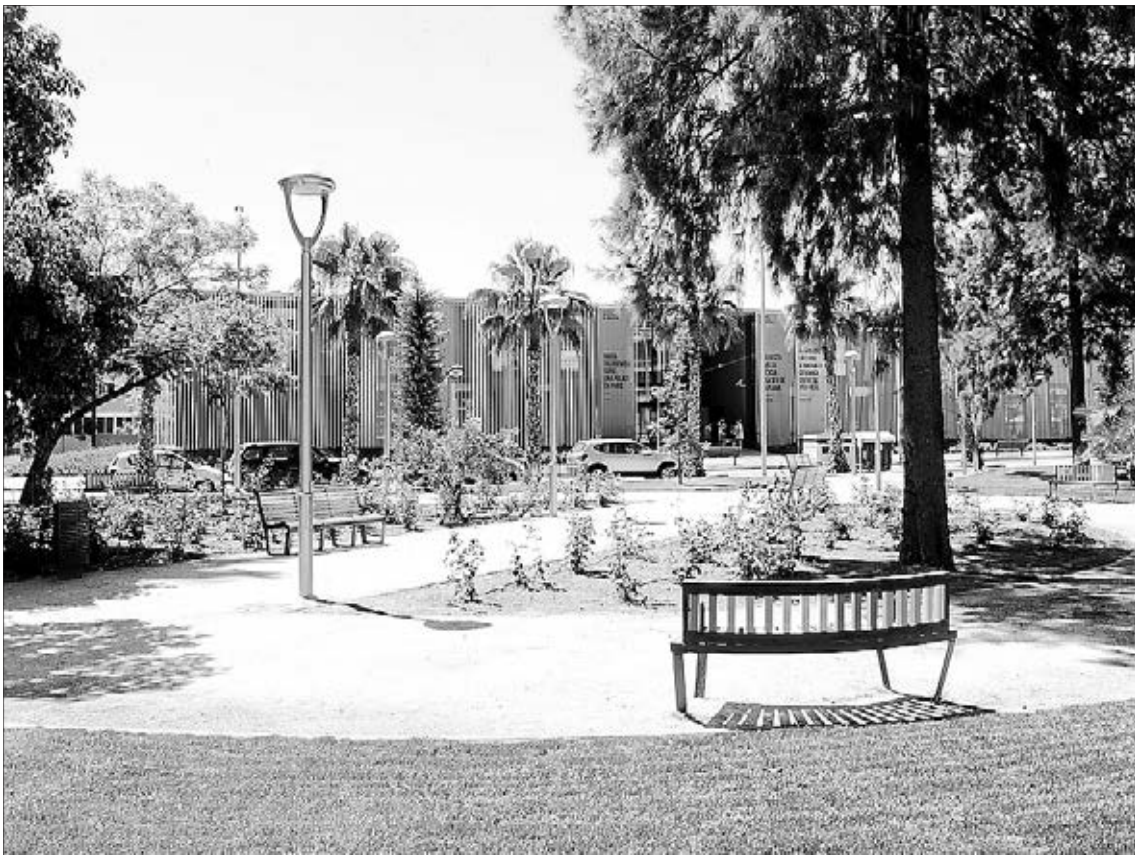
El jardín de las Dominicas conserva los árboles existentes e incorpora nuevos bancos de cerámica.