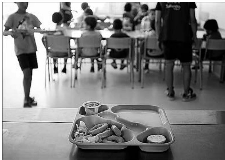
Els nens inscrits poden gaudir del servei de menjador escolar.