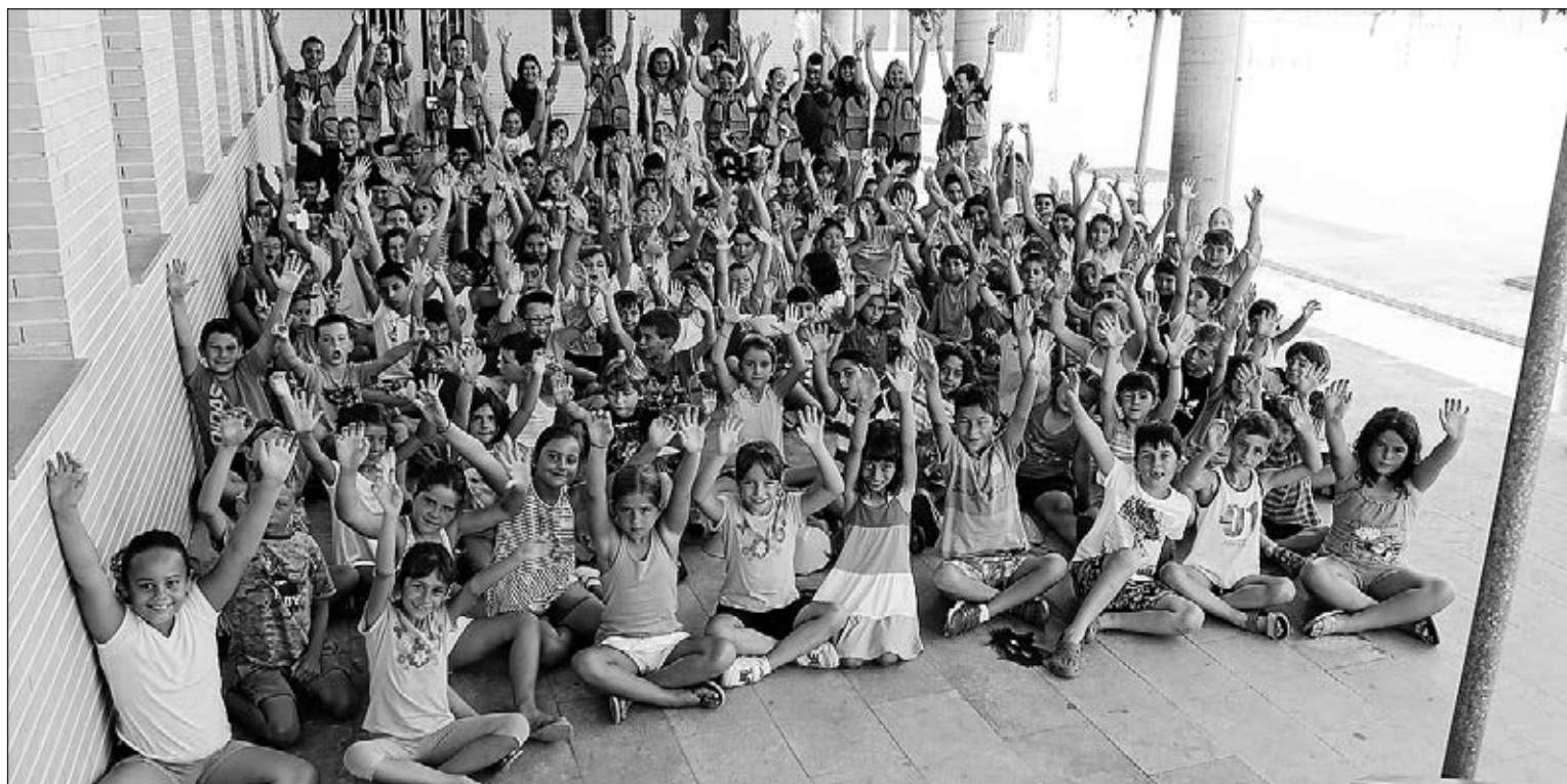
Els col·legis Pius XII i Angelina Abad han estat els encarregats d'acollir durant dues quinzenes al juliol l'Aplec d'Estiu d'enguany.

Cal destacar que es tracta d'una iniciativa innovadora a Vila-real, ja que és la primera vegada que es posa en marxa també a l'agost i compta amb les mateixes bonificacions i beneficis que en l'edició del juliol, amb l'objectiu de donar resposta a "la gran demanda rebuda a l'Aplec Municipal de Temps Lliure", afirma Àlvaro. D'aquesta manera, els més menuts podran gaudir del servei de menjador escolar, "que ens garanteix que els nostres xiquets reben una alimentació ade-