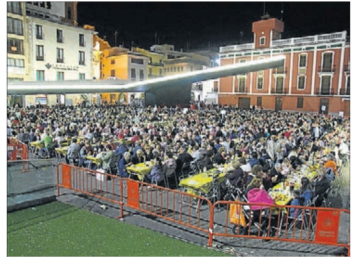
Cientos de vecinos se dieron cita en la última macrocena celebrada.

Para el segundo viernes de fiestas está prevista la actuación en la plaza Mayor de La Rana Manca, grupo comarcal emergente, "con una marcha espectacular, que será una sorpresa muy agradable" y DJs. El fin de semana finalizará la madrugada del sábado con el festival Vés Gita't, organizado por la Comissió de Penyes en el Recinto de la Marxa y el domingo la actuación en la plaza Mayor de Los Puntos, dirigida a un público más adulto. ≡