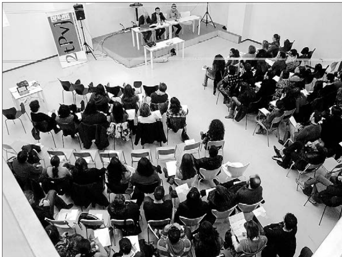
La Regidoria de Joventut ha programat nombroses activitats especialment dedicades a formar els joves.