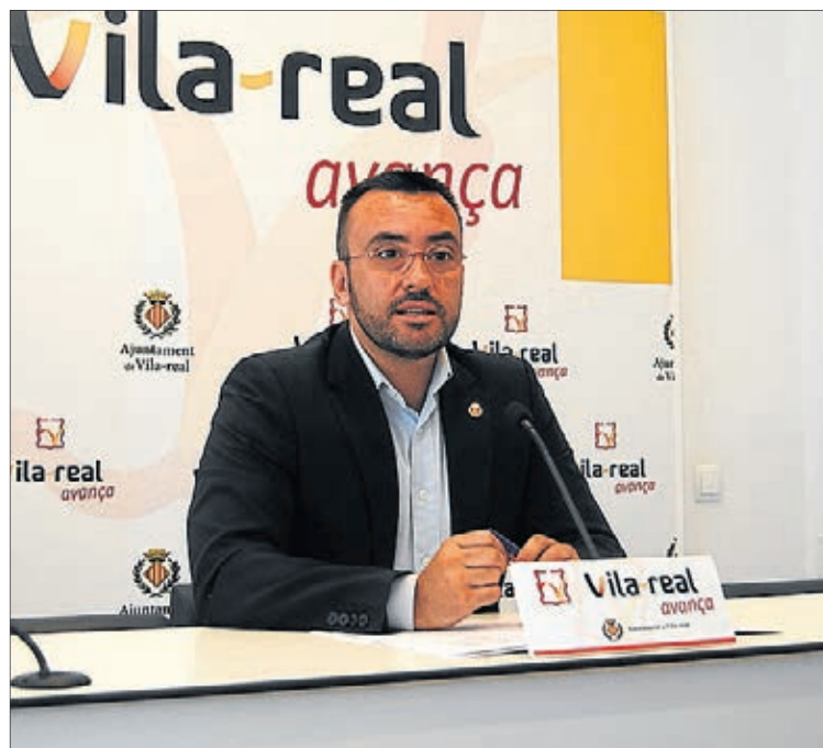
L'alcalde, durant la presentació de les dades d'aquest balanç.

"L'any 2007, els ingressos de l'Ajuntament per ICIO van arribar quasi als tres milions d'euros, enfront dels només 300.000 que es van recaptar el 2011. Aquesta brutal diferència dona compte de la difícil situació per la qual travessa un sector que no només afecta l'edificació d'habitatges, sinó sobretot l'ampliació de naus i comerços, l'atracció de noves inversions o la rehabilitació, a més de reflectir-se també en àrees associades, com la