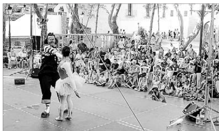
El Termet acogerá diversos espectáculos circenses con malabares.

El festival tendrá lugar los días 8, 9 y 10 con numerosos espectáculos, talleres y actividades