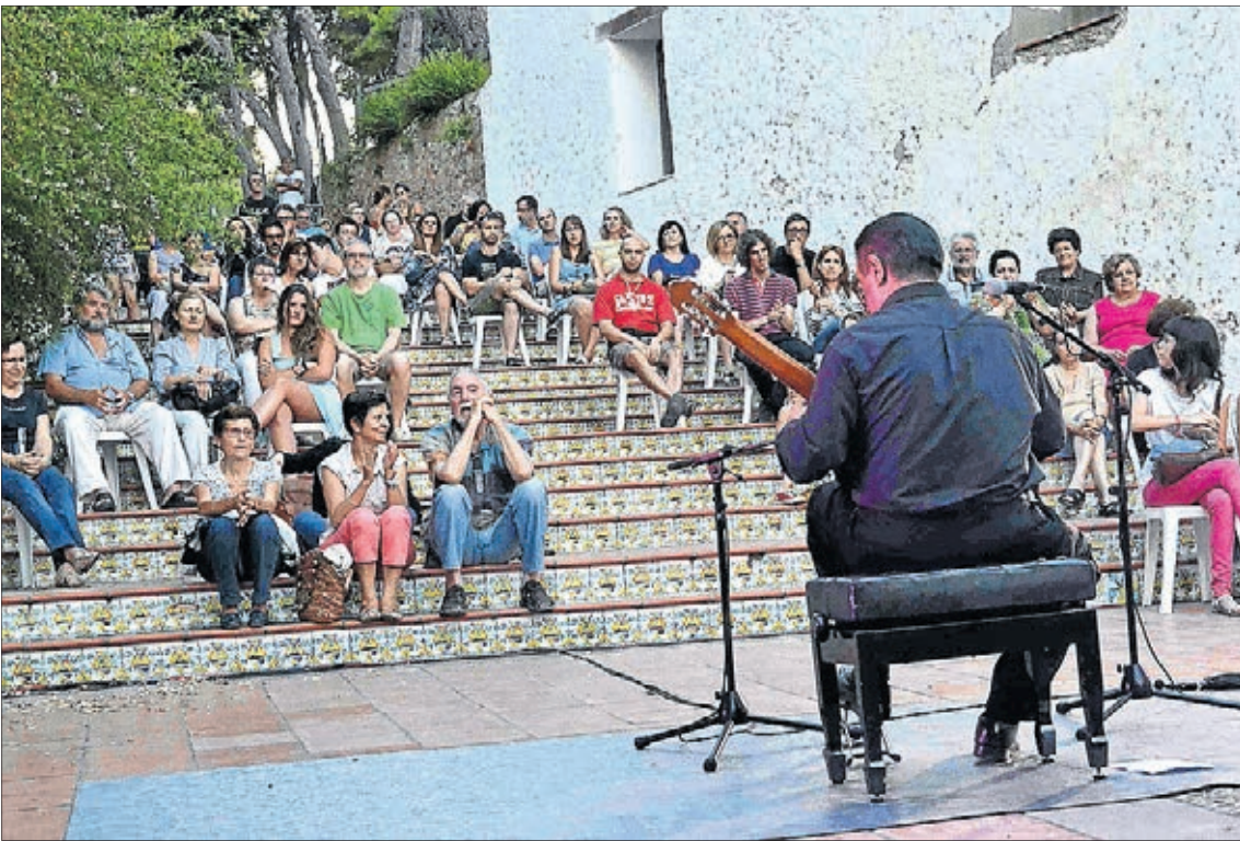
El Termet se ha convertido en el punto neurálgico al que han acudido decenas de interesados en su figura.