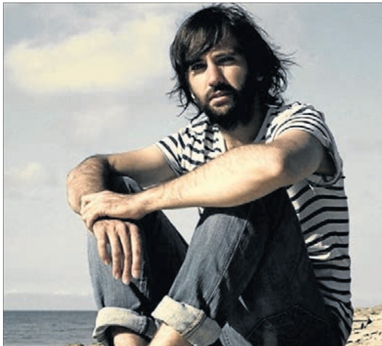
El Pescao es otra de las estrellas del cartel musical de este año.

El cartel de orquestas lo completan "dos formaciones de gran nivel" como son la orquesta Supermágica para la noche del jueves en la cena de 'tombet de bou' de las peñas y el sábado con la orquesta