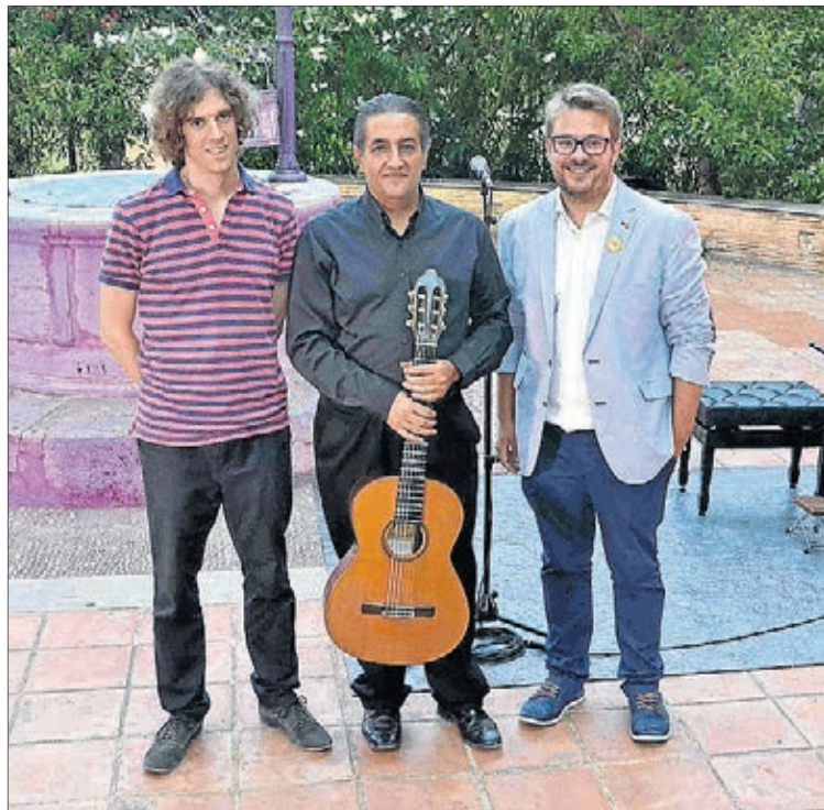
El edil de Cultura acompañó a los participantes durante su estancia.

Otro de los puntos fuertes ha sido la Integral Tárrega en tres conciertos gratuitos y abiertos al público que han vuelto a ser tres llenos consecutivos. Cabe recordar que la Semana Tárrega es el único festival del mundo donde se interpreta la integral