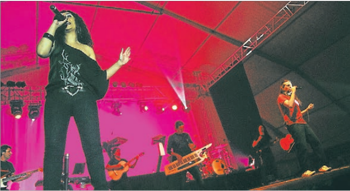
El mítico grupo Camela se subirá al escenario para ofrecer una actuación el miércoles de fiestas.