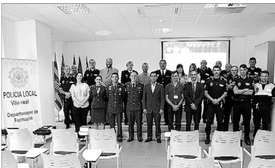
Els assistents al curs de mediació policial que s'ha celebrat a Vila-real eren brasilers.