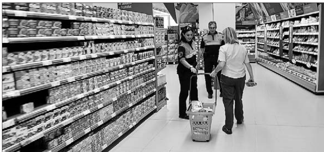
Protecció Civil recull en un supermercat de la ciutat i al Mercat Central productes per a les entitats.