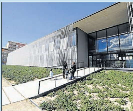
Instal·lacions punteres obertes a tothom.