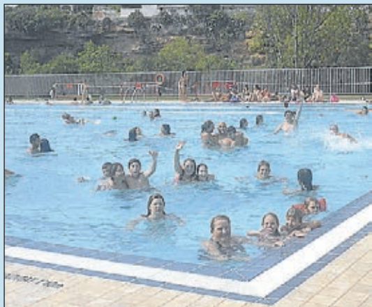
Infraestructures esportives a l'abast dels veïns.