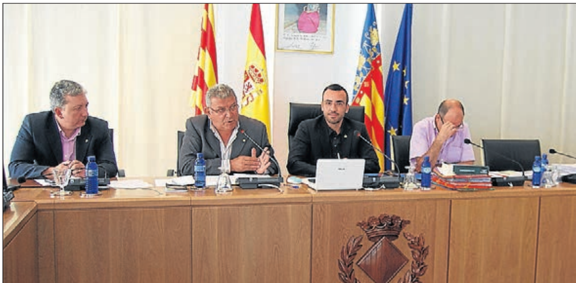
L'alcalde de Vila-real, José Benlloch, va explicar la situació en el darrer Ple celebrat a l'Ajuntament.

"Aquest canvi de finançament per al pagament a proveïdors serà molt avantatjós per al consistori i ens permetrà aconseguir, principalment, dos objectius", ha detallat el regidor d'Hisenda, Javier Serralvo, durant la sessió. "El primer i, segurament, el més immediat, serà un estalvi en interessos perquè, en no dependre del préstec del Govern central i poder negociar amb les entitats financeres, podrem obtenir un crèdit amb un menor tipus d'interès", ha explicat, "de manera que, si l'interès del préstec del pagament a proveïdors és d'Euribor + 5,2% ara passarà a ser Euribor + 3,2% com a mínim, la qual cosa representarà un estalvi de 175.000 euros en concepte d'interessos i sense una major càrrega financera en el temps, ja que no s'augmentarà