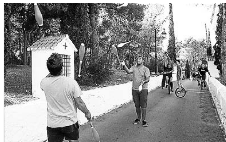
Cientos de personas disfrutan cada año del festival, que dura tres días.

Un año más, el Termet volverá a ser escenario del festival Malabara't, que se celebrará los días 8, 9 y 10 de agosto con multitud de espectáculos, talleres y actividades.