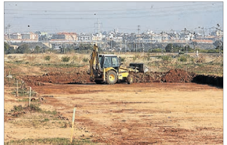
Imatge de l'espai que podria ocupar l'estació intermodal.

En concret, durant el període que l'ICIO s'ha mantingut al 0%, de juny de 2012 a desembre de 2013, es van executar al municipi un total de 58 obres, amb un pressupost de nou milions d'euros que haurien suposat una recaptació d'uns 350.000 euros. Finalitzat el termini fixat d'exoneració, es va decidir tornar a aplicar l'impost de construccions però a un tipus baix del 2%, "el més barat de tota la província". D'aquesta manera, des de gener, l'ICIO es manté al 2%, impulsant fins ara obres per valor de 3,9 milions d'euros a la ciutat. ≡