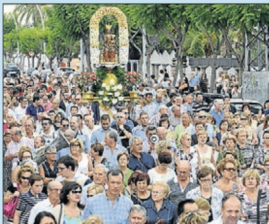
Riquesa cultural, fervor i tradicions pròpies.