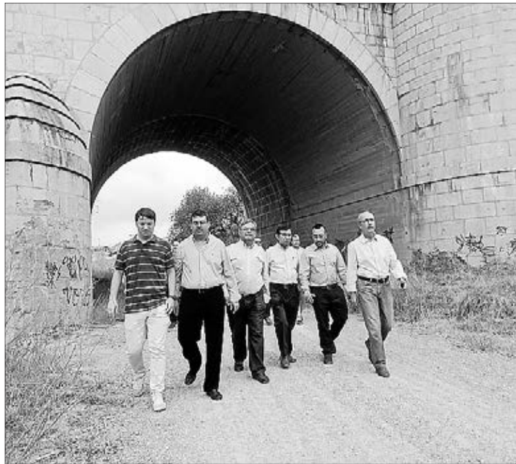
Imatge de la visita dels representants a la unió de les sendes.

El projecte, pagat amb càrrec als fons del Consorci del Riu Millars, constitueix una acció més de l'òrgan del qual formen part els ajuntaments de Vila-real, Almassora i Borriana, així com la Dipu-