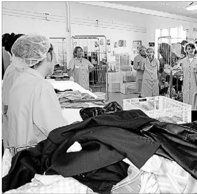
Tots Units reinsera cada año a decenas de trabajadores en la ciudad.

El programa ha hecho posible que 36 personas firmaran un contrato de trabajo en 2013 frente a las 11 del año 2012