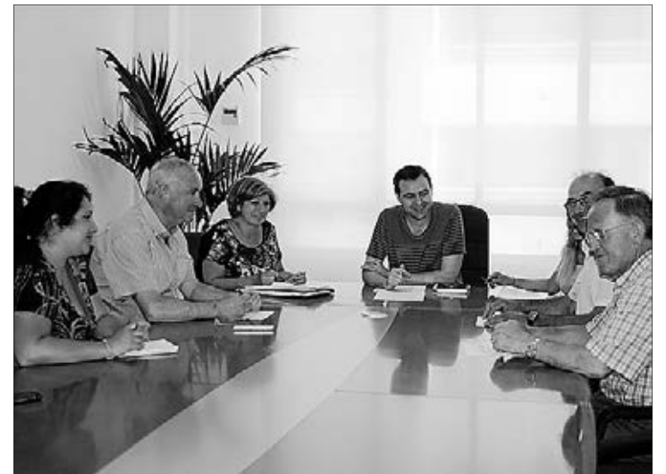
La comisión de seguimiento ha dado cuenta de la ejecución.