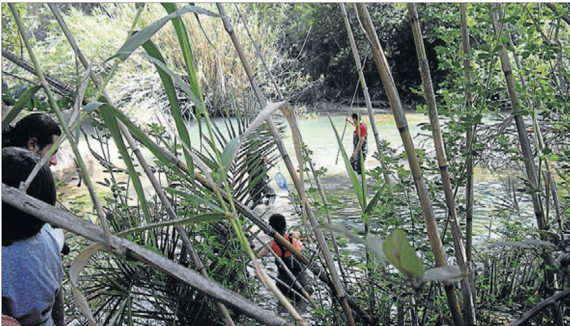
Imatge de la primera edició del Voluntariat Ambiental, que es va celebrar el 2013 a Vila-real.