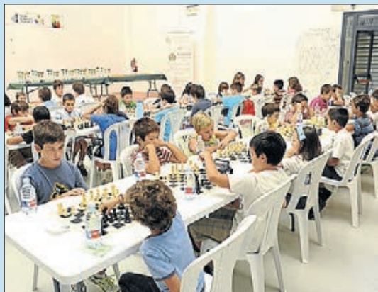
Oci, formació i educació per a la gent jove.