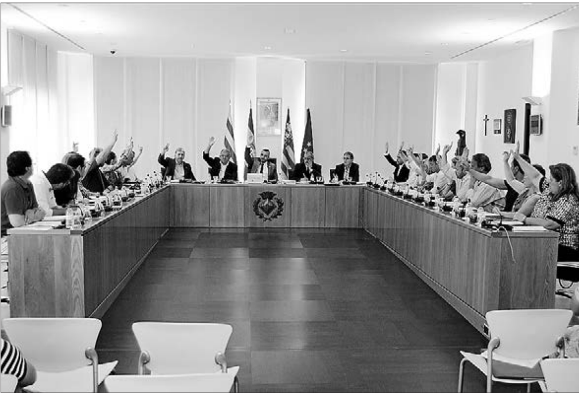
El pleno ha aprobado llevar a cabo una modificación del acuerdo para desbloquear la instalación.