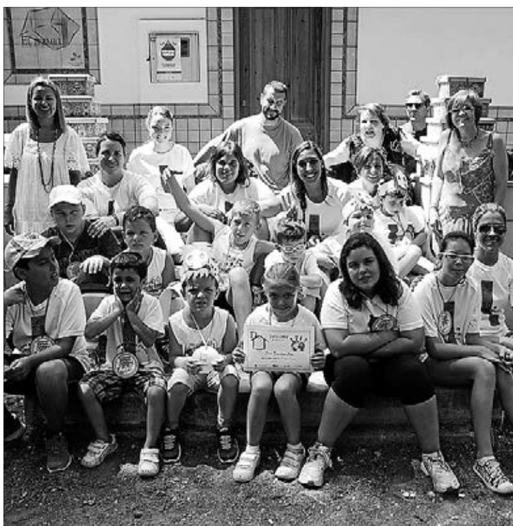
El primer Campus Natura s'ha celebrat al Termet durant juliol.

d'una manera amena i divertida. Les activitats, desenvolupades pel grup Cucanya i l'associació cultural El Bressol, s'han realitzat de dilluns a divendres de 9.00 a 14.00 hores. A més, han comptat amb personal qualificat per a cadascuna d'aquestes i un servei d'atenció sanitari i de recollida i tornada amb autobús. El primer Campus Natura ha establert dos grups amb un màxim de 20 places en cadascun. El primer, del 30 de juny a l'11 de juliol, i el segon, del 14 de juliol al 25 de juliol, als quals els assistents només han hagut de pagar 20 euros, a part dels descomptes. Un preu "més que raonable" perquè tots els nens que així ho han demanat hagen pogut participar en l'activitat. ■