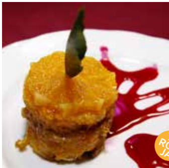
BORRATXET CILINDRE DE TARONJA

bescuit, mistela, melmelada de taronja casolana