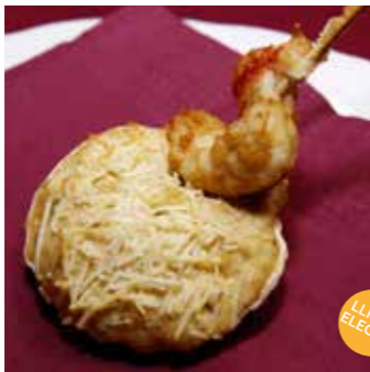
DELÍCIA DEL MEDITERRANI

ceba, rap, gamba, farina, mantega, nou moscada, pebre blanc, nata, formatge