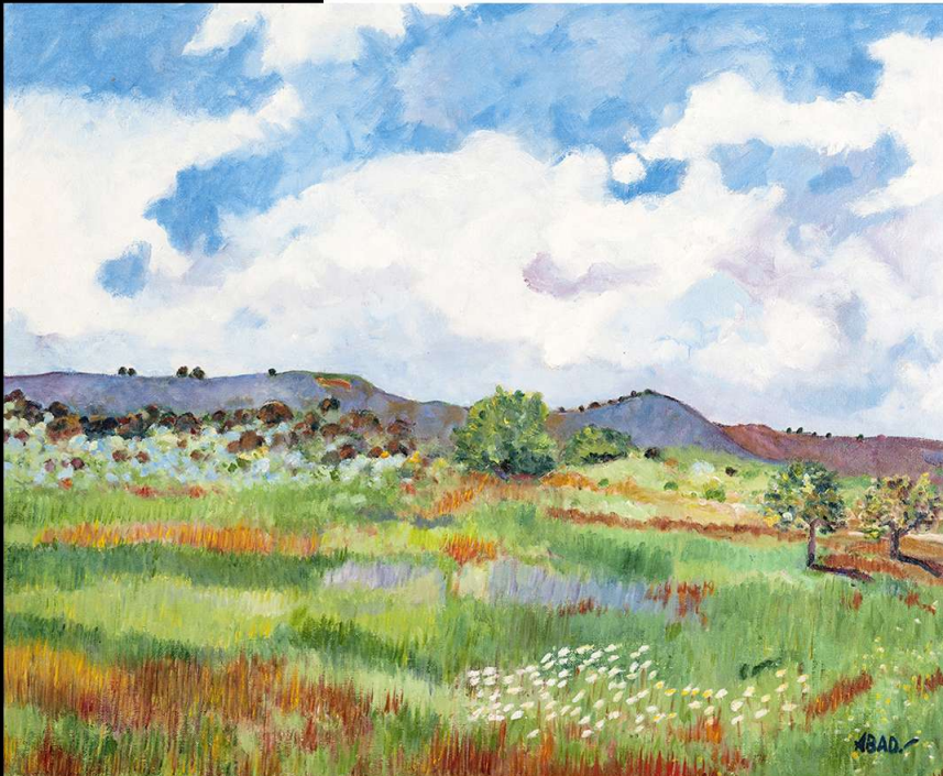
Núvol's Oli sobre llenç 50 x 61 cm

E l contacte directe amb la natura, a l'aire lliure, l'efecte de la llum en el paisatge i la seua impressió a la vista més enllà de la suposada realitat objectiva, la preponderància dels colors primaris, van ser característiques essencials que en el seu moment van definir el sorgiment de la pintura contemporània.