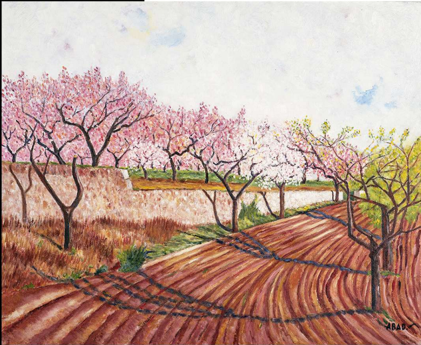
Solcs Oli sobre llenç 50 x 61 cm