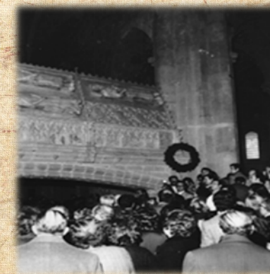
Tomba de Jaume I, any 1974

eren tibants. Diversos foren els motius per a la nova fundació, però els socioeconòmics tingueren un pes determinant, ja que unes terres fèrtils i adequadament irrigades oferien un reclam important als nous colons, que veien el repartiment de terres i les excepcions impositives dels primers deu anys com una forma de prosperar econòmicament, mentre que el rei veia enfortida la seua posició i sobirania. Tot plegat, si Vila-real avui és una ciutat capdavantera en el País Valencià, entre d'altres esforços, l'original li'l devem al Rei Jaume I.