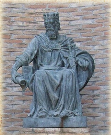
Jaume I. Escultura en bronze de Vicente Llorens Poy