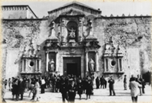
Façana del monestir, any 1974

El monestir de Poblet va ser el lloc triat pel nostre fundador, Jaume I, perquè descansaren les seues restes, és per aquesta raó que el 1974 (any del 700 aniversari de la fundació de la nostra ciutat) i el 1999 l'Ajuntament de Vila-real van promoure diversos viatges per a visitar la seua tomba i retre-li un homenatge. Aquests viatges han fet possible que aquells vila-realencs interessats en la història fundacional de la vila pogueren apropar-se d'una manera simbòlica a l'estimat monarca. El viatge que avui emprenem, organitzat per la Regidoria de Turisme de l'Ajuntament de Vila-real ens retorna a aquesta tradició, amb la novetat de dur 66 Jaumes a visitar Poblet.