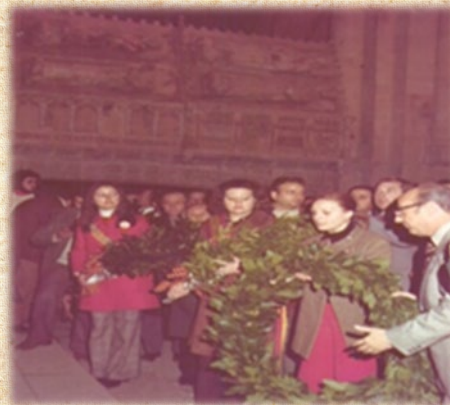
Homenatge del 700 aniversari de la fundació, any 1974

d'allò més longeu i intens. En aquests anys Jaume va haver d'afrontar diverses dificultats i esdeveniments.