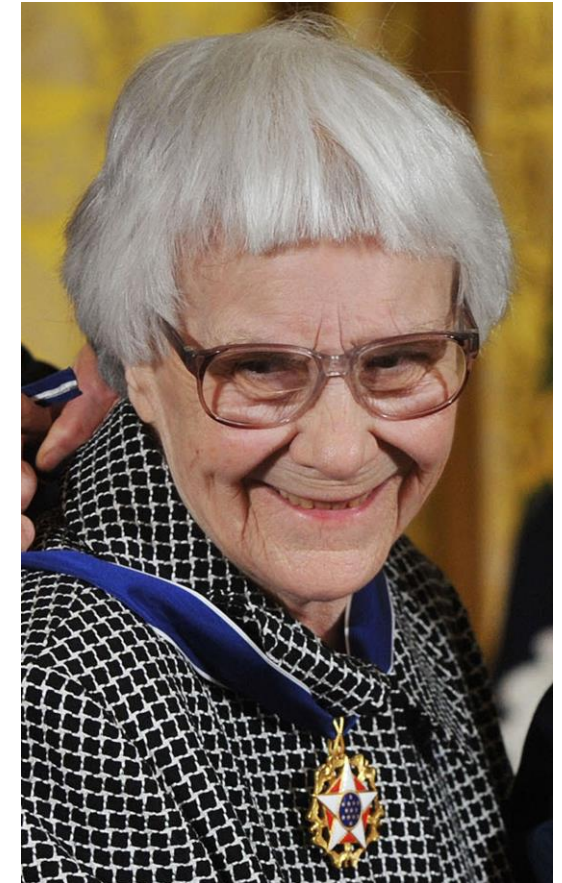
Harper Lee (1926-2016)