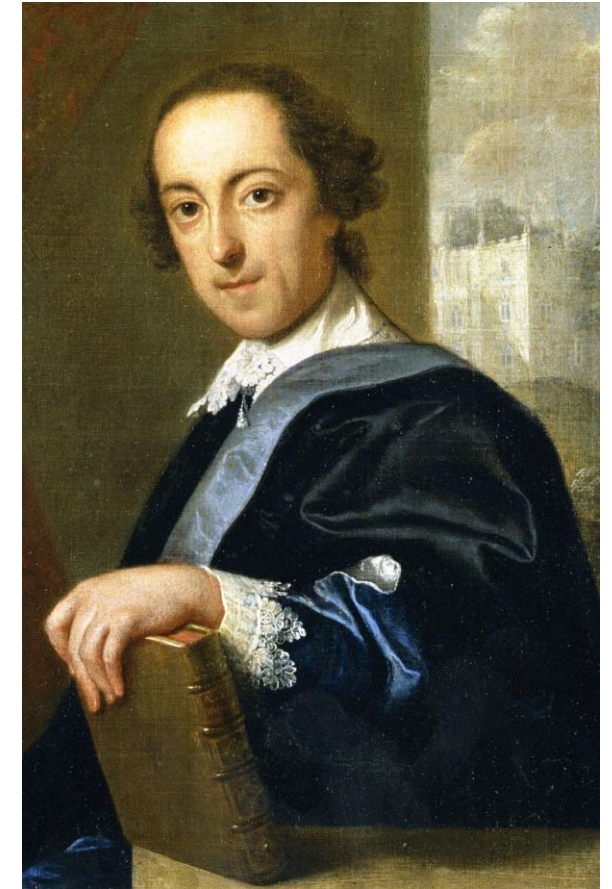
Horace Walpole (1717-1797)

Naix a Ciutat de Mèxic l'escriptora i política Laura Esquivel . Autora de novel·la negra amb referències al realisme màgic, aconseguí fama internacional amb la seua primera obra Como agua para chocolate , escrita l'any 1989. A aquesta següen altres com La ley del amor , Tan veloz como el deseo , Malinche...