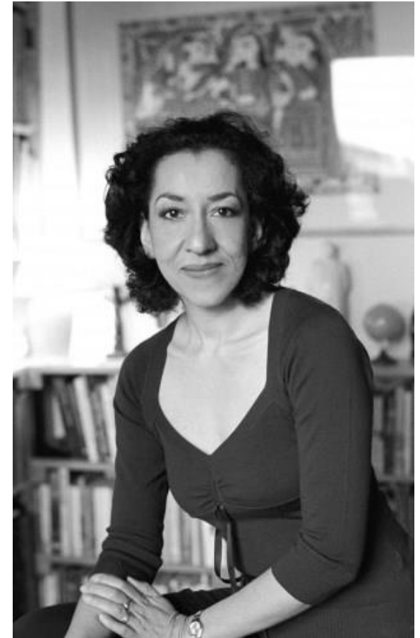
Andrea Levy (1956-2019)