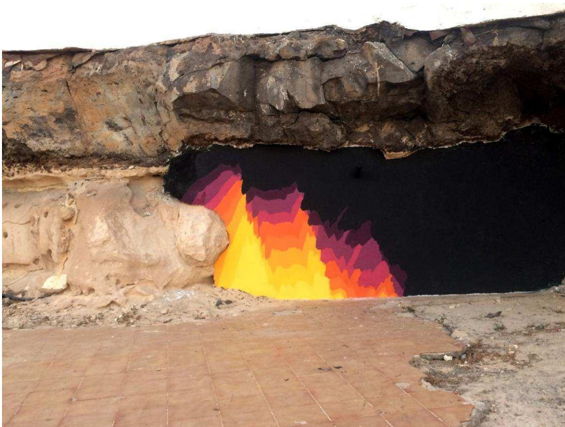
Una de les intervencions urbanes d'E1000, artista convidat al TEST 2021.

Nominada al Foam Paul Huf Award (Foam Fotografiemuseum, Amsterdam, 2017); Premi Fotolibro Latinoamericano del Centro de Fotografía (Montevideo, 2016); Open Call San José Foto Festival (l'Uruguai, 2016). He participat en una dotzena d'exposicions col·lectives a nivell internacional (Itàlia, l'Uruguai, Polònia, Suïssa) i compte amb diverses publicacions. L'última, Murs (Taula Rasa. 2020).