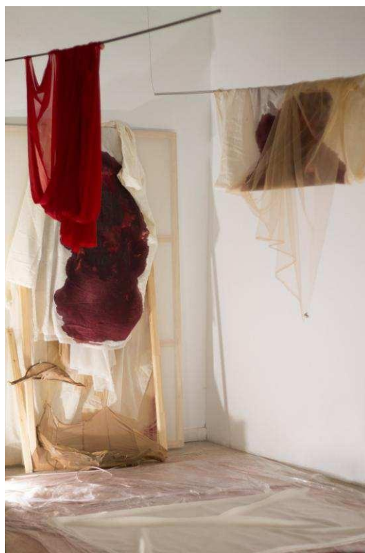
Ana Spoon acosta al TEST 2021 'Un oscuro que te desaparece'.

ANA SPOON (València, 1989) Projecte: 'Un oscuro que te desaparece' "EL TEST ÉS TANT UN REPTÉ COM UNA OPORTUNITAT PER A MI"