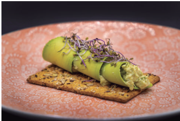
Caneló d'avocat farcit de txangurro

Alvocat, txangurro, pa torrat, panses i mel